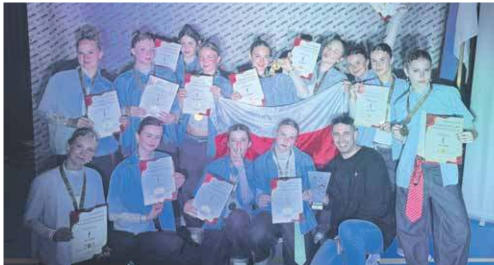
Mistrzynie Europy, 13 utalentowanych tancerek hip-hopu