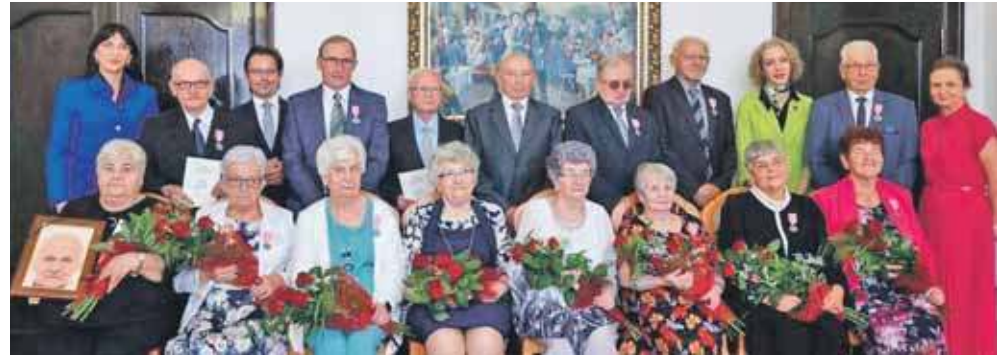
Nie zabrakło pamiątkowych zdjęć