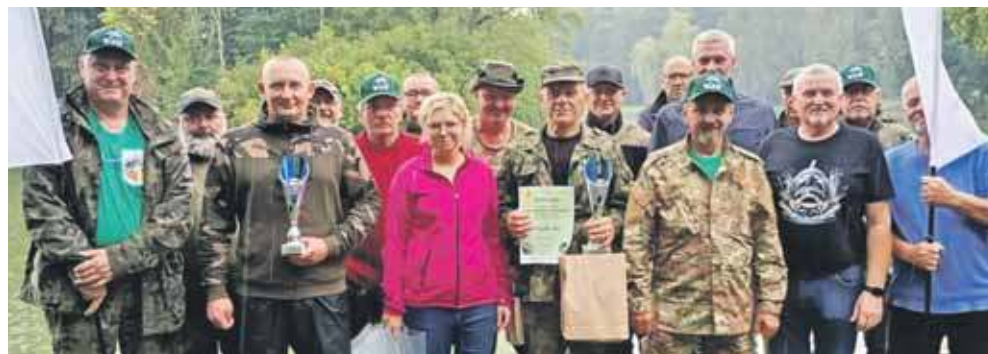
Uczestnicy zawodów w Świerkłańcu