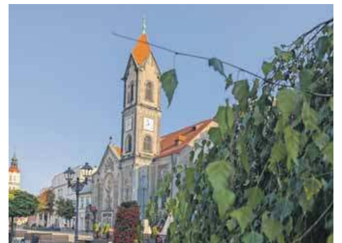
W kolejne soboty w Kościele Zbawiciela odbędą się koncerty organowe