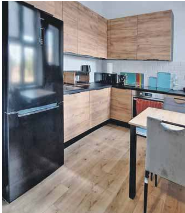
Mieszkania powstały przy ul. Opolskiej w Tarnowskich Górach

W ramach projektu osoby usamodzielniane, które mieszkają w mieszkaniach, mogą liczyć na m.in.: opiekę pracownika socjalnego, udział w treningach i szkoleniach rozwojowych takich jak: trening ekonomiczny, zdrowe i ekonomiczne żywienie, prowadzenie gospodarstwa domowego.