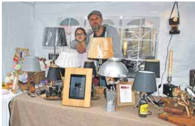
Na pl. Synagogi nie docierało tylu klientów, co do ścisłego centrum miasta

Wystawcy nie ukrywali, że na pl. Synagogi docierało zdecydowanie mniej osób. Niby jest w centrum, ale dla