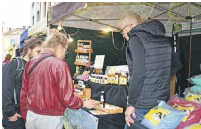
Część stoisk rękodzielników była na ul. Piastowskiej, na wysokości pl. Wolności

Jarmark rękodzieła i stoiska różnych stowarzyszeń na Gwarkach były w tym roku w nowym miejscu. Niestety, niewiele było o tym informacji i klientów przyszło mniej niż zwykle. Swoje zrobiła też kiepska pogoda.