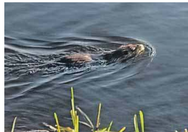
Nutrie są m.in. w stawach w Kaletach-Zielonej