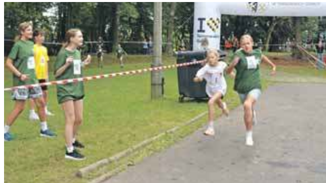
Walka o zwycięstwo do samego końca

W marszu nordic walking na 1 000 m wystartowali słuchacze Uniwersytetu Trzeciego