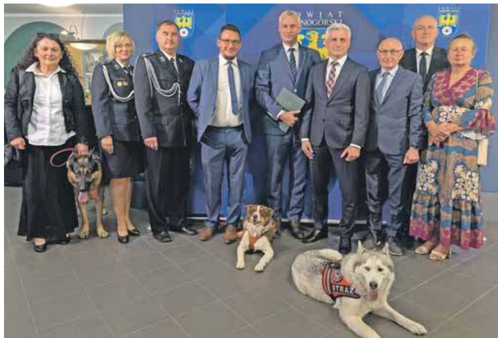
Drugim wyróżnionym podmiotem jest Grupa Poszukiwawczo-Ratownicza działająca przy Ochotniczej Straży Pożarnej w Orzechu

W Centrum Kultury „Karolinka” w Radzionkowie odbyła się uroczysta sesja Rady Powiatu Tarnogórskiego, podczas której wręczono prestiżowe nagrody Orła i Róży. To najważniejsze wyróżnienia, przyznawane przez nasz samorząd osobom i instytucjom, które w szczególności