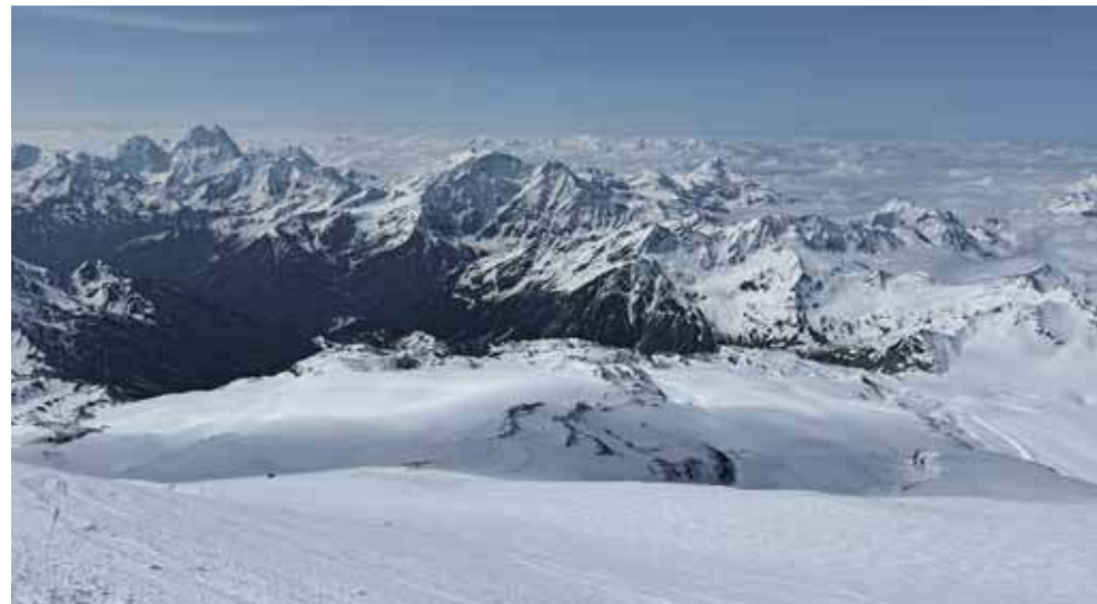
Zapierający dech w piersiach widok z Elbrusa (5642 m n.p.m.)