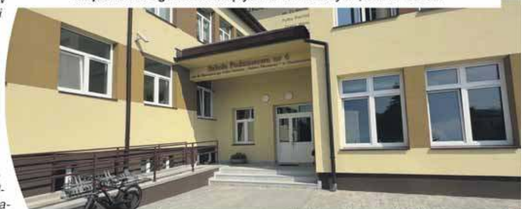
Szkoła Podstawowa nr 4 w Ciechanowie