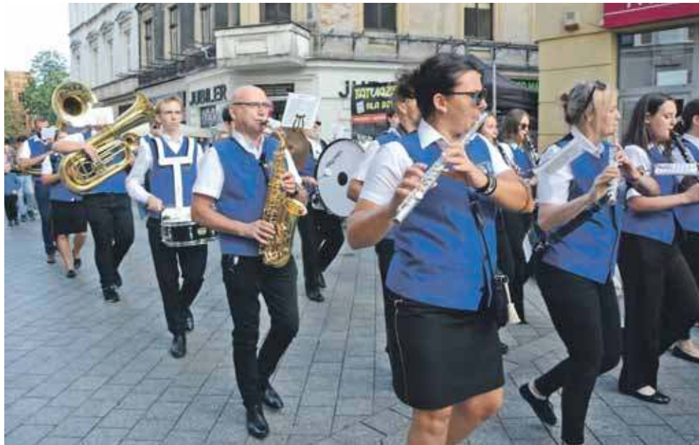
W Strzybnicy usłyszymy Tarnogórską Orkiestrę Dętą

To grupa młodych muzyków, którzy w wakacje 2024 roku założyli zespół rockowy, aby dzielić się muzyką oraz wspólnie cieszyć się grą. Jego brzmienie łączy