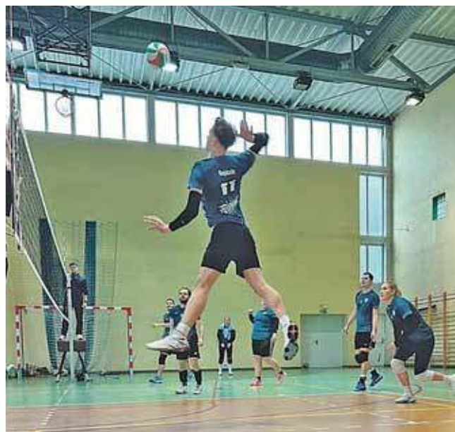
W Nakle Śląskim kontynuowana jest Liga Stowarzyszenia Aktywni 2025

– Stowarzyszenie Aktywni, które jest pomysłodawcą i organizatorem ligi, zaprasza mieszkańców regionu do śledzenia zmagania oraz kibi-