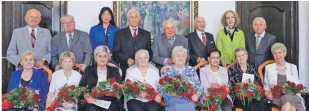
We wtorek, 16 września, w Urzędzie Stanu Cywilnego w Piekarach Śląskich świętowano mażeńskie jubileusze

We wtorek, 16 września, w Urzędzie Stanu Cywilnego w Piekarach Śląskich świętowano mażeńskie jubileusze.