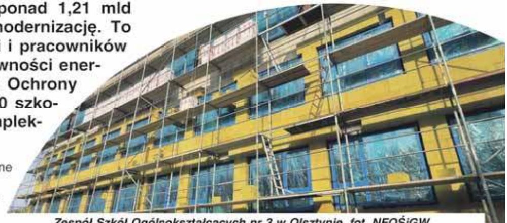
Zespół Szkół Ogólnokształcących nr 3 w Olsztynie, fot. NFOŚiGW

Istotną kwestią w ramach programu jest przeprowadzenie działań edukacyjnych i prozdrowotnych, które podniosą świadomość dzieci i nauczycieli w zakresie poprawy jakości powietrza, przeciwdziałania trendom zmian klimatycznych i wykorzystania OZE. W szkołach prowadzone będą również inicjatywy promujące aktywność fizyczną na świeżym powietrzu. Jest to dodatkowe wsparcie, które pozwala nauczycielom rozwijać u uczniów świadomość klimatyczną i ekologiczną. W efekcie nauczyciele zyskują lepsze warunki pracy, a szkoły stają się miejscem, w którym edukacja idzie w parze z troską o zdrowie, bezpieczeństwo i przyszłość młodego pokolenia. Już 330 placówek ze 141 miejscowości skorzysta z bezzwrotnych dotacji. W programie zawarto umowy na łączną kwotę 1 miliarda 221 milionów złotych.