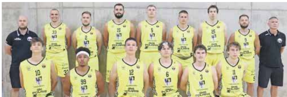
Zwycięska ekipa z Tarnowskich Gór

Tarnogórzanie grali w niedzielę, u siebie – w hali sportowej w Tarnowskich Górach. Od początku spotkania postawili twarde warunki gry, co szybko pozwoliło zbudować przewagę. Swoją cegiełkę do zwycięstwa dołożyli także młodzi zawodnicy – wychowankowie KKS-u – którzy dostali swoje minuty na parkiecie i szansę na zdobywanie cennego doświadczenia.