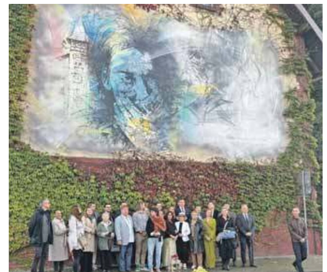
Mural ma przywracać pamięć m.in. o kobietach, które padły ofiarami gwałtów ze strony żołnierzy Armii Czerwonej