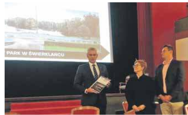
Dyplom już jest, teraz czas na nakręcenie spotu promocyjnego