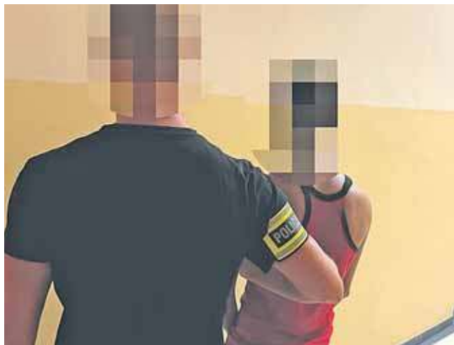
Trzy osoby usłyszały zarzuty po bóje w hotelu pracowniczym w Miasteczku Śląskim

Na miejscu kryminalni i policjanci z patrolu zastali rannych mężczyzn. Udzielili