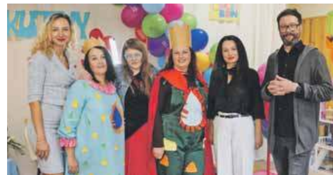
Przedszkole w Ożarowicach wygrało ogólnopolski konkurs w ramach kampanii społecznej „Akcja Tron”