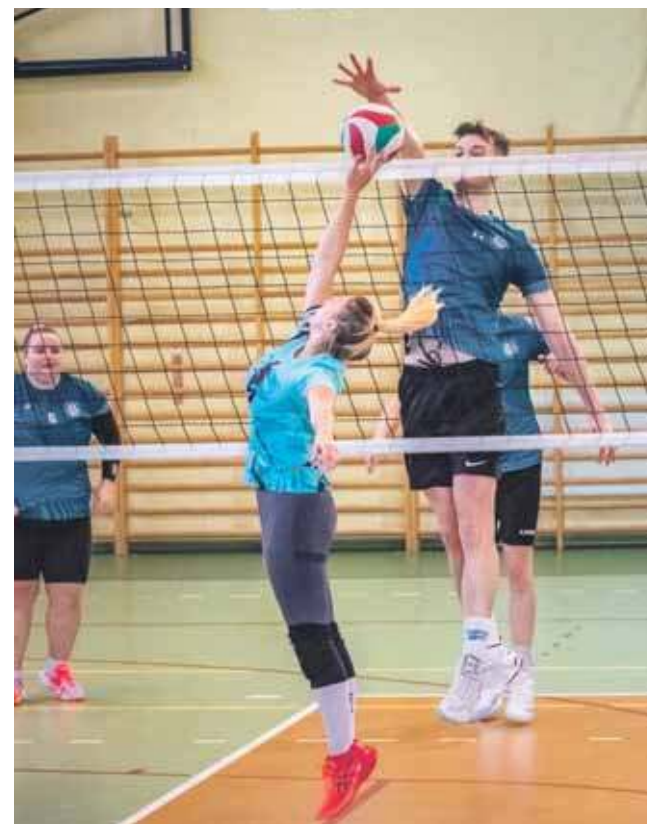
Każda drużyna musi wystawić na boisko minimum dwie zawodniczki

stanie ok. 1 km sieci wodociągowej. Po zakończeniu prac ma być odtworzona nawierzchnia wspomnianych ulic. Wartość robót to 5 mln 642 tys. zł. Na inwestycje gmina ma unijne dofinansowanie. (ESP)