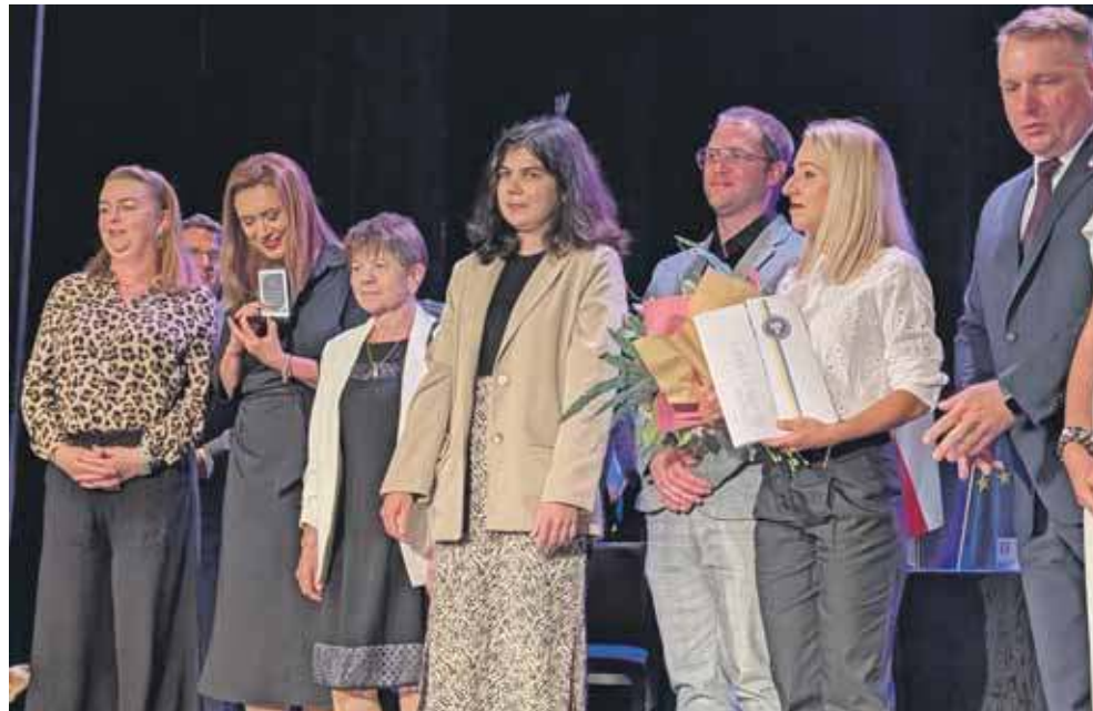
Nagroda trafiła do Centrum Dokumentacji Deportacji Górnoślązaków do ZSRR w 1945 roku w Radzionkowie

– Jest to dla nas szczególne wyróżnienie. Dowód