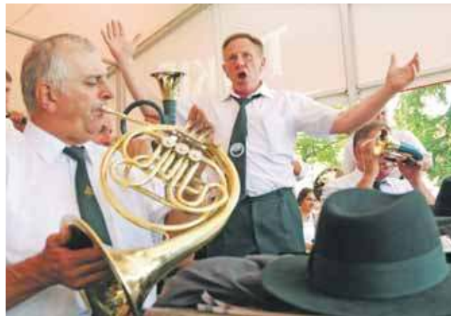
W najbliższy weekend odbędzie się Leśny Piknik Rodzinny „Cietrzewisko 2025”

18.30-19.45 – dekoracja zwycięzców i ogłoszenie