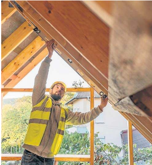
Pozwolenie na budowę może wygasnąć, np. na skutek przerwania prac

Ciekawy przykład praktycznego zastosowania tych przepisów opisał Główny Urząd Nadzoru Budowlanego w jednym z artykułów z cyklu „Ciekawe interpretacje GUNB”.