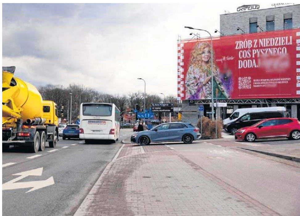
Krakowianie zwracają też uwagę na reklamy nieopodal Ronda Matecznego. Są legalne?