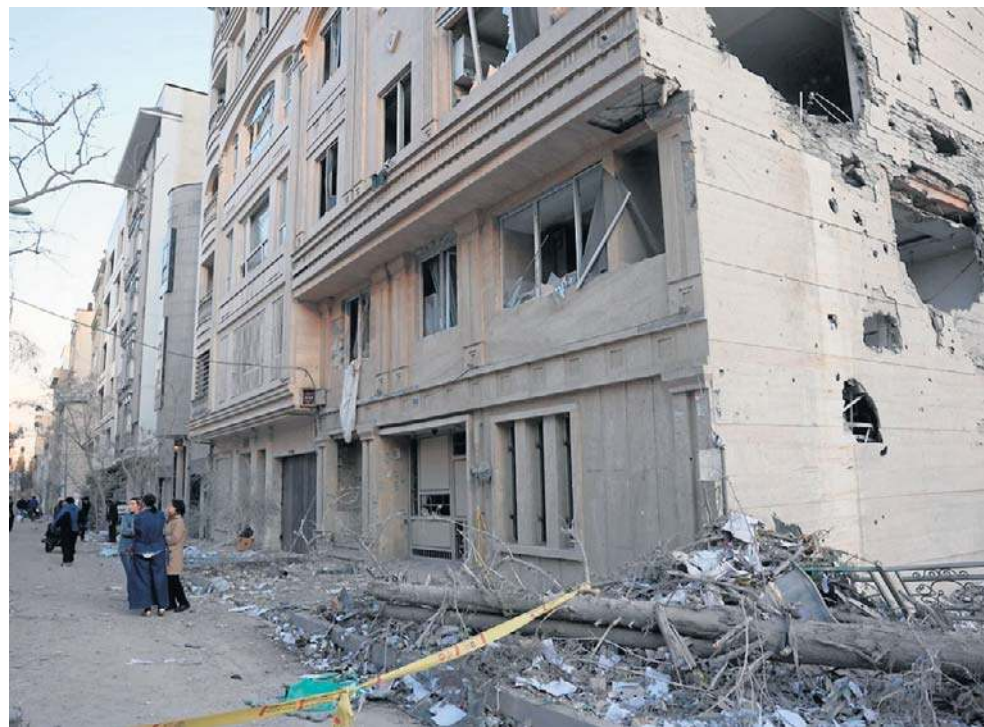
Atak Stanów Zjednoczonych oraz Izraela na Iran i w następstwie rozwijający się konflikt na Bliskim Wschodzie wywołał reakcję inwestorów na rynkach metali szlachetnych