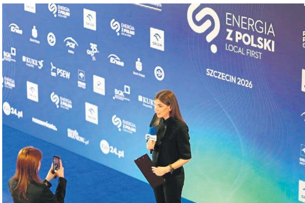
Forum relacjonowali dziennikarze „Głosu Szczecińskiego” i Strefy Biznesu

- Jeżeli chcemy dużo wydawać w tej chwili na zbrojenia, żeby w tym trudnym, dynamicznym, geopolitycznym czasie Europa się zbroiła i chcemy obniżyć koszty tych zbrojeń, to chcemy przemysł zbrojeniowy zwolnić właśnie z kosztów emisyjnych - dodała Hennig-Kloska. ©