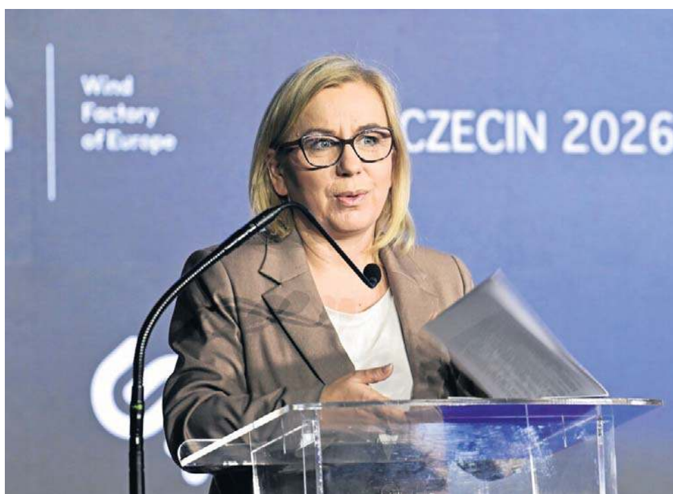
Paulina Hennig-Kloska, minister klimatu i środowiska, podkreśliła, że w ubiegłym roku Polska wyprodukowała ponad 31 proc. energii z OZE

Dodała, że rozwój tego typu inwestycji otwiera także przestrzeń do budowy własnych kompetencji technologicznych. Jako przykład wskazała powstający w Polsce, w Żarnowcu, jeden z największych magazynów energii w Europie. Podkreśliła, że takie podejście wzmocni bezpieczeństwo energetyczne i pozwala budować bardziej niezależny, oparty na krajowych zasobach system energetyczny.