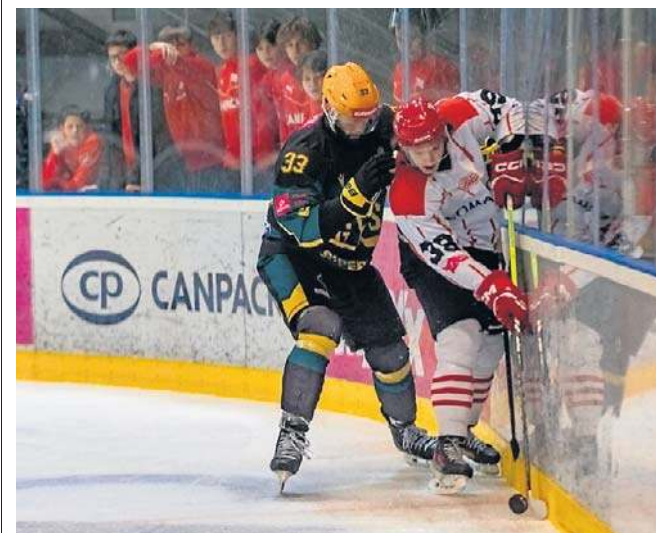
W dzisiejszym meczu Comarch Cracovia musi podjąć twardą walkę, by doprowadzić do siódmego meczu

- Cracovia musi zagrać bardziej agresywnie - mówi były obrońca „Pasów”. - Bez odpuszczania, a takie zagrania zawsze odbierają siły rywalowi, trzeba też oddawać więcej strzałów na bramkę. Jeśli by Cracovia wygrała, to w siódmym meczu może się zdarzyć wszystko. Każdy mecz jest inny, a w play-offie, nawet jak się prowadzi 3:1, to dalej szanse wynoszą 50 na 50, to jest gra psychologiczna. ©©