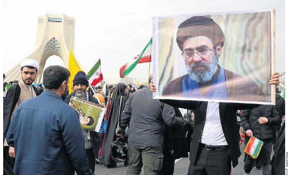
Modżtaba Chamenei zastąpił swojego ojca ajatollaha Alego Chameneia, który zginął w atakach Izraela i USA, na stanowisku najwyższego przywódcy kraju