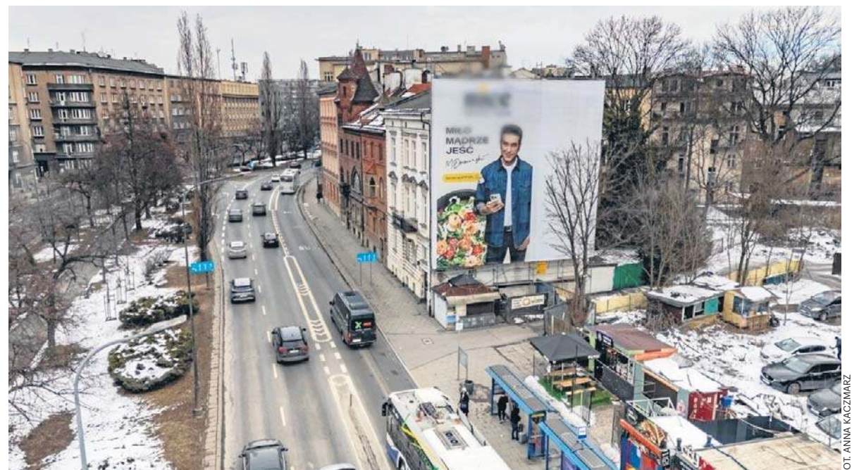
Jeszcze w lutym na budynku przy Al. Słowackiego wisił baner z aktorem reklamującym catering

Ceny paliw. Rząd zapowiada działania, PiS chce obniżek str. 7