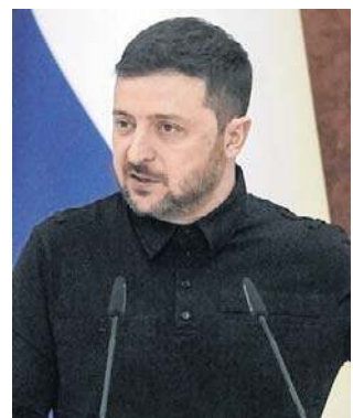
Zełenski powiedział, że chce pomóc krajom Bliskiego Wschodu

Biały Dom nie odpowiedział na pytanie, czy Stany Zjednoczone zwróciły się do Ukrainy