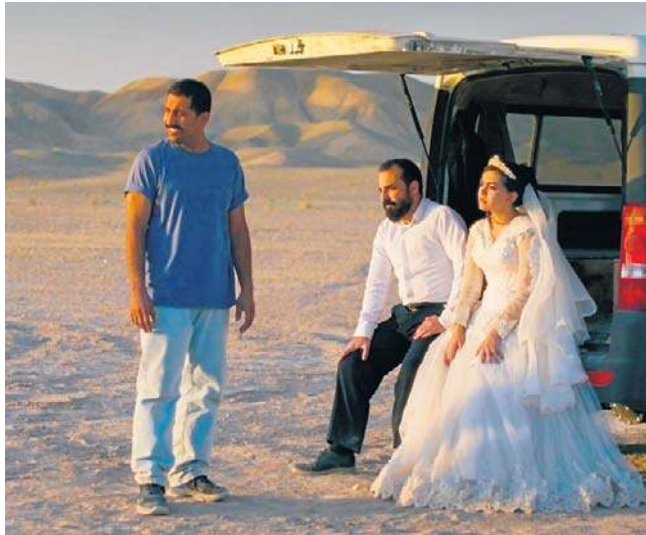
Kadr z filmu „To był zwykły przypadek” w reżyserii Jafara Panahiego