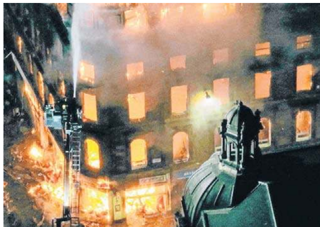
W szczytowym momencie do opanowania ognia wezwano 18 wozów strażackich i specjalistycznych

Właściciele kilku firm mieszczących się w budynku ogarniętym pożarem, w tym kawiarni i salonu tatuażu, napisali w sieciach społecznościowych, że zostały one zniszczone. Z powodu pożaru ewakuowano gości pobliskiego hotelu Voco Grand Central - poinformował zarząd hotelu. PAP