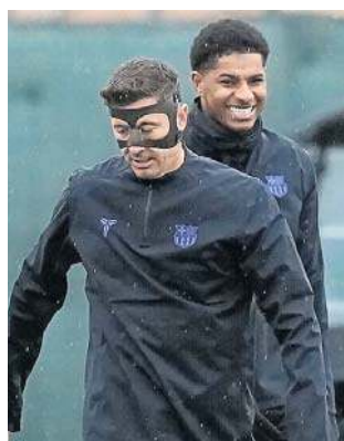
Robert Lewandowski w masce ochronnej

Robert Lewandowski w meczu z Villarrealem (4:1) odniósł uraz. Rywal złamał Polakowi kość oczodołu, przez co „Lewy” nie mógł zagrać z Atletico Madryt w rewanżu Pucharu Króla. Wrócił do kadry meczowej. Spotkanie w Bilbao rozpoczął jednak wśród rezerwowych. Na boisku zameldował się w 62. minucie i grał w masce ochronnej. Oddał jeden strzał, jednak był on zablokowany, więc nawet nie sprawił problemów rywalom. Miał tylko kilka podań i był niewidoczny. Tak samo, jak grający od początku meczu na jego pozycji Ferran Torres. Hiszpańskie media, jednak zaskoczyły, bo pochwałyły go Po-