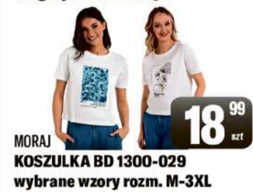
MORAJ KOSZULKA BD 1300-029 wybrane wzory rozm. M-3XL