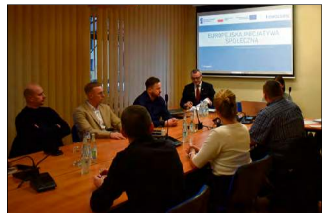
Podczas zebrania głosowano nad czterema wnioskami.