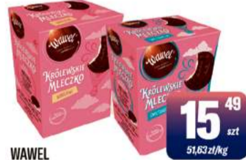
WAWEL KRÓLEWSKIE MLECZKO 300g śmietankowe, wanilowe