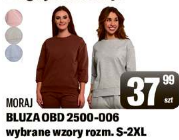
MORAJ BLUZA OBD 2500-006 wybrane wzory rozm. S-2XL