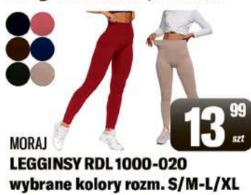
MORAJ LEGGINSY RDL 1000-020 wybrane kolory rozm. S/M-L/XL