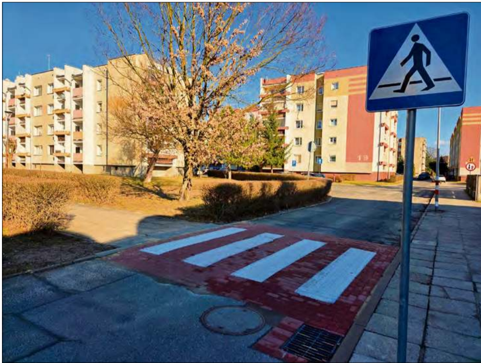
W rejonie piekarni przy ul. Sikorskiego w Ozimku powstał próg zwalniający.

Parking o powierzchni 367 m 2 znacząco poprawia dostępność i komfort parkowania w tej części miasta, szczególnie w rejonie Urzędu Gminy i Miasta w Ozimku. Koszt realizacji inwestycji wyniósł 344 490,07 zł brutto i został w całości pokryty ze środków własnych gminy.