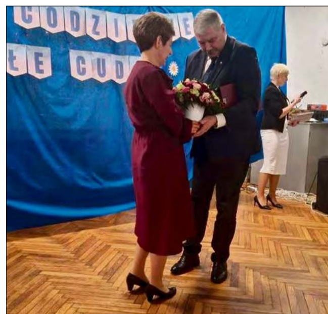
Podczas spotkania pożegnania, które odbyło się 23 lutego, społeczność przedszkolna wraz z władzami samorządowymi i innymi gośćmi dziękowali za lata ciężkiej pracy dyrektor.

Podczas spotkania pożegnania, które odbyło się 23 lutego, społeczność przedszkolna wraz z władzami samorządowy-