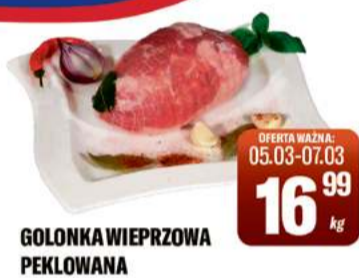
GOLONKA WIEPRZOWA PEKLOWANA