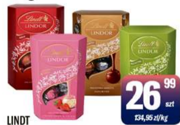
LINDT PRALINY LINDOR 200g wybrane rodzaje