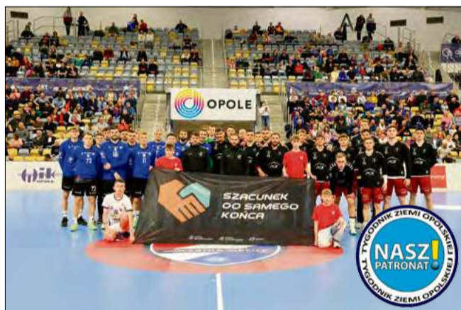
Opolanie staną przed kolejną szansą na poprawę swojej sytuacji w tabeli już 9 marca. W meczu domowym zmierzą się z piątym obecnie zespołem KGHM Chrobry Głogów. Początek starcia o godz. 18:00.

Gwardziści zdołali szybko zmniejszyć różnicę w wyniku do 7:9. Opolanie nie nacieszyli się długo nadrobieniem strat,