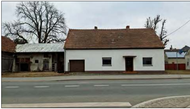
Gmina Tarnów Opolski zrealizuje przebudowę budynku mieszkalnego na „Centrum Tradycji i Aktywności Lokalnej”.