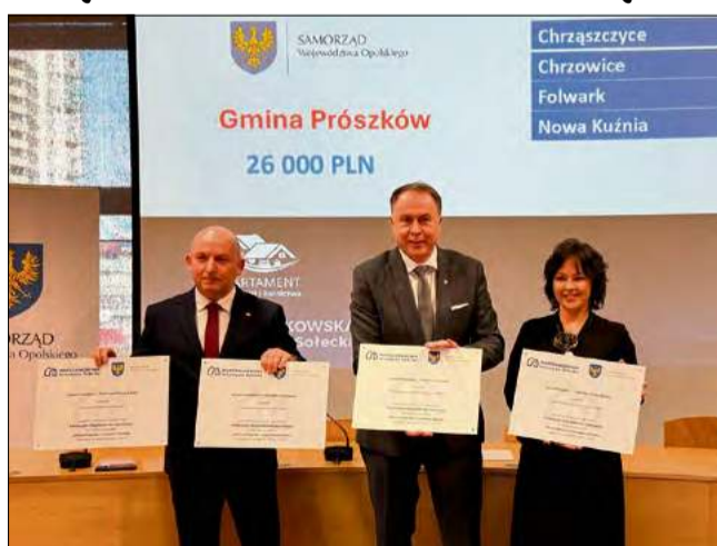
W zeszłym roku z MIS skorzystały sołectwa: Nowa Kuźnia, Chrząszczycy, Chrzowice oraz Folwark.

Nowa Kuźnia i Chrzowice zdecydowały się na doposażenie świetlic wiejskich. Zakupiono niezbędny sprzęt AGD,