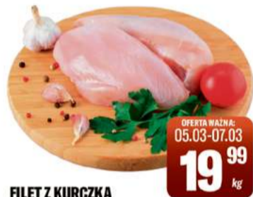
FILET Z KURCZKA