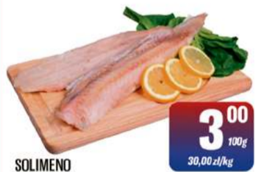
SOLIMENO MORSZCZUK FILET bez skóry luz