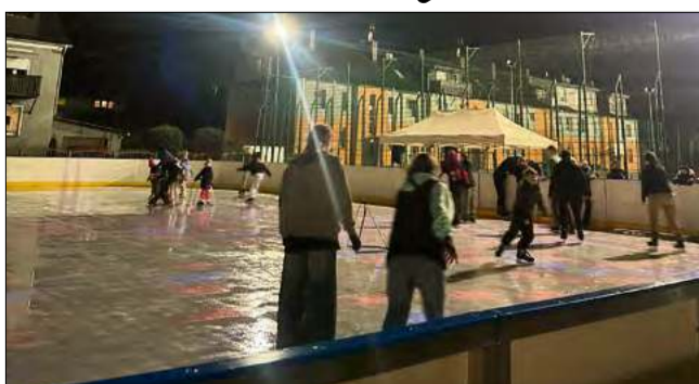
Trwają prace, których celem jest stworzenie rolkowiska.

Jak podkreślają przedstawiciele Miejskiego Ośrodka Sportu i Rekreacji w Ozimku, aktualnie trwają prace, których celem jest przygotowanie tego obiektu do nowej funkcji. Zgodnie z planem z rolkowiska będzie można korzystać już w połowie marca.