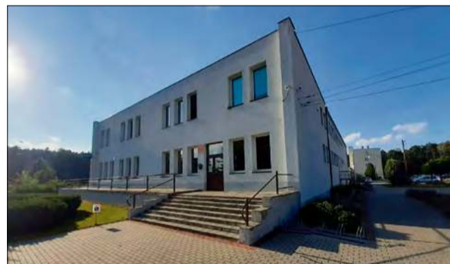
Gminny Ośrodek Kultury w Tarnowie Opolskim przejdzie kompleksową modernizację.

Artykuł sponsorowany, Mateusz Dąbrowski