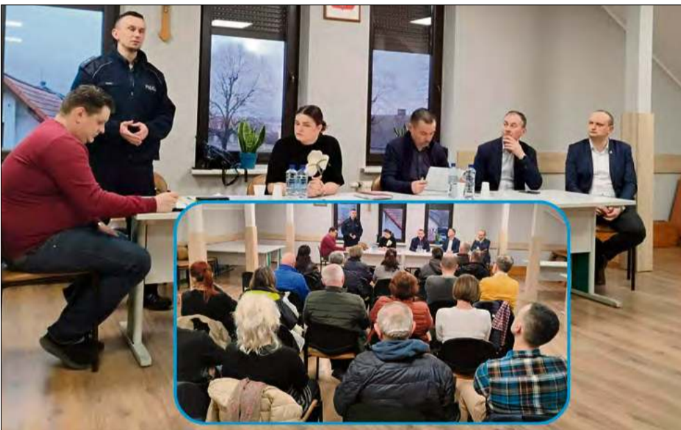
25 lutego odbyło się zebranie sołeckie w Tarnowie Opolskim.

Mieszkańcy Tarnowa Opolskiego spotkali się 25 lutego na zebraniu wiejskim, którego głównym punktem było podsumowanie działalności sołectwa za miniony rok. W spotkaniu udział wzięli przedstawiciele lokalnych władz oraz policji, a dyskusja koncentrowała się wokół spraw bieżących i przyszłych inwestycji.