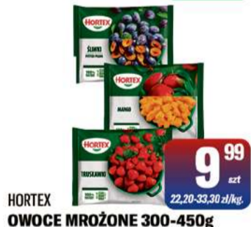
HORTEX OWOCY MROŻONE 300-450g śliwki bez pestek, truskawki, mango