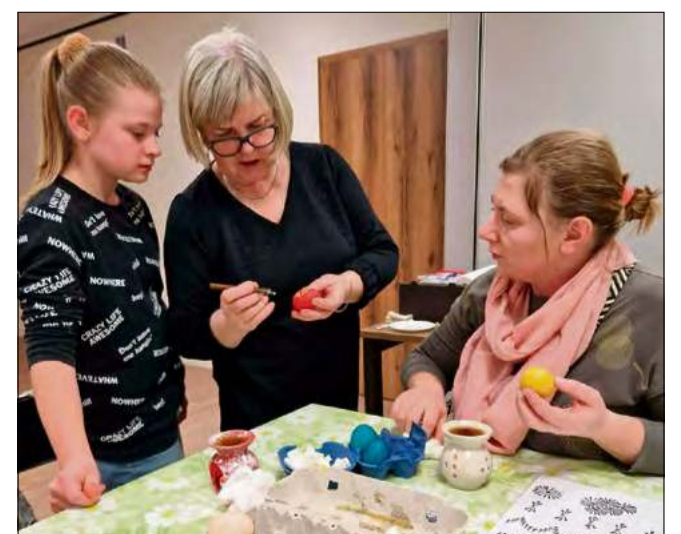
Kultura i tradycja regionu przekazywana młodemu pokoleniu podczas warsztatów kroszonkarskich.

Warto dodać, że rękodzielnicze warsztaty kilka razy odbywały się też w Centrum Aktywności Lokalnej w Chróscinie.