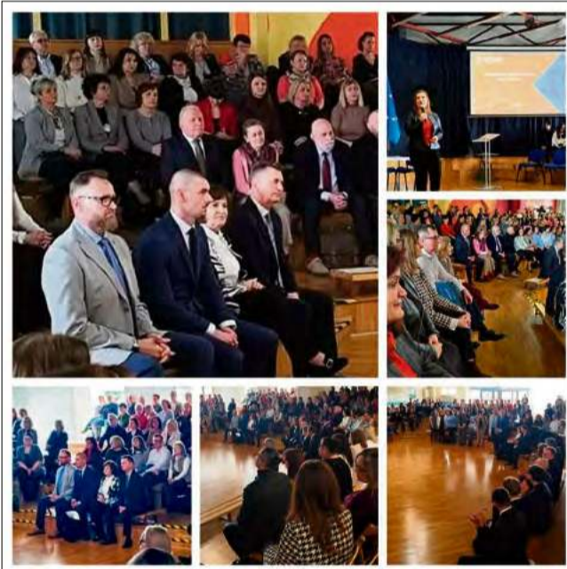
Powiat Opolski obecny był na konferencji „Kierunek: Kompas Jutra” w Opolu, poświęconej założeniom Reformy26.

Z zaprezentowanych założeń wynika, że Reforma26, przygotowywana przez Ministerstwo Edukacji Narodowej, nie ma być rewolucją ustrojową, lecz próbą uporządkowania i unowocześnienia systemu. Mowa była o wzmocnieniu kompetencji przyszłości, takich jak krytyczne myślenie, odpowiedzialność czy