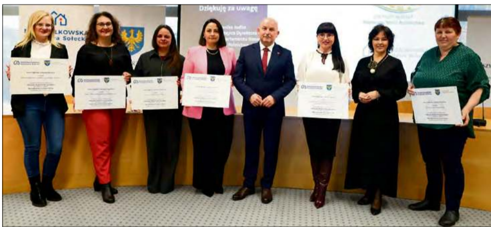
Całkowita wartość zadań zrealizowanych w sołectwach oszacowano na niewiele ponad 80 tys. zł.

Jednym z sześciu sołectw, które brało udział w Marszałkowskiej Inicjatywie Sołec-