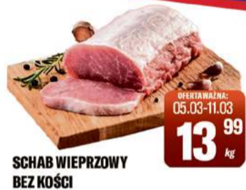
SCHAB WIEPRZOWY BEZ KOŚCI