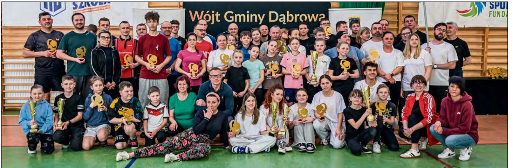
W tym roku w turnieju wzięła udział rekordowa liczba zawodników.