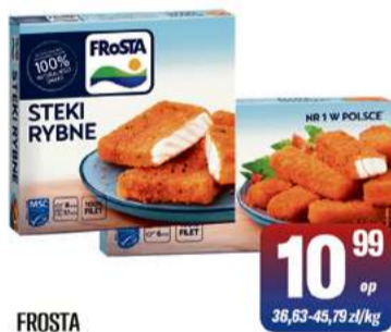
FROSTA RYBA W PANIERCE 240-300g wybrane rodzaje