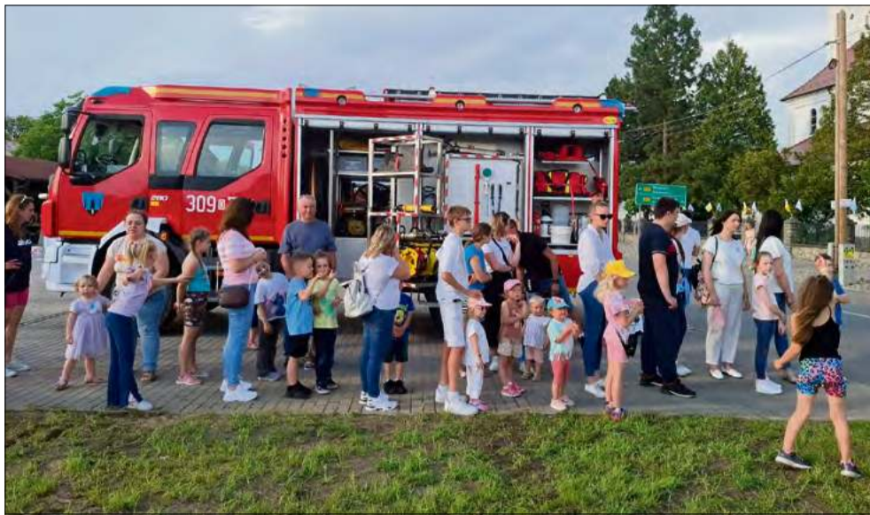
Sołectwa gminy Komprachcice mają w planach organizowanie wydarzeń integracyjnych.

- Dla nas to ważne inwestycje, ponieważ zależy