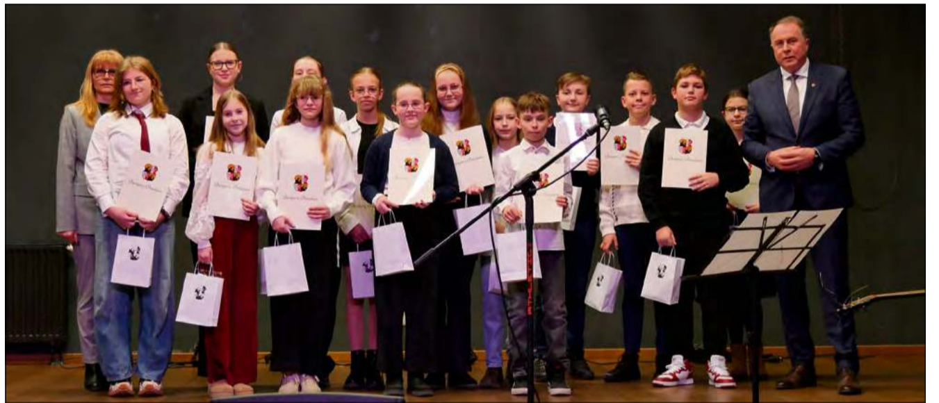
Największa liczba stypendystów pochodziła ze szkoły podstawowej w Prószkowie.

Warto dodać, że najwyższą średnią w tym roku - 5,54 - osiągnęła uczennica ze Szkoły Podstawowej w Prószkowie.