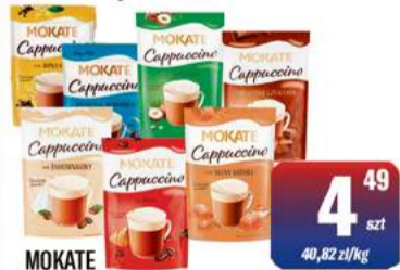
MOKATE KAWA CAPPUCCINO 110g wybrane rodzaje