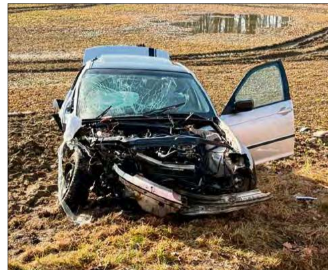
Trwa wyjaśnianie dokładnych przyczyn zdarzenia.

D o groźnego zdarzenia drogowego doszło w piątek 27 lutego rano. W wyniku wypadku dwie osoby zostały przewiezione do szpitala.