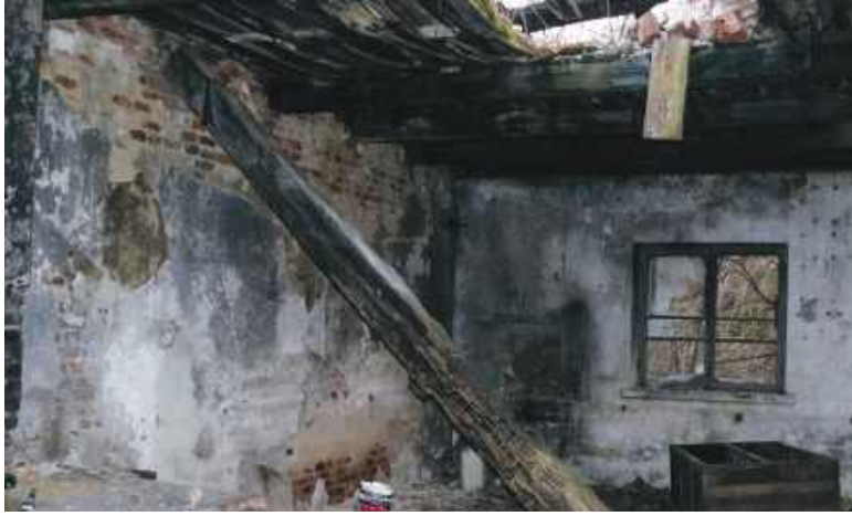
Wnętrze 200-letniej kuźni, w której był pożar