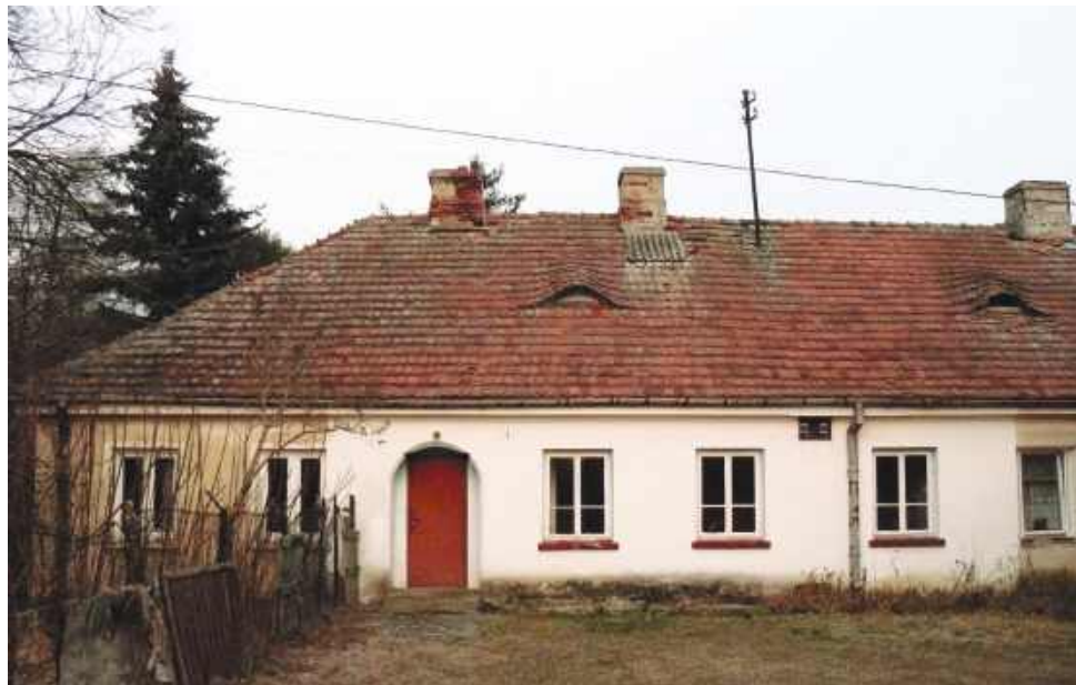
Zabytkowa oficyna przy ruinach pałacu