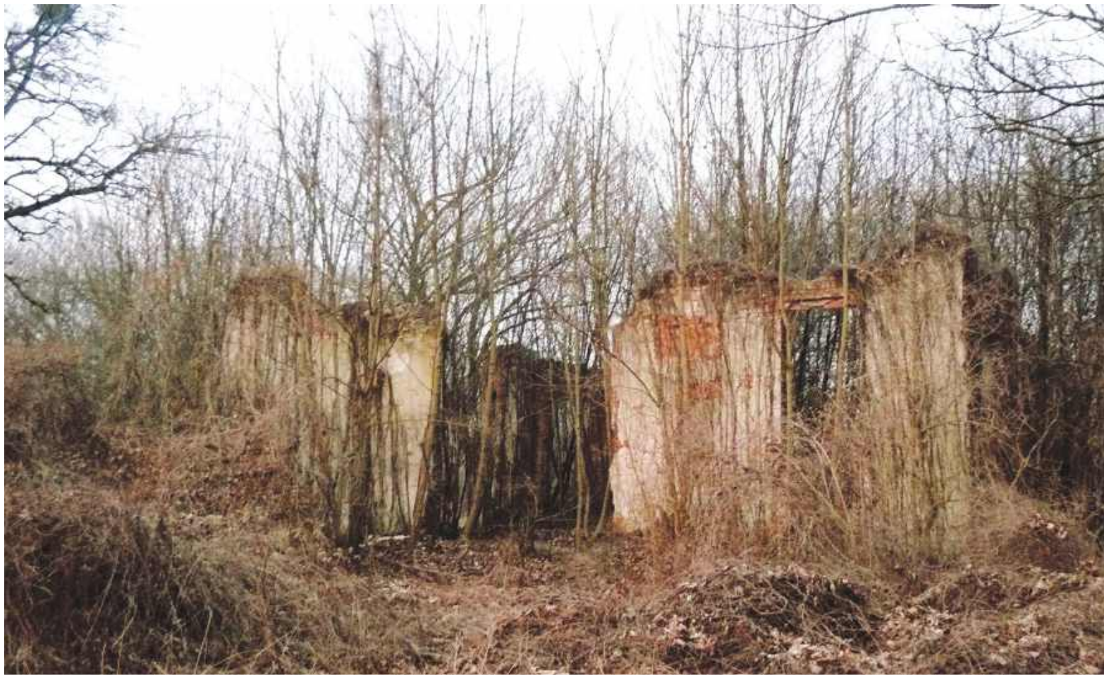
Ruiny pałacu w Górze

Stan, w jakim znajdują się ruiny pałacu, pobliska oficyna (zamieszkała przez kilku lokatorów), spichlerz i kuźnia obrazują załączone zdjęcia. Z oczywistych względów najlepiej zachowana jest oficyna, natomiast reszta to obraz nędzy i rozpacz. Dewastacja tych obiektów postępuje z dnia na dzień. Jest wręcz nieprawdopodobne, by pałac (ujęty w rejestrze zabytków) został odbudowany, natomiast gruntowny remont jest nadal możliwy w przypadku spichlerza, kuźni i oficyny. Obecne władze Gminy Wieliszew od lat starają się przejąć ruiny pałacu i oficynę. W tym celu wieliszewscy radni poprzedniej kadencji stworzyli plan zagospodarowania. Choć plan powstał, Gmina