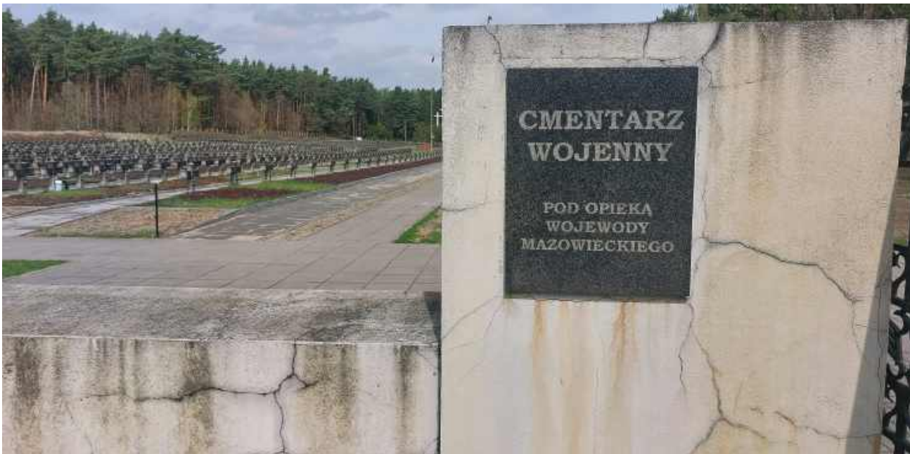
Pomnikami, o które pytamy wojewodę, nikt się praktycznie nie interesuje