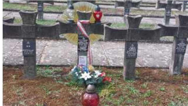
Nimb na krzyżu nagrobnym błogosławionego przypomina wyroby Cepeliady

„W ślad za moją rozmową przeprowadzoną z Panem wicewojową na Cmentarzu Mauzoleum w Lesie Palmirskim, ponownie zwracam się z prośbą o spowodowanie uporządkowania cmentarza, a w szczególności o wycięcie krzaków zasłaniających w 80 proc. krzyże / symbol Cmentarza Palmirskiego, niszczące bryłę architektury cmentarza a spełniające rolę śmietnika”.