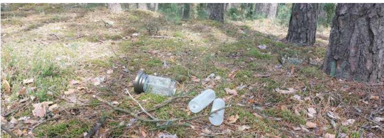
W chwili robienia fotorelacji, naokoło cmentarza walały się „tylko” resztki po „znakach pamięci”.