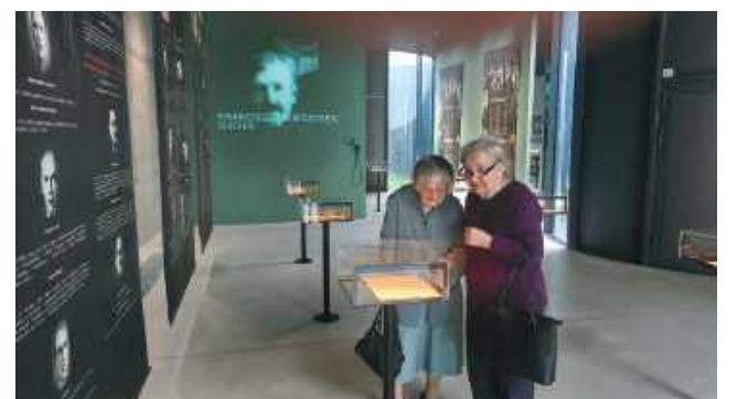
Muzeum - jedyne miejsce, którego nie trzeba się wstydzić