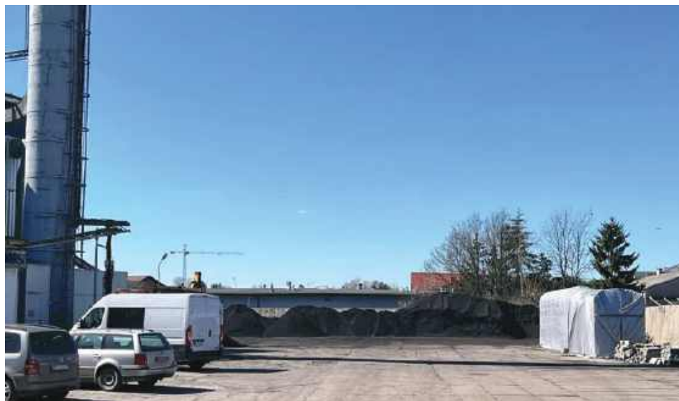
Tymczasem ciuchcia zabezpieczona plandeką czeka na placu PEC-u