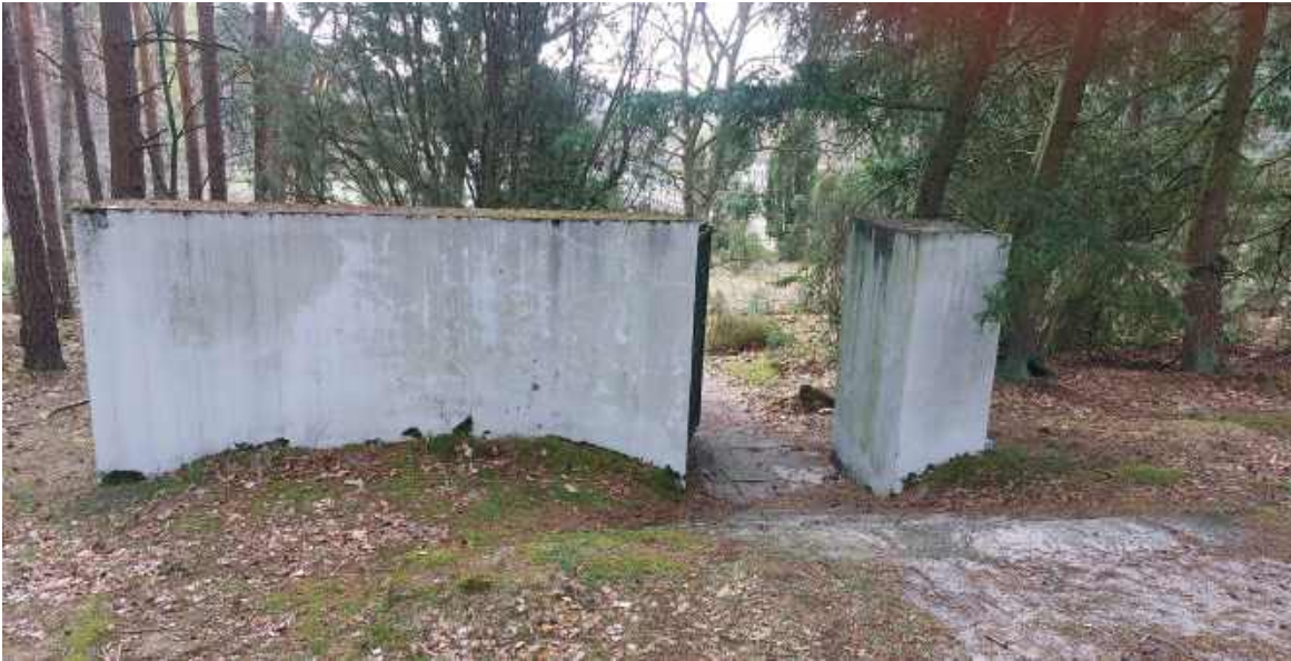
Resztki dawnego ogrodzenia tkwią, jak wyrzuty sumienia