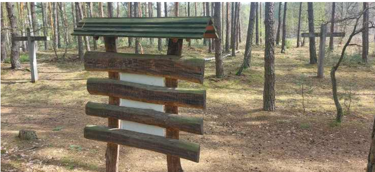
Tam, gdzie leżą kości pomordowanych, jest tylko deptak turystyczny