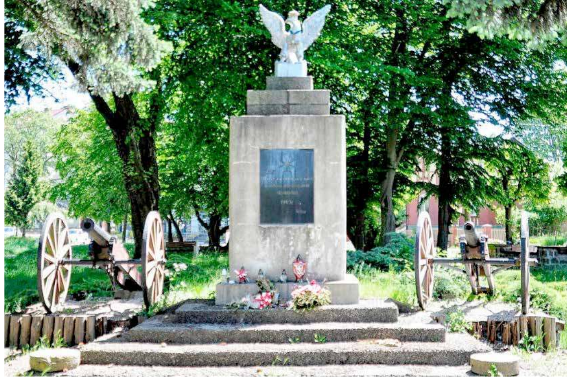
Zdjęcie pomnika stare

gazynach zbiorczych i tak np. w kościele w Maszewie zgromadzono fortepiany z okolicznych dworów, magazyny nowogardzkiej krochmalni pełne były mebli itp. Kiedy przyjechali tu polscy osadnicy - zastali pusty teren bez zwierząt, maszyn, zapasów, ziarna siewnego i paszy dla zwierząt, tymczasem w lipcu trzeba było rozpocząć żniwa. Po terenie grasowały całe gangi szabrowników. Zamieszania dopędzili Sowietci, którzy nachodzili wioski, zabierali zwierzęta, paszę, napastowali kobiety, zmuszali osadników do pracy na swoich majątkach. Szczególnie uciążliwa była jednostka zlokalizowana okolicy Sikerek.