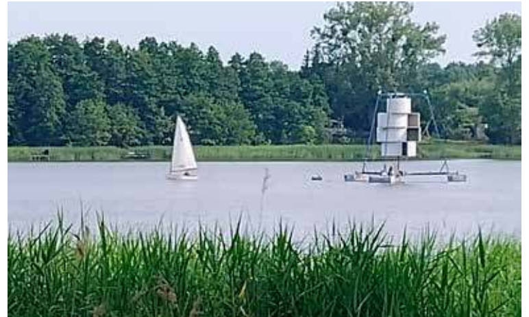
W dość póki co mglistym zarysie na jeziorze mają pojawić się dwa nowe areatory