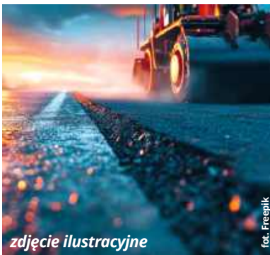
zdjęcie ilustracyjne

● GM. CHEŁM Wydaje się, że przebudowa drogi powiatowej, która łączy Okszów-Kolonię ze Srebrzyszcem, to jedno z tych zadań inwestycyjnych, jakie zarząd powiatu musi tymczasem odłożyć „ad acta”. Nie po myśli inwestora poszły działania związane z opracowaniem dokumentacji projektowej, a i gmina ma wątpliwości związane z wydaniem niezbędnej decyzji o środowiskowych uwarunkowaniach dla tego przedsięwzięcia.