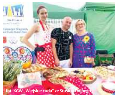
foto. KGW „Wiejskie cuda” ze Stasina Dolnego

Dzisiaj nie potrafimy się już spotykać. Pogadać. Przysiąść na ławce i posłuchać o tym, co komu