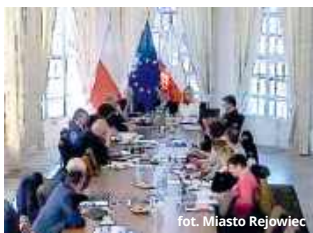
rad. Miasto Rejowiec

● GM. REJOWIEC Sporo różnego rodzaju wątpliwości zrodziło się w czasie ostatnich obrad rady miejskiej przy okazji omawiania sprawozdania z zakresu wspierania rodziny za 2024 rok oraz dokumentu, w którym dokonano analizy wysokości średnich wynagrodzeń nauczycieli w szkole i przedszkolu prowadzonych przez gminę Rejowiec za ubiegły rok. Rzecz w tym, że sprawozdania zostały jedynie przyjęte przez głosowanie, natomiast z ich treścią radni zapoznali się w czasie posiedzenia komisji stałych rady miasta. - Chyba nie tak to powinno wyglądać. Także mieszkańcy powinni wiedzieć, co zapisano w tych dokumentach - zauważył jeden z radnych.