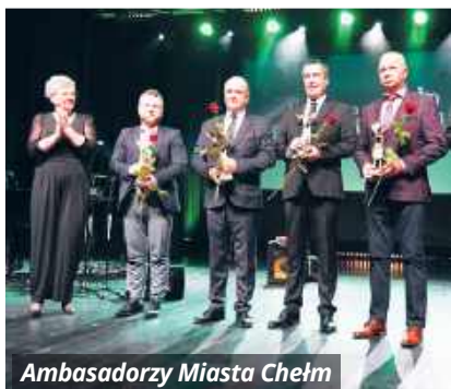
Ambasadorzy Miasta Chełm