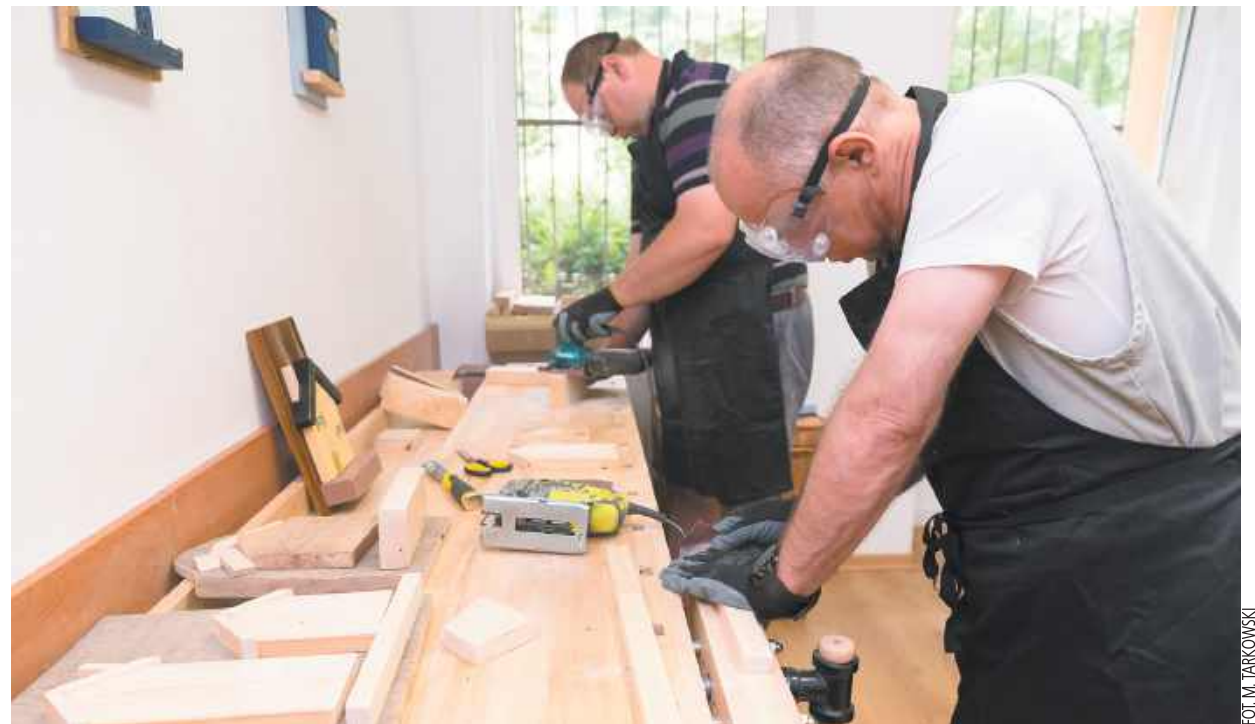
Realizacja projektu „ZA KROKIEM KROK” w ramach Działania 11.2 Usługi społeczne i zdrowotne RPO WL 2014-2020 w Powiatowym Centrum Pomocy Rodzinie w Kraśniku

Wspieranie aktywnego włączenia społecznego w celu promowania równości szans, niedyskryminacji i aktywnego uczestnictwa w życiu społecznym oraz zwiększanie zdolności do zatrudnienia, w szczególności grup w niekorzystnej sytuacji – to cel szczegółowy naboru w ramach Działania 8.1 Aktywizacja społeczna i zawodowa programu Fundusze Europejskie dla Lubelskiego 2021-2027. Na przedmiotowe wsparcie zabezpieczono środki w wysokości blisko 2,7 mln zł!