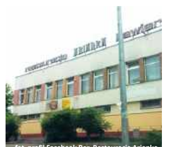
W znanej restauracji powstanie teraz centrum lokalnej integracji i azyl dla ludzi kultury

- Początkowo właściciel wycenił obiekt na kwotę 1,2 mln