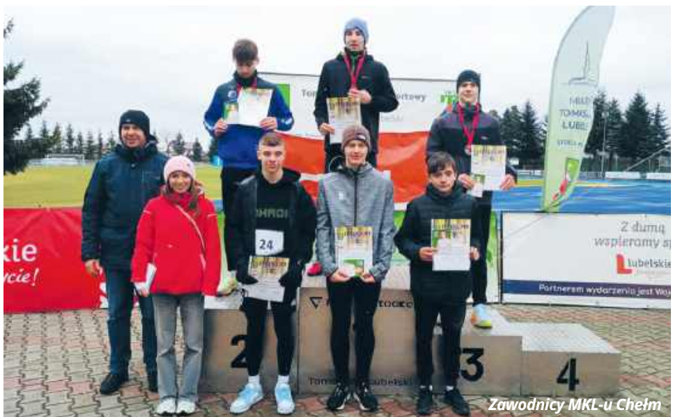
Zawodnicy MKL-u Chełm