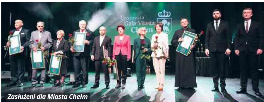
Zasłużeni dla Miasta Chełm