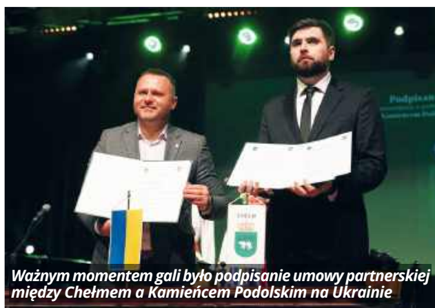
Ważnym momentem gali było podpisanie umowy partnerskiej między Chełmem a Kamieńcem Podolskim na Ukrainie