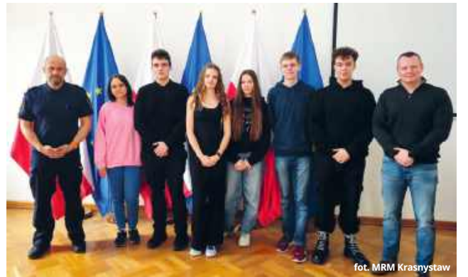
fol. MRM Krasnystaw

- Spotkanie było wynikiem ustaleń z ostatniej sesji młodzieżowej rady i dotyczyło