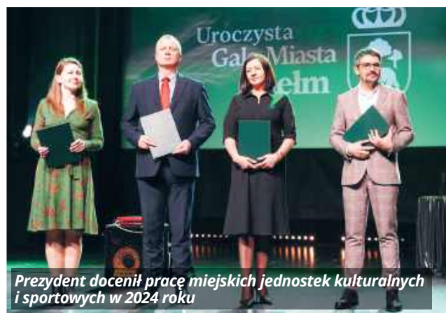
Prezydent docenił pracę miejskich jednostek kulturalnych i sportowych w 2024 roku