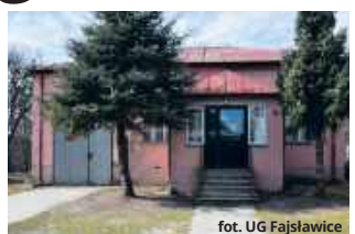
fol. UG Fajslawice

● GM. FAJSŁAWICE Wojewódzki Fundusz Ochrony Środowiska i Gospodarki Wodnej w Lublinie przyznał dotację w wysokości 500 tys. zł na termomodernizację budynku remizy OSP w Suchodołach w ramach inicjatywy „Bitwa o remizy”.