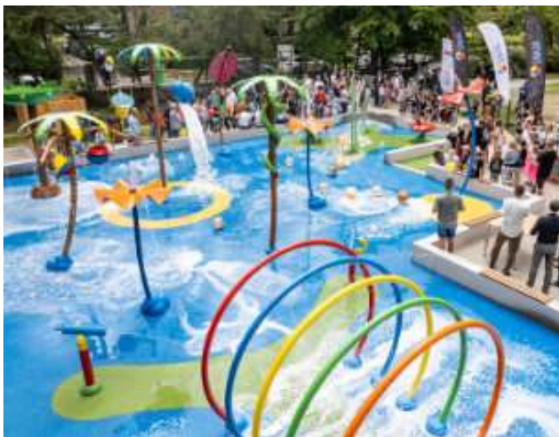
► Na placu zabaw zamontowano ponad 20 urządzeń

Warto podkreślić, że jest to pierwszy w Zabrzu wodny plac zabaw, ale nie ostatni. Kolejny taki obiekt ma powstać w rewitalizowanym Parku Hutniczym, usytuowanym w centrum naszego miasta. Koszt wykonania placu zabaw z dostępem dla osób niepełnosprawnych wynosi blisko 1,5 mln zł.