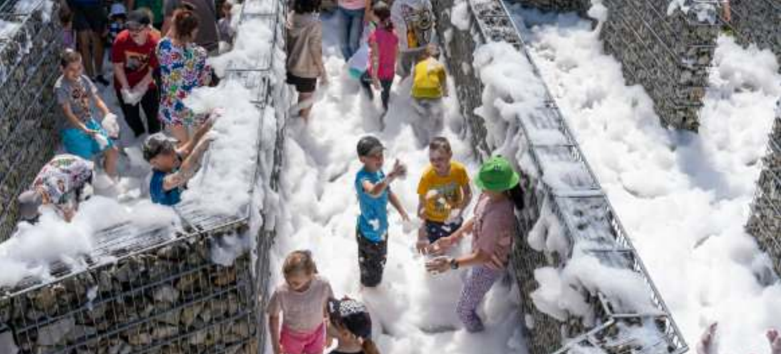
► Zabawa w pianie w Parku 12C Sztolni Królowa Luiza

1 CZERWCA TO DZIEŃ, NA KTÓRY Z NIECIERPLIWOŚCIĄ CZEKAJĄ NAJMŁODSI