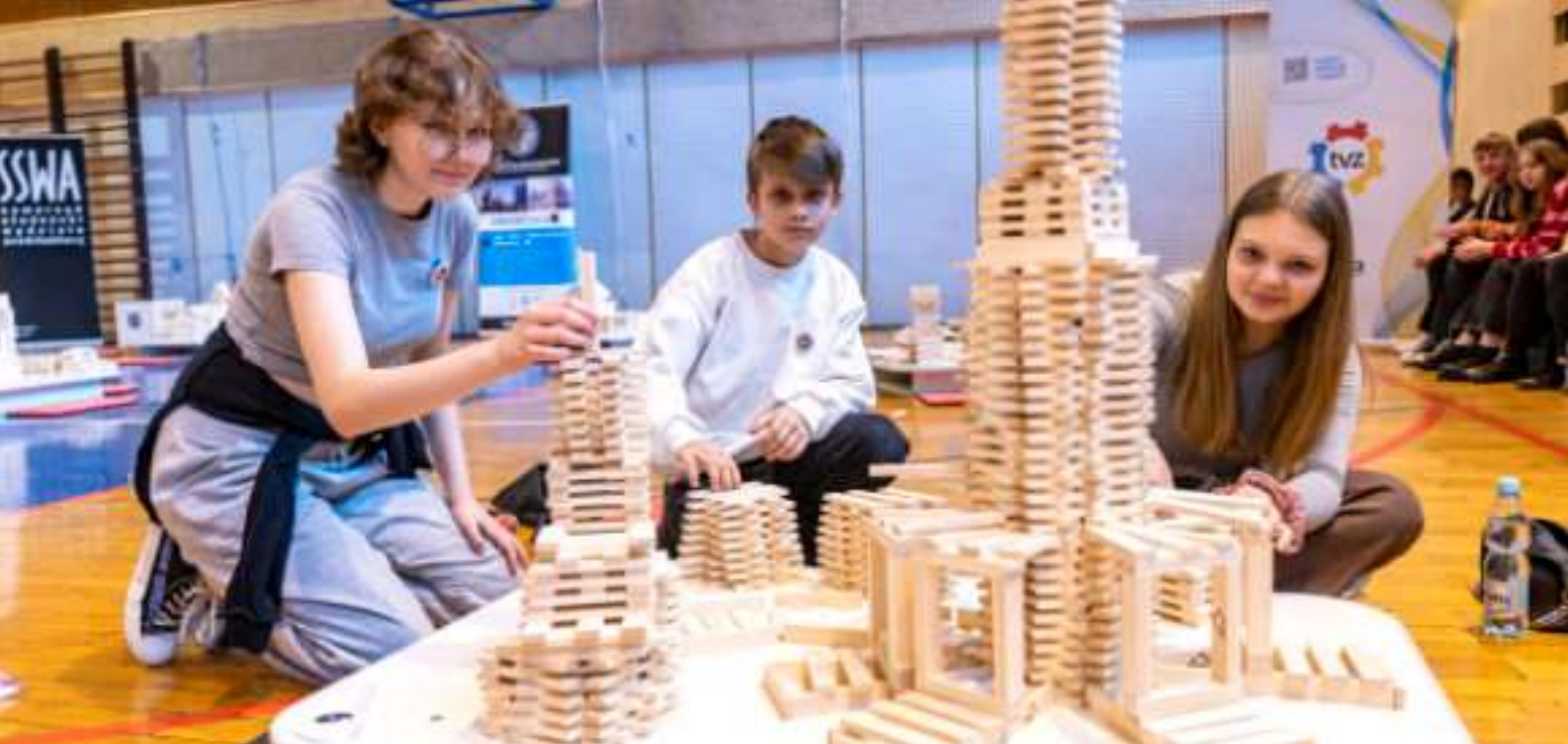
► Uczestnikom konkursu nie brakowało pomysłowości i precyzji

SPÓŁKA ZBM-TBS ZAPROSIŁA NA „KLOCKAMI WIELKIE BUDOWANIE”