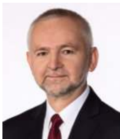
► Prof. Zbigniew Paszennda

nienie procesu kształcenia będzie się odbywało w takiej formie, że każdy ze studentów będzie miał możliwość wyboru ścieżki z jednej strony prowadzonej przez określone katedry, natomiast z drugiej strony z poszczególnych ścieżek dyplomowania będzie mógł jeszcze wybierać przedmioty, które go naj-