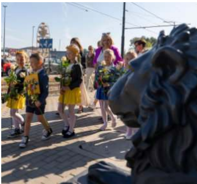
► W Dniu Dziecka mali goście odwiedzili zabrański ratusz