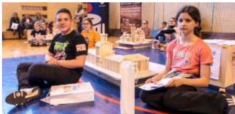
► To była już trzecia edycja akcji zorganizowanej przez ZBM-TBS

W finale, który odbył się w hali Miejskiego Ośrodka Sportu i Rekreacji, najlepsza okazała się reprezentacja Szkoły Podstawowej nr 21. Drugie miejsca zajęła SP nr 14, a trzecie – SP nr 17. GOR