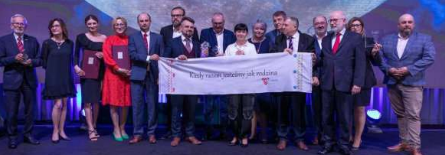
► Gala wręczenia nagród