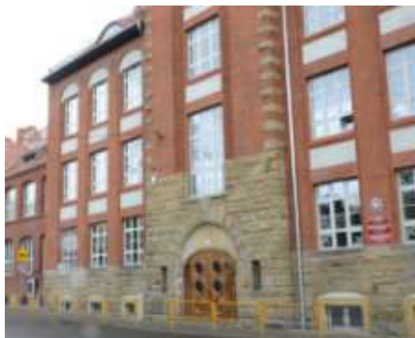
► Zespół Szkolno-Przedszkolny nr 16