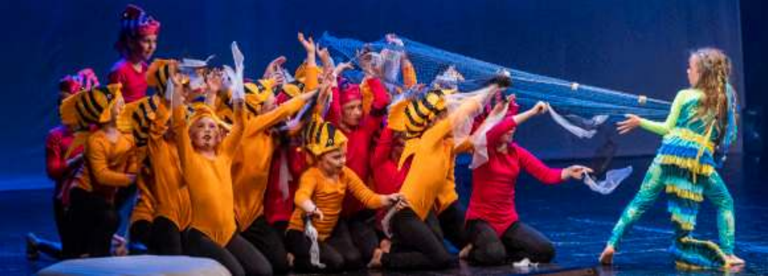
► Uczestnicy Festiwalu na scenie Teatru Nowego