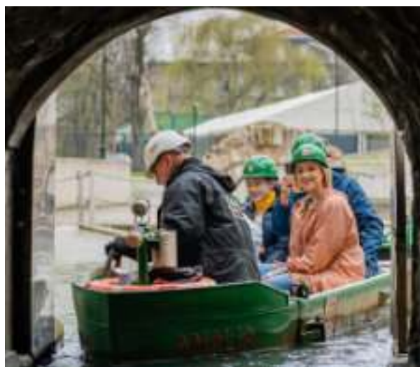
► Podziemny rejs zabytkową sztolnią