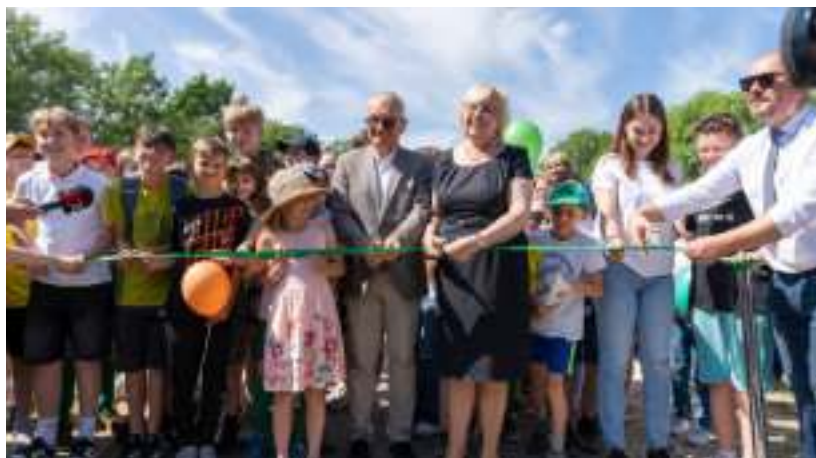
► Symboliczne przecięcie wstęgi