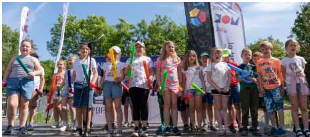
► Otwarcie geoparku zorganizowane zostało w Dniu Dziecka