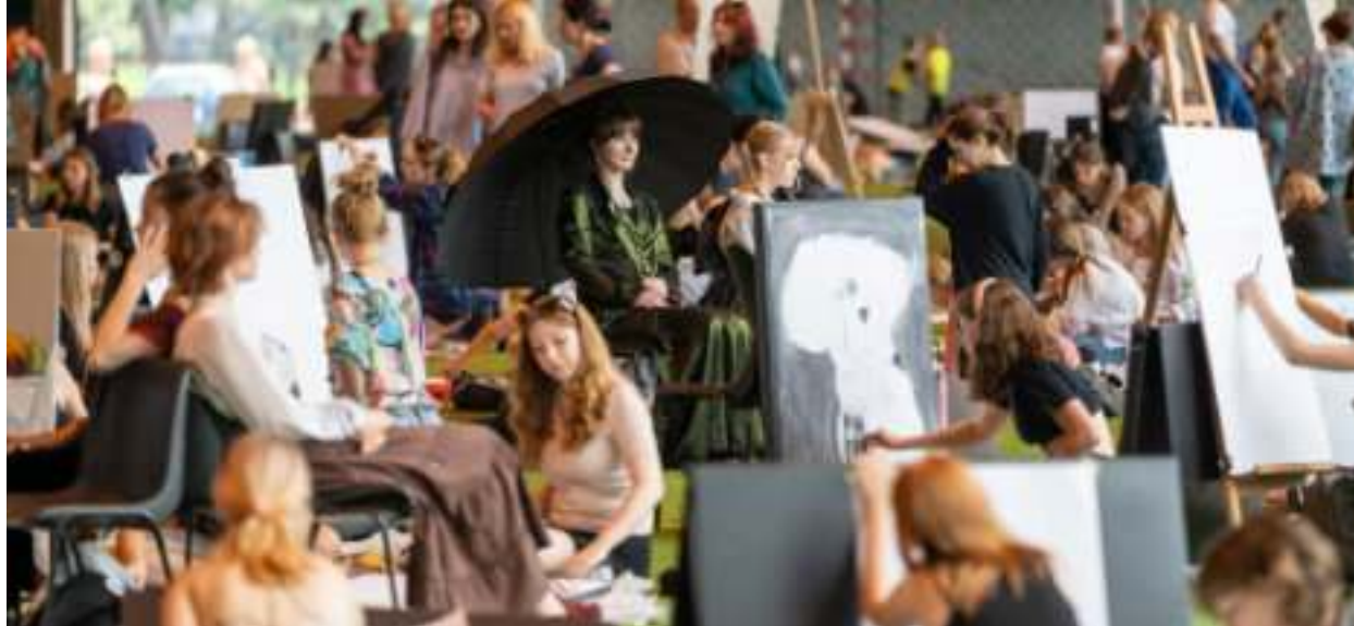
► W Międzynarodowym Festiwalu Rysowania wzięło udział około tysiąca osób