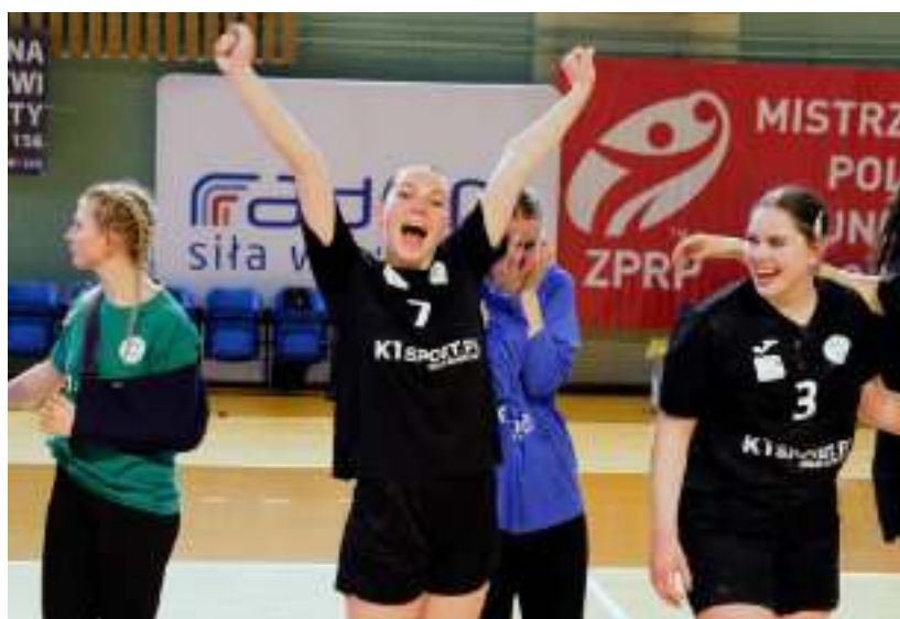
► Powody do dumy zapewniły nam również zabrzańskie piłkarki ręczne