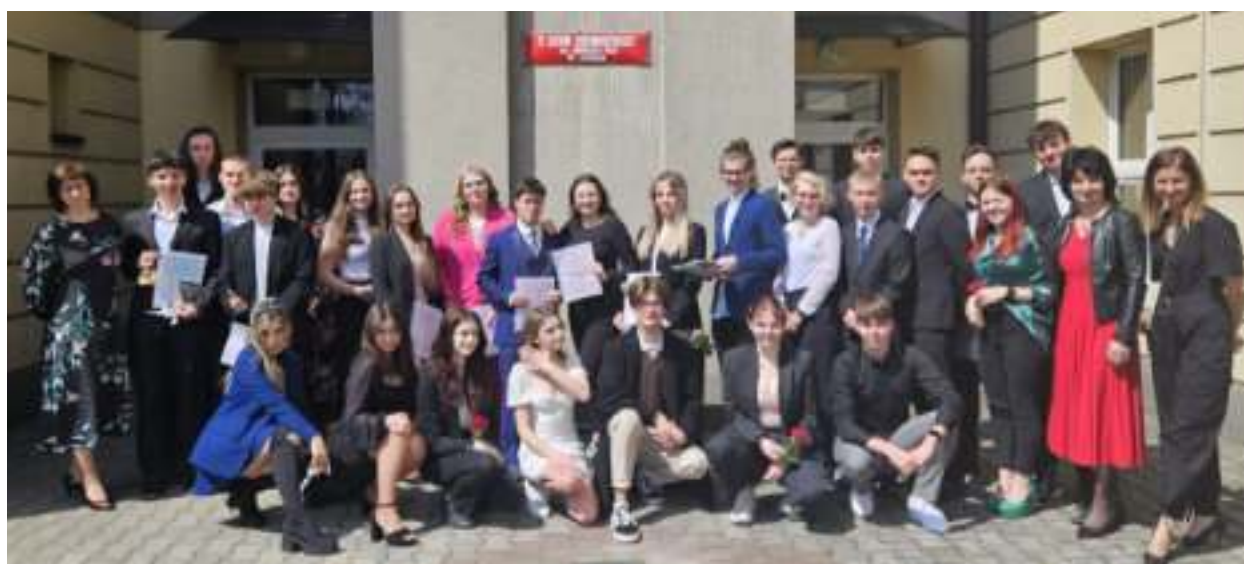
► Pożegnanie czwartych klas w IV Liceum Ogólnokształcącym

Ponad tysiąc absolwentów zabrzańskich szkół średnich przystąpiło w maju do egzaminu dojrzałości. Tuż po nich pierwszy ważny test czekał ósmoklasistów.