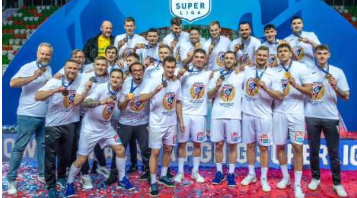
► Brązowi medaliści PGNiG Superligi