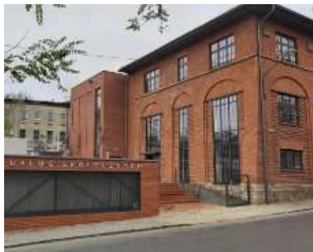
► Centrum Usług Społecznych