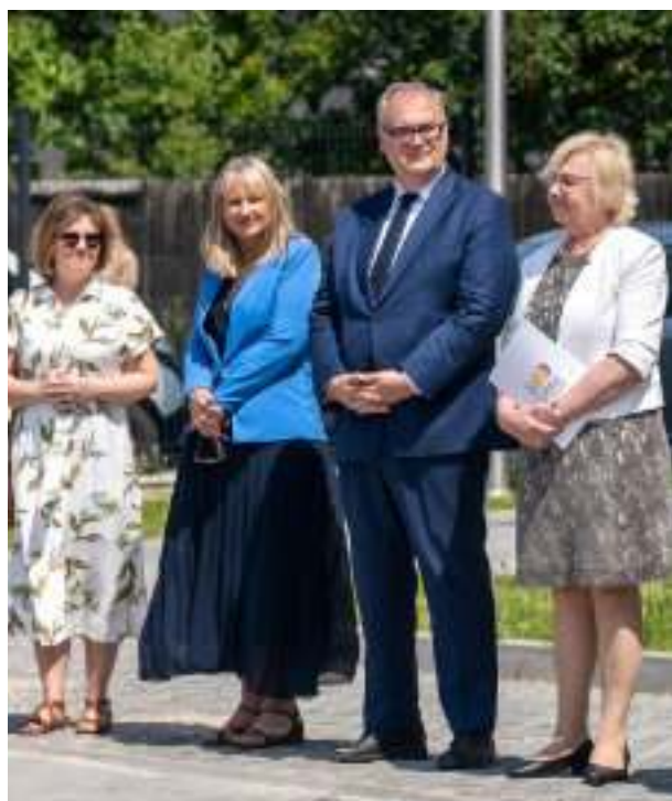
► Przedstawiciele zabrzańskiego samorządu...