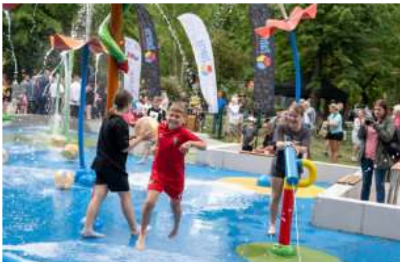
► Wodna atrakcja z pewnością przyciągnie latem wielu chętnych