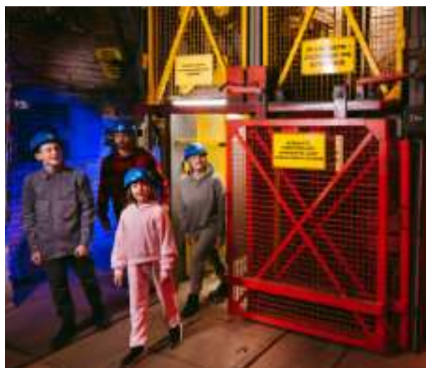
► Poziom 320 w Kopalni Guido