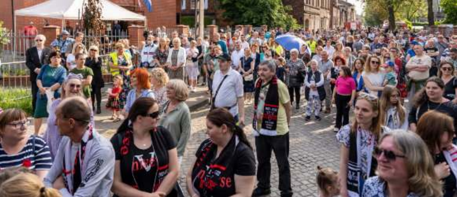
► Majowy festyn na Zandce