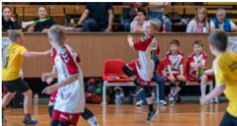
► Młodzi szczypiorniści zapewnili kibicom sporo emocji

C hcemy zachęcać mieszkańców Zabrze do uprawiania sportu, ale też do kulturalnego kibicowania zgodnie z zasadą „fair play”. Naszym celem jest promowanie aktywnego uprawiania różnych dziedzin sportu również poza zajęciami szkolnymi, propagowanie idei „Przez sport do zdrowia”, a także włączenie się w firmowaną przez Ministerstwo Sportu i Turystyki akcję „STOP zwolnieniom z WF-u” – podkreślają organizatorzy imprezy. Stowarzyszenie Piłki Ręcznej „Pogoń 1945” Zabrze funkcjonuje w naszym mieście od ośmiu lat. Do klubu należą około 220 osób. Na co dzień są to uczniowie Zespołu Szkół Sporto-