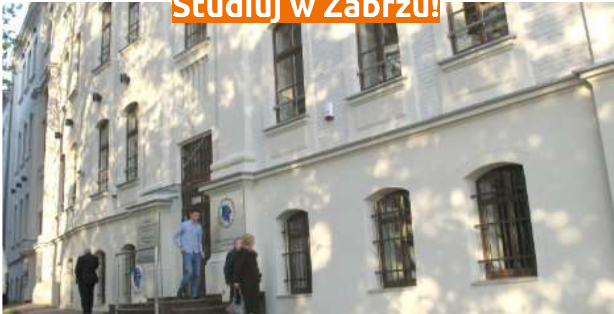
► Siedziba Akademii Śląskiej przy ul. Park Hutniczy