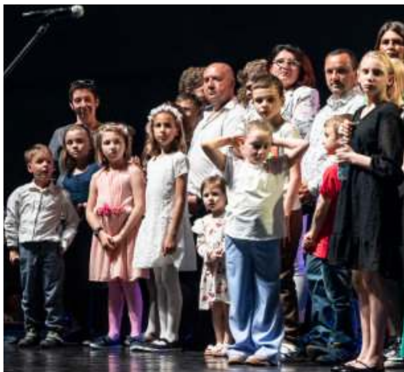
► Rodzinnie na scenie Domu Muzyki i Tańca