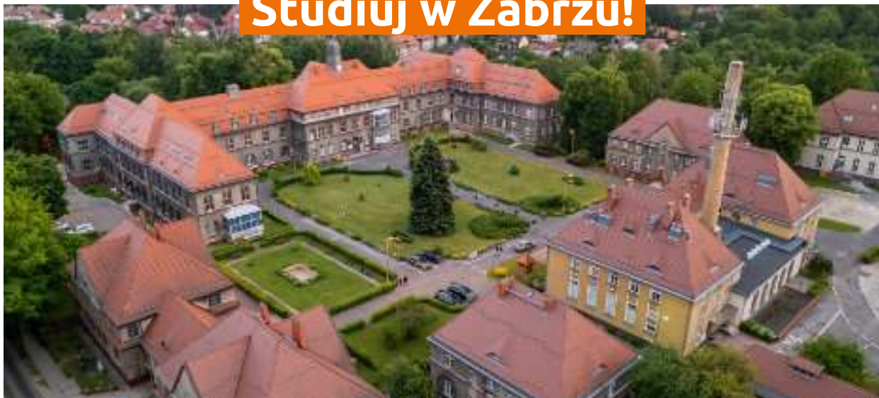
► Malowniczy kampus Śląskiego Uniwersytetu Medycznego w Rokitnicy