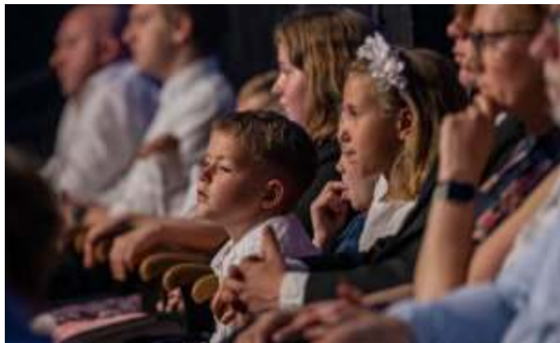
► To już 16. edycja Metropolitalnego Święta Rodziny

Kolejne wydarzenia przed nami. Szczegółowy program dostępny jest na stronie www.swieto-rodziny.pl . GOR