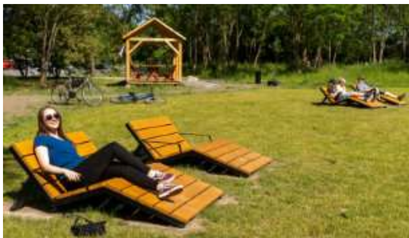
► Trawiasta plaża z leżakami zachęca do opalania