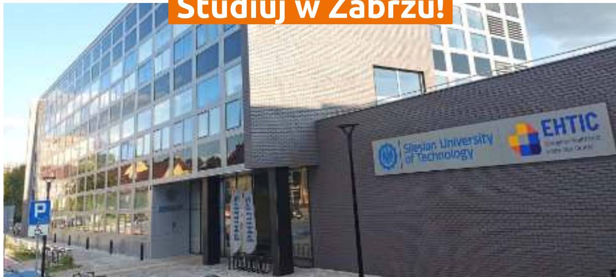
► Europejskie Centrum Innowacyjnych Technologii dla Zdrowia