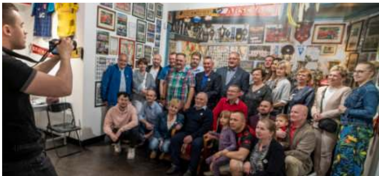
► Wystawa przygotowana przez Muzeum Miejskie