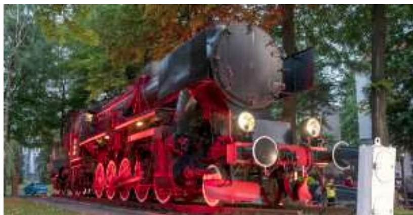
► Zabytkowa lokomotywa przed siedzibą DB Cargo