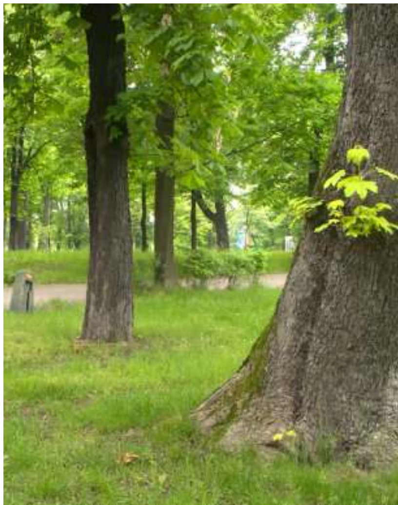
► Już wkrótce Park Hutniczy całkowicie zmieni oblicze

Warto podkreślić, że spośród blisko 2500 tysięcy polskich gmin Zabrze znalazło się w gronie 29 jednostek samorządu terytorialnego, które skutecznie pozyskały środki z funduszy norweskich. To około 15 mln zł, dzięki którym w Zabrzu zrealizowanych zostanie wiele projektów. To zarówno półkolonie dla najmłodszych, warsztaty dla rodziców i opiekunów czy gry miejskie dla całych rodzin, jak i inwestycje, wśród których warto wymienić tężnie solankowe, wodny plac zabaw, zlikwidowanie barier architektonicznych w siedzibie