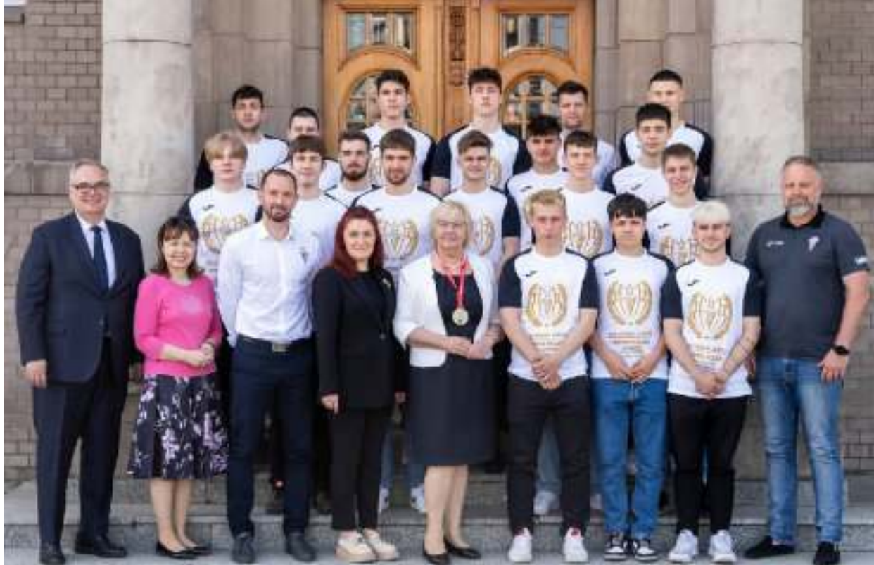
► Wizyta młodych sportowców w zabrzańskim ratuszu