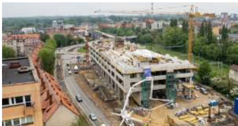
► Prace na budowie są coraz bardziej zaawansowane