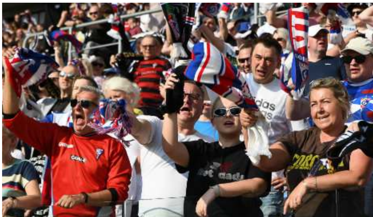
► Końcówka sezonu przyniosła kibicom sporo powodów do zadowolenia