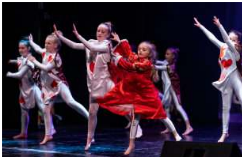
► Historia Festiwalu sięga lat 50. XX wieku

odbył się w 1952 r. Później zmieniała się jego nazwa, kształt, terminy, lecz idea przedsięwzięcia pozostała niezmienna. W 1992 r. nadano Festiwalowi imię Norberta Kroczka, zasłużonego twórcy za-brzańskiej kultury. GOR