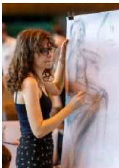
► Fot. UM Zabrze