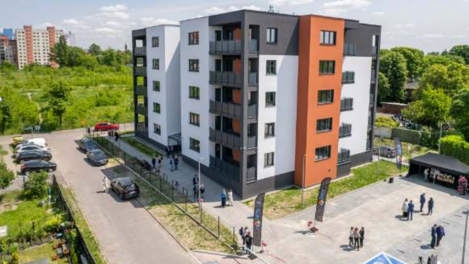
► W budynku przy ul. Żeromskiego powstało 35 nowoczesnych mieszkań