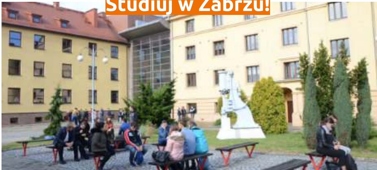
► Kampus Politechniki Śląskiej przy ul. Roosevelta