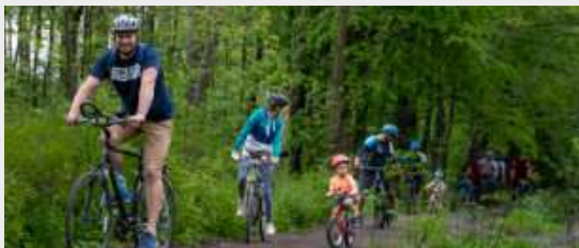
► Uczestnicy rajdu na trasie