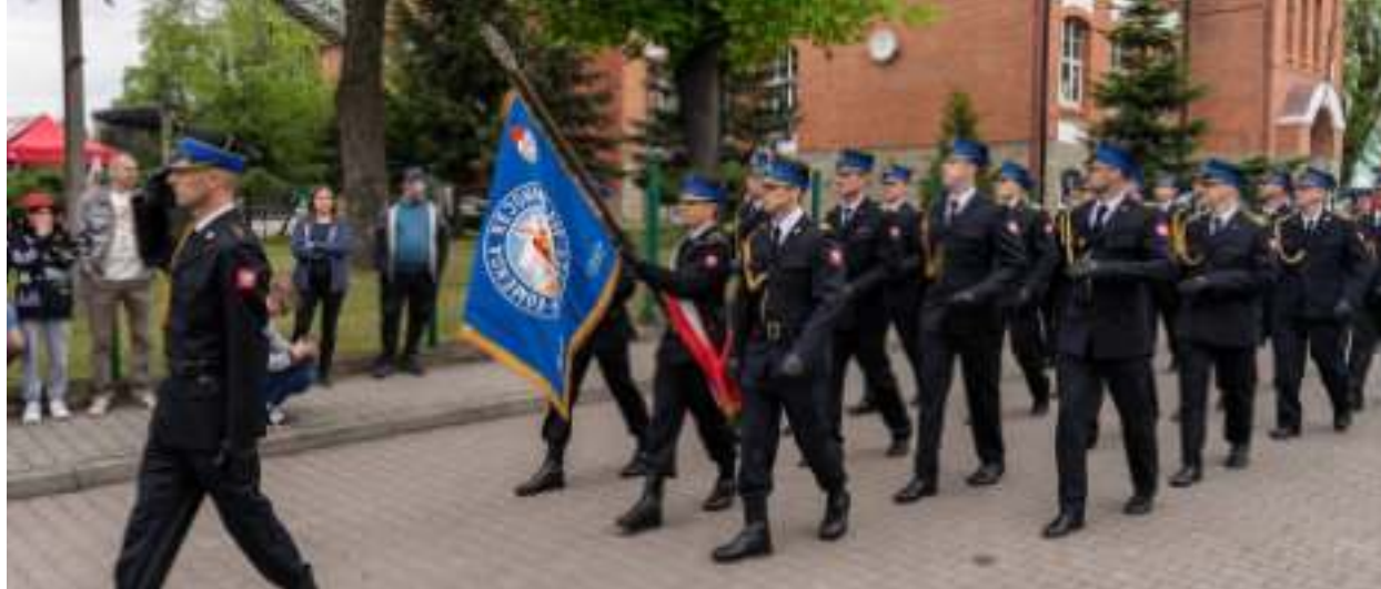
► Uroczysty przemarsz ulicami miasta