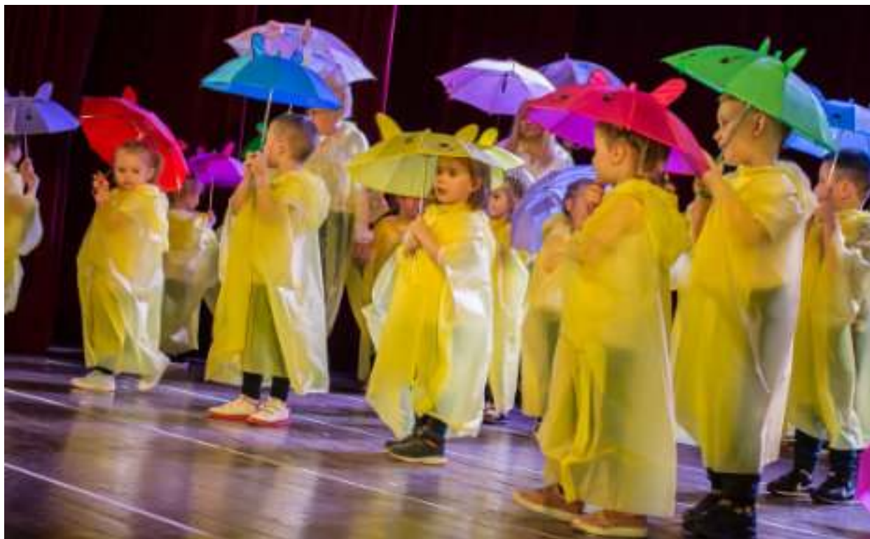
► Mali artyści na scenie Miejskiego Ośrodka Kultury skutecznie zarażali innych swoim optymizmem

Optymizm, radość i pełen profesjonalizm w wydaniu małych artystów można było zobaczyć w maju na scenie Miejskiego Ośrodka Kultury w Zabrzu. Przedszkole nr 20 przygotowało bowiem dla publiczności Galę Optymizmu.