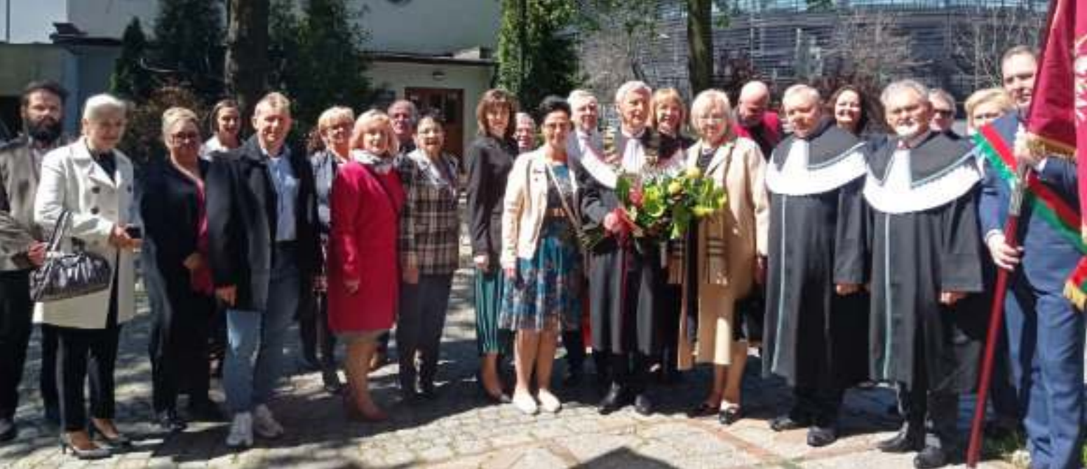
► Spotkanie z zabrzańskimi rzemieślnikami Fot. UM Zabrze (2)