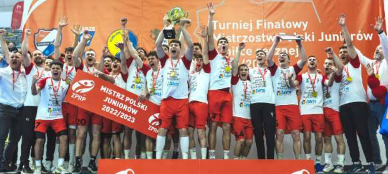
► Juniorzy SPR Górnika Zabrze