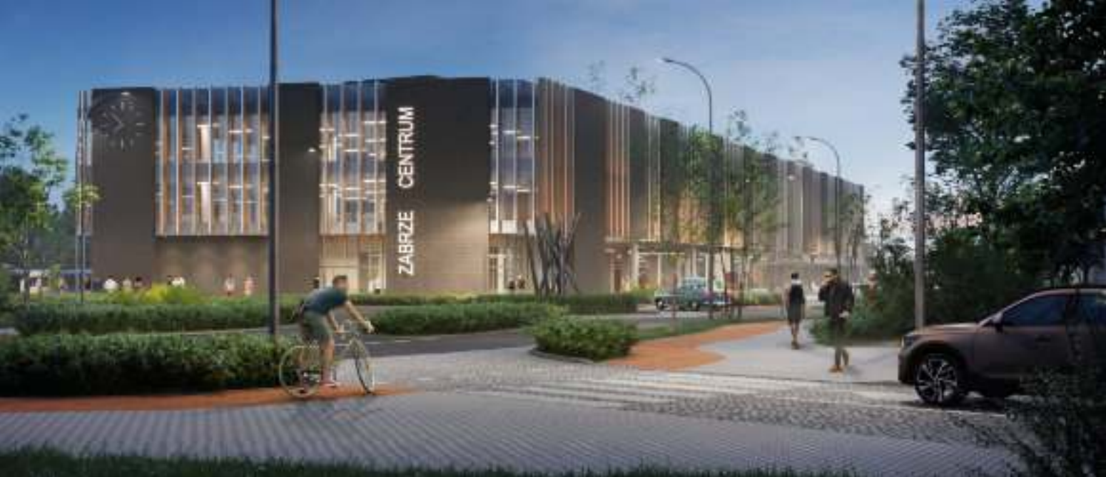
► Tak ma wyglądać gotowe centrum przesiadkowe przy ul. Goethego