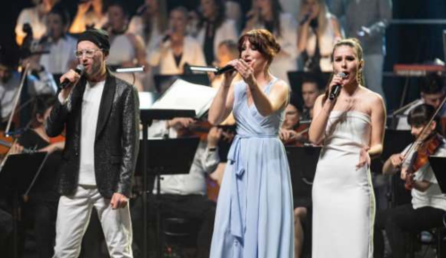
► Koncert inauguracyjny tegoroczną edycję Metropolitalnego Święta Rodziny