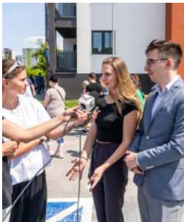
► ...i lokatorzy nowego bloku