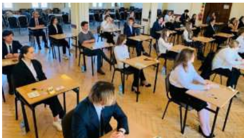
► Maturzyści w III Liceum Ogólnokształcącym

było ich około 2 tysięcy. - Życzymy im osiągnięcia wyników, które pozwolą na kontynuowanie nauki w wymarzonych szkołach średnich, gdzie będą szlifować talenty, zdobywać wiedzę i rozwijać pasje – uśmiecha się prezydent Małgorzata Mańka-Szulik. GOR