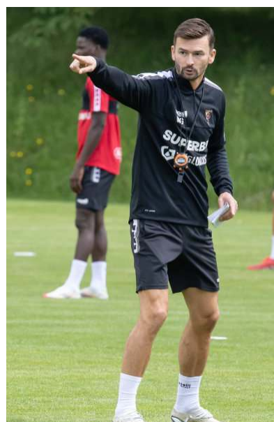
Fot. Górnik Zabrze(2)

Do Zabrza trafił także wypożyczony z FC Augsburg 21-letni bramkarz