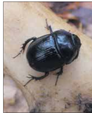
Żuk leśny i czaszka sarny