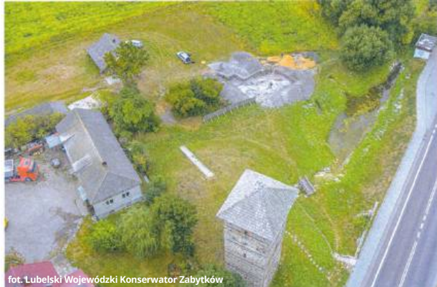
fol. Lubelski Wojewódzki Konserwator Zabytków

cjonował niegdyś umocniony wał z fosą, który skierowany był w stronę gródka istniejącej wieży. Wał i fosa nie miały charakteru obronnego, a tylko porządkowały całe założenie. Fosa pełniła przede wszystkim funkcję drenażową i odprowadzała wody roztopowe oraz opadowe z Janowskiego pagóra, oraz okolicznych pól do pobliskiej rzeki Garki. Miała zabezpieczać zabudowę jako pewnego rodzaju system odwadniającego. Fakt jednoczesnego istnienia dwóch wież odnotowało kilku badaczy. Potwierdzają to wykonane przez nich badania. Analiza den-