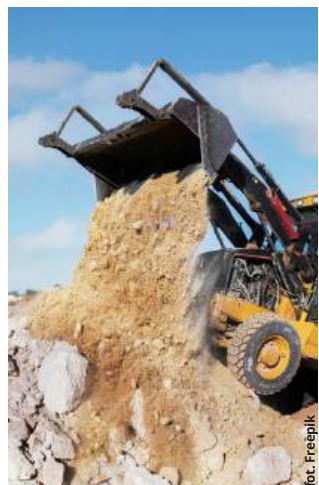
Zwiększenie wydobycia w Turce pod lupą Urzędu Gminy Dorohusk

dokumentów urzędnicy stwierdzili, że muszą one zostać uzupełnione o dodatkowe informacje. Z treści zawiadomienia wynika, że wątpliwości wzbudził fakt, że działka 375/1, a więc ta, na której prowadzone jest wydobycie, zlokalizowana jest w obszarze stanowiska archeologicznego, a także zagrożenia