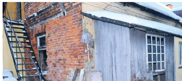
fol. KMP w Chełmie

niezbędną dokumentację. Oko-gółowe wyjaśnianie w toku licznosci i dokładne przyczyny prowadzonego postępowania pożaru, jak również przyczyna - dodaje Angelika Głęb-Kunysz . śmierci mężczyzny będą szcze-