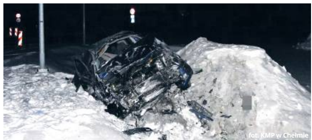
fol. KMP w Chełmie

● GM. CHEŁM Kolejny przykład skrajnej nieodpowiedzialności na drogach powiatu chełmskiego. W nocy z niedzieli na poniedziałek w miejscowości Horodyszcz do wypadku, który tylko cudem nie zakończył się tragedią. Pijany kierowca, ignorując dożywotni zakaz prowadzenia pojazdów, doprowadził do dachowania auta.