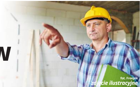
zajęcie ilustracyjne

Rodzi się jednak pytanie: czy szacunki urzędników pokryją się z wycenieniami oferentów? RC