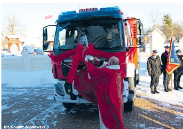
fol. Powiat Włodawski

Nowy samochód trafił do jednostki po zakończeniu procedur zakupowych i został poświęcony podczas lokalnych obchodów. Wóz będzie wykorzystywany w działaniach gaśniczych i ratownictwie technicznym, a jego parametry pozwolą na sprawniejsze prowadzenie akcji w terenie