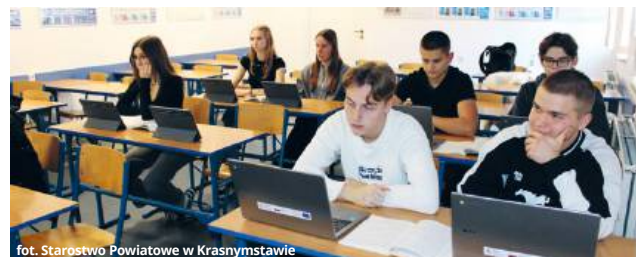
fol. Starostwo Powiatowe w Krasnymstawie

- Doposażenie placówek w sprzęt komputerowy umożliwi efektywniejsze wykorzystanie technologii cyfrowych w codziennym procesie dydak-