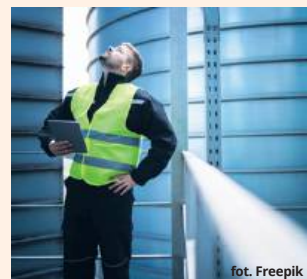
Kiedy mieszkańcy poznają decyzję władz w sprawie inwestycji spółki Power Hub?

Z treści obwieszczenia, jakie opublikowano niedawno na stronie Biuletynu Informacji Publicznej urzędu, wynika, że tym razem postanowiono przesunąć termin załatwienia sprawy ze względu na zawiadomienie Regionalnego Dyrektora Ochrony Środowiska. Organ stwierdził, że wydanie uzgodnień opóźni się, w związku z czym także gminni urzędnicy postanowili o tym, aby wyznaczyć nowy termin załatwienia