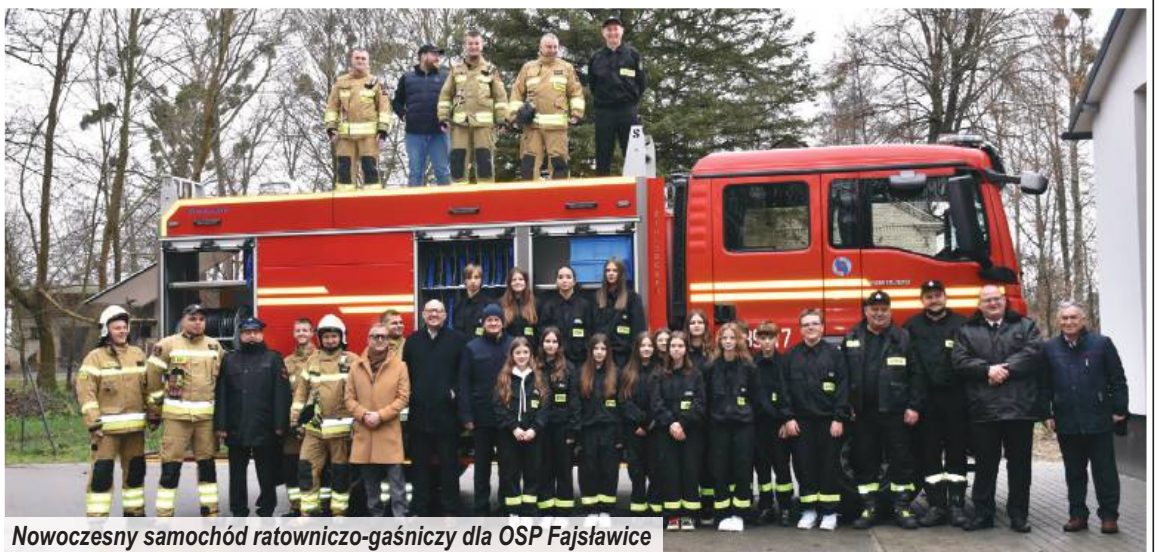
Nowoczesny samochód ratowniczo-gaśniczy dla OSP Fajstów

Rok 2025 to także konsekwentna realizacja działań proekologicznych. Usuwanie i utylizacja azbestu oraz przygotowanie do dalszych projektów w tym zakresie sprawiają, że gmina staje się coraz bezpiec-