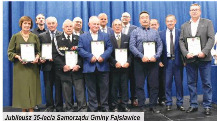
Jubileusz 35-lecia Samorządu Gminy Fajstów