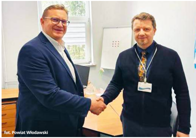
fol. Powiat Włodawski

Nowy p.o. zastępcy dyrektora ds. medycznych posiada ponad 20 lat doświadczenia zawodowego i specjalizuje się w chirurgii onkologicznej. Zawodowo związany jest z 1 Wojskowym Szpitalem Klinicznym z Polikliniką w Lublinie, jednym z największych i najbardziej wyspecjalizowanych szpitali w regionie. Jego kompetencje mają wspierać funkcjonowanie włodawskiej placówki, w szczególności w obszarze działalności oddziału chirurgii.