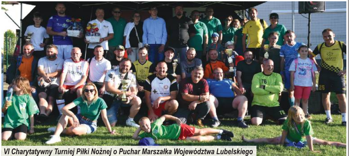
VI Charytatywny Turniej Piłki Nożnej o Puchar Marszałka Województwa Lubelskiego

Nie zabrakło również inwestycji drogowych, które w istotny sposób wpłynęły na poprawę bezpieczeństwa i komfortu poruszania się. Przebudowana droga