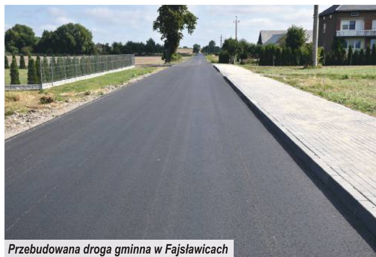
Przebudowana droga gminna w Fajstowicach