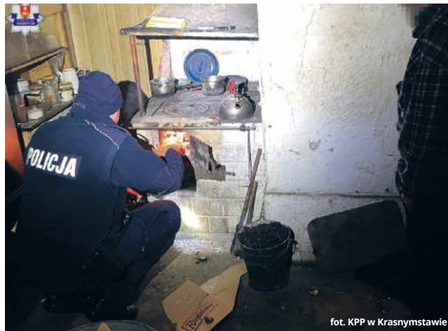
fol. KPP w Krasnymstawie

Policjanci przygotowali podpałkę i rozpalili ogień w domowym piecu. Aby zapewnić mężczyźnie ciepło na kolejne godzi-