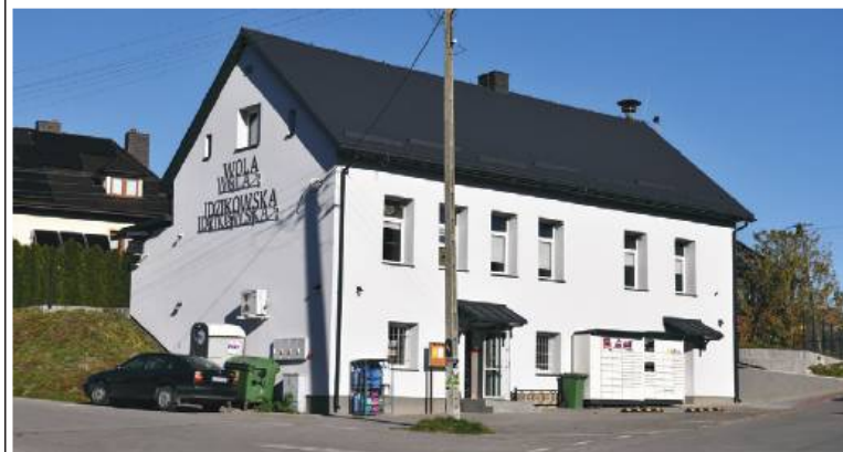
Budynek remizy OSP w Woli Idzikowskiej po termomodernizacji

Podsumowując, rok 2025 był dla Gminy Fajstów czasem intensywnej pracy, ale i widocznych efektów. Inwestycje infrastrukturalne, rozwój przestrzeni publicznej, troska o bezpieczeństwo, środowisko i dziedzictwo kulturowe, a także bogate życie społeczne i kulturalne pokazują, że gmina nieustannie się rozwija. Samorząd konsekwentnie realizuje wizję nowoczesnej, bezpiecznej i przyjaznej społeczności, tworząc solidne fundamenty pod dalsze działania i kolejne ambitne projekty.