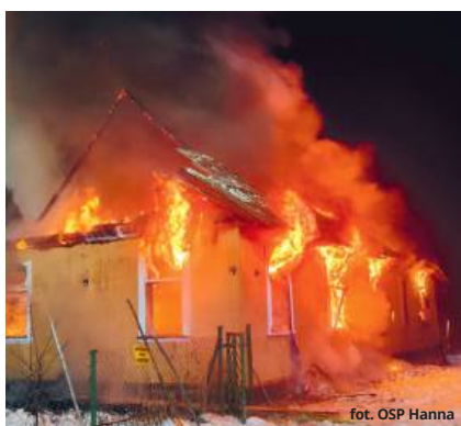
fol. OSP Hanna

Na miejscu działali zawodowi strażacy z Włodawy oraz ochotnicy z OSP Hanna, Do-