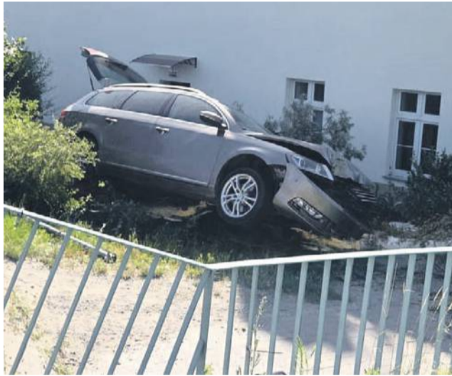
Wyglądało to groźnie

30 czerwca na ranem kierowca volkswagena passata wjeżdżając do Oławy od strony Jelcza-Laskowic nie wyrobił na zakręcie przed mostem na Odrze. Efekt? Ścięte znaki drogowe, zniszczona brzoza, a auto wylądowało na terenach zielonych przy budynku, w który - na szczęście - nie uderzył. Kierowca, któremu najwyraźniej nie się nie stało, nie wezwał na miejsce Policji, bo - jak mówił - nie ma potrzeby. Ta jednak, wezwana przez kogoś innego, zjawiała się na miejscu zdarzenia.