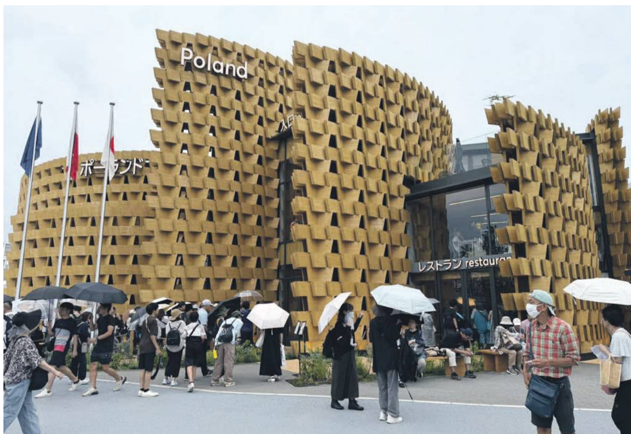
Tak prezentuje się Polski Pawilon na światowej wystawie EXPO 2025 w Osace