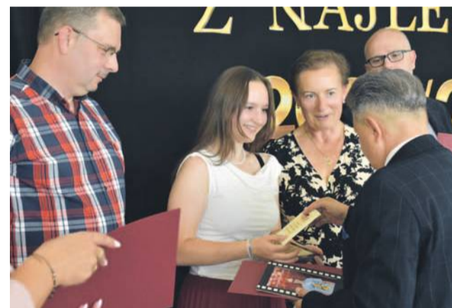
Nagrodzono najlepszych uczniów ze szkół gminy Oława

WIOLETTA KAMIŃSKA wkaminska@gazeta.olawa.pl