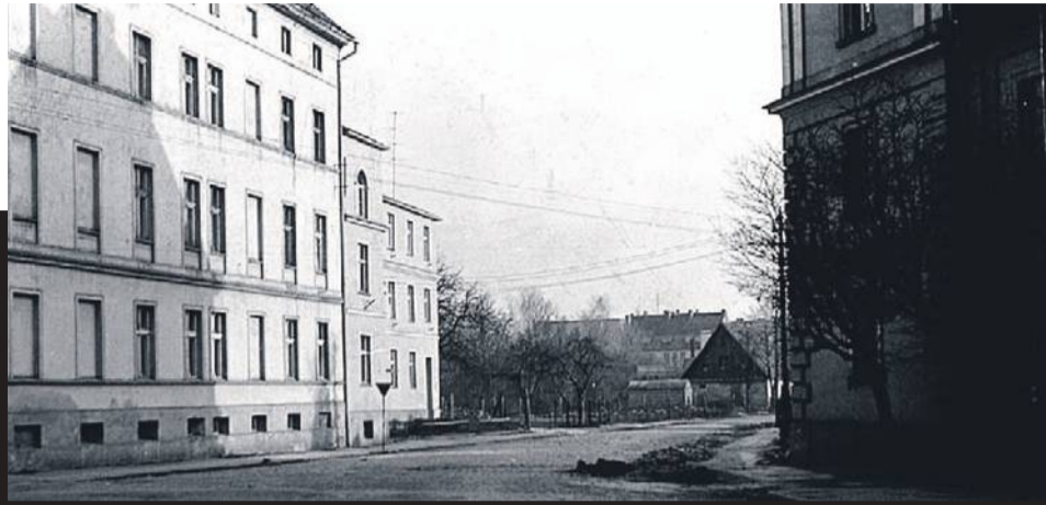
Zdjęcie nr 1 zrobiłem w 1967 roku z placu Zamkowego w kierunku ulicy Ogrodowej, która skręcała w prawo - na wprost był wtedy budynek mieszkalny i ogrody