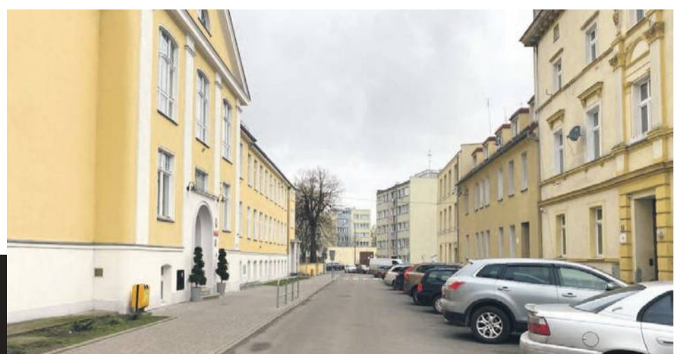
Zdjęcie nr 6 zrobiłem w 2025 roku - po prawej dwa budynki mieszkalne, następny budynek należy do szkoły nr 1 i tam odbywają się zajęcia młodszych klas. W głębi widać dwa punktowce z osiedla „pudełkowego”, jak to kiedyś na nie mówiono