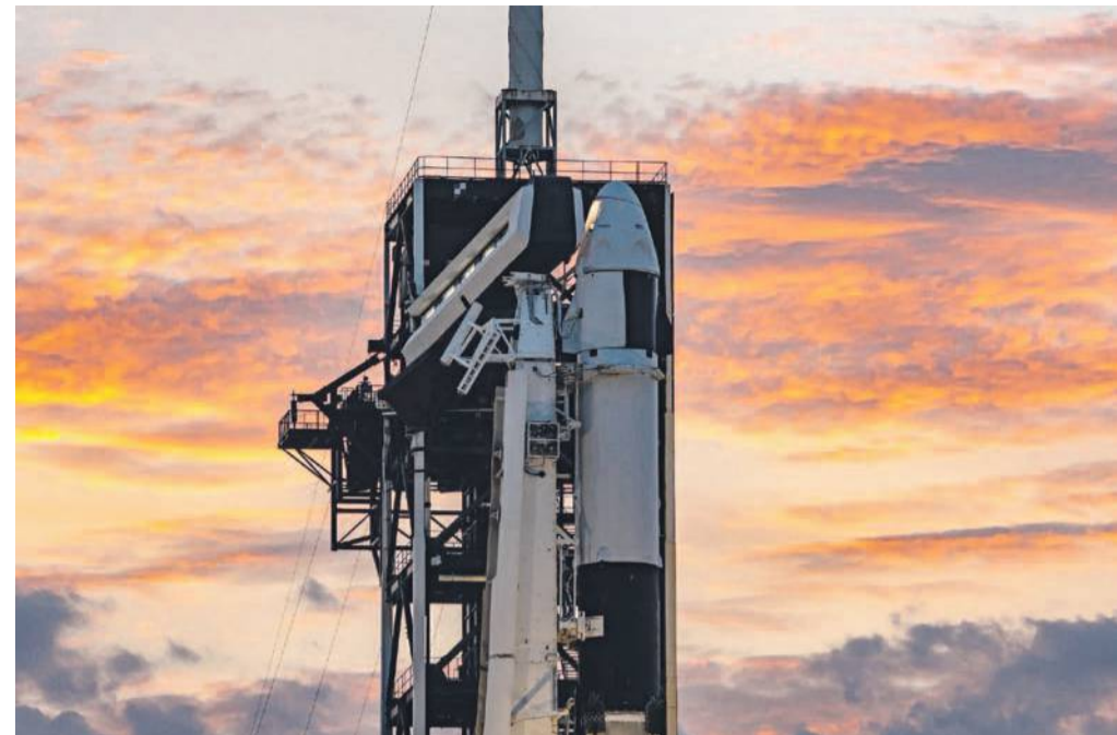
Tuż przed startem

teraz Sławosz zdobywa jeszcze wyższe szczyty.