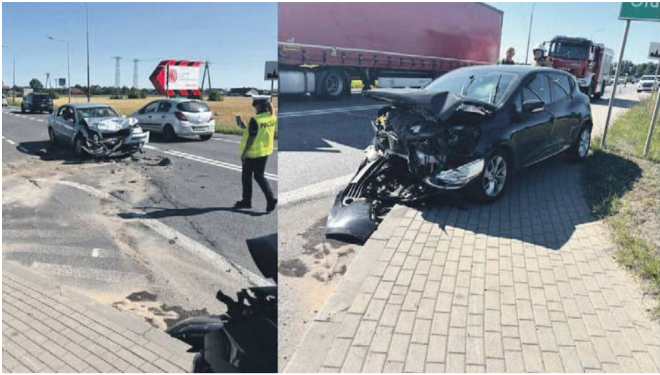
W rejonie skrzyżowania ulic Opolskiej i Polnej czołowo zderzyły się volkswagen i renault.