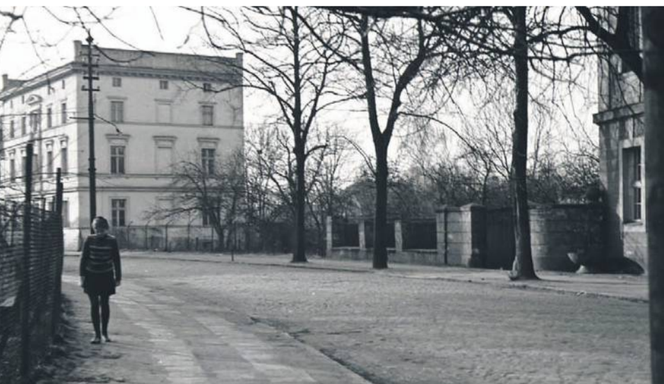
Zdjęcie nr 7 zrobiłem w 1969 - po prawej widzimy krawędź budynku, w którym obecnie jest sąd, dalej widać ogrodzenie, za którym były ogrody - w tym miejscu powstała nowa ulica dziś 11 Listopada. Po lewej mamy ogrodzenie z siatki - za nim było boisko SP nr 1, dziś jest tu parking.