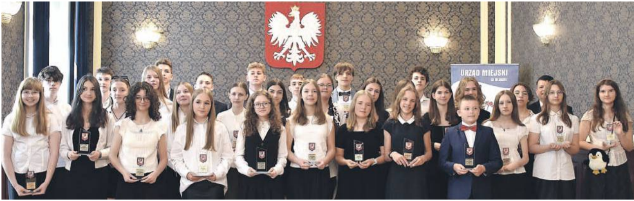
Tegorocznii laureaci Złotych Kogutów