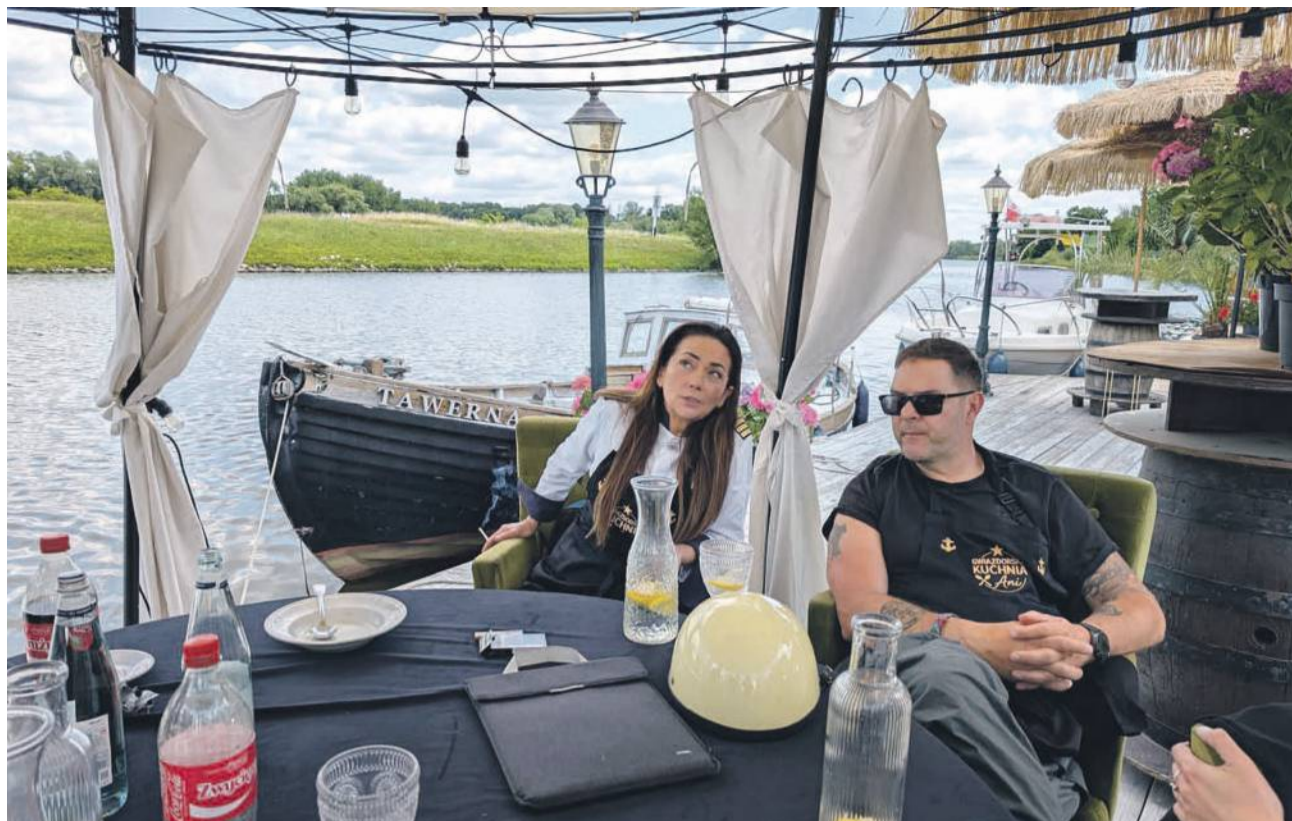
Scenografia iście wakacyjna - aż trudno uwierzyć, że to gmina Oława

- Tak, bo ja jestem z tej strefy... Mój ojciec, który był kwatermistrzem wojskowym, w komunie dbał, aby tam było zawsze dobrej jakości mięso. Zawsze przywoził do domu swoje wędliny, jeździło się do rolnika, który je produkował. Jestem więc wychowany