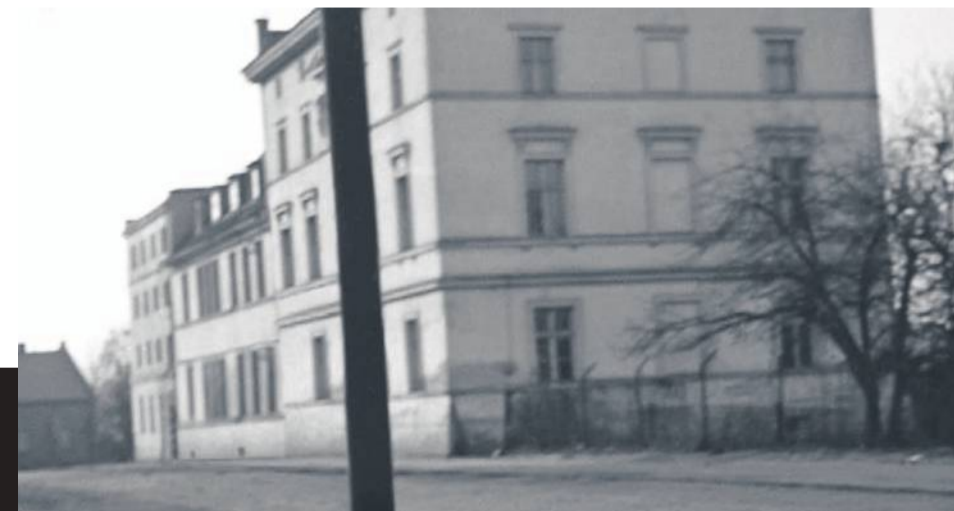
Zdjęcie 5 zrobiłem w 1968 - po prawej stronie pierwsze dwa budynki mieszkalne to dziś ulica Armii Krajowej 10 i 8. Następny budynek wtedy należał do młyna. Na wprost widzimy budynek ze zdjęcia nr 4. Po lewej jest szkoła nr 1 (niewidoczna)