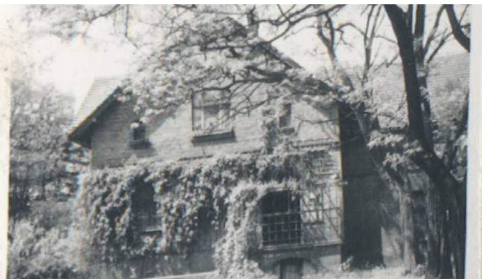
Zdjęcie nr 3 i 4 to budynki mieszkalne i gospodarcze pod adresem Ogrodowa 15 i 16 - zdjęcie z 1962 - widoczne budynki wyburzone w połowie lat sześćdziesiątych, w ich miejscu powstało osiedle „pudełkowe” (6 czteropiętrowych budynków).