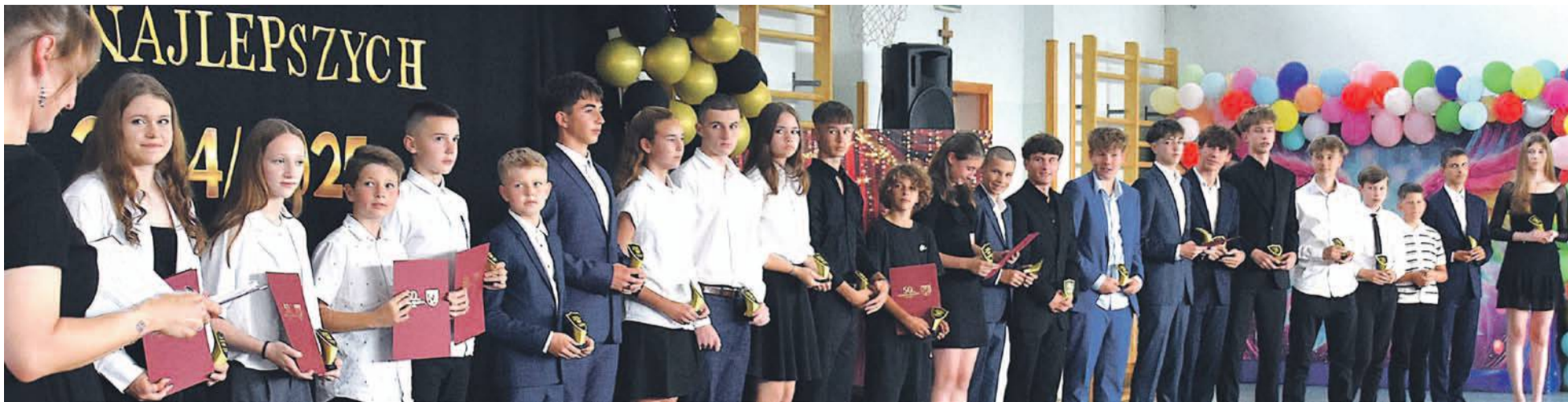
Po trzyletniej przerwie w tym roku nagrodzono także najlepszych sportowców