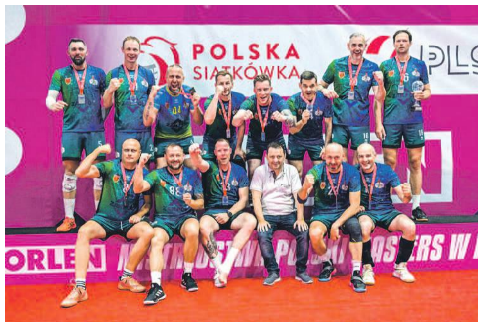
„Oławskie Koguty” z medalami na szyjach

Drugi start w ORLEN Mistrzostwach Polski Masters w Piłce Siatkowej i drugi medal - tym razem srebrny! Siatkarze „Oławskich Kogutów” znów pokazali charakter i świetną formę