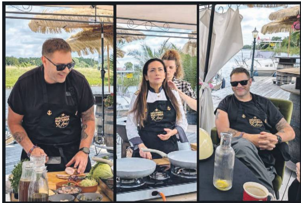
Parę kadrów z planu