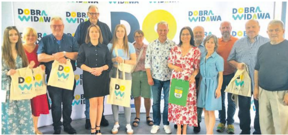
Wizyta w LGD Dobra Widawa, należała obok udziału w Biskupickim Złotym Kłosie, do największych atrakcji dla gości z Niemiec

Biskupicki Złoty Kłos przyciąga nie tylko zespoły folklorystyczne z całej Polski, ale także gości zagranicznych. Oficjalna delegacja z miasta partnerskiego Gudensberg prezentowała swój region jako niemieckie zagłębie hodowców kapusty