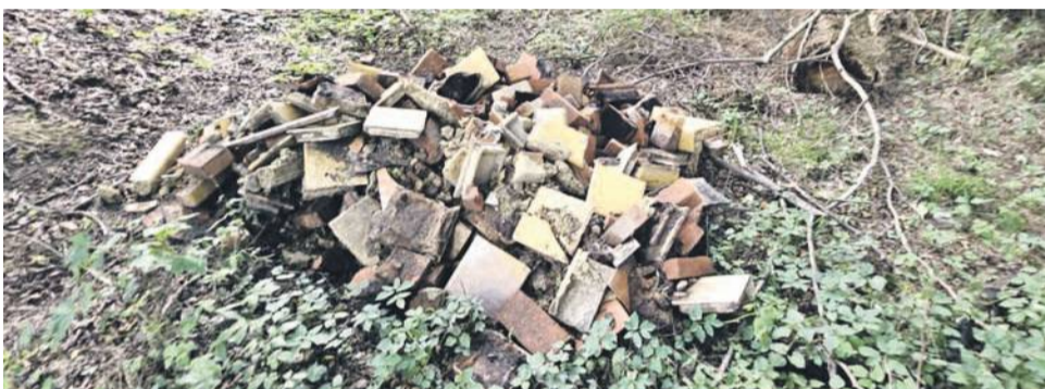
Resztki z pieca kaflowego w lesie