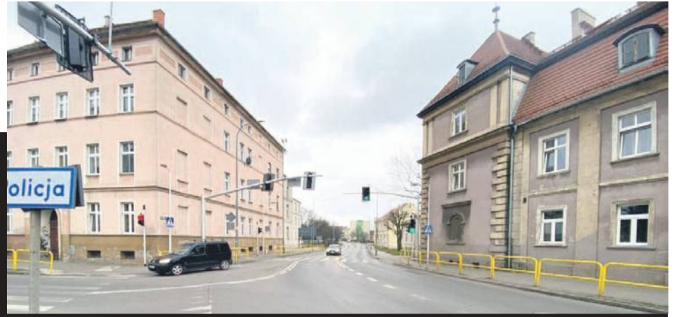
Zdjęcie nr 2 zrobiłem w 2025 z placu Zamkowego w kierunku 11 Listopada - kiedyś na początku była ulica Ogrodowa, która skręcała w prawo - dziś ten odcinek to ulica Armii Krajowej