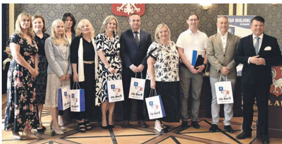
Podziękowania powędrowały też do pracowników oświaty