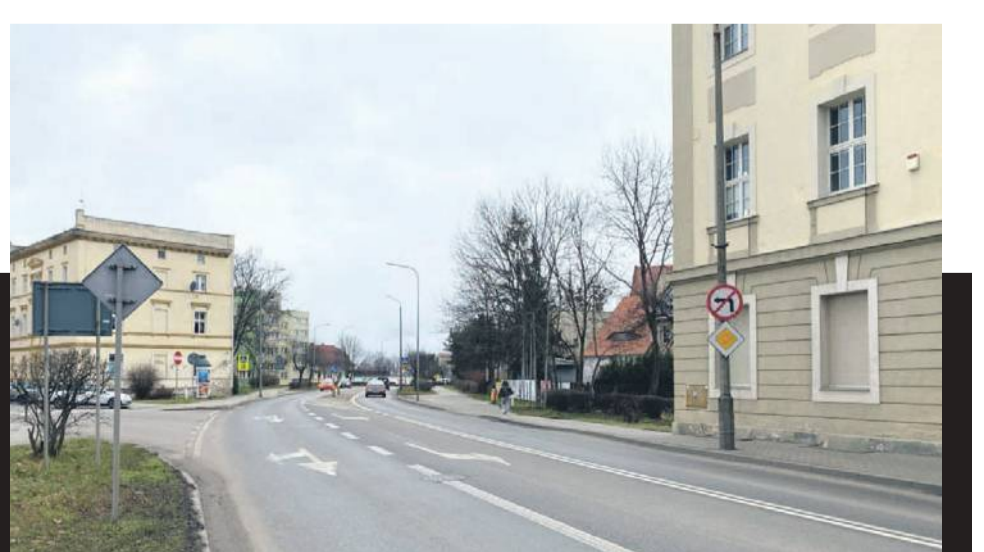
Zdjęcie nr 8 zrobiłem w 2025 roku - widzimy ulicę 11 Listopada, po prawej budynek sądu, na wprost budynek mieszkalny przy ulicy Armii Krajowej 10