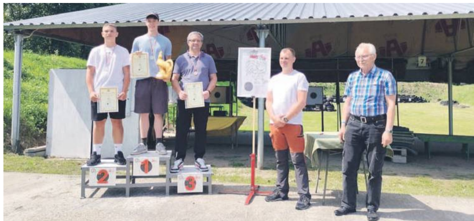
Zawody organizował Klub Strzelecki KOGUT