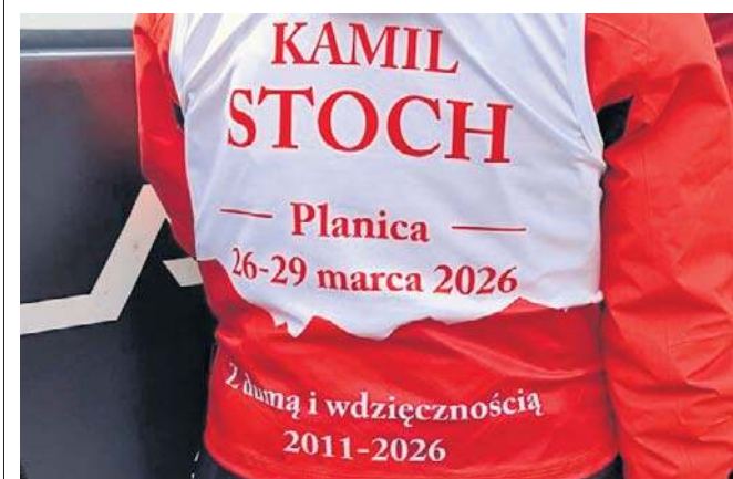
Mimo słabszej dyspozycji, nasz skoczek starał się cieszyć każdą chwilą. Był w centrum uwagi - mediów i kibiców