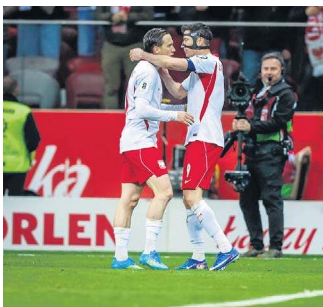
Robert Lewandowski i Piotr Zieliński w najtrudniejszym momencie zegrali tak, jak na liderów kadry przystało

Jan Bednarek zachował się niczym junior przy stracie gola, Matty Cash wchodził w mecz przez niemal godzinę, a generalnie cała jedenastka po przyzwyczajeniu - a w każdym razie zgodnym z oczekiwaniami - początkowo sprawiała wrażenie zdziwionej, że niżej notowani Albańczycy nie położyli się po kwadransie. Tylko jak już przetrwali naszą krótkotrwałą premierową nawałnicę, to za wszelką cenę starali się przejąć inicjatywę. Co oznacza, że u naszych reprezentantów zawiodł mental; Biało-Czerwoni nie byli przygotowani na taką dawkę stresu i presji,