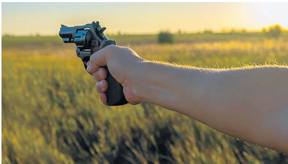
Policja szybko ustaliła, że młodzi ludzie zginęli od strzału z czeskosłowackiego pistoletu CZ, kaliber 99 mm (zdjęcie poglądowe)