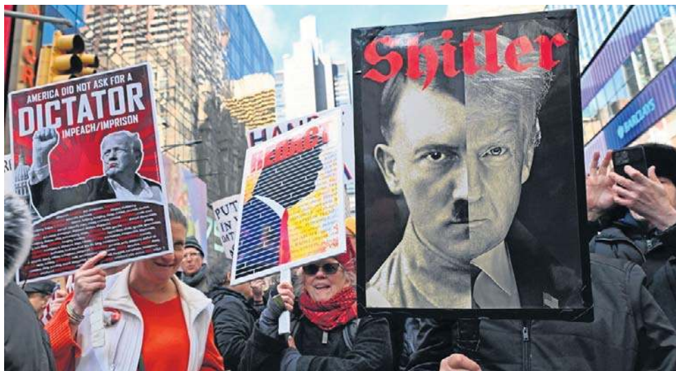
Przeciwnicy Trumpa wyszli na ulice m.in. Nowego Jorku (na zdjęciu), Chicago i Houston. Ale demonstracje odbywały się także w wielu mniejszych miejscowościach

Główna sobotnia demonstracja odbyła się w Minneapolis, miejscu kontrowersyjnej operacji służb imigracyjnych, gdzie z rąk funkcjonariuszy zginęło dwoje demonstrantów. Na scenie przed gmachem stanowego parlamentu przemawiali m.in. gubernator stanu Tim Walz, senator Bernie Sanders. Wystąpili też Bruce Springsteen, który napisał piosenkę o wydarzeniach z Minneapolis, oraz Joan Baez. - Kiedy aspirujący dyktator w Białym Domu wysłał swoich niewykształconych, agre-