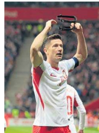
Robert Lewandowski wierzy w awans na MŚ