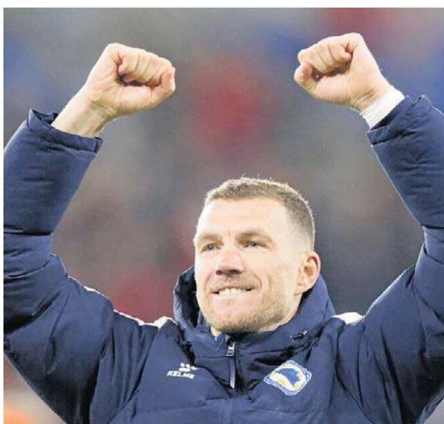
Edin Dzeko wciąż odczuwa niedosyt związany z grą w barwach narodowych. Marzy o dużym turnieju

Włochy i Bośnia Hercegowina na start w mundialu czekają od 2014 roku, Czechy dłużej, bo od 2006. Po przeciętnych eliminacjach w ich wykonaniu nowy selekcjoner, zatrudniony od grudnia Miroslav Koubek, sięgnął po Vladimira Darida, uczestnika Euro 2012, 2016, 2020, który w 2021 roku zrezygnował z gry w reprezentacji. Obecnie wystę-