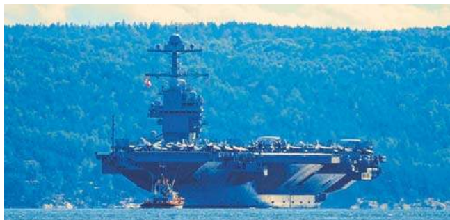
Lotniskowiec USS Gerald R. Ford to największy okręt wojenny, jaki kiedykolwiek zbudowano

Okręt znajdował się na Morzu Śródziemnym, kiedy w październiku szef Pentagonu Pete Hegseth nakazał jego przemieszczenie na Karaiby, aby wspomóc działania USA przeciwko Nicolasowi Maduro, przywódcy Wenezueli, zanim został pojmany - przypomniała chorwacka telewizja N1. Lotniskowiec został następnie skier-