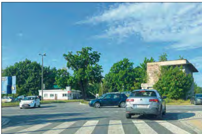
Kierowco! W tym miejscu pamiętaj o zachowaniu szczególnej ostrożności.

- Czasami nie wiadomo, czy kierowcy wyjeżdżający