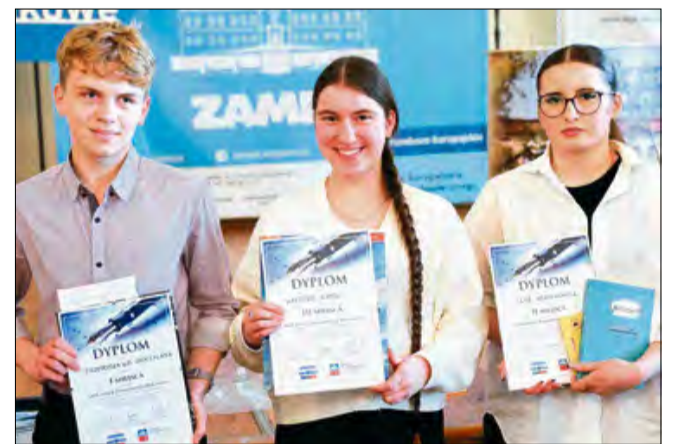
Gratulacje dla wszystkich uczestników za odwagę, zaangażowanie i świetną znajomość zasad interpunkcji i ortografii.