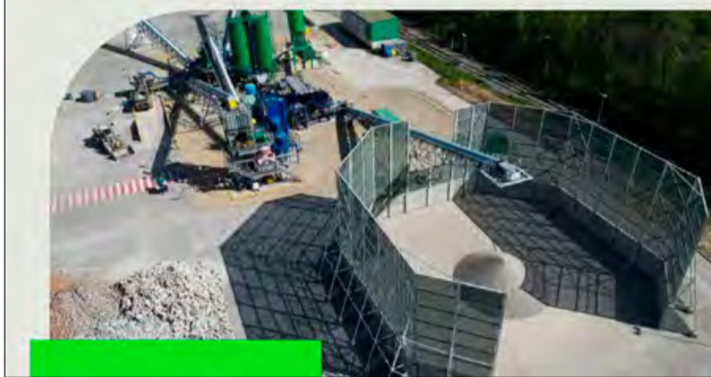
Heidelberg Materials dba o naturę każdego dnia.

Stawiamy na recykling - w ubiegłym roku jako pierwsi w Polsce uruchomiliśmy Zakład Recyklingu Betonu.