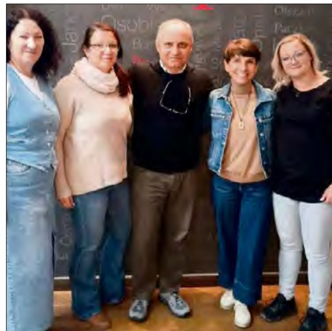
Przedstawicielki placówek oświatowych z terenu gminy Zdzieszowice wzięły udział w spotkaniu w siedzibie Euroregionu Pradziad.

Przedstawicielki placówek oświatowych z terenu gminy Zdzieszowice 18 maja wzięły udział w spotkaniu w siedzibie Euroregionu Pradziad. Wspólnie z czeskim partnerem pracowano nad nowym projektem transgranicznym.