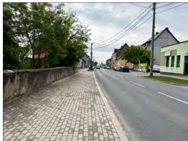
Mieszkańcy Krapkowic zwracają uwagę na brak koszy na śmieci na ul. Opolskiej.

- Pewnie, że brakuje - mówi krapkowiczanie