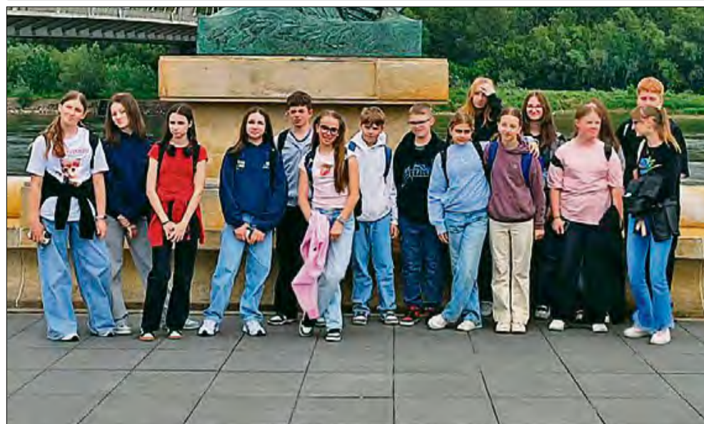
To był intensywny czas dla grupy wycieczkowej.

Uczniowie ze Szkoły Podstawowej w Strzeleczkach pojechali na wycieczkę do Warszawy. W stolicy Polski spędzili dwa dni.