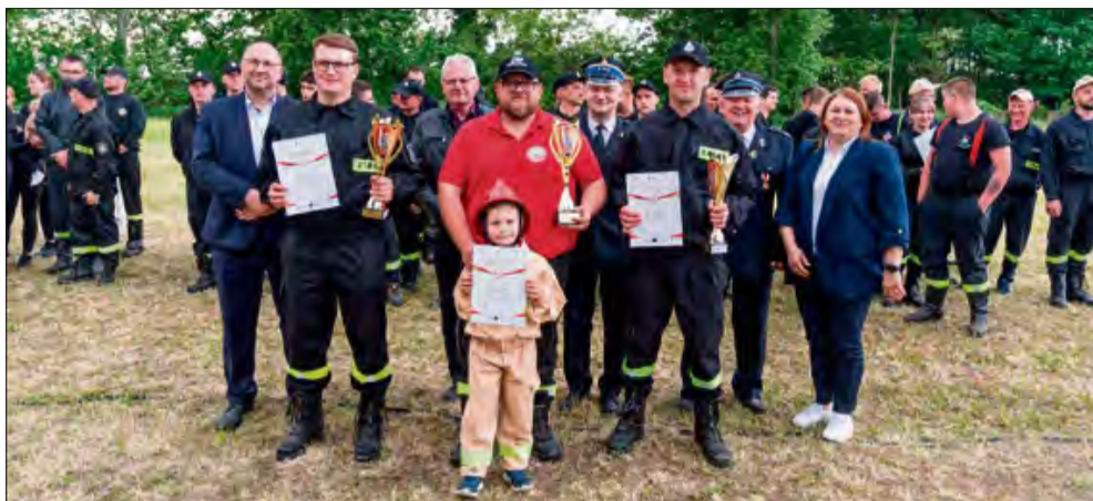
Było to święto wspólnoty strażackiej.

W sportowej rywalizacji najlepsi okazali się druhowie i druhnicy z kilku wyróżniających się jednostek. W kategorii dziecięcej zwyciężyła drużyna z OSP Stradunia, prezentując znakomitą formę i świetne zgranie. W rywalizacji młodzieżowej bezkonkurencyjna okazała się również reprezentacja OSP Stradunia, potwierdzając silne przygotowanie młodego pokolenia strażaków. Wśród senierek triumfowała