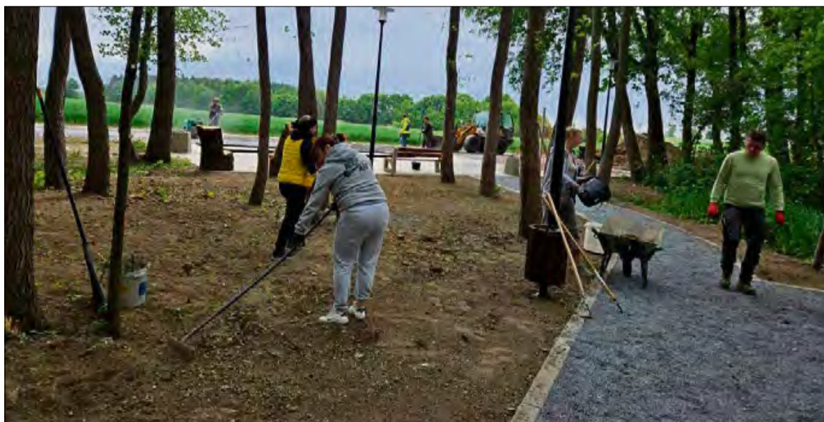
Wspólne działanie na rzecz przyrody.

Frekwencja pozytywnie zaskoczyła. Mieszkańcy – od najmłodszych po seniorów – licznie stawili się, by wspólnie zadbać o czystość i estetykę tego zielonego zakątka, chętnie wykorzystywanego do spacerów i rekreacji. W trakcie działań nie tylko