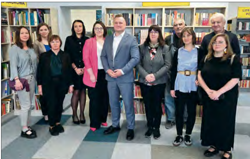
Spotkanie było okazją do wymiany doświadczeń.

Wyjątkowe spotkanie odbyło się w ubiegłym tygodniu w bibliotece w Raclawiczkach. W ramach partnerskiej współpracy bibliotek placówkę odwiedzili przedstawiciele Wojewódzkiej Biblioteki Publicznej im. E. Smółki w Opolu oraz wyjątkowi goście z Węgier.