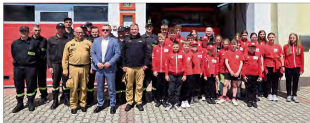
To było bardzo ważne spotkanie, które zorganizowano w remizie OSP Dobra.

We wtorek 20 maja w remizie w Dobrej odbyło się spotkanie ze strażakami z Państwowej Straży Pożarnej różnych szczebli. Była to doskonała okazja do wymiany doświadczeń.