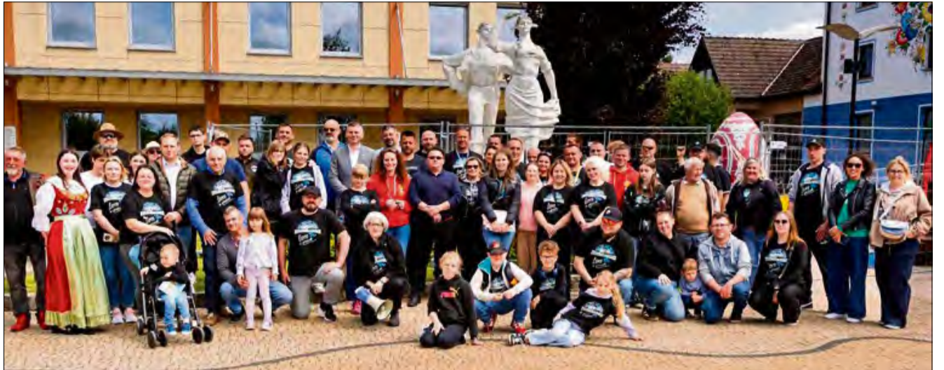
Mosty potrafią łączyć nie tylko miejsca ale i ludzi.

Goście z północy Polski przyjechali, by nie tylko podziwiać piękno regionu, ale także nawiązać do ubiegłorocznych wydarzeń. Po wrześniowej powodzi, która dotknęła powiat krapkowicki, samorząd powiatu bytowskiego zdecydował się