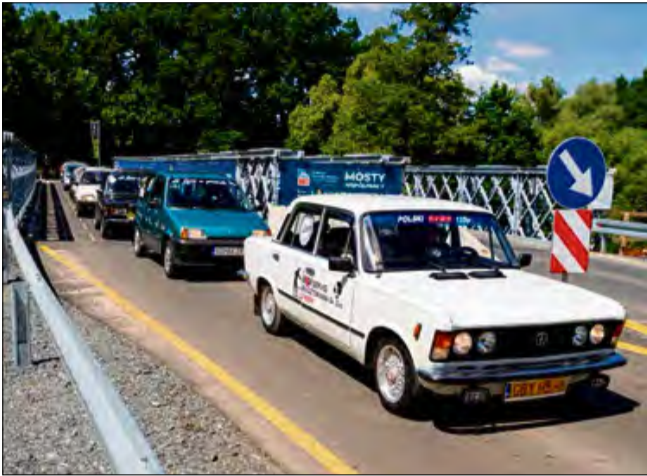
20 zabytkowych pojazdów przejechało przez powiat.

Przez powiat krapkowicki przejechała wyjątkowa kolumna ponad 20 zabytkowych samochodów, prowadzona przez pasjonatów z Kaszub zrzeszonych w grupie Leno w Przódk. To nie była zwykła wycieczka - to była podróż z misją i głębokim przesłaniem.