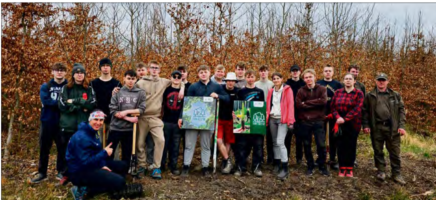
Grupa uczniów z krapkowickiej szkoły posadziła prawie 2600 sosen.