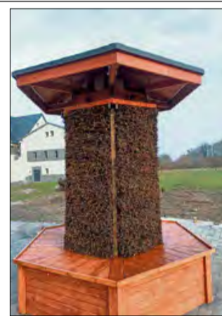
Oficjalne otwarcie tężni, już 30 maja.

Konstrukcja ma średnicę podstawy wynoszącą 2,5 metra, trzpień o zmiennej średnicy od 1,10 do 1,50 metra oraz wysokość od 2,5 do 3 metrów. Całość osadzono na solidnej płycie fundamentowej o średnicy 2,60 metra i grubości 20 centymetrów. Obiekt już