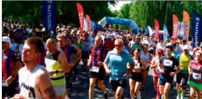
Niektórzy zawodnicy biorący udział w tegorocznym biegu głównym w ramach 41. Krapkowickiego Biegu Ulicznego z wielkim zdziwieniem wracali do domów bez nagród rzeczowych.

Okazało się, że organizatorzy zmienili dotychczasową formułę przyznawania nagród rzeczowych w 41. KBU, o czym jasno nie poinformowali w regulaminie biegu głównego. Dlatego też, 6 maja, prze-