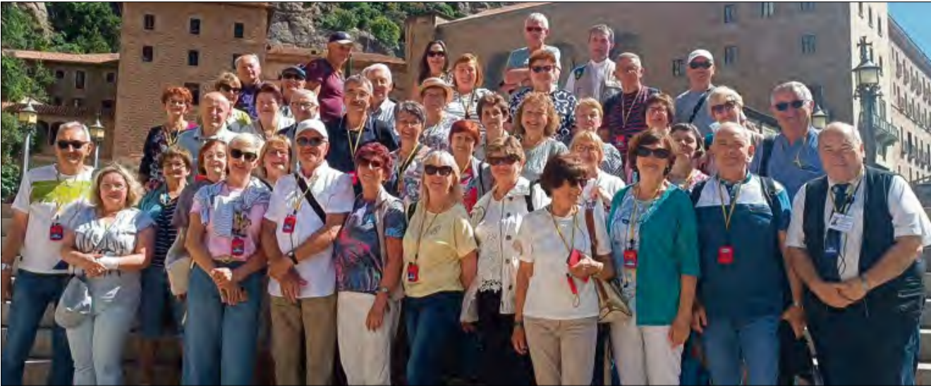
Wspólne zdjęcie uczestników wycieczki.

Jak co roku, Parafia pw. św. Anny i św. Joachima z Gogolina - Kartubca, zaprosiła w dniach 17 - 24 maja wielu chętnych, na Parafialną Pielgrzymkę, tym razem do Hiszpanii. Prócz parafian z Kartubca, wzięły w niej udział osoby z sąsiednich parafii, tj. z Malni, Januszkowic, Rozwadzy, Gogolina, Żywocic, Otmętu, Kędzierzyna i innych.