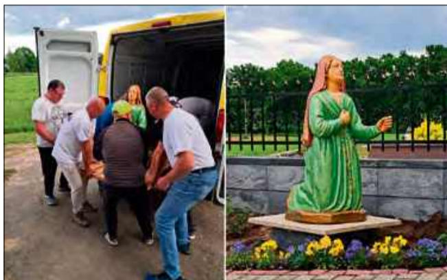
Odnowiona figura św. Bernadety wróciła na cmentarz w Pietnej.

Po długiej nieobecności na cmentarz w Pietnej powróciła figura św. Bernadety. Dzięki zaangażowaniu jednego z parafian, figura która w czasie pamiętnego huraganu w sierpniu 2023 roku uległa poważnemu uszkodzeniu, odzyskała dawny blask i świetność.