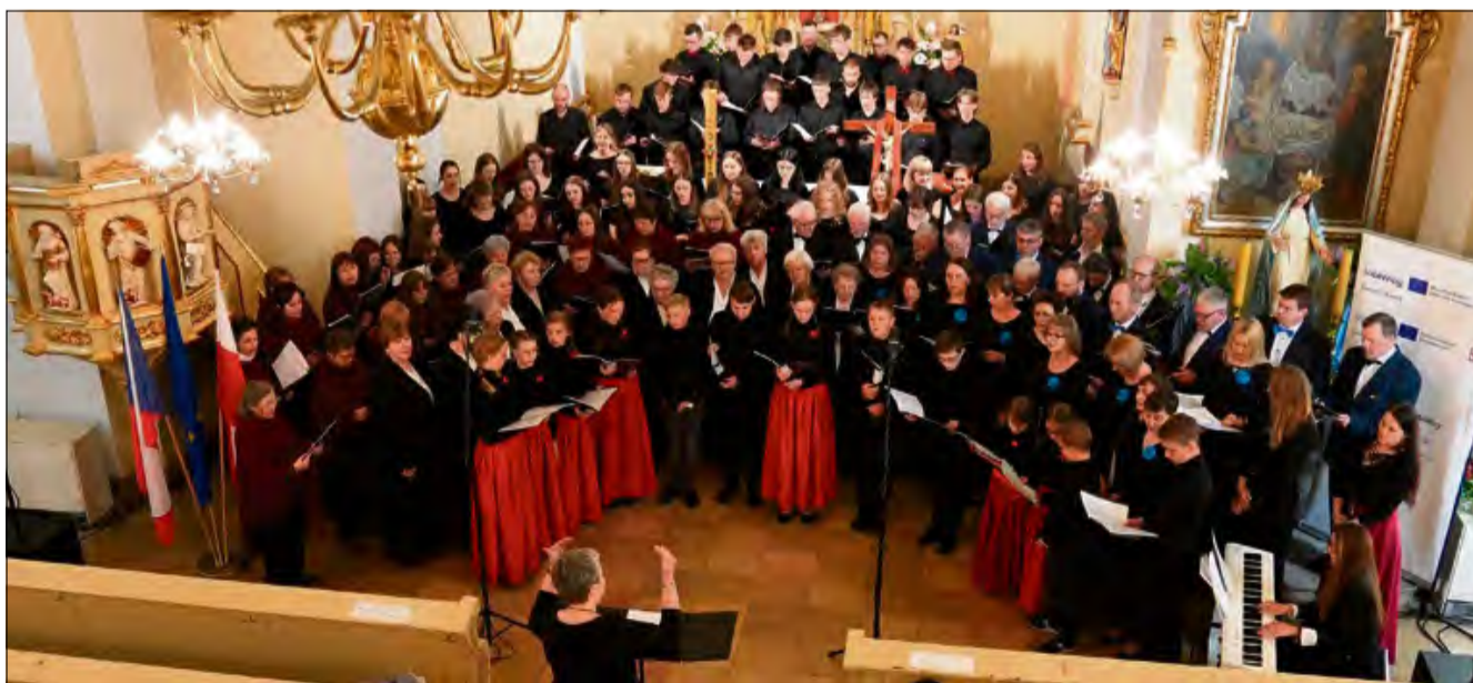
Chóry z Polski i Czech podczas wspólnego wykonania „Czarnej Madonny” w Brożcu.

W Brożcu rozbrzmiały pieśni, które od wieków poruszają serca. Koncert Pieśni Maryjnej w kościele pw. Wszystkich Świętych w Brożcu zgromadził chóry z Polski i Czech, pokazując, że muzyka nie potrzebuje tłumacza. Były owacje, wspólny finał i śpiew, który wybrzmiewał długo po ostatnim akordzie.