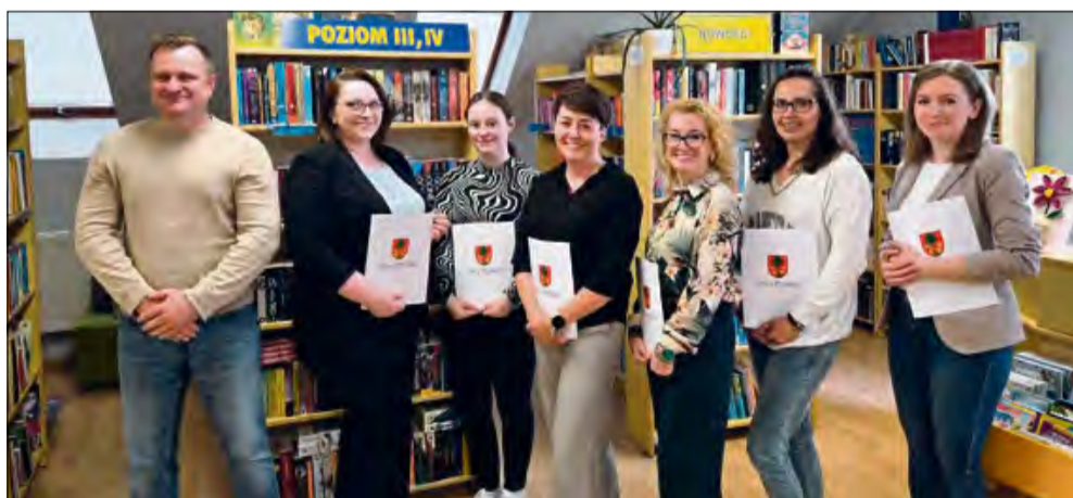
Burmistrz osobiście podziękował pracownikom Gminnej Biblioteki Publicznej w Strzeleczkach.

Pracownicy Gminnej Biblioteki Publicznej w Strzeleczkach zostali docenieni przez lokalne władze samorządowe. Wszystko z okazji mionego, Ogólnopolskiego Tygodnia Bibliotek.