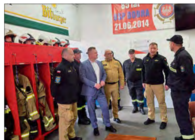
Ważnym tematem spotkania było szeroko rozumiane bezpieczeństwo.

Podczas wizyty wybrzmiały liczne gratulacje dla chłopców z Młodzieżowej Drużyny Pożarniczej z Dobrej, która wywalczyła 1. miejsce w Wojewódzkich Zawodach Sportowo-Pożarniczych jednostek OSP i MDP. To piękny sukces i powód do dumy dla całej lokalnej społeczności. Słowa uznania wybrzmiały również pod adresem dziewczęcej MDP, która również zna-