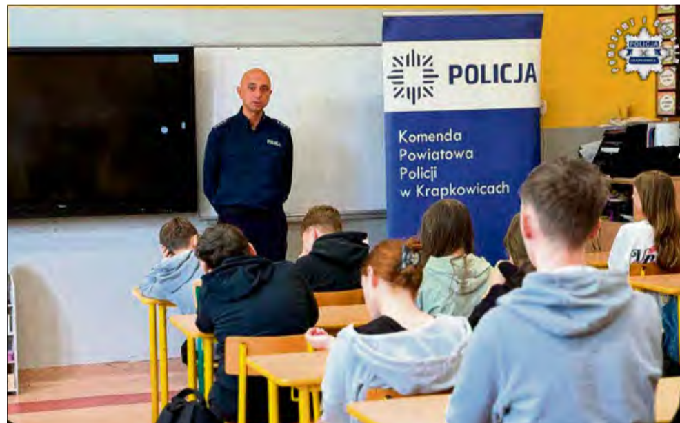
Podczas spotkania z uczniami policjanci z Krapkowic poruszyli tematy związane z przeciwdziałaniem agresywnym zachowaniom w szkołach.

Bezpieczeństwo młodzieży i konsekwencje jakie niesie dla nieletnich łamanie prawa, były głównym tematem spotkania w Szkole Podstawowej nr 2 w Zdzieszowicach. Policjanci omówili zagrożenia, na które szczególnie narażone są osoby młode. To kolejne spotkanie, na którym szeroko omówiona została profilaktyka.