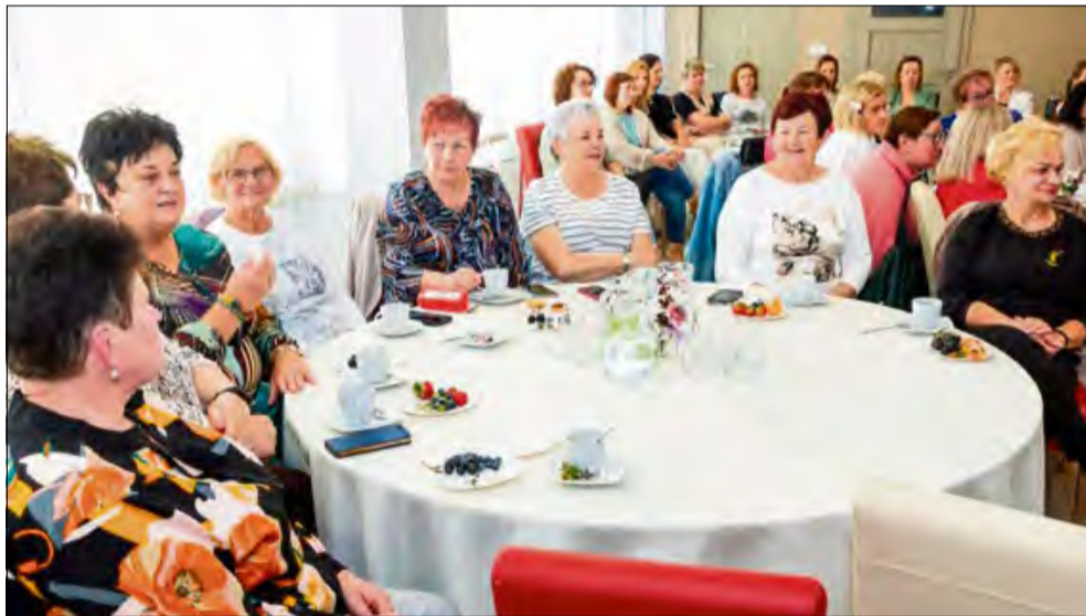
„Siła Kobiet” to nie tylko wydarzenia – to miejsce gdzie nie ma tematów tabu.

Czasem szukamy nieprawdopodobnych opowieści w książkach, filmach czy serialach – tymczasem te najbardziej poruszające pisze życie, tuż obok nas, w codziennych historiach.