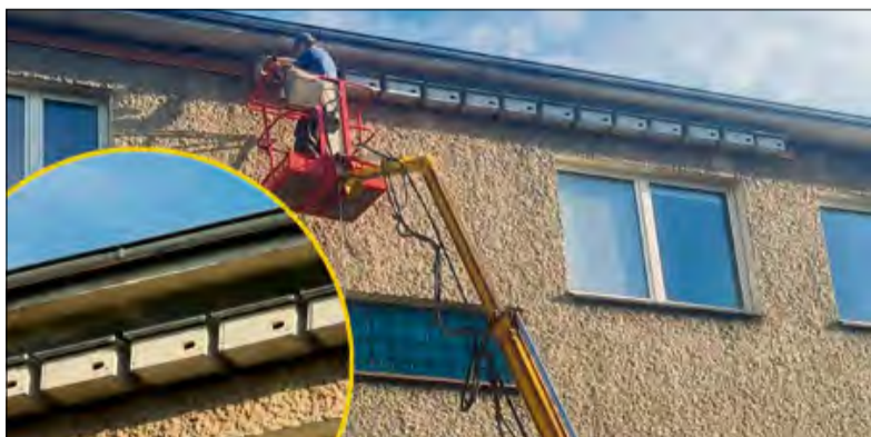
Mieszkańcy Zdzeszowic będą mogli obserwować nowych „lokatorów” ośrodka zdrowia i cieszyć się ich obecnością.

P o kilkunastu latach starań na ścianie ośrodka zdrowia w Zdzeszowicach zawisły specjalne budki lęgowe dla