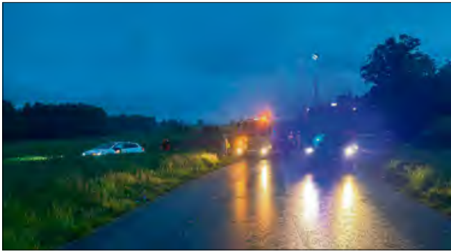
Toyota skończyła jazdę na polu.

Do niebezpiecznej kolizji z udziałem dwóch samochodów osobowych doszło w Walcach. Zderzenie było na tyle mocne, że jeden z uszkodzonych pojazdów sam wezwał pomoc.