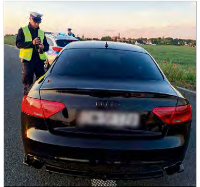
Policjanci ujawnili 70 wykroczeń, które w blisko 60 przypadkach zakończyły się mandatami karnymi.

W sobotę 24 maja w Opolu odbył się spot motoryzacyjny, gromadzący wielbicieli sportowych samochodów. Niestety, część z jego uczestników zlekceważyła przepisy ruchu drogowego. W działaniach policjantów z wydziału ruchu drogowego komendy miejskiej w Opolu uczestniczyli również policjanci ruchu drogowego z jednostki w Krapkowicach. Funkcjonariusze skontrolowali trzeźwość ponad 230 kierujących. Policjanci ujawnili 70 wykroczeń, które w blisko 60 przypadkach zakończyły się mandatami karnymi. Policjanci zatrzymali również 10 dowodów rejestracyjnych, w tym za niewłaściwy stan techniczny, niewystarczającą przepuszczalność światła przez bocz-