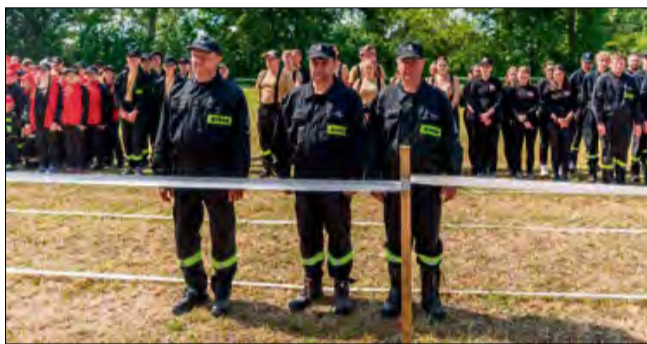
W zawodach uczestniczyło 37 drużyn.

Zawody były nie tylko emocjonującą rywalizacją, ale także świętem wspólnoty strażackiej – od najmłodszych po weteranów, pokazując, jak silne i żywe są więzi między jednostkami. Wydarzenie zgromadziło tłumy kibiców, rodziny za-