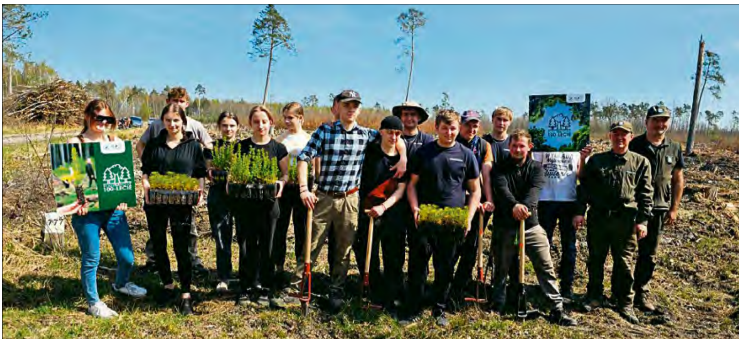
W ramach Międzynarodowego Dnia Lasów, czwarte klasy Zespołu Szkół Zawodowych im. Piastów Opolskich w Krapkowicach sadziły „swój” las.