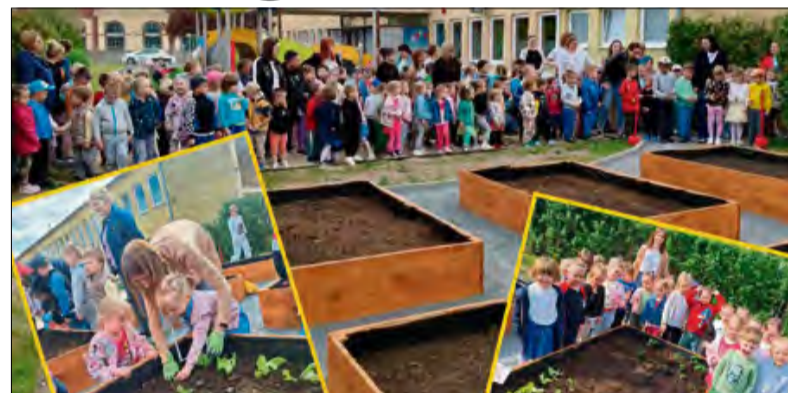
Przedszkolne ogródki powstały m.in. dzięki zaangażowaniu rady rodziców.

W Przedszkolu Publicznym nr 2 z Oddziałami Integracyjnymi w Krapkowicach odbyła się niezwykle uroczystość – oficjalne otwarcie nowych ogródków przedszkolnych. To wyjątkowe wydarzenie zgromadziło wszystkie grupy przedszkolne, a symbolicznym przecięciem wstęgi przez dyrektora placówki oraz małych reprezentantów każdej grupy rozpoczął się nowy, ekologiczny rozdział w życiu przedszkola.