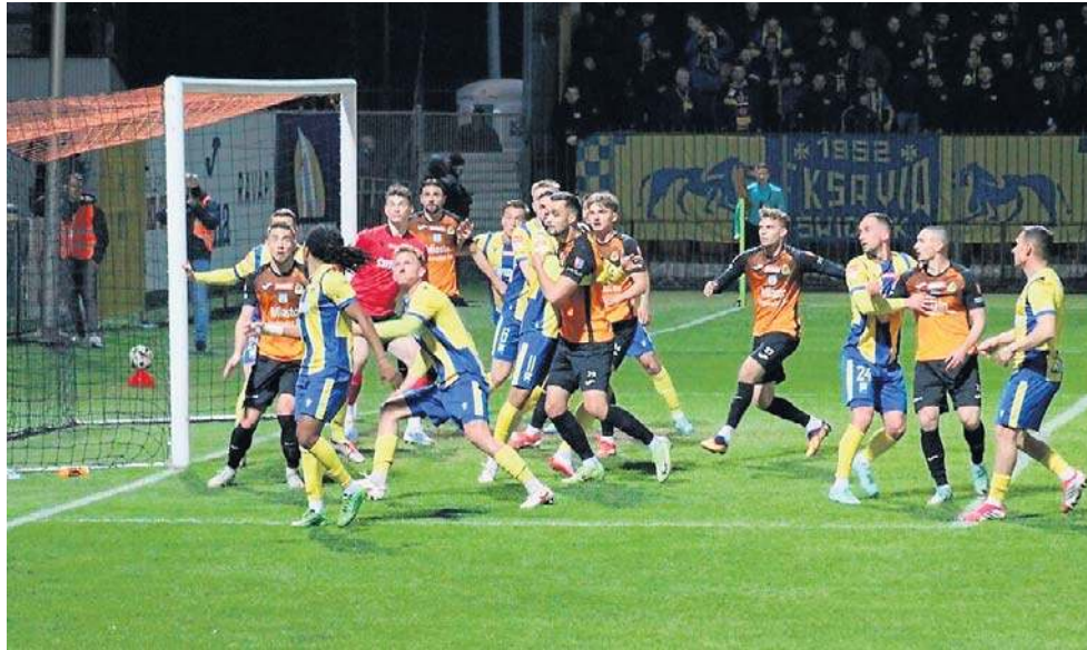
KSZO 1929 Ostrowiec przegrał u siebie z Avią Świdnik i stracił fotel lidera