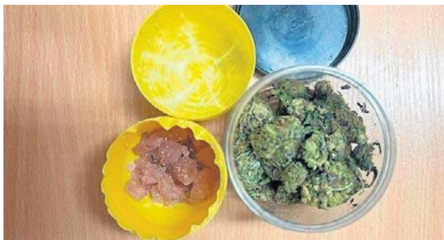
Młody człowiek z Ostrowca Świętokrzyskiego jest podejrzany o posiadanie znacznej ilości narkotyków

Z posiadanie znacznej ilości narkotyków grozi kara do 10 lat pozbawienia wolności.