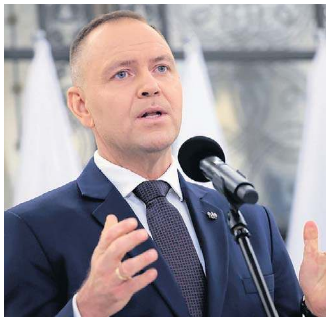
Prezydent Karol Nawrocki spotka się w Budapeszcie z premierem Victorem Orbanem

Portal zwracał uwagę, że moment wizyty na Węgrzech jest niefortunny dla Nawrockiego. 23 marca w Budapeszcie odbywać się będzie „Wielkie Zgromadzenie” prawicowego