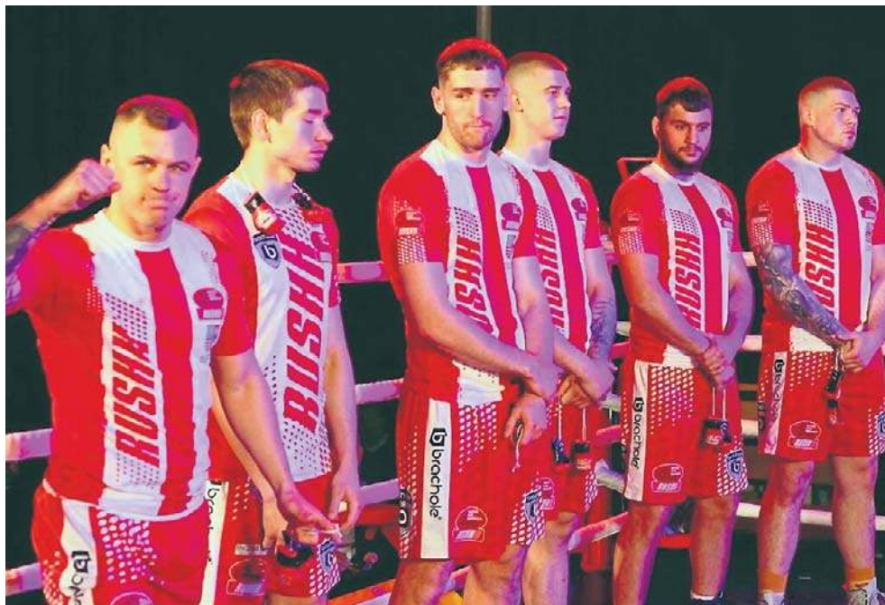
Rushh Kielce wygrał z Potężnie Ciechocinek, ale mecz był niezwykle zacięty

W walce poprzedzającej - po której goście z Ciechocinka wyrównali na 8:8 - Mateusz Be-