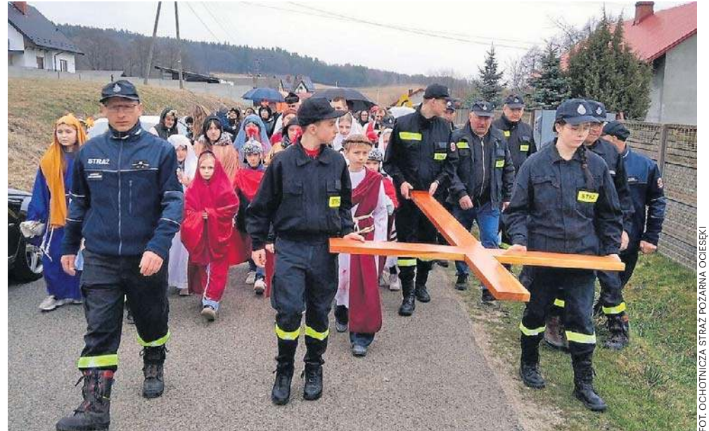
Kilkaset osób wzięło udział w III Drodze Krzyżowej na Górę Zamczysko. To kontynuacja przedwojennej tradycji, która miała miejsce w tej parafii

Oprócz strażaków w tej pięknej, wzruszającej liturgii