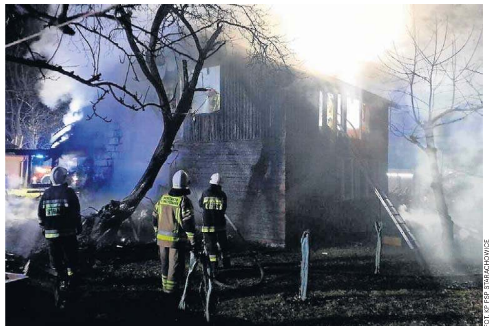
Przyczyną pożaru było przypuszczalnie zwarcie w instalacji elektrycznej

Tuż po godzinie 1 strażacy dostali sygnał, że pali się drewniany dom. - Małżeństwo około 70-ki ewakuowało się z budynku jeszcze przed naszym dotarciem. Z ogniem walczyło osiem zastępów, łącznie 33 ratowników. Przyczyną wybuchu pożaru było przypuszczalnie zwarcie w instalacji elektrycznej - opowiadał młodszy brygadier Konrad Dąbrowski, oficer prasowy Komendy Powiatowej Państwowej Straży Pożarnej w Starachowicach. Pogorzelnicy znaleźli schronienie u rodziny.