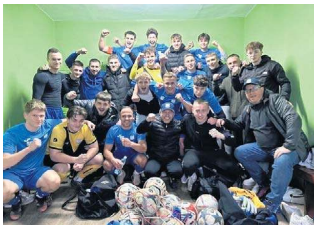
Piłkarze Kamiennej Brody pokonali w wyjazdowym meczu Partyzant Wodzisław

Partyzant Radoszyce tak podsumował mecz w mediach społecznościowych: - Remisujemy z wiceliderem ligi. Świetnie zaczęliśmy spotkanie - w niespełna 30 minut wychodzimy na dwubramkowe prowadzenie. W drugiej połowie rywale odpowiadają dwoma trafie-