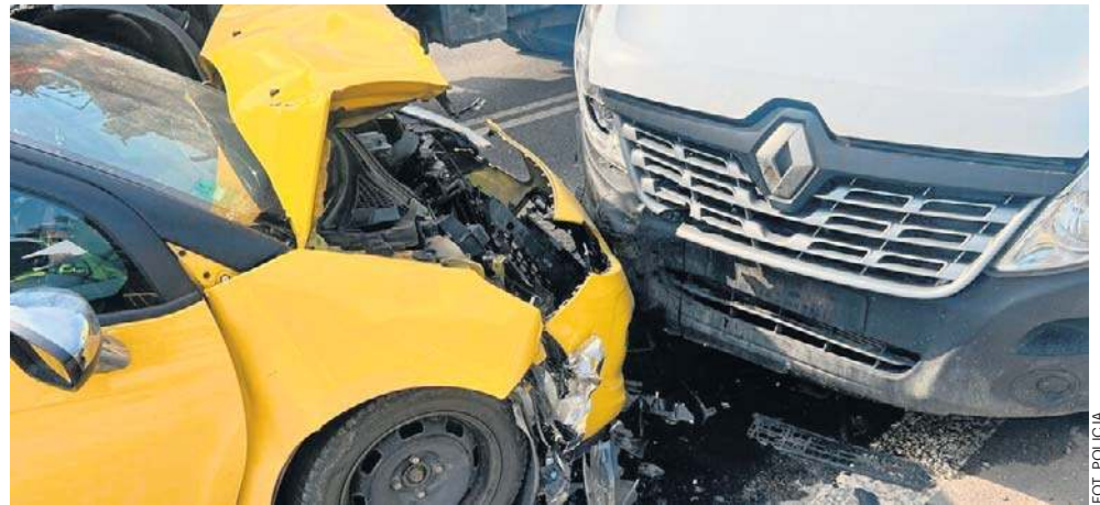
Do wypadku doszło na remontowanym odcinku trasy w podkieleckim Sukowie

- Ze wstępnych ustaleń policjantów pracujących na miejscu zdarzenia wynikało, że kierowca ciężarowego Iveco dojeżdżając do zwężenia drogi zatrzymał się przed słupkiem. Chciał przepuścić jadącego z przeciwka osobowego Citroena. Za ciężarówką jechało dostawcze Renault. Jego 49-letni kierowca zdecydował się ominąć ciężarówkę i zderzył