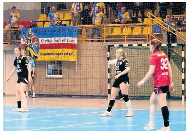
Szcypiornistki Suzuki Korony Handball Kielce walczyły dzielnie, ale ostatecznie przegrały z liderkami tabeli

„Koroneczki” napędzone ostatnimi zwycięstwami starały się mocno wejść w mecz, ale raziły nieskutecznością. Rywalce również nie potrafiły przebić się przez mocną obronę Kielczanek i na pierwszego gola trzeba było czekać aż do czwartej minuty. W dalszej części pierwszej połowy oba zespoły nadal grały dobrze