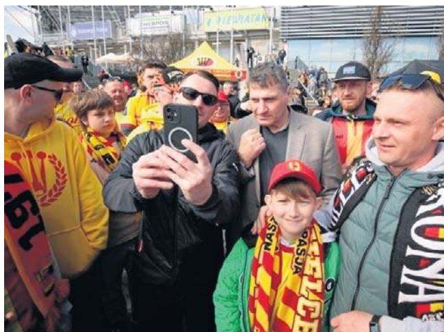
Andrzej Gołota był oblegany przez kibiców na niedzielnym meczu Korona Kielce - Arka Gdynia