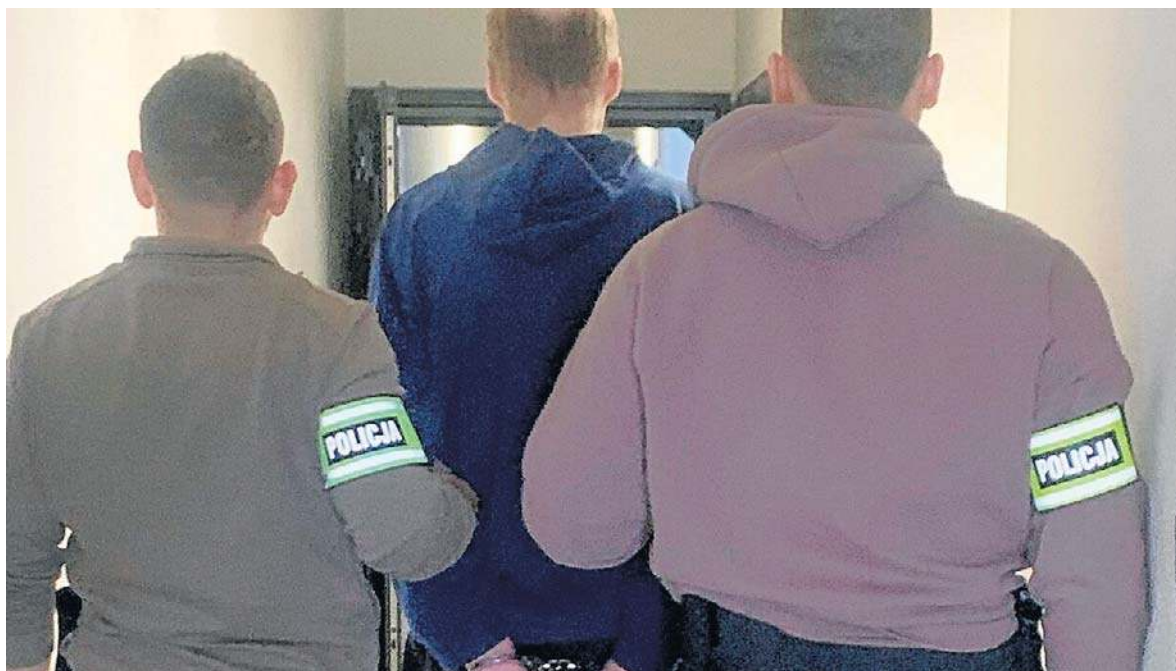
Decyzją sądu 32-latek został tymczasowo aresztowany na trzy miesiące

- Oszust straszył, że ktoś szykuje się, by okraść mieszkanie kielczanina. Chciał, by mężczyzna spakował oszczędności do reklamówki i wyrzucił ją przez okno. Senior przejrzał oszustów i zadrwił sobie z nich. Wyrzucił za okno torbę, do której włożył cztery niewielkie książki. Torba zniknęła. Z naszych ustaleń wynika, że zabrał ją 32-latek - mówiła podkomisarz Małgorzata Perkowska-Kiepas.