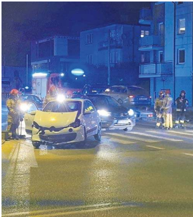
Nikomu nic się nie stało, jednak rozbite samochody częściowo zablokowały drogę na skrzyżowaniu

nault, chcąc skręcić w lewo, nie ustąpiła pierwszeństwa 19-latkowi prowadzącemu Audi - tłumaczył aspirant sztabowy Artur Majchrzak z zespołu prasowego Komendy Wojewódzkiej Policji w Kielcach. Nikomu nic się nie stało, jednak rozbite samochody częściowo zablokowały drogę. Prócz policjantów na miejscu działali strażacy. Zająli się neutralizacją płynów, które wyciekły na drogę.