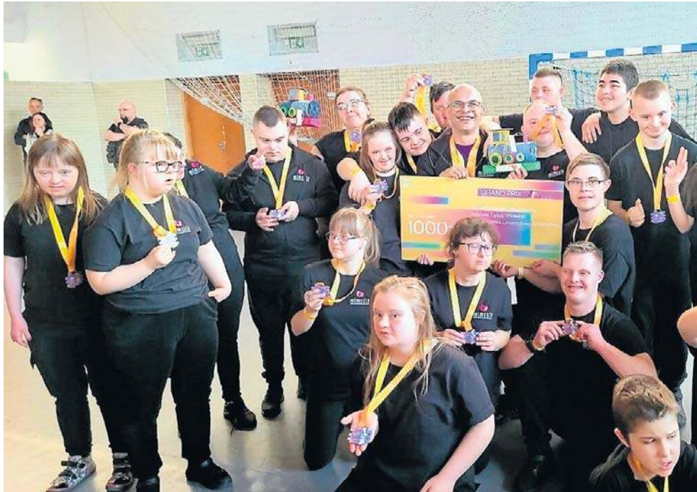
Grand Prix zdobyła DOWN&UP działająca przy Fundacji Scena Mimesis w Kielcach

Na prowadzone przez niego zajęcia uczęszcza obecnie około 40 osób. Są to osoby z niepełnosprawnością intelektualną, dla których taniec staje się nie tylko formą ekspresji artystycznej, ale także ważnym elemen-