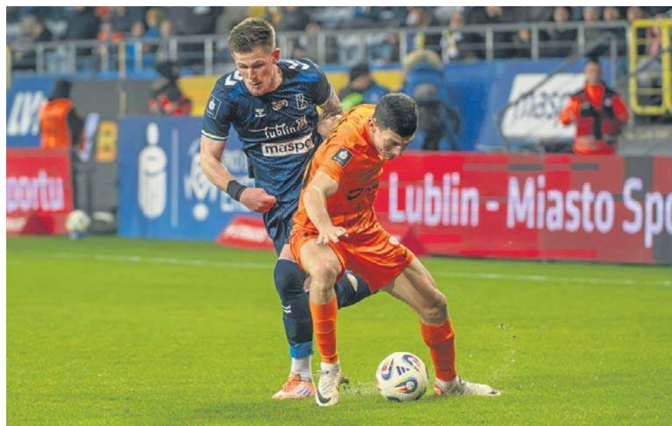
Kibice oklaskiwali zespół Motoru po wygranej nad liderującym dotąd Zagłębiem Lubin