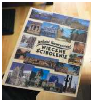
Książka opublikowana przez Wydawnictwo TiO. Do nabycia w księgarni „U Leszka” - Legionowo, Stefana Batorego 10

Potajemne obżeranie się, jakie oglądamy w polskim filmie, jest zabawne i sympatyczne, jako że chodzi tu o zaspokojenie głodu, zdarza się jednak folgowanie łakomstwu i wówczas historia