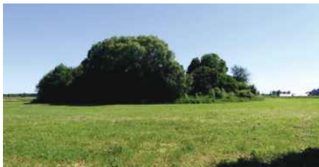
Dawny cmentarz w krajobrazie mazowieckich pól i widoczne nadal fragmenty monumentalnego grobowca (Pokrzywnica Wielka)