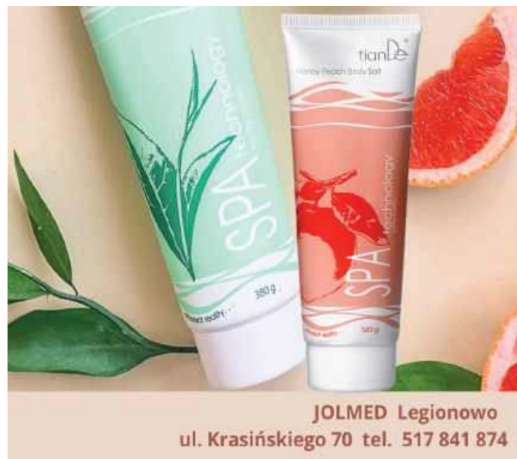
JOLMED Legionowo ul. Krasińskiego 70 tel. 517 841 874

1. Sól „Grejpfрут” pomoże utrzymać figurę w świetnej formie. Zapach grejpfruta aktywizuje proces odchudzania – do takiego wniosku doszli japońscy kosmetolodzy. Stwierdzili oni bezpośredni związek między zapachami