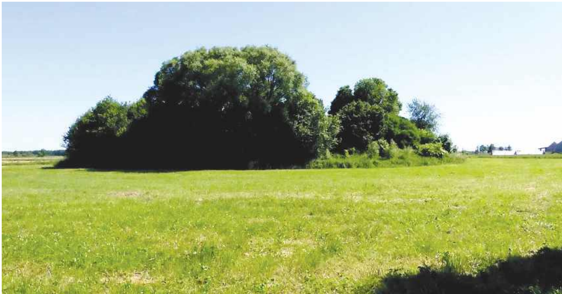
Dawny cmentarz w krajobrazie mazowieckich pól i widoczne nadal fragmenty monumentalnego grobowca (Pokrzywnica Wielka)