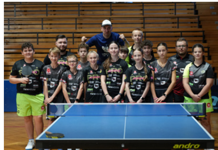
Ogłoszenie - Materiał promocyjny Gminy Wołów