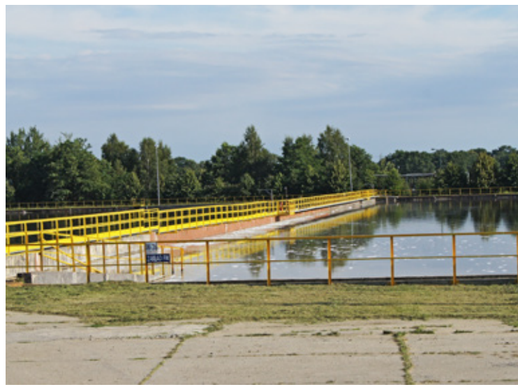
Fot. Zdjęcie archiwalne

Radni miejscy wysłali pytania do Rady Nadzorczej PCC Rokita,