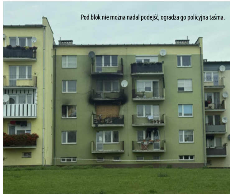
Pod blok nie można nadal podejść, ogradza go policyjna taśma.

uszczerbek na zdrowiu wielu osób. W takim przypadku kara wynosi od 2 do 12 lat więzienia