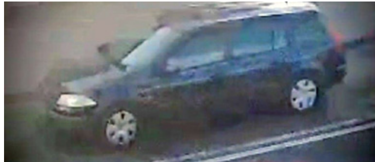
Osoby podejrzewane poruszały się samochodem marki Renault Megane o numerach rejestracyjnych zaczynających się od WPI.

Każda informacja może okazać się kluczowa w śledztwie. Policja prosi osoby posiadające nagrania z kamer samochodowych lub monitoringu, a także świadków zdarzenia, o pilny kontakt: prowadzący sprawę: 665 522 388, dyżurny Komendy