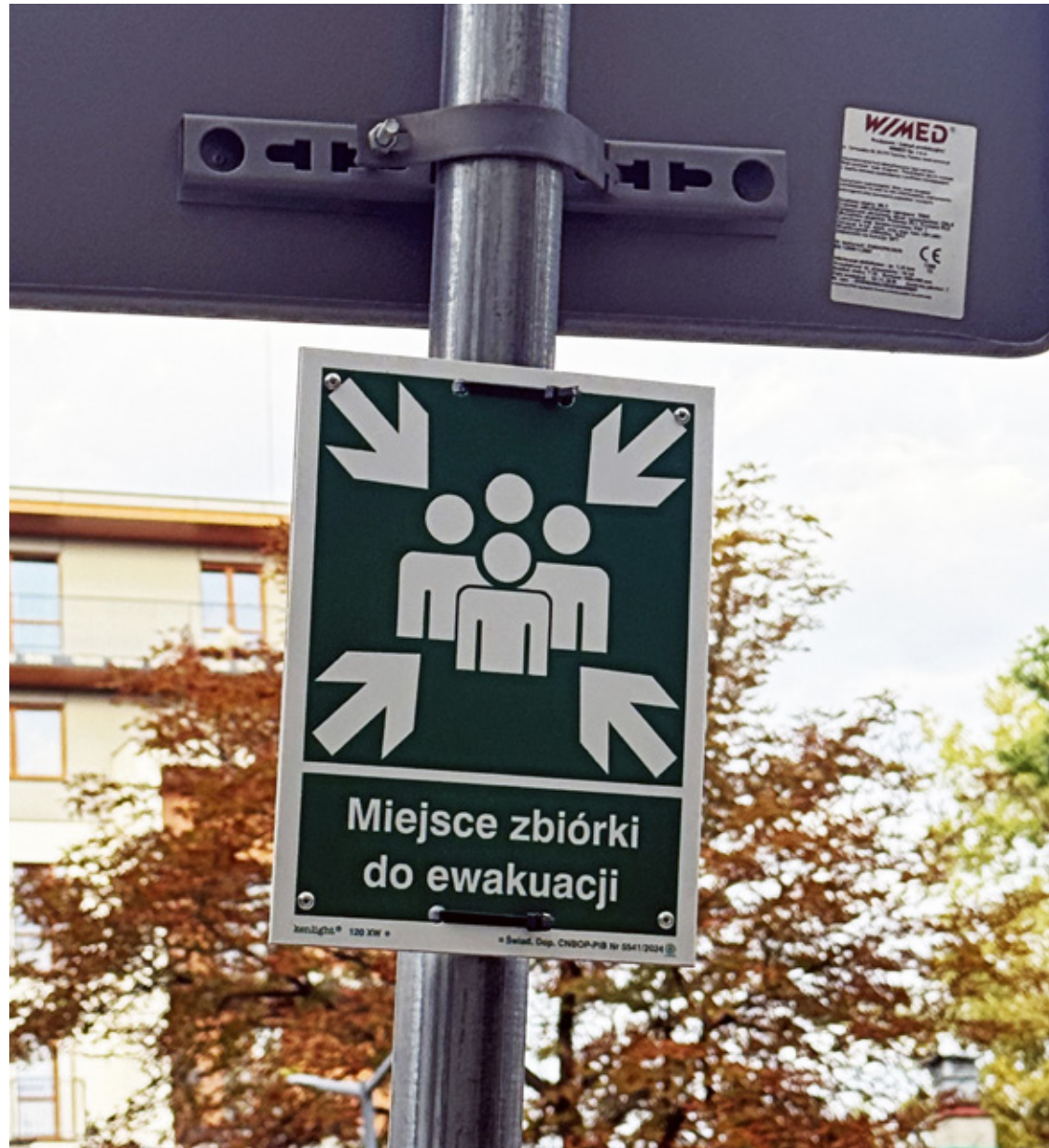
Między innymi w Warszawie, na osiedlach, rozwieszane są takie tabliczki.

Alert Rządowego Centrum Bezpieczeństwa (RCB) to system SMS-owego powiadamiania ludzi o zagrożeniach. Jest uruchamiany wyłącznie w sytuacjach nadzwyczajnych, gdy istnieje prawdopodobieństwo bezpośredniego zagrożenia zdrowia lub życia na znacznym obszarze.