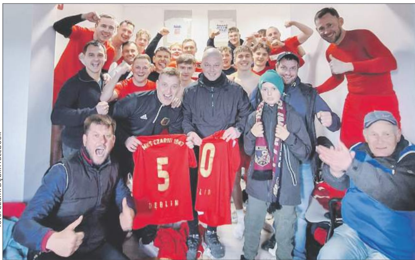
Czarni Dęblin pokonali 5:0 Zawiszę Garbów i wrócili na fotel lidera II grupy A klasy