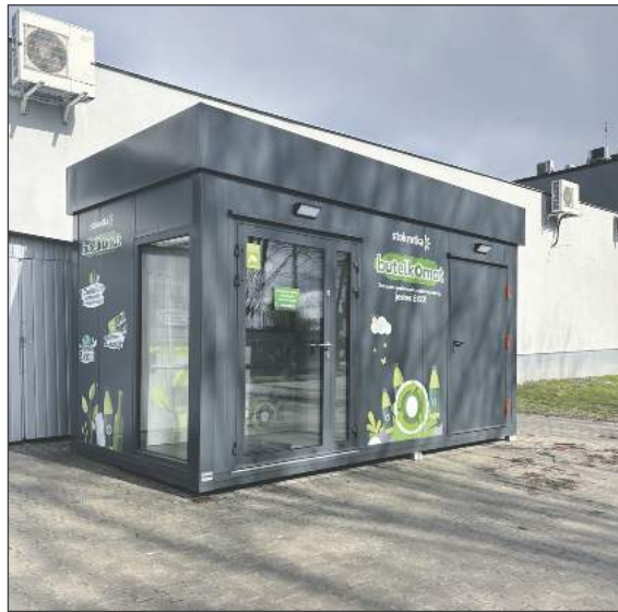
Butelkomat pod Stokrotką w Garwolinie

Na Facebooku, pod postami dotyczącymi oddawania butelek do automatów, pojawia się zwykle wiele opinii. Jedni chwalą system, inni narzekają na jego działanie. Polecają miejsca, gdzie odda się bezproblemowo opakowania. „W Lidlu bezproblemowo,