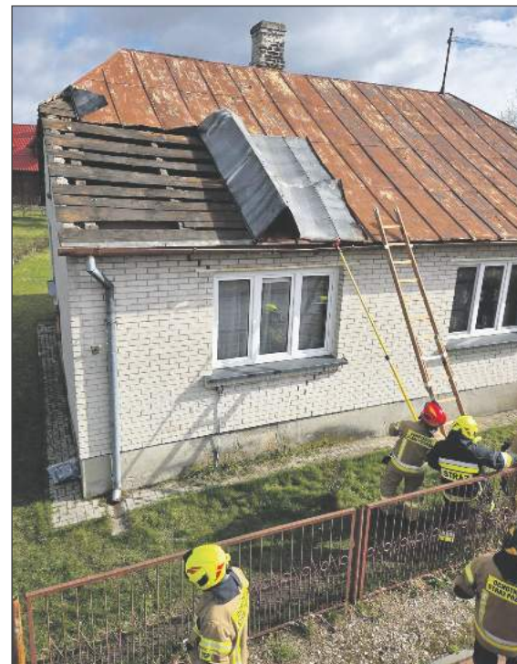
☛ Strażacy z PSP w Rykach oraz druhowie ze Stężyczy w Lany Poniedziałek zostali zadysponowani do zerwanego dachu na jednym z domów w Stężyczy