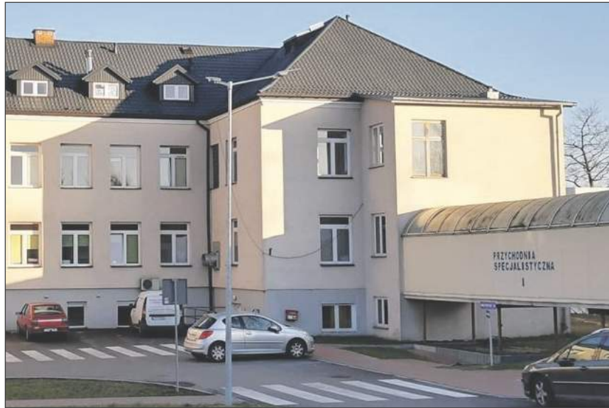
Nowe regulacje wprowadzone zarządzeniem prezesa Narodowego Funduszu Zdrowia mogą znacząco obniżyć ilość wykonywanych badań profilaktycznych

Zmiany to efekt zarządzenia prezesa Narodowego Funduszu Zdrowia. Z dokumentu wynika, że od początku kwietnia ograniczone zostało rozliczanie badań diagnostycznych, takich jak tomografia komputerowa, rezonans magnetyczny, gastroscopia i kolonoskopia. Badania tomografii i rezonansu będą wykonywane tylko do wysokości umowy. Za badania wykonane ponad limit NFZ zapłaci dopiero po zakończeniu roku i tylko w 50 proc. ich wartości. W przy-