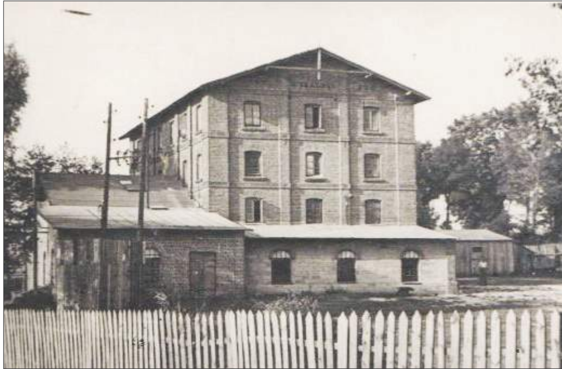
▣ Najbardziej znanym młynem w Rykach był młyn założony przez Władysława Skalskiego

Zmiany w budowie młynów przyniósł XVI wiek.