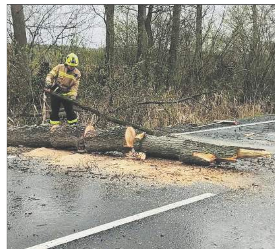
☛ 6 kwietnia strażacy z Ułęża interweniowali na DK 48 w Podłodowie usuwając powalone drzewo