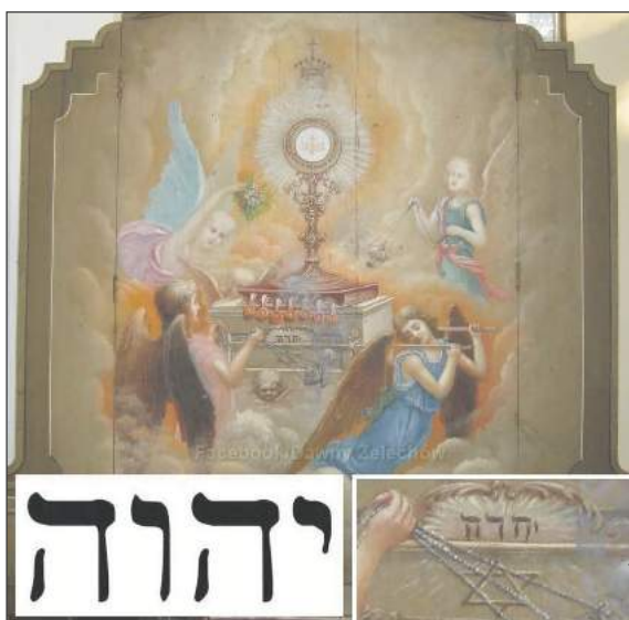
Na jednym z malowideł znajdujących się w kościele filialnym pw. św. Stanisława w Żelechowie znajduje się tetragram i gwiazda Dawida

Imię Boga, będące wyrażeniem nieskończonej wielkości i majestatu Bożego, od zawsze uznawane było za niewymawialne i w związku z tym w lek-