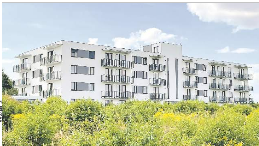
➤ Inwestycja przy ul. Jana Kochanowskiego w Rykach. Obiekt posiada 64 lokale na 4 kondygnacjach (developer: Spółka OPM3)