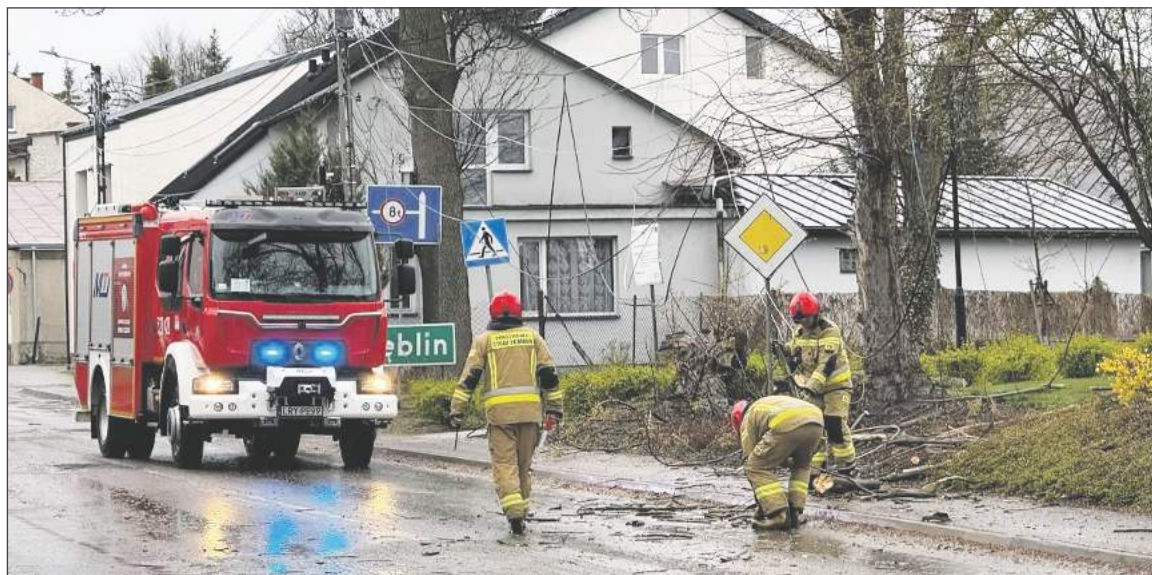
☛ Silne podmuchy wiatru przewróciły jedno z drzew na skwerze przy ulicy Szkolnej w Rykach. Drzewo łamiąc się zerwało linię energetyczną

Apogeum nawałnicy przypadło na drugi dzień świąt. Komenda Powiatowa Państwowej Straży Pożarnej odnotowała aż 30 interwencji związanych z silnym wiatrem. Najwięcej zgłoszeń dotyczyło powalonych drzew i gałęzi blokujących drogi oraz zagrażających liniom energetycznym - było ich 21. Strażacy usuwali także drzewa pochylone nad jezdniami i przewodami. Doszło również do poważniejszych zdarzeń. W dwóch miejscach wiatr uszkodził dachy budynków mieszkalnych, a w jednym przypadku naruszył dach budynku gospodarczego.