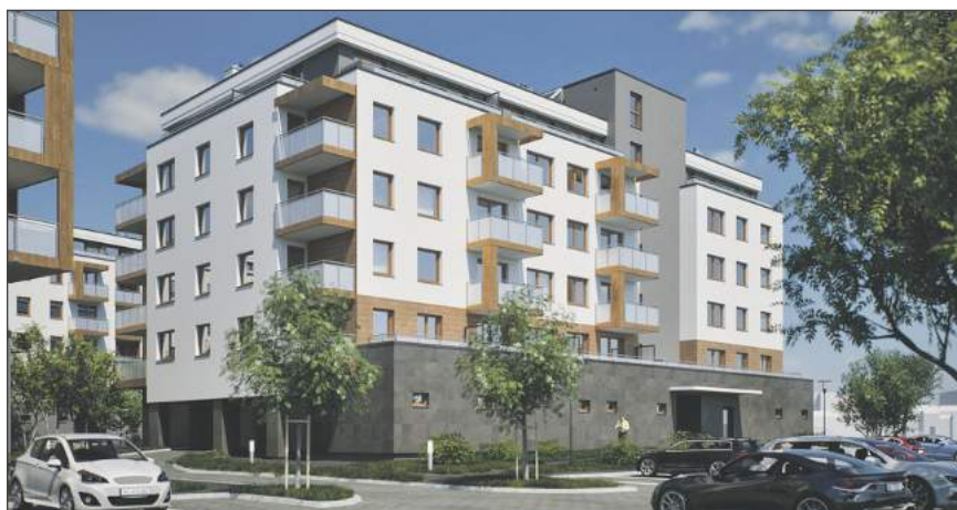
➤ Apartamenty nad Wilgą (II etap) - budowa zespołu dwóch budynków mieszkalnych wielorodzinnych z garażami na działkach przy ul. Targowej w Garwolinie (developer: Spółka Czan)