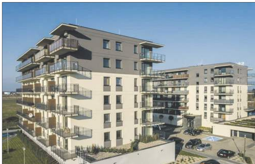
➤ Budowa budynku nr 8 na osiedlu Zamojskiego w Garwolinie (developer: Grupa Ochnik Inwest)

Metropolie są poza zasięgiem wielu portfeli, ale średniej wielkości miasta zaczynają im dorównywać pod względem cen. Koszty zakupu nowych lokali w Dęblinie, Garwolinie i Rykach zbliżają się do stawek oferowanych przez łódzkich deweloperów