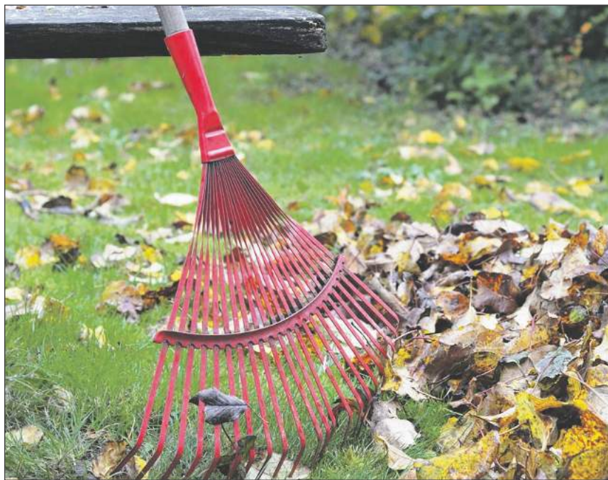
■ Wiosenne porządki na działce i w ogrodzie warto zacząć od dokładnego wygrabienia trawnika

Po zimie, zwłaszcza tej z długo zalegającym śniegiem, szczególnej