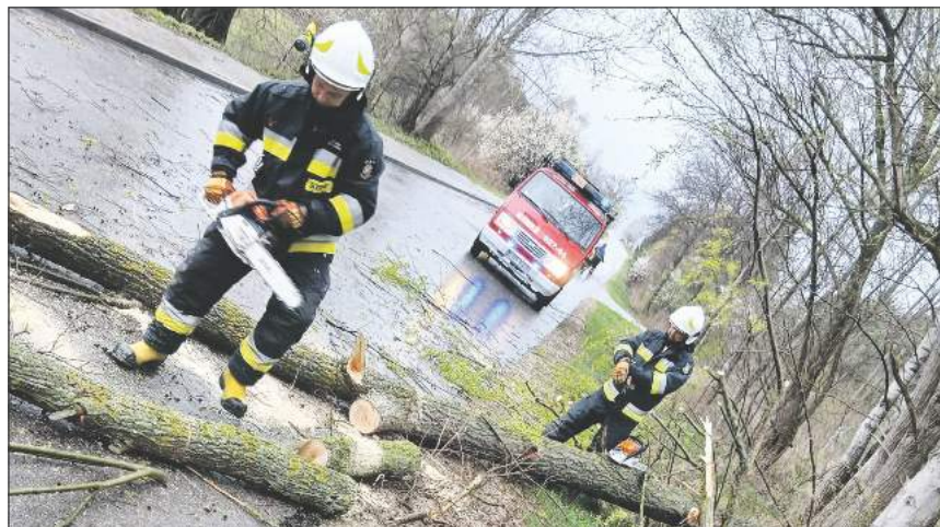
☛ Silne nawałnice, które w ostatnich dniach przeszły przez powiat rycki powaliły i połamały wiele drzew, upadając na drogi stwarzały niebezpieczeństwo dla kierowców

Niebezpiecznie było przy jednej z linii energetycznych. Zerwany przewód spadł na ogrodzenie, a jedna osoba została porażona prądem i trafiła do szpitala. Strażacy interweniowali także przy zerwanej linii uszkodzonej przez drzewo oraz przy drzewach grożących kolejnymi awariami.