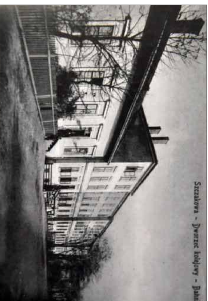
Szczakowa – dworzec kolejowy na pocztku XX wieku (MWN)

Co jednak łączy tych właśnie ludzi? I w jakim kontekście do grona tego zaliczyć należy Józefa Stalina? W dzisiejszym tekście odpowiedź na te właśnie pytania.