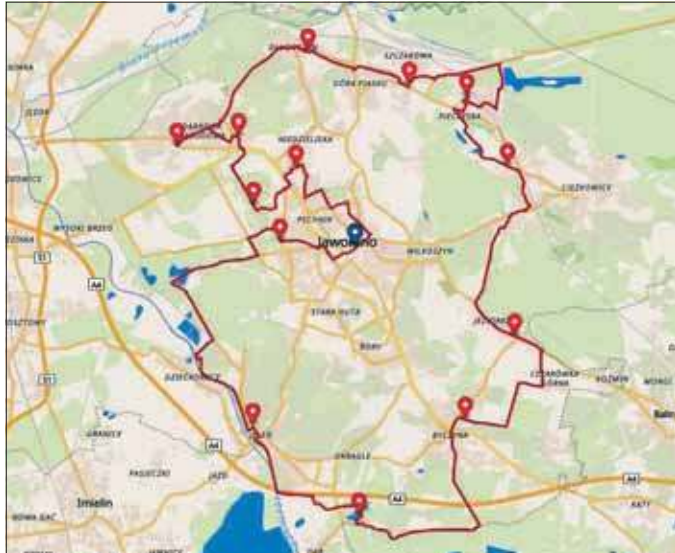
Trasa Czerwona – 57 km ekstremalnego wyzwania

Utrudnienia: trasa wiedzie przez lasy i odludzia – możliwe spotkanie dzikich zwierząt, w tym dzików. Uczestnicy powinni również zachować ostrożność przy przejściu przez ul. Martyńiaków i ul. Bukowską.