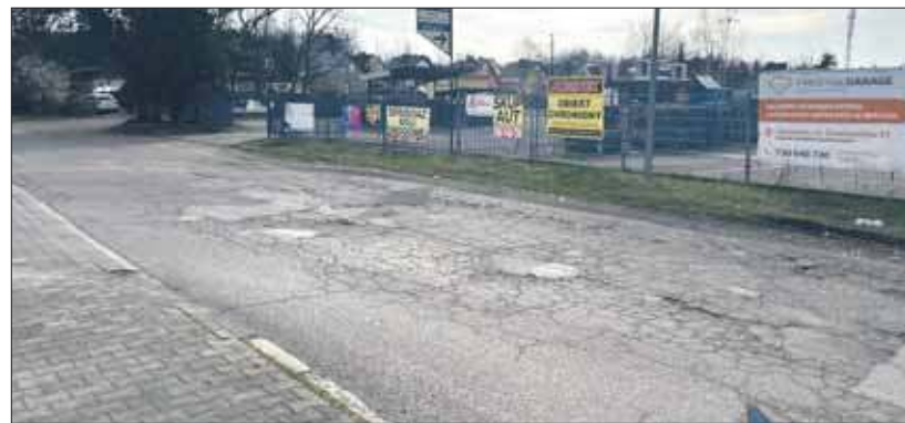
Droga dojazdowa do dyskontu

Przedsiębiorstwo Komunikacji Miejskiej w Jaworznie odniosło się do interpelacji radnej, jednak wskazało, że głównym użytkownikiem drogi jest sklep Lidl. Jednak część autobusów, które kończą swój kurs, wjeżdżają do zajezdni właśnie od strony wjazdu do Okręgowej Stacji Kontroli Pojazdów. PKM Jaworz-