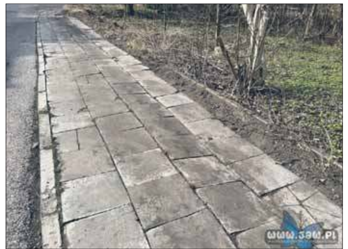
Chodnik na ulicy Ludwika Solskiego

Powierzchnia jest nierówna i zniszczona. Płyty są popękane, a w niektórych miejscach brakuje fragmentów nawierzchni. Część płyt chodnikowych pod naciskiem stopy zaczyna się ru-