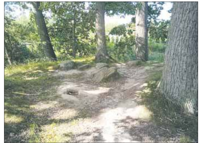
Pozostałości grodziska w Mielnie

swoją kulturę i mowę. Potem zaczęła dominować niemieczyna, choć na części Pomorza dość długo panowali także Szwedzi. I myśląc o tym, siedząc na wspomnianej masywnej ławie kościelnej, pomyślałem właśnie o tych wszystkich, którzy przychodzili tutaj by się modlić. Bez względu na to, w jakim języku to robili, czy w mowie Pomorzan, Polaków czy Niemców, Szwedów i Duńczyków; zwracali się do tego samego Boga, ku chwale którego kościół ten wzniesiono. I chociaż wszystkich tych ludzi już nie ma, tak jak nie będzie kiedyś nas, to budynek stoi jak stał, ciesząc oko i nasycając duszę ukojeniem. Dla mnie takie miejsca jak to niosą zawsze pewne ukojenie i nostalgię, graniczącą z trudnym do ukrycia wzruszeniem.