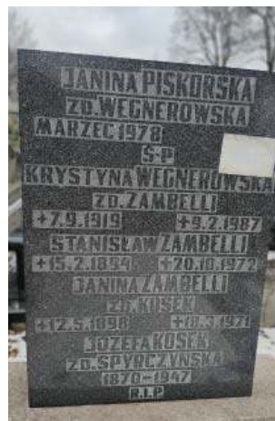
Tablica nagrobna rodziny Zambellich, Wegnerowskich, Kosek oraz Piskorskiej. Cm. parafii Najświętszego Serca Pana Jezusa w dzielnicy Koszutka - Katowice, II 2023 r.