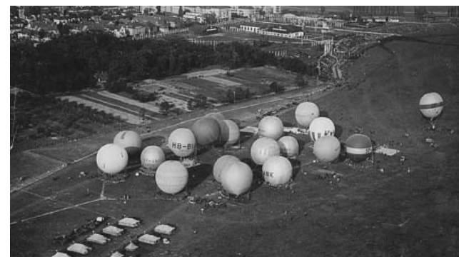
Balony z przedwojennej Wytwórni Balonów i Spadochronów. Legionowo, lata 30. XX w.