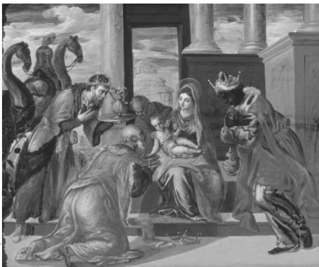
Pokłon Trzech Króli, El Greco (1568)

Chrześcijanie zachodni natomiast, po zrozumieniu boskości Chrystusa, upamiętniają 6 stycznia przede wszystkim (ale nie wyłącznie) wizytę Trzech Króli u Dzieciątka Jezus, a tym samym fizyczne objawienie się Jezusa Chrystusa poganom. Bardziej koncentrują się na przyjsciu Trzech Króli i ich późniejszym uwielbieniu: „Przyszedłszy do domu, zobaczyli Dziecię z Matką Jego, Maryją, i upadli na twarz, i oddali Mu pokłon” (Mt 2,11). Paradoksalnie, w zachodnich chrześcijańskich obchodach poświęcano chrztowi Chrystusa niewiele uwagi, nawet na początku — Augustyn z Hippony, wygłaszając serię sześciu kazań o Objawieniu Pańskim pod koniec IV lub na początku V wieku, mówi jedynie o wizycie i adoracji Trzech Króli.