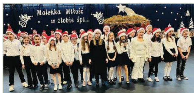
Koncert Bożonarodzeniowy w SP 2 s. 5