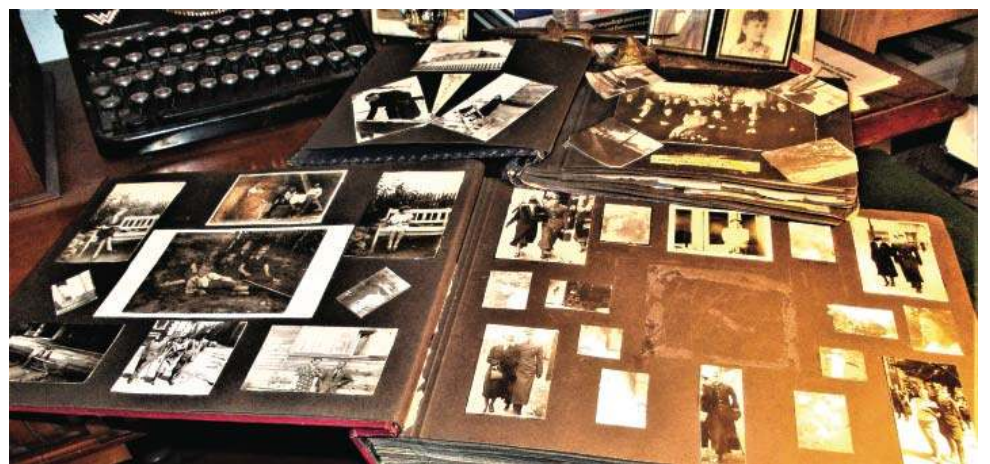
Dwa albumy rodzinne po rodzinie Zambellich - „Depozyt pamięci”. Olsztyn, 26 XII 2025 r.