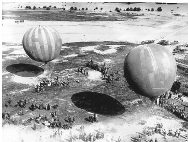
Pokazy balonowe w Legionowie, lata 30. XX w.