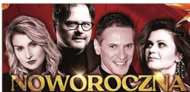
Noworoczna Gala Świątecznych Przebojów w Mławie s. 13