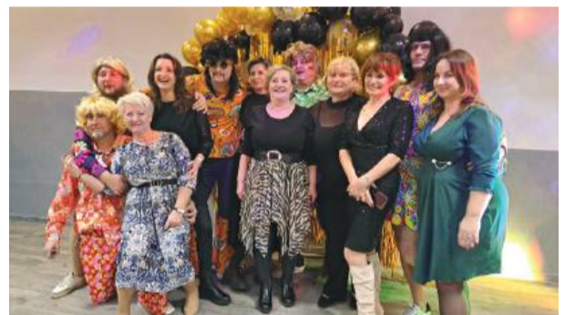
Pamiątkowe zdjęcia z występującymi paniami były nie lada atrakcją.