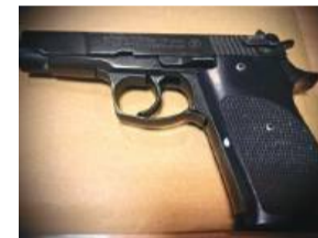
W garażu należącym do mężczyzny znaleziono niemiecki pistolet marki Rohm na naboje 9 mm

Na posiadanie pistoletu alarmowego o mniejszym kalibrze, np. 6 milimetrów