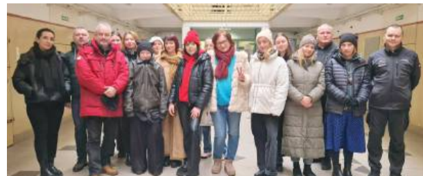
Spotkanie ze studentami zorganizowano w ramach zajęć praktycznych i zapoznania się z funkcjonowaniem jednostki.