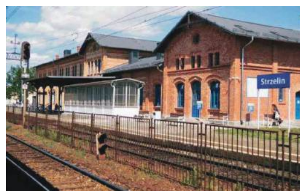
Dokąd pojedziemy ze strzelińskiego dworca?

Atrakcyjne turystyczne mogą być też bliższe podróże. Ze Strzelina bez przesiadki dojedziemy m.in. do Ziębic, Kamieńca Ząbkowickiego, Kłodzka, Barda, Bystrzycy Kłodzkiej czy Międzyzlesia. W Ziębicach uwagę przykuwa gotycka bazylika św. Jerzego, rynek z ratuszem czy fragmenty murów obronnych. Kamieniec Ząbkowicki to przede wszystkim imponujący neogotycki Pałac Mariany Orańskiej z mauzoleum Hohenzollernów i pocysterski zespół klasztorny.