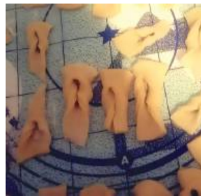
Faworki przewijamy przez środek

Czekaliście na tłusty czwartek? Obchodźcie go tradycyjnie czy nietypowo? Niezależnie od tego zajrzyjcie do naszej Kroniki.