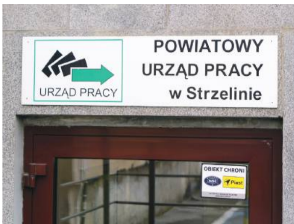
Rząd obciął środki urzędów pracy o około 40%

jak trzytygodniowe spotkanie dla osób długotrwale bezrobotnych, które nie potrafią się odnaleźć na rynku pracy. Spotykają się w klubie pracy i pracują nad tym, aby nauczyć się na nowo sposobów szukania pracy, aktywnego docierania do pracodawców i efektywnego prezentowania siebie. Nie mamy jednak żadnej gwarancji, że te osoby poradzą sobie i będą mogły wrócić na rynek pracy. W tym przypadku możemy nie uzyskać efektywności. Naszą efektywnością jednak i satysfakcją jest to, że te osoby nauczyły się napisać CV, list motywacyjny i potrafią poruszać się na