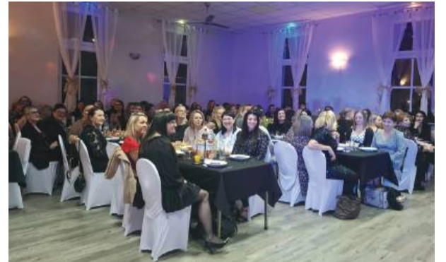
Świetlica wiejska była wypełniona po brzegi.