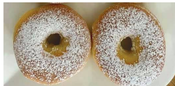
Donaty (oponki) z piekarnika są zdrowsze niż takie smażone

Wszystkie składniki połączyć i zagnieść ciasto (żółtka powinny mieć temperaturę pokojową). Rozwałkować dość cienko. Pokroić w prostokąty – najlepiej radełkiem, ale jeśli ktoś nie ma – wystarczy nożem. Środek prostokąta