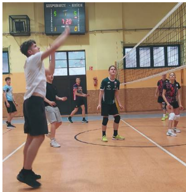
Wszystkie niedzielne mecze zakończyły się wynikiem 3:0

w identycznym stosunku wygrały z drużyną Sunrise I. Również Uzależnieni od Siatkówki nie dali szans swoim rywalom – pokonali ekipę Vamoss bez straty seta. W ostatnim meczu niedzielnych rozgrywek drużyna Sunrise II