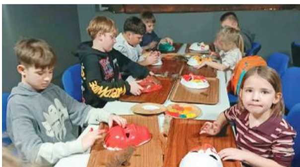
Uczestnicy wyjazdu brali także udział w warsztatach plastycznych.

W ramach programu „Co-olturowe Ferie” Gminny Ośrodek Kultury w Przewornie zorganizował wycieczkę do Parku Nauki i Ewolucji Człowieka w Krasiejowie. Uczestnicy mieli okazję wziąć udział w zajęciach edukacyjnych „Labirynt przodków”, które w przystępny sposób przybliżyły tematykę życia pradawnych