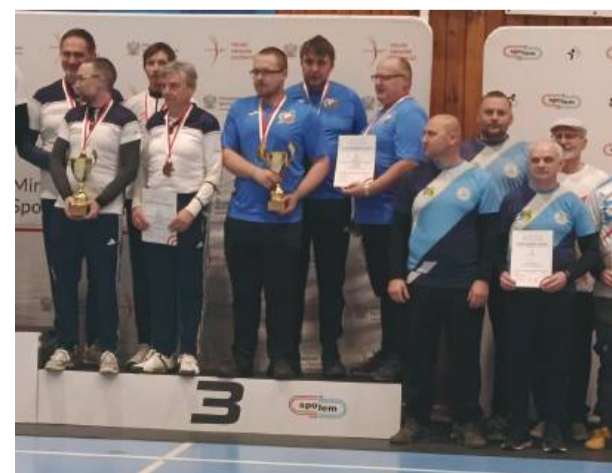
Męska drużyna sekcji łuczniczej Granit