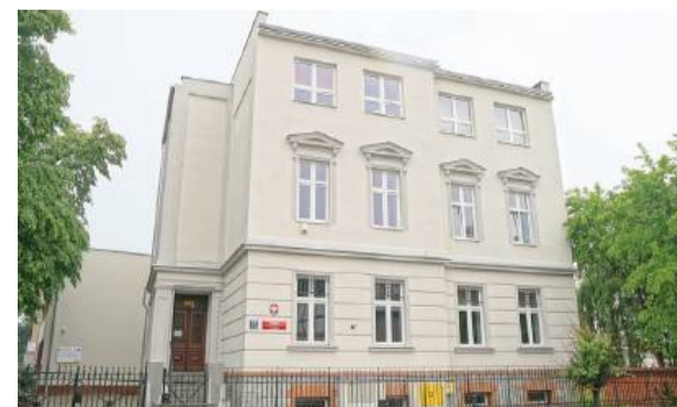
Szkoła Muzyczna zabiega o takie rozwiązanie prawne, które pozwoli Ministerstwu Kultury finansować modernizację i rozbudowę obiektu przy ul. Jana Pawła II w Strzelinie.