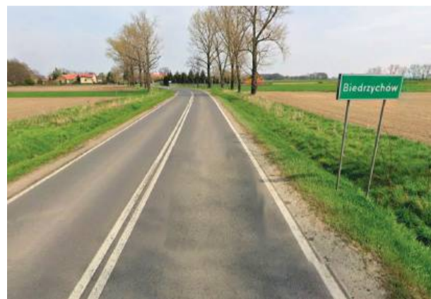
Wjazd do Biedzychowa pod Strzelinem.

– Uważają, że jak pies nie ma żeber na wierzchu, to znaczy, że wszystko jest dobrze. Nie biorą pod uwagę znęcania się psychicznego,