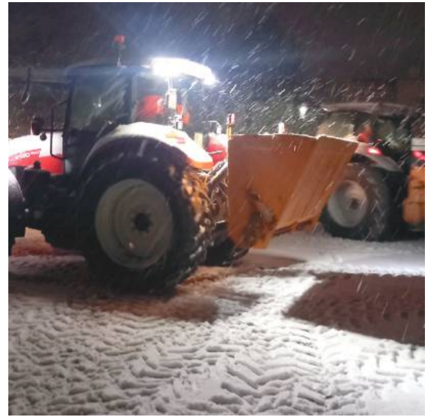
Do akcji posypywania były wykorzystywane traktory z przyczepionymi piaskarkami

Dodatkowo, w granicach administracyjnych Strzelina znajdują się drogi wojewódzkie, które nie należą do gminy, ale na mocy porozumienia z DSDiK gmina je utrzymuje. Są to: ul. Oławska, ul. Wolności, ul. Żąbkowicka (DW 396) oraz ul. Wrocławska (DW 395). Łącznie to 6,5 km. Te drogi również są utrzymywane w pierwszej kolejności.