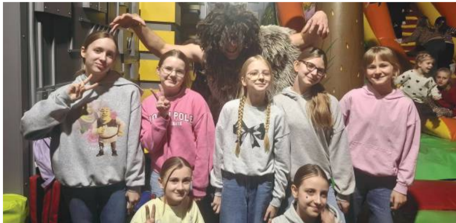
Dzieci z gminy Przeworno miały okazję wziąć udział w zajęciach „Labirynt przodków”, które przybliżyły tematykę życia pradawnych ludzi.