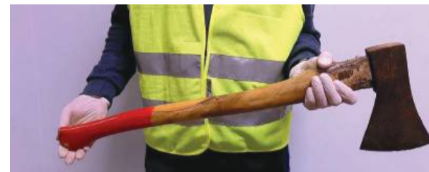
Sprawca trafił do policyjnej celi, jednak nie przyznał się do zarzutów. Fot. ilustracyjne

trzymaniem mężczyzny, który trafił do policyjnej celi. Już usłyszał zarzuty. Nie przyznał się do winy, jednak świadkowie potwierdzili okoliczności zdarzenia – informuje