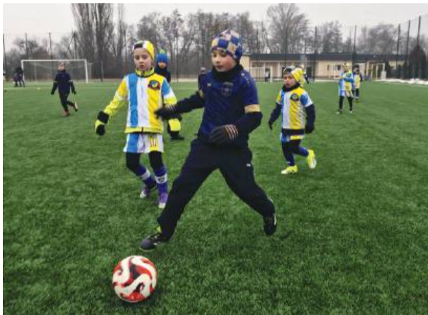
Strzeleńskie szkółki piłkarskie już szlifują formę przed rundą wiosenną

To bardzo dobra wiadomość dla młodych piłkarzy i ich rodziców. Szkółki piłkarskie z powiatu strzeleńskiego znalazły się w gronie klubów wyróżnionych w Programie Certyfikacji Szkółek Piłkarskich Polskiego Związku Piłki Nożnej na rok 2026. Na Dolnym Śląsku PZPN przyznał certyfikaty łącznie 76 szkółkom piłkarskim. Wśród nich tylko jedna może pochwalić się Złotą Gwiazdką,