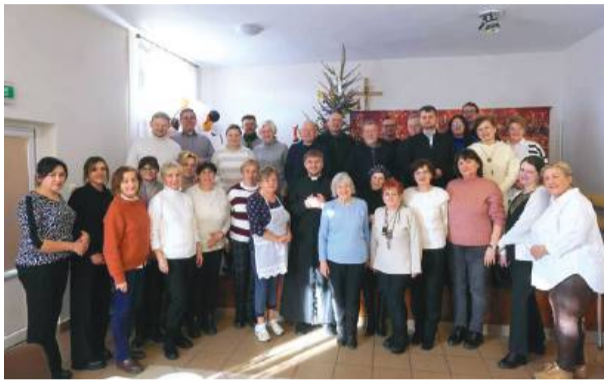
Pamiątkowe zdjęcie chórzystów i organizatorów wydarzenia.