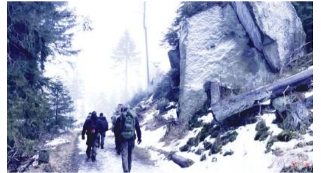
Strzelcy z Jednostki Strzeleckiej 4330 Strzelin wzięli udział w intensywnym marszu kondycyjnym na terenie malowniczych Gór Stołowych.

W wydarzeniu wzięł udział również kolega z zaopiecznionej ekipy RATS