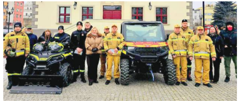
Oficjalne przekazanie druhom OSP dwóch nowoczesnych quadów. Wydarzenie odbyło się na strzeleńskim rynku. Fot. UMiG Strzelin

Dzięki znacznie mniejszym rozmiarom niż samochody, drухowie będą mogli nimi dotrzeć tam,