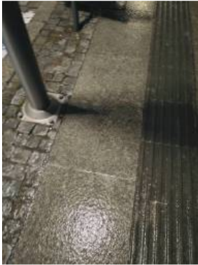
Jedna z mieszkańek Strzelina zrobiła zdjęcie, pokazujące, jak wyglądał chodnik w okolicy dworca w minionej środę. - Dramat. Jedno wielkie oblodzenie - napisała

zały się również strome, oblodzone podjazdy, na których ciężkie pojazdy miały poważne trudności z poruszaniem się. - Zdarzało się, że wysyłałmy ciągnik z solą i piaskiem wyłącznie po to, aby podsypać drogę pod koła samochodu ciężarowego i umożliwić mu dalszą jazdę - relacjonuje.