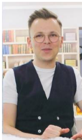
Sławomir Gortych, pisarz znany z popularnych powieści osadzonych w klimatycznych, górskich realiach