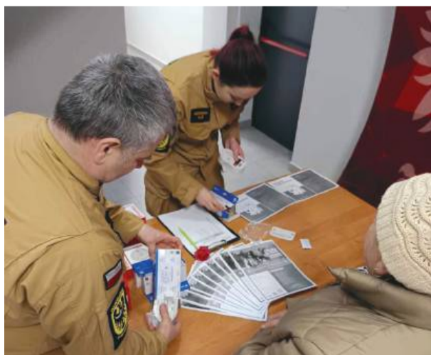
Mieszkańcy powiatu otrzymali bezpłatne czujki tlenku węgla i dymu.