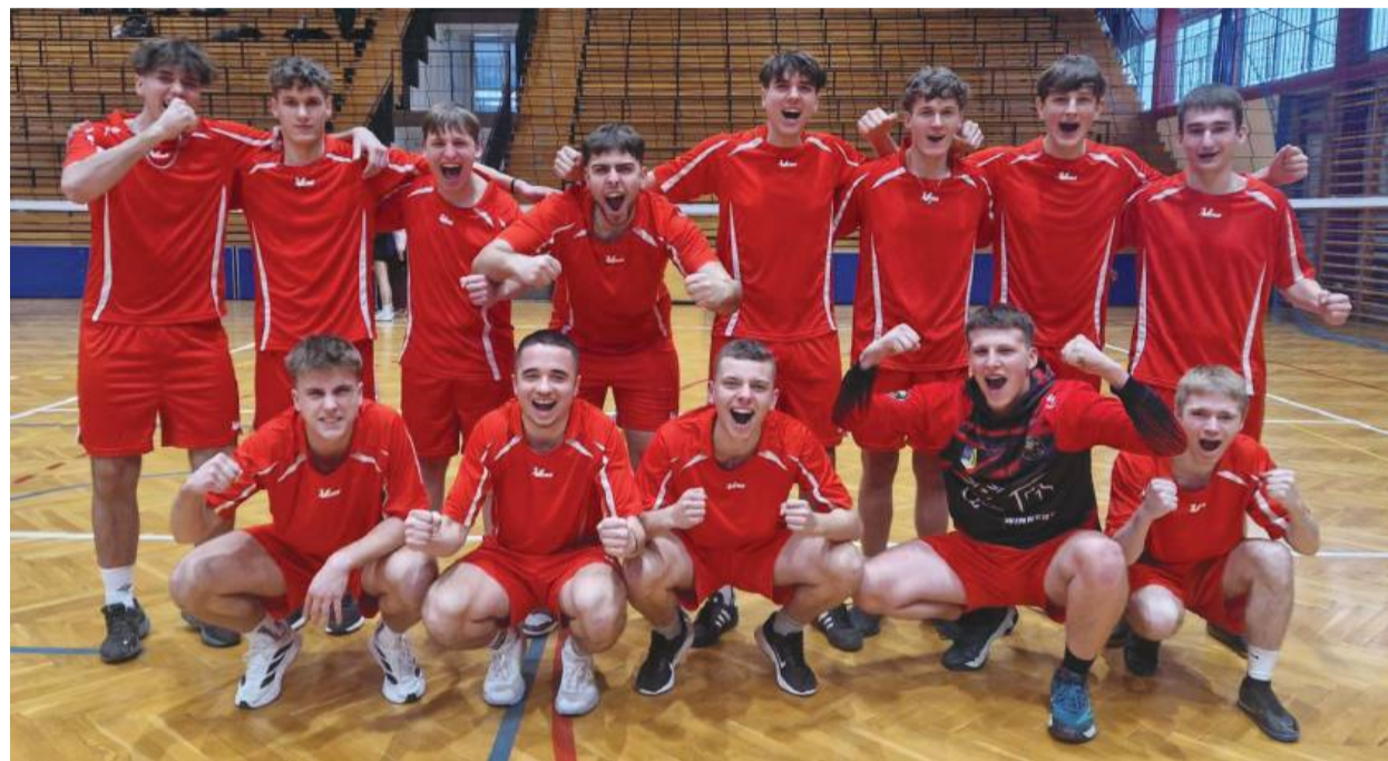
Drużyna siatkarzy ze Strzelina zajęła pierwsze miejsce