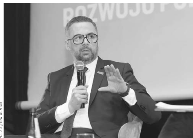
Musimy dążyć do budowy spójnego systemu finansowania nauki w Polsce — stwierdził minister Marcin Kulasek

— Czy polscy naukowcy potrafią skutecznie promować i komercjalizować swoje osiągnięcia? Wciąż jest tu spory potencjał do rozwoju. Co innego dokonać czegoś dzięki wiedzy, talentowi i ciężkiej pracy, a co innego przekuć te osiągnięcia w konkretne rezultaty o wymiernym znaczeniu gospodarczym czy społecznym. Dostrzegamy tę potrzebę