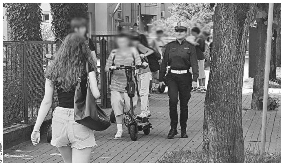
KPP w Mławie

najbliżej zewnętrznej krawędzi chodnika, najbardziej oddalonej od jezdni, - hulajnoga elektryczna będzie ustawiona równoległe do krawędzi chodnika, - szerokość chodnika pozostawionego dla ruchu pieszych jest taka, że nie utrudni im ruchu i jest nie mniejsza niż 1,5 m. Hulajnoga elektryczna może zostać usunięta z drogi na koszt właściciela, m.in. w przypadku pozostawienia jej w miejscu, gdzie jest to zabronione i utrud-