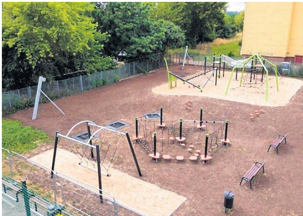
W ramach LBO powstał m.in. park linowy na osiedlu Zosinek

Przebudowa wnętrza podwórza przy ul. Fredry, Batorego, Głowackiego i Chojnow-