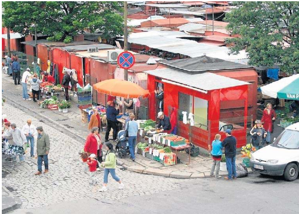
Przy ul. Partyzantów ma powstać parking/schron na 400-500 pojazdów i 1000 osób

- Miasto zdecydowało się wydłużyć termin przyjmowania