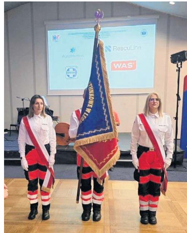
Pogotowie Ratunkowe w Legnicy otrzymało swój sztandar, poświęcony podczas uroczystej mszy świętej