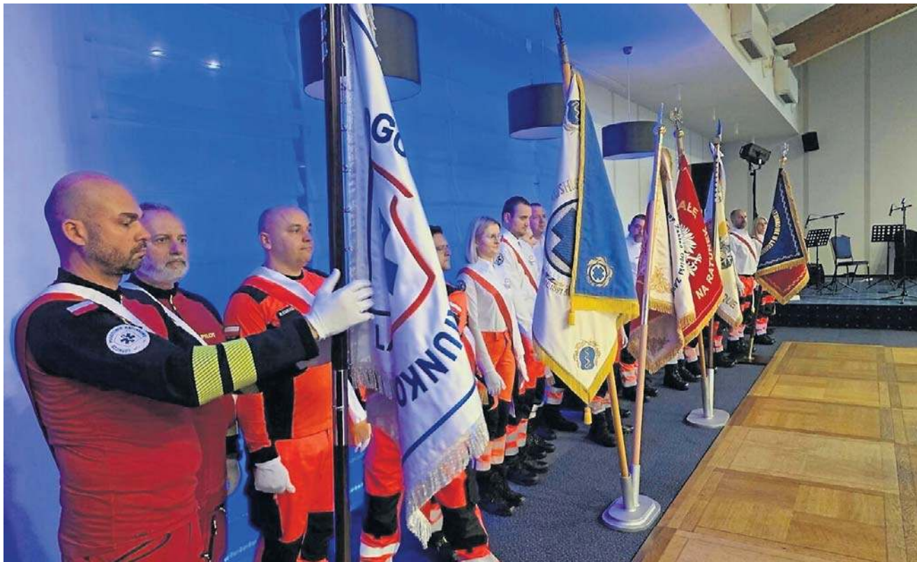
Uroczystości 80-lecia istnienia Pogotowia Ratunkowego w Legnicy połączone z Ogólnopolskim Dniem Ratownictwa Medycznego, na który przybyli do naszego miasta przedstawiciele ratownictwa z całej Polski.