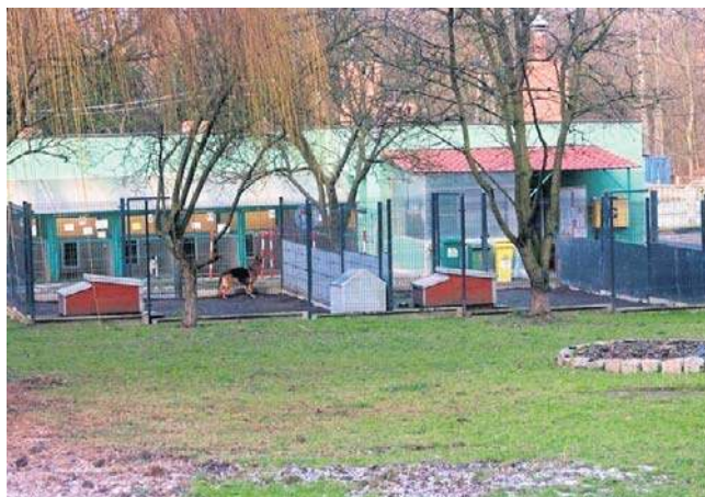
Kontynuacja modernizacji Schroniska dla Bezdomnych Zwierząt wygrała w kat. projektów ogólnomiejskich

skiej. To inwestycja, która znacząco poprawi jakość życia mieszkańców okolicznych kamienic. Projekt obejmuje zagospodarowanie terenu wewnątrz budynków mieszkalnych, poprawę bezpieczeństwa, estetyki oraz funkcjonalności przestrzeni wspólnych.