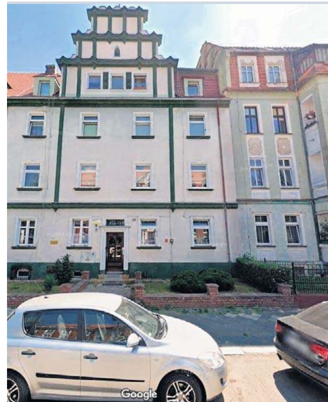
Na remont 1/2 dachu, remont elewacji frontowej i tylnej kamienicy przy ul. Orzeszkowej 38 przyznano 207 886,62 zł

- Legnica ma wyjątkową, wielowiekową historię zapisaną w swoich budynkach. Cieszę się, że dzięki temu programowi coraz więcej właścicieli zabytków będzie mogło o nie zadbać. Miasto będzie nadal wspierać te inicjatywy, bo każda odrestaurowana kamienica, każda uratowana fasada, to cegiełka w budowaniu piękniejszej, bardziej zadbanej Legnicy - mówi Maciej Kupaj, prezydent Legnicy.