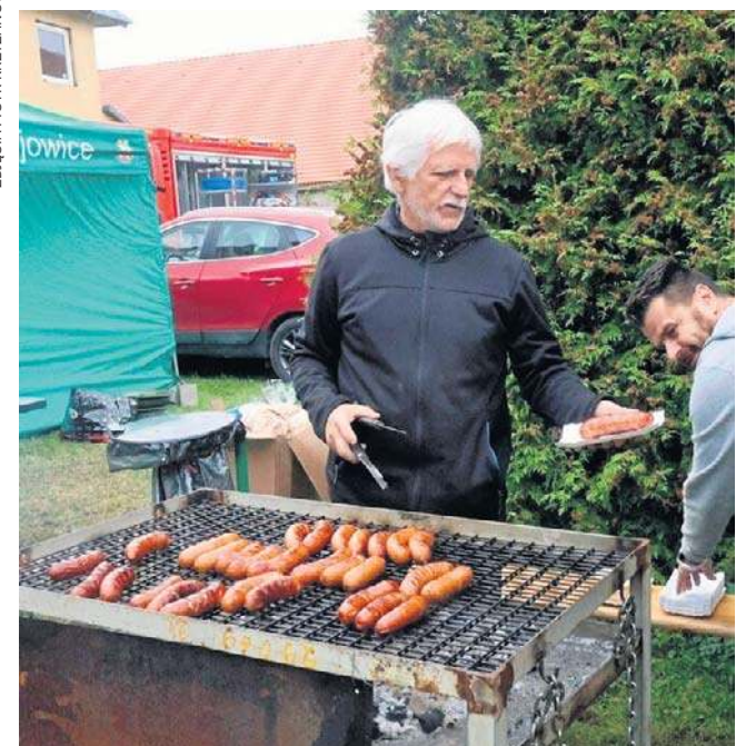
Ljadła i napitków na festynie było sporo. Nie brakowało chętnych na kielbaski z różną