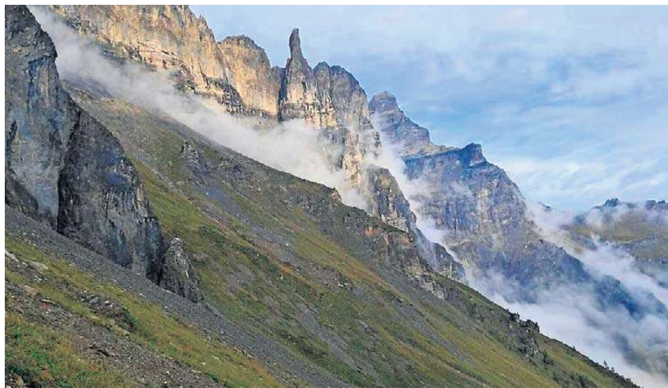
- To ogromna satysfakcja walczyć o zwycięstwo. Prawdziwa przygoda. Plusem jest czas, spędzony na rowerze, jazda w wysokogórskim terenie z pięknymi widokami - mówi.

Mossoczy korzystał z tego, że jego organizm toleruje bardzo długą jazdę, nawet bez snu. Aż trudno uwierzyć, że pierwszy w miarę normalny