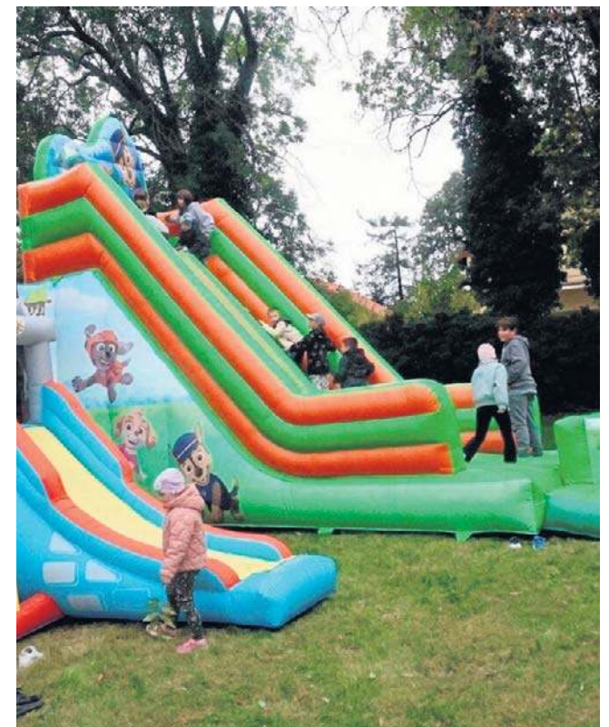
Pomyślano też o atrakcjach dla najmłodszych uczestników festynu