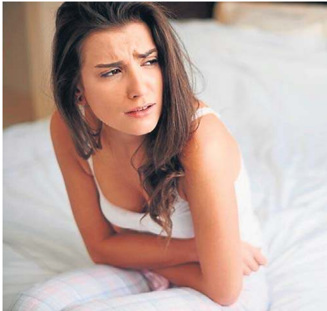
Na nowej liście refundacyjnej znalazł się m.in. lek Ryego, który jest nowością w leczeniu endometriozy