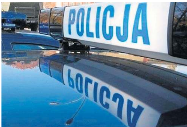
Funkcjonariusze policji obezwładnili 41-latkę i wezwali karetkę pogotowia

Śledczy podkreślają, że na tym etapie postępowania za wcześnie jest na formułowanie wniosków dotyczących przyczyn zgonu. Wyniki sekcji zwłok mają być kluczowe dla ustalenia, co dokładnie wydarzyło się podczas interwencji.