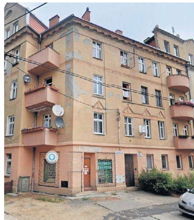
Na remont elewacji frontowej przy Senatorskiej 61 przyznano 97 216,25 zł. Na elewację przy ul. Chłapowskiego 9 - 31 382,24 zł