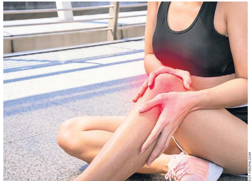
Bóle stawów często występują u osób starszych na skutek zużycia stawów wraz z wiekiem

W konsekwencji, niedobory witamin mogą doprowadzić do wystąpienia bólu i ich