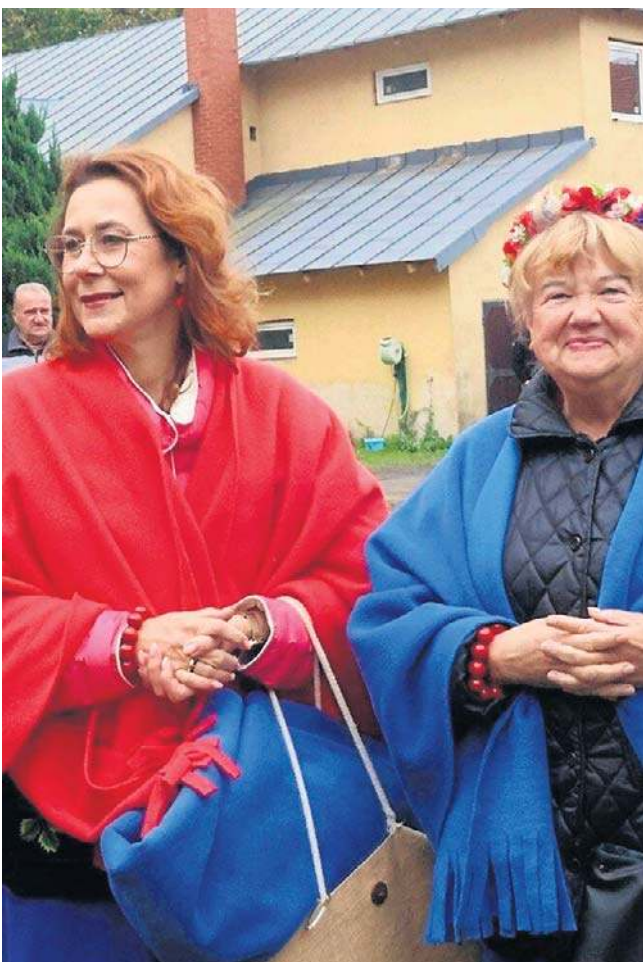
Na festynowej scenie wystąpiły lokalne zespoły folklorystyczne