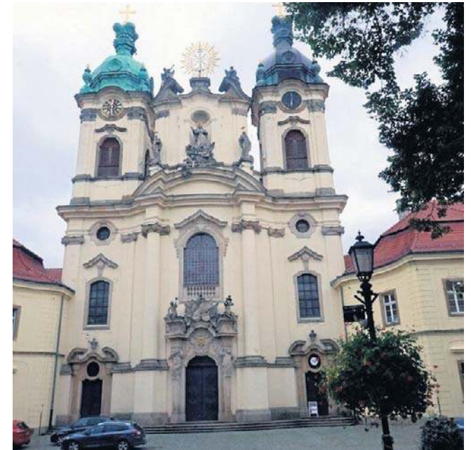
Uroczysta msza odpustowa odbyła się w bazylice mniejszej w Legnickim Polu