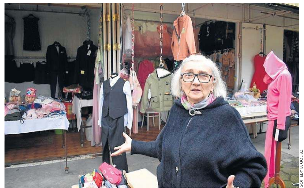
Handlowcy rozumieją potrzebę budowy schronu, ale martwią się o swoją przyszłość

- Zapewniamy, że jeśli do inwestycji dojdzie, plac targowy w tym miejscu zostanie. Parking