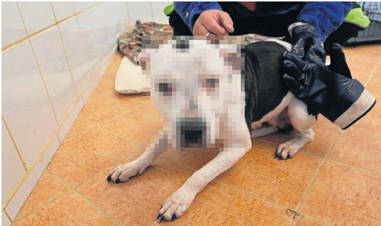
Suczka była przerażona, na głowie i nosie miała liczne rany