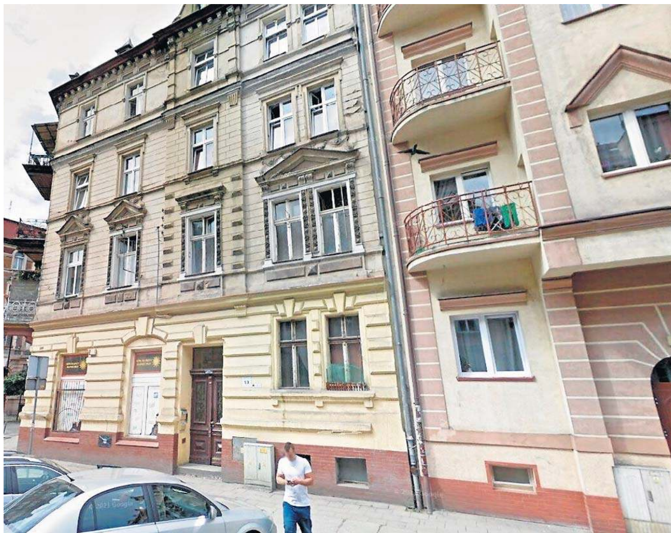
Na remont balkonów i dachu w budynku przy ul. Roosevelta 13 poprzyznano 212 932,87 zł dotacji