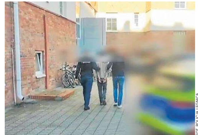
24-latkowi grozi do trzech lat więzienia

- Pracujemy nad surowszymi karami dla takich potworów - podkreślił parlamentarzysta w komentarzu pod swoim wpisem.