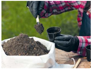
Spór o zakład, który będzie produkował nawozy ze ściekowych osadów, trwa od lat. Administracyjne przepychanki w tej sprawie nie ustają.

W ostatnich obradach rady gminy wziął udział właściciel posesji położonej w bezpośrednim sąsiedztwie działki, na której spółka Agrocal zamierza wybudować zakład przetwarzający ściekowe osady na granulatach nawozowych. Mieszkaniec, nie po raz pierwszy zresztą, wyraził swój otwarty sprzeciw wobec działań spółki, ale też urzędników gminy, którzy byli bezpośrednio zaangażowani w przeprowadzenie czynności administracyjnych, związanych z wydaniem decyzji o środowiskowych uwarunkowaniach. W ocenie mieszkańca Buśna sprawa zakładu nie powinna być uznawana za zamkniętą.