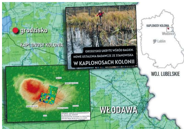
Foto: P. Piotrowska (zdjęcie), M. Piotrowski (wykres), G. Mączka (mapka). Źródło: Lubelski Wojewódzki Konserwator Zabytków

Z najnowszych informacji udostępnionych przez Lubelskiego Wojewódzkiego Konserwatora Zabytków wyłania się fascynujący obraz wczesnośredniowiecznej historii naszego regionu. Jesienne badania archeologiczne, przeprowadzone w trudno dostępnych lasach wokół miejscowości Kaplonosy-Kolonia, potwierdziły istnienie potężnego, niemal nienaruszonego upływem czasu grodziska. To odkrycie rzuca zupełnie nowe światło na dawne osadnictwo na tych terenach i stanowi prawdziwą sensację naukową.