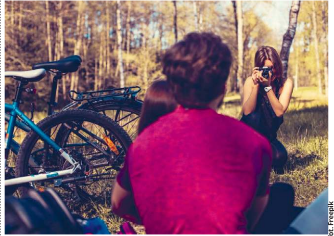
Odwiedzający gminę goście będą mogli skorzystać z nowych rozwiązań infrastruktury turystycznej.

● GM. LEŚNIEWICE Już niebawem władze gminy dowiedzą się, którzy wykonawcy zechcą zrealizować nową inwestycję infrastrukturalną. Tym razem chodzi jednak nie o drogi, a nowe obiekty rekreacyjne. Co dokładnie zaplanowano?