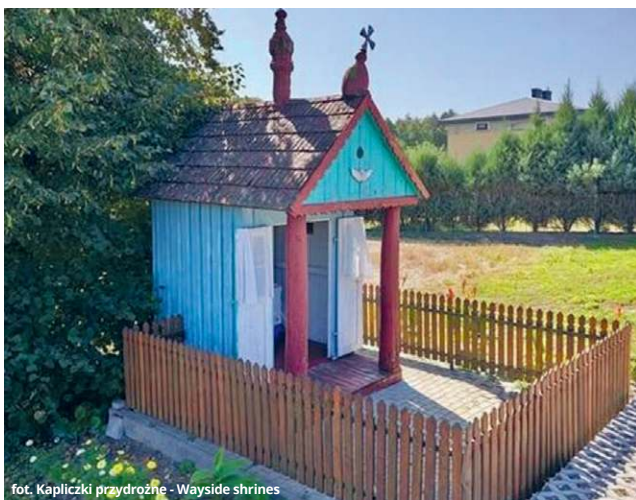
Wszyscy biją na alarm, a „góra” nie widzi problemu

- Nie mogę pozostać bierny, kiedy widzę, co dzieje się z tą cenną, XIX-wieczną kapliczką - w alarmującym tonie zwrócił się do nas niedawno mieszkaniec Raciborowic. Dla niego miejscowa kapliczka to nie tylko obiekt kultu. To także cenne świadectwo historii miejscowości, które przetrwało próbę lat, ale może nie przetrwać próby... wody. Prysłowiowy gwóźdź do trumny stanowią dla obiektu remont przebiegającej nieopodal drogi wojewódzkiej nr 844.