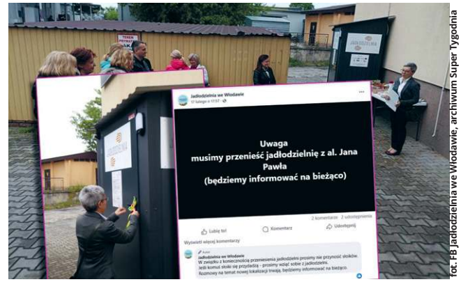
W połowie lutego br. pojawiła się zapowiedź o przenosinach jadłodzielni w nowe miejsce. Włodawscy społecznicy wkrótce poinformują o nowej lokalizacji.

– To było miejsce stworzone z myślą o jedzeniu. Jest tam regał, na którym można zostawić słoik czy paczkę makaronu. Niestety, zaczęły się tam pojawiać ubrania, co zauważyliśmy od momentu, gdy ubrania trzeba było wrzucać do specjalnych kontenerów. Być może wynikało to z pewnej niefrasobliwości ludzi. My, jako inicjatorzy jadłodzielni, nie jesteśmy w stanie stać tam i pilnować porządku przez całą dobę. Nie taki był cel tej działalności, tworząc to miejsce, mieliśmy nadzieję, że jego użytkownicy zadbają o porzą-