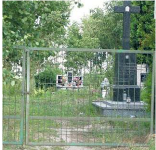
Porządkowanie przestrzeni cmentarza jest problematyczne, ale postępuje. Mile widziane są osoby, które chciałyby wykonać troskę i pomóc w przeprowadzeniu niezbędnych prac.

O cmentarz dbamy dokładnie tak samo, jak o każdy inny, rzymsko-katolicki cmentarz. Dbamy o to, aby teren był, w sensie ogólnym, schludnie utrzymany i nie stanowił zachęty do tego, aby urządzać tam dzikie wysypisko śmieci. Niemniej jednak o poszczególne mogiły powinni już zadbać sami zainteresowa-