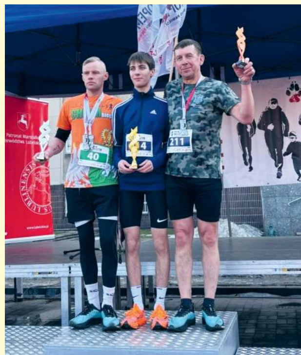
fort. Bieg Tropem Wilczym Chełm