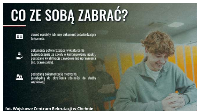
fol. Wojskowe Centrum Rekrutacji w Chełmie

Okazuje się jednak, że to jeszcze nie wszystkie grupy, jakie stawia się w tym roku do kwalifikacji. To także osoby, które w minionych latach – 2024 i 2025 – zostały uznane przez komisje lekarskie za czasowo niezdolne do służby wojskowej ze względu na swój stan zdrowia.