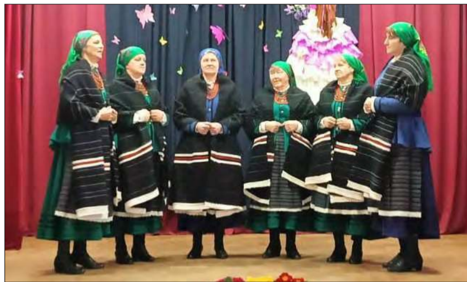
➤ Najbardziej utytułowanym zespołem jest Kawęczyn. Rok temu w finale Festiwalu Kapel i Śpiewaków Ludowych w Kazimierzu Dolnym zdobył drugie miejsce

» Ich talent i muzykalność docenili znawcy folkloru. Sukcesem dla naszych reprezentantów zakończył się Międzypowiatowy Przegląd Kapel i Śpiewaków Ludowych