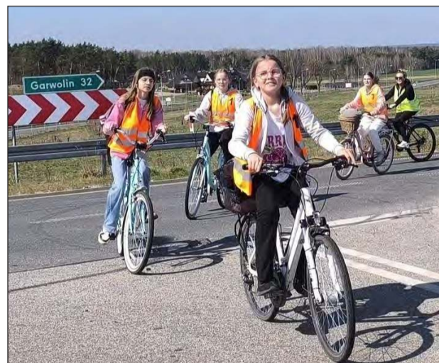
☛ Główny nacisk położono na ćwiczenia indywidualne na skrzyżowaniach

Jak bezpiecznie pokonywać skrzyżowania na rowerze i przestrzegać zasad ruchu drogowego? Tego uczyli się uczniowie Zespołu Placówek Oświatowych w Owni, którzy wzięli udział w edukacji rowerowej. Po zajęciach teoretycznych młodzież zdobywała praktyczną wiedzę o ruchu drogowym. Ze względu na brak infrastruktury rowerowej w okolicy zdarzały się dłuższe przelety bez postojów. Główny nacisk położono na ćwiczenia indywidualne na skrzyżowaniach, szczególnie lewoskręty oraz omawianie znaków drogowych. Organizatorem zajęć była Fundacja Mobilności Ak-