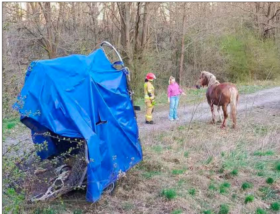
Strażacy, używając narzędzi hydraulicznych, uwolnili klacz z pułapki

Niecodzienne zdarzenie sparaliżowało ruch na ulicy Podchorążych w Dęblinie. Przyczyną była... klacz, która próbowała wyskoczyć z przyczepy transportowej