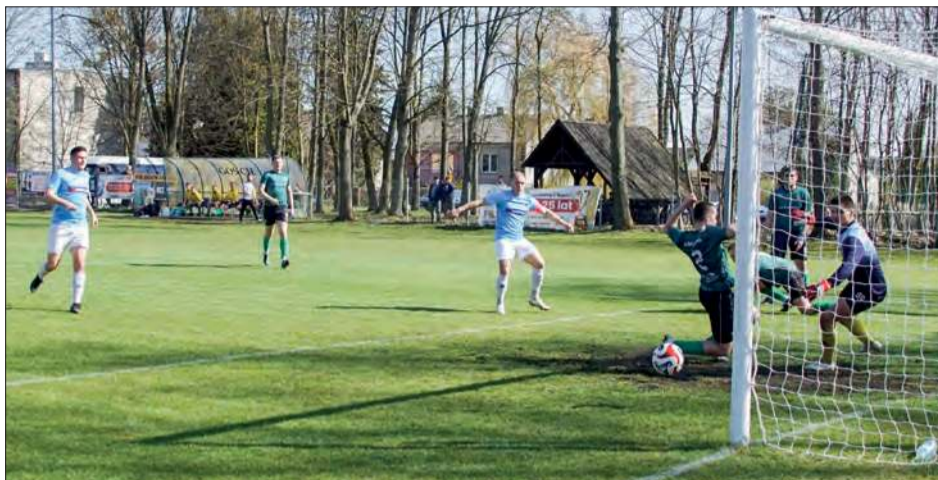
Amator Leopoldów/Rososz remisując 4:4 z LZS-em Poniatowa Wieś zdobył pierwszy punkt na wiosnę

zdołany przez piłkarzy Amatora Leopoldów/Rososz, to zdecydowanie poniżej oczekiwań kibiców i samych piłkarzy Amatora. Tym bardziej, że po pierwszej połowie Amator prowadził 3:1 i wydawało się, że ma ten mecz już pod swoją kontrolą. Niestety, na drugą połowę obie drużyny wyszły jakby odmienione. Goście z Poniatowej mocniej zaczęli atakować, a gospodarze cofnęli się i tylko sporadycznie przechodzili do ataku. W grze Amatora było coraz więcej nerwowości i chaosu, co wykorzystywali przyjeźdźni, którzy konsekwentnie strzelali kolejne gole. Kiedy