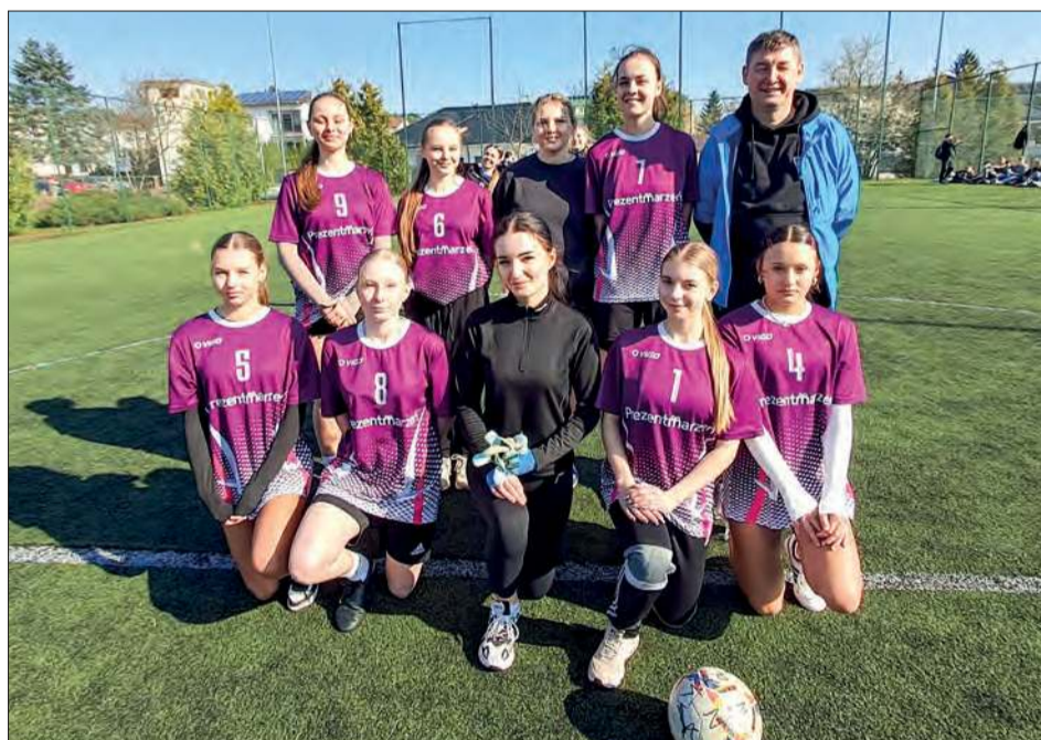
Piłkarki ZSZ 2 Ryki - mistrzyni powiatu ryckiego w zawodach szkolnych szóstek piłkarskich

Drużyna ZSZ nr 2 w Rykach zajęła pierwsze miejsce w powiatowych mistrzostwach powiatu ryckiego szóstek piłkarskich szkół średnich