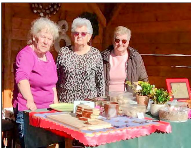
☛ O świąteczny klimat zadbały panie z KGW z Tradycją w Ułężu