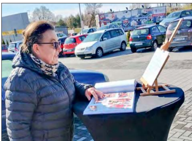
☛ Przy okazji kiermaszu zwiedzający i klienci mieli okazję zapoznać się z działalnością lokalnych społeczniczek