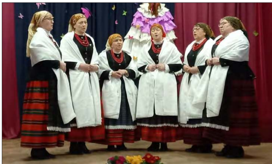
➤ Panie z Czernica uzyskały nominację do Lublina m.in. śpiewając dawną pieśń wielkopostną

Z gminy Ryki w eliminacjach wzięły udział Zespół Śpiewaczy „Moszczaniani” z Moszczanki oraz Zespół „Karczmiska” z Leopoldowa. Gminę Kłoczew