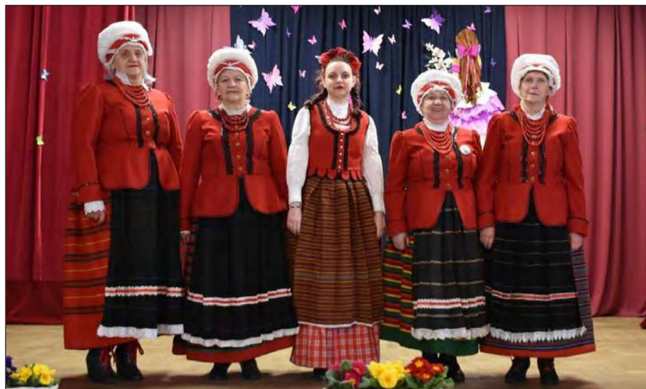
➤ Jako jedyny zespół śpiewaczy z gminy Ryki na eliminacjach wojewódzkiego festiwalu kapel zakwalifikowały się „Moszczaniani” z Moszczanki