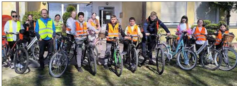
☛ Po zajęciach teoretycznych uczniowie wyruszyli spod swojej szkoły na zajęcia praktyczne