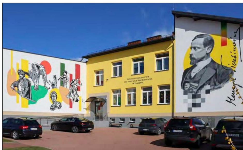
➤ Mural przedstawia Henryka Sienkiewicza, patrona szkoły, oraz bohaterów jego najśłynniejszych powieści

Mural nie tylko wzbogaca przestrzeń wizualną placówki, ale także przypomina o literackim dziedzictwie i wartościach przekazywanych młodemu pokoleniu.