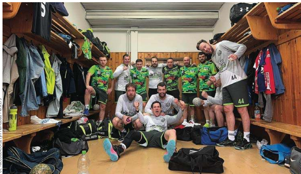
Olsztyńska szatnia po wygraniu słowackiego turnieju

Tyle że wtedy musiałby wybrać: liga czy mastersi, bo w Polsce nie można jednocześnie być mastersem i aktywnym ligowcem. - Na Słowacji ten przepis nie obowiązuje, dlatego w składach naszych ry-