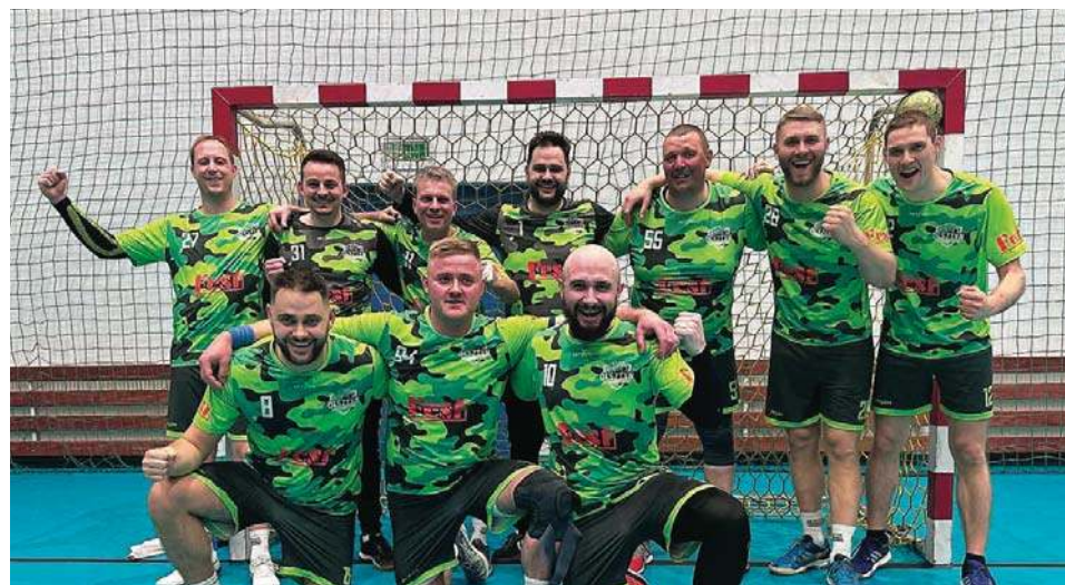
Turniej w Ostrołęce Olsztyn Handball Masters zakończył na trzecim miejscu