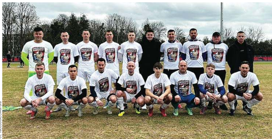
Gwardia Szczytno doznała pierwszej domowej porażki w obecnym sezonie