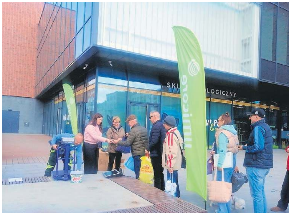
Kolejka chętnych do oddania drobnego sprzętu AGD, makulatury lub zużytych baterii ustawiła się jeszcze przed rozpoczęciem akcji.

Jeszcze przed oficjalnym rozpoczęciem akcji, na pasażu przed galerią Dekada utworzyły się kolejki chętnych do oddania surowców i ich wymiany na sadzonki. Zasady uczestnictwa w akcji były jasno sprecyzowane we komunikatach zapowiadających wydarzenie w Nysie: wystarczyło przynieść 5 kg makulatury, minimum 10 sztuk zużytych baterii lub drobny sprzęt AGD, aby otrzymać specjalny kupon na sadzonkę drzewa lub krzewu owocowego. Przyniesione surowce były na miejscu ważone i na tej podstawie