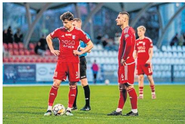
Runda wiosenna w wykonaniu Polonii Nysa zdecydowanie nie należy do udanych. Coraz mocniej grozi jej spadek

Kolejne niepowodzenie zanotowała natomiast Polonia