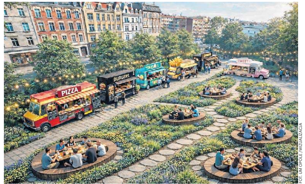
Na razie w Opolu to wciąż jedynie pomysł. Wiele zależy od tego, czy spotka się on z realnym zainteresowaniem mieszkańców.

Jeśli projekt spotka się z pozytywnym odbiorem, kolejnym krokiem byłoby stworzenie stałej strefy food trucków w bardziej reprezentacyjnej lokalizacji. Wśród rozważanych miejsc