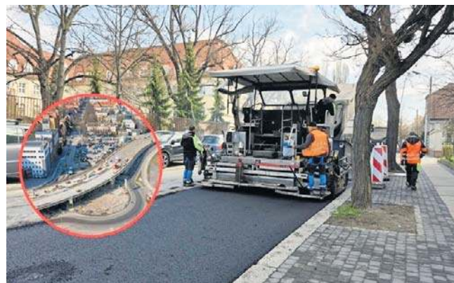
Po zakończeniu budowy estakady ulica Kośnego będzie włączona w nowy układ komunikacyjny centrum Opola.

Miniony tydzień upłynął dla mieszkańców ulicy Kośnego pod znakiem intensywnych prac remontowych na drodze, przy której mieszkają. Trwały między innymi roboty związane z asfaltowaniem jezdnii.