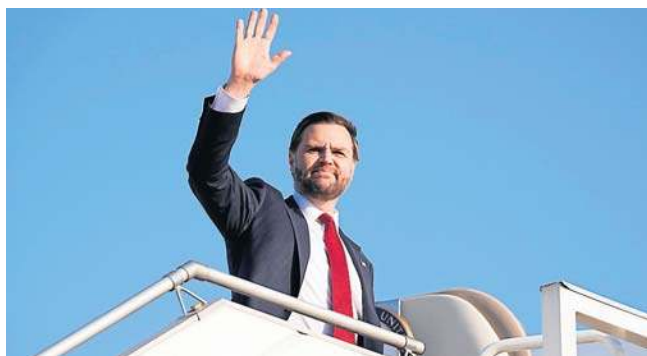
Wiceprezydent USA J.D. Vance opuścił w niedzielę Islamabad po fiasku rozmów z Iranem na temat pokoju na Bliskim Wschodzie

Prowadzone w sobotę w stolicy Pakistanu negocjacje pokojowe między Iranem a USA zakończyły się niepowodzeniem, co przyznały zarówno irańskie oficjalne media, jak i stojący na czele amerykańskiej delegacji wiceprezydent J.D. Vance. Delegacje obu krajów już wyjechały z Pakistanu. Wcześniej na konferencji prasowej Vance mówił, że „wraca do Stanów Zjednoczonych bez osiągnięcia porozumienia” po 21 godzinach