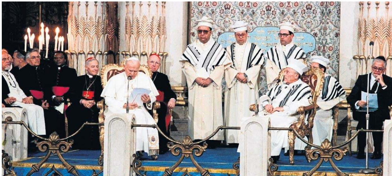
Przemawiając w synagodze, Jan Paweł II podkreślił, że nie można Żydom jako narodowi przypisywać żadnej dziedzicznej ani zbiorowej winy za to, co popełniono podczas męki Jezusa

Nim Jan Paweł II wygłosił swoje przemówienie, głos zabrał gospodarz - rabin Toaff. Witając gości zauważył, że „Kościoł w sposób radykalny zmie-