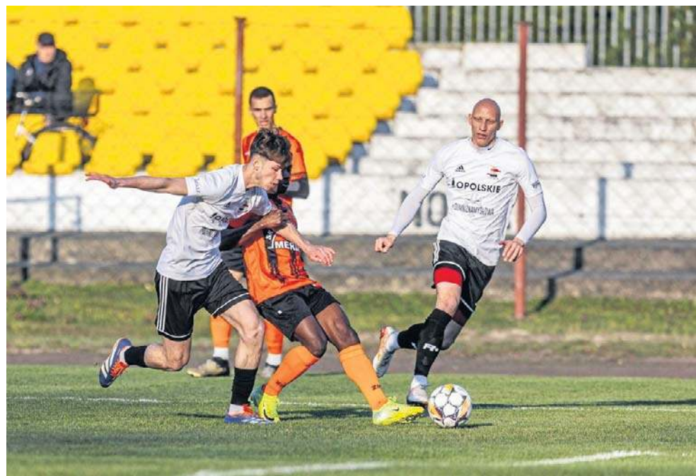
O wyniku meczu w Namysławie przesądził jeden gol, autorstwa miejscowego Startu

Poza tym, po trzy punkty do swojego konta dopisały jeszcze LZS Walce (3-0 z Po-Ra-Wiem Większyce), Śląsk Łubniani (2-0 z LZS-em Starościan)