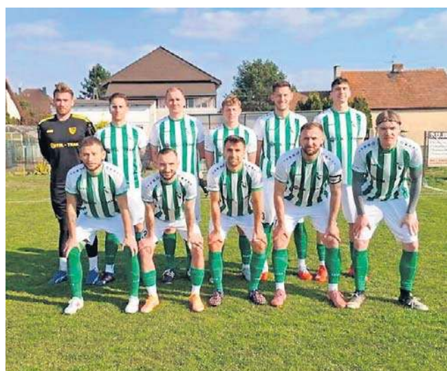
LZS Mechnice miał powody do zadowolenia. W 21. serii gier okazał się bowiem lepszy od Skalnika Gracze