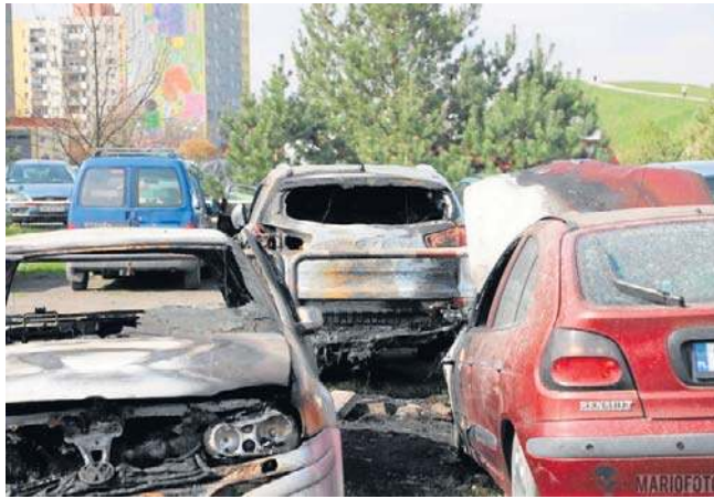
Dwa samochody spłonęły doszczętnie, natomiast cztery zostały poważnie uszkodzone.

Nowa Trybuna Opolska bok.prenumerata@polskapress.pl prenumerata.nto.pl