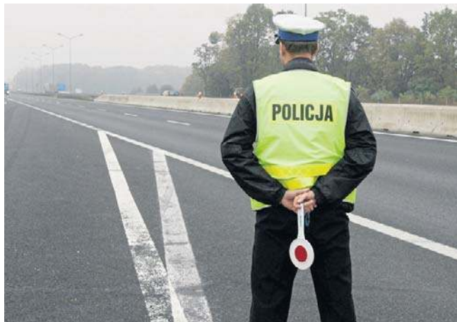
FOT. ZDJĘCIE ILLUSTRACYJNE

- Mężczyzna nie chciał rozmawiać z funkcjonariuszami i odjechał ze swojej posesji. Tak rozpoczął się pościg za nim - re-