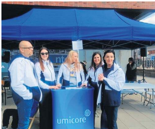
Partnerem sobotniej akcji nto, podobnie jak wielu innych organizowanych w Nysie, była firma Umicore.

Niezwykle udaną sobotnią edycję naszej redakcyjnej akcji: „Drzewko za surowce wtórne” czeka jeszcze podsumowanie. Po zważeniu zebranych elektrośmieci i makulatury do wiemy się, ile w sumie zebrano surowców wtórnych. Informację taką znajdziecie w przyszłym tygodniu na portalu nto.pl, tam także dostępna jest galeria zdjęć z sobotniej akcji w Nysie. ©©