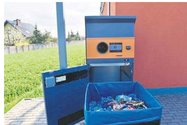
Butelkomat z Opola jest teraz znany w całym kraju.

- Z mojego punktu widzenia to napędza sprzedaż. Ludzie