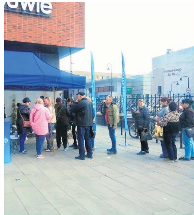
Na zainteresowanych czekała pula 1000 sadzonek różnych drzew i krzewów owocowych.

wtórne”, w którym bierzemy udział wspólnie z nto i galerią Dekada, i bardzo się cieszę, że mieszkańcy Nysy biorą w niej tak liczny udział - powiedziała nam Alicja Stafford, menadżerka ds. komunikacji w firmie Umicore. - Ten projekt w naturalny sposób łączy się z tym, czym Umicore zajmuje się na co dzień: w Nysie produkujemy materiały do baterii wykorzystywanych