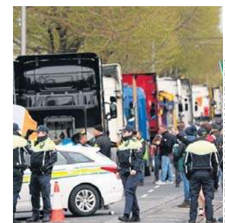
Protesty spowodowały poważne zakłócenia w ruchu w Dublinie i pozbawiły paliwa około jednej trzeciej stacji

Rząd odmówił bezpośrednich negocjacji z protestującymi, wśród których są rolnicy i kierowcy, prowadzi jednak rozmowy z grupami reprezentującymi sektor rolniczy i transportowy na temat środków mających na celu złagodzenie skutków wzrostu cen paliw. PAP