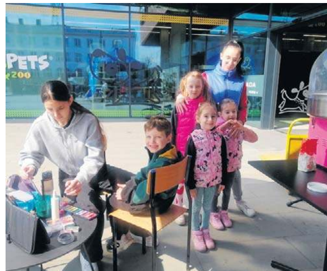
Dla najmłodszych Nysan, mniej zainteresowanych naszą akcją, czekały inne atrakcje.