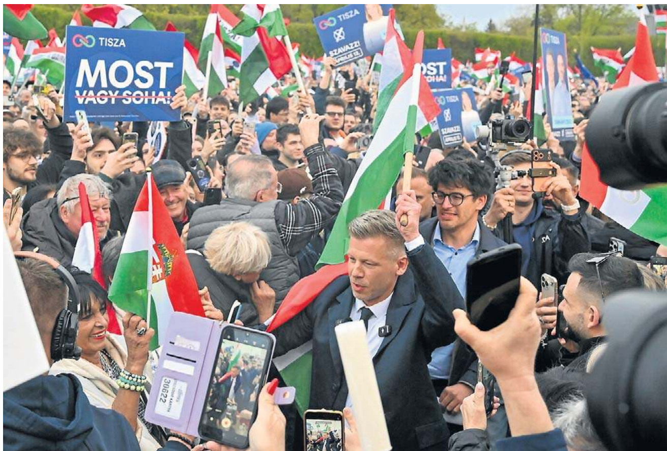
Oficjalne i całkowite wyniki wyborów na Węgrzech mogą zostać ogłoszone nawet pod koniec przyszłego tygodnia

Ważnym elementem węgierskiego systemu wybor-