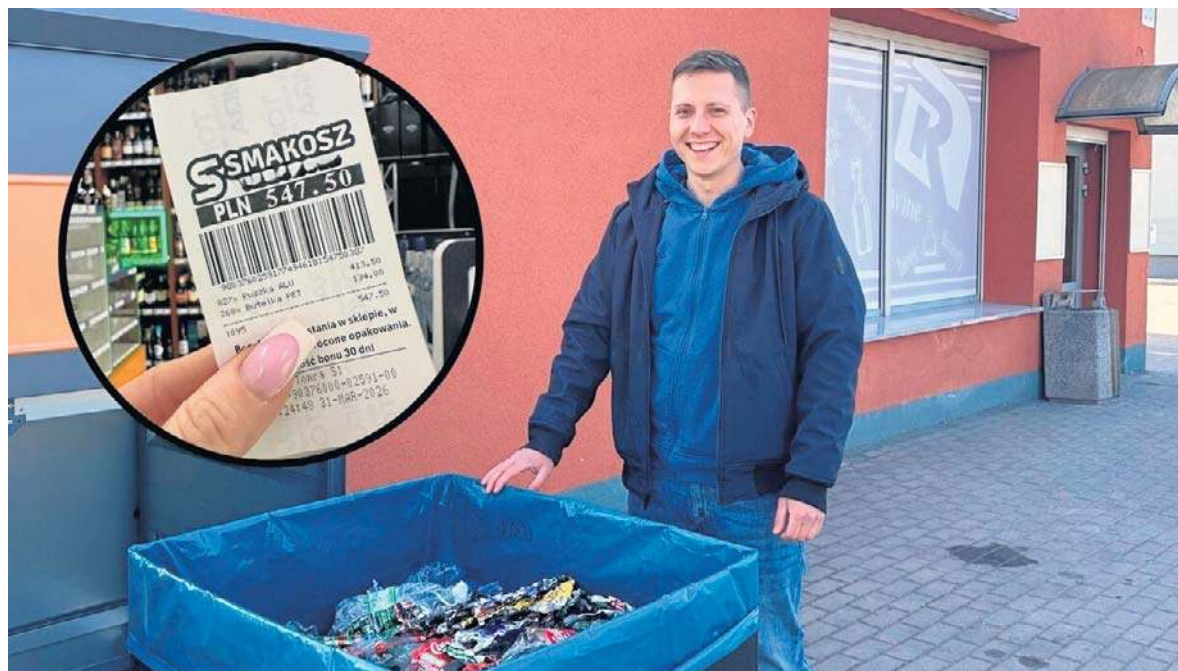
Właściciel sklepu kibicował przyszłemu rekordzistom podczas oddawania opakowań.

Drzewko za surowce wtórne. W sobotę rozdaliśmy w Nysie tysiąc sadzonek drzew i krzewów str. 11