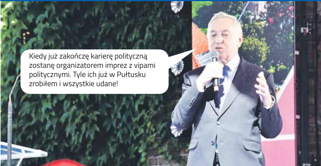
FOTO NA WESOŁO

Kiedy już zakończę karierę polityczną zostanę organizatorem imprez z vipami politycznymi. Tyle ich już w Pułtusk zrobiłem i wszystkie udane!