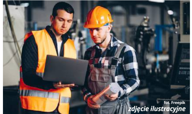
zdjęcie ilustracyjne

Kończy się już powoli dotychczasowy model finansowania samorządów lokalnych, które zachęcane są przez rządzących do tego, aby poszukiwać jednak coraz więcej źródeł dochodów i wpływów do budż-