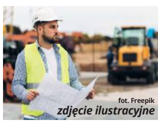
zdjęcie ilustracyjne

Tylko władze gminy wiedzą, ile wysiłków, zabiegów i negocjacji wymagało ustalenie szczegółów inwestycji polegającej na wybudowaniu w pasie drogi wojewódzkiej nr 812 chodnika dla pieszych. To arteria, która łączy ze sobą Białą Podlaską, Wisznice, Włodawę, Chełm, Rejowiec, Krasnystaw. Mieszkańców gminy interesuje jednak najbardziej ulica Chełmska i chodnik, który poprawiłby znacznie poziom bezpieczeństwa osób, które w tym rejonie pojawiają się najczęściej.