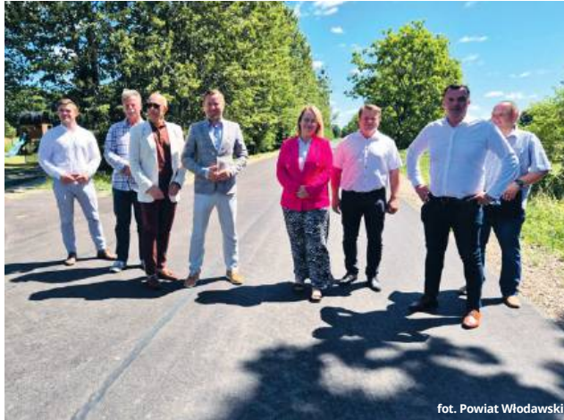
fol. Powiat Włodawski

W Orchówku zrealizowano przebudowę fragmentu drogi prowadzącej od skrzyżowania z drogą wojewódzką do terenu byłej fabryki Sco-Pak. Odcinek o długości ponad 2,1 km został przebudowany kosztem 3 304 177,73 zł. Zadanie obejmowało kompleksową modernizację nawierzchni i dostosowanie parametrów technicznych do obowiązujących standardów. W odbiorze technicznym