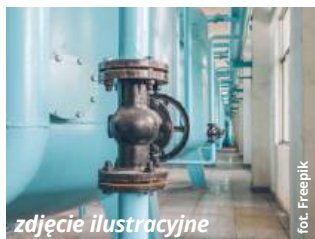
zdjęcie ilustracyjne

Mówiąc o szczegółach inwestycji, wójt Zdzisław Krupa przypomniał o tym, że obowiązujące przepisy zobligowały urząd do podzielenia całego przedsięwzięcia na trzy odrębne zadania. Dwa z nich dotyczą budowy nowych odcinków sieci