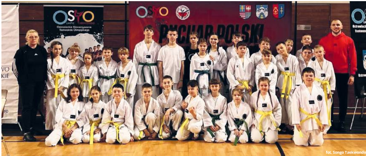
fol. Songo Taekwondo