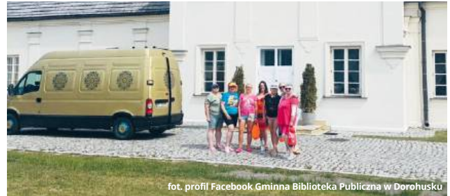
Obie instytucje mają swoją siedzibę w pałacu Suchodolskich