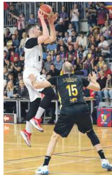
Skuteczność tym razem nie była mocną stroną polonistów

Pierwsza kwarta sobotniego starcia pokazała, że Legion to bardzo wymagający i dobry przeciwnik. Goście zwyciężyli 24:22. W kwarcie drugiej Polonia mozołnie, punkt po punkcie odrabiała małą stratę i zdołała nawet dorzucić punkt przewagi - wygrała 29:26. Kwarta trzecia znowu dla przyjezdnych - 25:22, co oznaczało, że znowu wyszli oni na dwupunktowe prowadzenie.