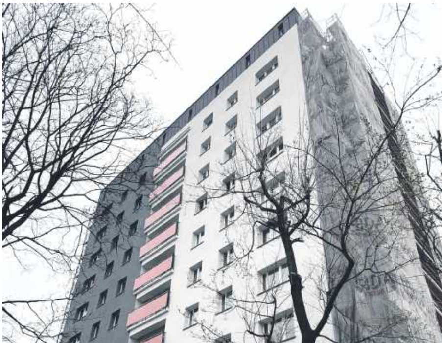
Efekty termomodernizacji wieżowca przy Szkolnej 10 robią wrażenie