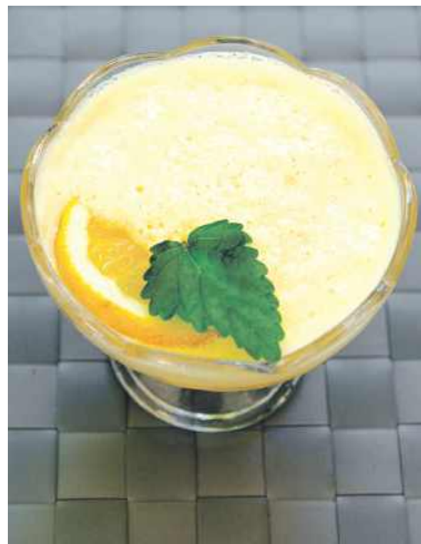
Citronszpajza to fest maszket

Na srogich fajerach szpajzy dowoło sie na stół po ło biedzie. Te sroge fajery, to może być komunio, wesele, chrzciny, abo ło dpust. U moji babki na ło dpuscie we czyrwcu zowdy boła citronszpajza, abo szpajza ze podzimkami. Na zdjyn-