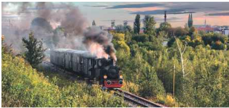
Wagoniki kolejki wąskotorowej ciągnie między innymi zabytkowy parowóz

Jest ona bez wątpienia jedną z największych turystycznych atrakcji naszego miasta oraz całego regionu. Każdego roku tłumnie i najczęściej całymi rodzinami obiegają ją miłośnicy kolei, dobrej zabawy i historii. W tym roku będzie zapewne podobnie. O atrakcje postarają się członkowie wspomnianego Stowarzyszenia,