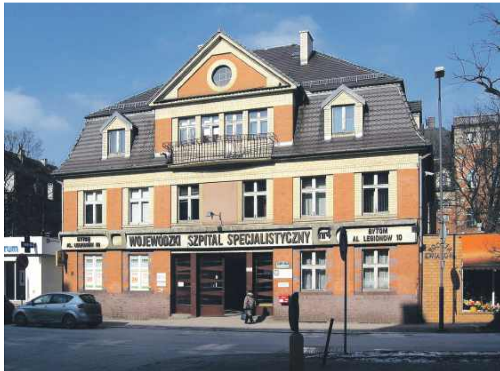
Jeden z punktów funkcjonuje w szpitalu przy alei Legionów

Natomiast porada specjalisty, jeśli chcemy skorzystać z niej prywatnie, kosztuje nawet 300 zł, ale też nie otrzymamy ją ad hoc. Wiele osób zwyczajnie nie może sobie pozwolić na taki wydatek i po prostu nie korzysta z pomocy. A często to jedyny sposób, aby lepiej się czuć i zacząć cieszyć się życiem. Ale nie załamujmy się, bo na szczęście jest też trzecia możliwość. I to w naszym mieście! Wojewódzki Szpital Specjalistyczny nr 4 przy al. Legionów oferuje wam pomoc za darmo i to bez kolejki.