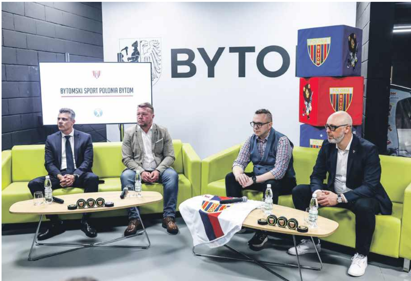
Konferencję poświęconą wejściu Polonii do THL zorganizowano na Lodowisku im. Braci Nikodemowiczów