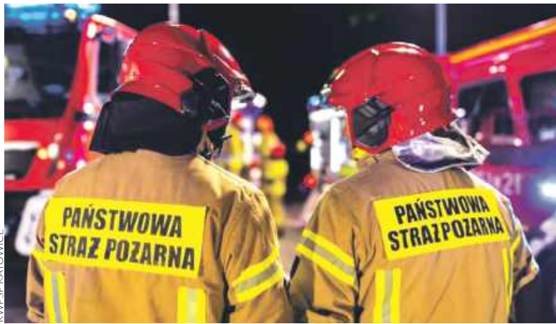
Ponad dwie godziny trwała akcja strażaków po wybuchu przy Wojciechowskiego

W chwili zdarzenia kobieta była w mieszkaniu razem z trójką dzieci w wieku od 2 do 5 lat. Na szczęście cała czwórka nie odniosła żadnych ran, a jedynie najadła się strachu i przerażenia głośnym hukiem oraz jego skutkami. Wywołany eksplozją podmuch wyrwał z framug drzwi łazienkowe i wybil