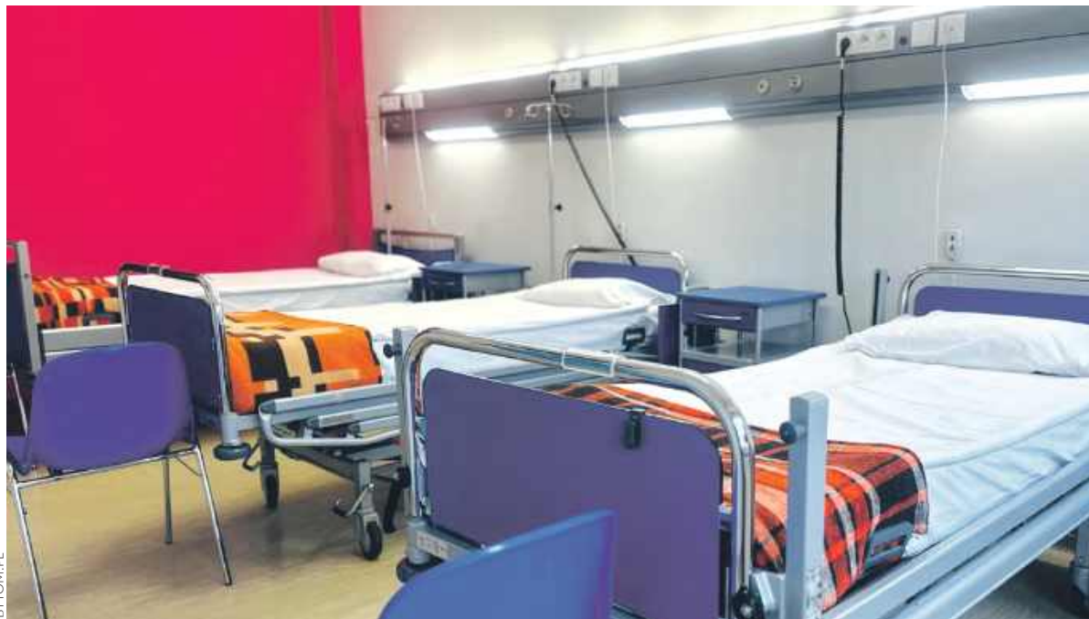
Szpitalne sale dla pacjentów nabrały przyjemnych kolorów. Zdaniem lekarzy ma to spore znaczenie w procesie leczenia

ŚRÓDMIEŚCIE. RÓŻOWE FARBY NA ŚCIANACH, KOLOROWE FOTELE DLA PACJENTÓW, PRZYJEMNE I CIEPŁE ŚWIATŁO, A DO TEGO NOWOCZESNE URZĄDZENIA: TE WSZYSTKIE ELEMENTY POJAWIŁY SIĘ NA ODDZIALE HEMATOLOGII BYTOMSKIEGO SZPITALA SPECJALISTYCZNEGO NR 1 PRZY ULICY ŻEROMSKIEGO. TO EFEKT MODERNIZACJI ZREALIZOWANEJ PRZY WSPARCIU FUNDACJI DKMS.