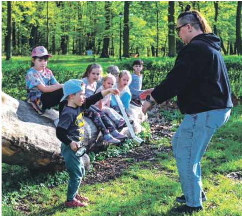
Dzień Ziemi świętowano między innymi w sąsiedztwie Pałacu w Miechowicach

Obok Pałacu stanął namiot edukacyjny, w którym poprzez gry i zabawy najmłodszy uczestnicy warsztatów dowiedzieli się, jak prawidłowo segregować odpady i oszczędzać kurczące się zasoby naturalne. Poza tym uczyli ich, jak sadzić rośliny na balkonach i zapewnić roślinom korzystne warunki do życia w mieszkaniach. Wielką atrakcją był przyjazd wielkiej śmieciar-