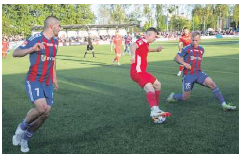
Polonia wróciła na drugie miejsce w tabeli

To bardzo ważne zwycięstwo. Cieszy tym bardziej, że ciągle prowadząca