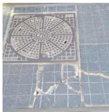
Takich uszkodzeń na Katowickiej jest sporo

Długo wyczekiwana przez mieszkańców, zwłaszcza tych zmotoryzowanych modernizacja ul. Katowickiej