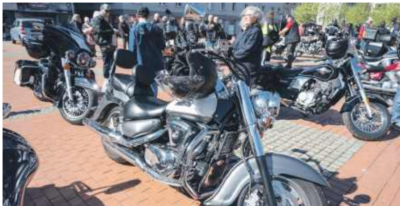
Maszyny pięknie lśniły w słońcu