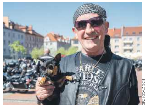
Pies na motorze? Czemu nie