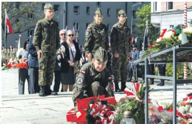
3 maja czekają nas oficjalne ceremonie u stóp Pomnika Wolności