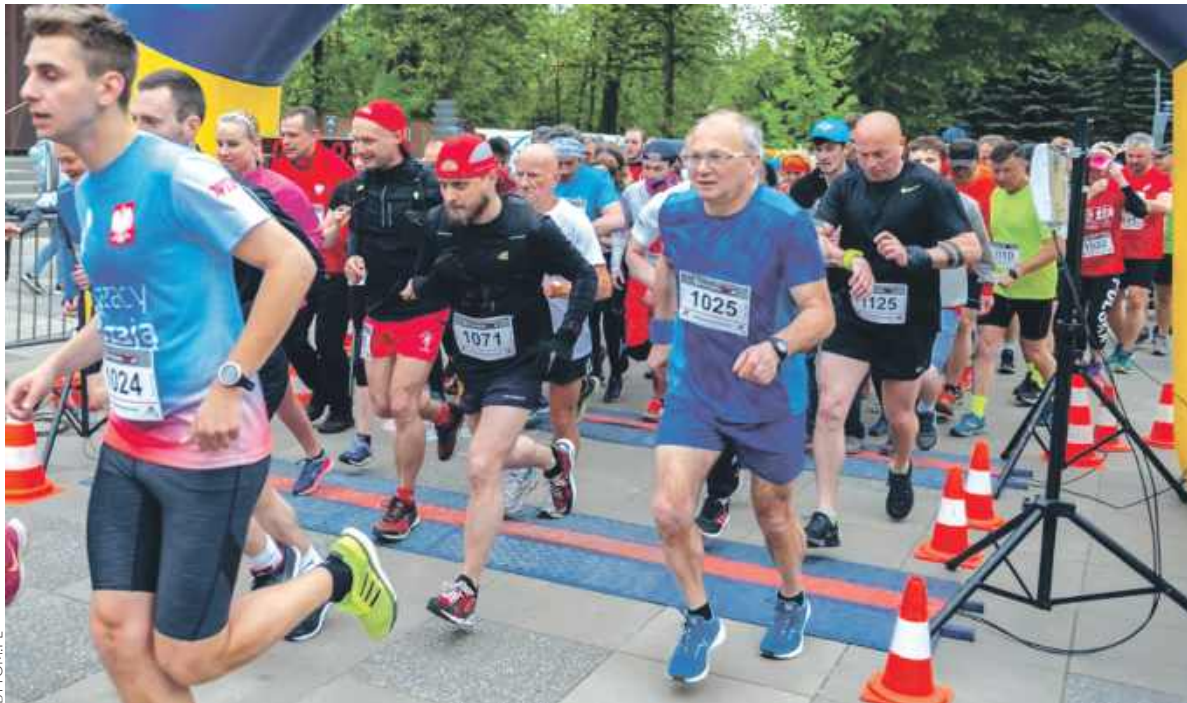
Aktywni uczczą narodowe święto w biegu

Głodny nikt z pikniku nie wyjdzie, bo pojawi się szereg punktów gastronomicznych. Piknikowicy będą towarzyszyć także występy artystyczne dzieci z Młodzieżowych Domów Kultury nr 1 i 2 oraz Studia Baletowego Opery Śląskiej. Maluchy, które chcą spotkać się na żywo z prezydentem miasta będą miały do tego okazję. Natomiast miłośnicy teatru będą mogli obejrzeć przedstawienie przedstawienie w wykonaniu artystów Teatru Rozbark oraz występ chóru „Wrzosa Jesieni” i Zespołu Studio Piosenki 60+. A co dla miłośników sporu? Uczeszą oni Święto Konstytucji 3 Maja biegiem po parkowych alejkach.