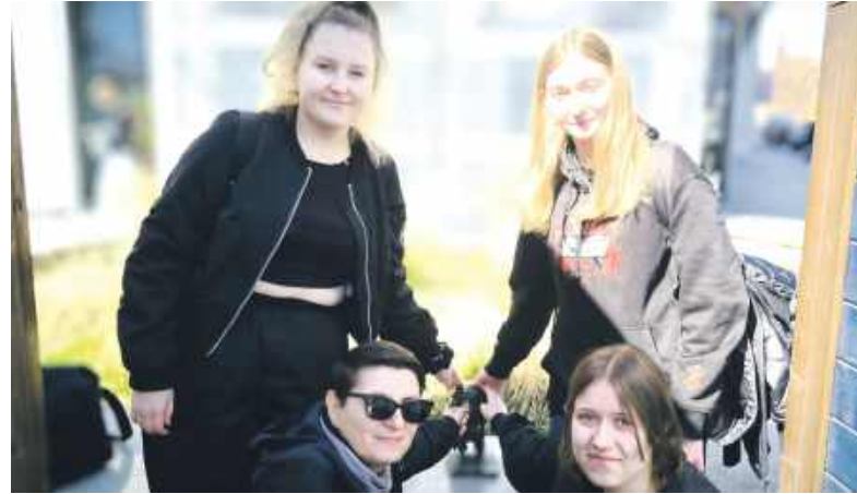
Młode bytomskie geodetki i ich nauczycielka

Naszym poszło bardzo dobrze. Reprezentacja szombierskiej szkoły uplasowała się drużynowo na 8. miej-