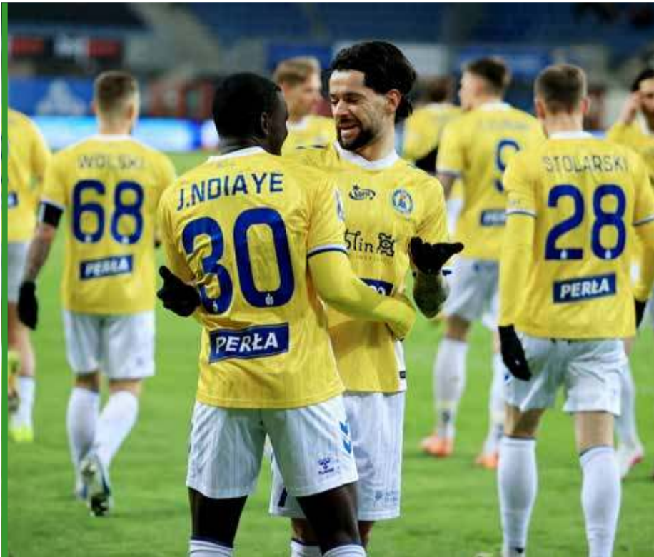
Koleczy z zespołu nie dowierzali, ale gol to gol...