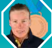
3. SANDRA NAESLUND Szwecja

4. Marielle Berger Sabbatel (Francja), 5. Talina Gantenbein (Szwajcaria), 6. Jade Grillet Aubert (Francja), 7. Sixtine Cousin (Szwajcaria), 8. Jole Galli (Włochy)