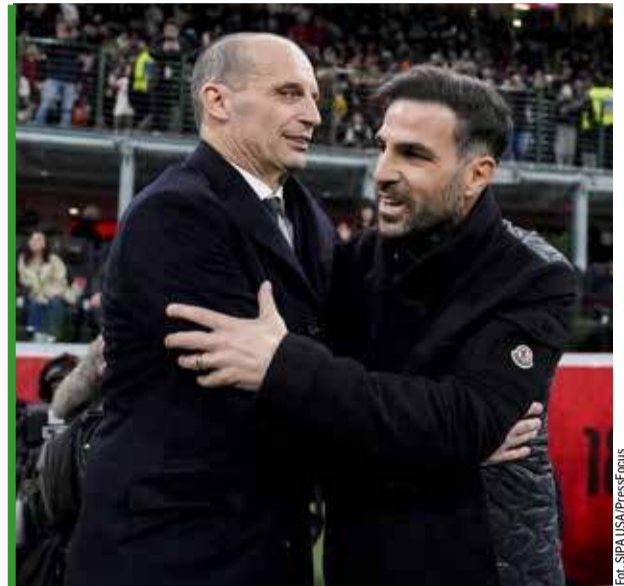
Patrząc na przedmeczowe „przytulasy” obu panów, ich zachowanie wobec siebie w trakcie i po spotkaniu jawi się zupełnie irracjonalnym!

To nie było pierwsze starcie pomiędzy tymi tre-