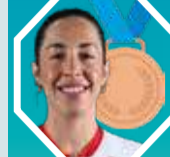
3. VALERIE MALTAIS Kanada 1:54,40

4. Brittany Bowe (USA) 1:54,70, 5. Femke Kok (Holandia) 1:54,79, 6. Miho Takagi (Japonia) 1:54,865, 7. Jelizawieta Gotubiewa (Kazachstan) 1:54,868, 8. Ivania Blondin (Kanada) 1:54,93... 15. Natalia Czerwonka 1:56,96