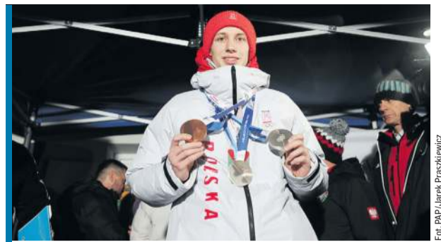
Gwiazdą mistrzostw Polski będzie trzykrotny medalista olimpijski, Kacper Tomasiak.