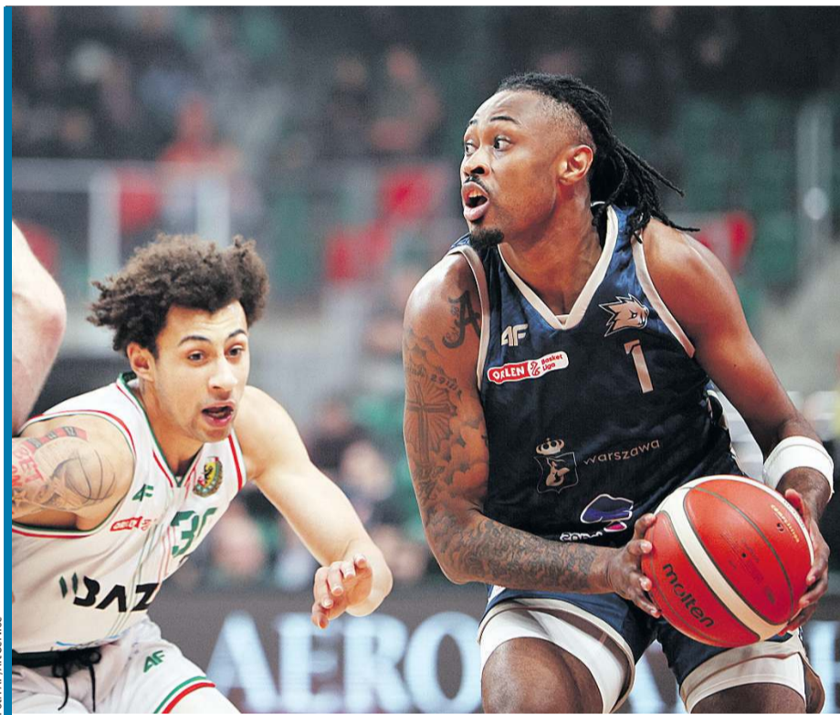
Śląsk pokonał Dzikie głównie dzięki świetnej drugiej kwarcie.