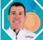
3. QUENTIN FILLON MAILLET Francja 25,6

4. Philipp Horn (Francja) 35,5, 5. Vette Sjaastad Christiansen (Norwegia) 1:48,1, 6. Michal Krčmar (Czechy) 2:03,6, 7. Philipp Nawrath (Niemcy) 2:05,3, 8. Johan-Olav Botn (Norwegia) 2:07,4