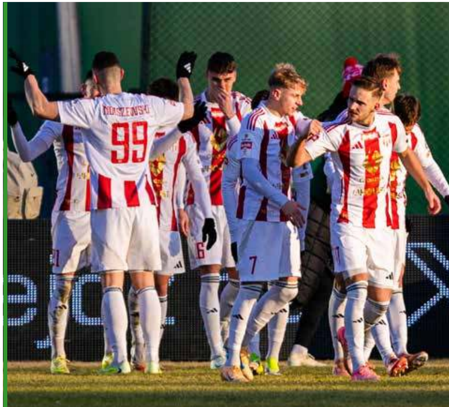
Do takich obrazków kibice z Grodziska Mazowieckiego zdążyli się przyzwyczać.