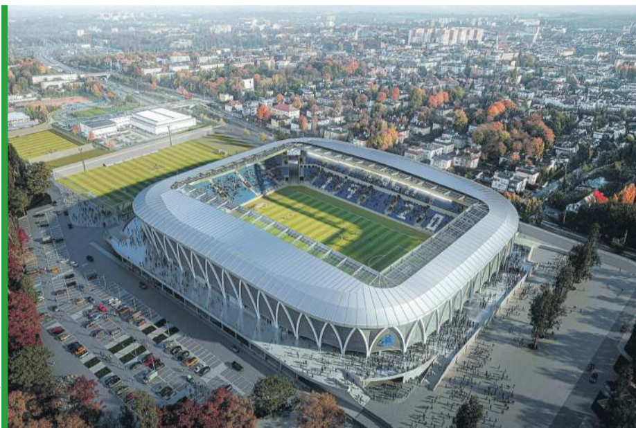
Czy w przyszłym roku ruszą prace nad pierwszą trybuną, tą z napisem „RUCH 1920”?

Co wiemy po wczorajszym ogłoszeniu? Zgodnie z wstępnymi założeniami, cała inwestycja będzie prowadzona etapami, a miej-