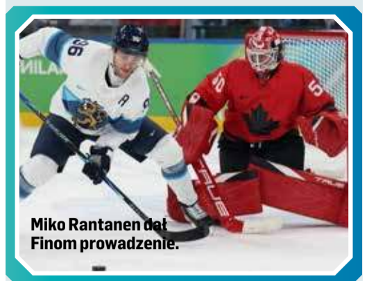
Miko Rantanen dał Finom prowadzenie.