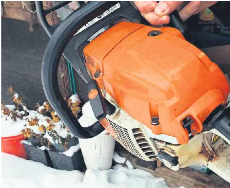
Policjanci odzyskali skradzioną piłę i butlę gazową, a po skradzionym winie pozostał tylko pusty gąsior.

w tym tygodniu. Przedstawiono mu zarzuty dotyczące serii kradzieży w krótkim odstępie czasu. Jego łupem padły m.in. piła spalinowa oraz butla gazowa. Jednak najbardziej dotkliwą stratą dla okradzonego właściciela okazała się utrata 35 litrów domowego wina – policjanci podczas rewizji odnaleźli gąsior, ale był już całkowicie pusty.