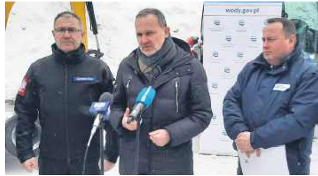
Jest to sprzęt, który w sytuacji kryzysowej będzie można wykorzystać do tego, aby chronić mienie, a także życie ludzkie – mówił podczas konferencji prasowej Krzysztof Hetman, poseł do Parlamentu Europejskiego.

– Tylko w ten sposób można realnie poprawiać poziom bezpieczeństwa. Działania RZGW w Lublinie wpisują się w strategię wzmacniania odporności państwa – mówił Krzysztof Hetman, podkreślając podwójne zastosowanie zakupionego wyposażenia: do