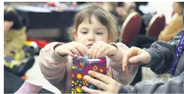
W pomaganiu włączyli się dorośli i dzieci.

Bełżec zebrał 8 982,89 zł. To więcej niż rok temu – 8 481,37 zł. Od rana 25 stycznia na terenie gminy Bełżec w zbórkę pieniędzy do puszek WOŚP zaangażowanych było siedmiu wolontariuszy. W Gminnym Ośrodku Kultury (siedziba sztabu) bez przerwy coś się działo. Publiczność oglądała występy: zespołu Bełżusie, grupy wokalne dzia-