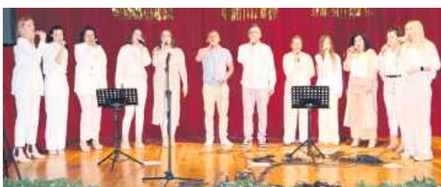
Chór Krasnobrodzki Gospel.

W niedzielne popołudnie 25 stycznia sala widowiskowa Krasnobrodzkiego Domu Kultury wypełniła się po brzegi. Świąteczny koncert kolędowo-jasełkowy zgromadził liczną publiczność i wykonawców reprezentujących różne pokolenia, od najmłodszych dzieci po doświadczonych muzyków.