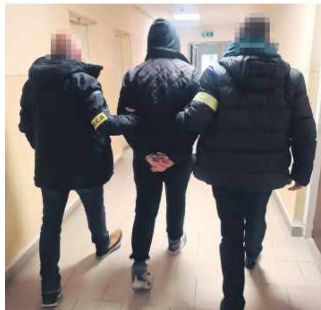
19-latek z Zamościa został tymczasowo aresztowany za usiłowanie rozboju na pracownicy sklepu.

Sprawą natychmiast zajęli się zamajscy policjanci pionu kryminalnego, którzy intensywnie prowadzili czynności zmierzające