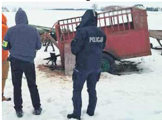
Na miejscu funkcjonariusze zastali 16 psów w stanie skrajnego wycieńczenia.

Większość psów była uwiązana na krótkich, poskręca-