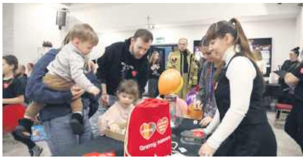
Na zdjęciu finał WOŚP w GOK-u w Bełżcu.

W powiecie działało kilka sztabów: największy w Tomaszowie Lubelskim (miał blisko setkę wolontariuszy), a także w Suścu, Lubyczy Królewskiej,