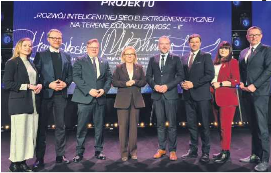
Podpisanie umowy na dofinansowanie projektu.

– Od dwóch lat mówimy, że Polska jest jednym wielkim energetycznym placem budowy – i to wcale nie jest przesada. Od