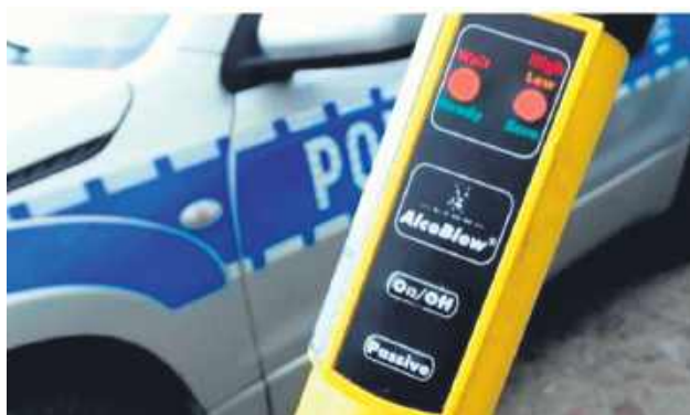
Kierowca Volkswagena był trzeźwy, jednak ma zaledwie 13 lat. Natomiast pasażer siedzący obok kierowcy – jego ojczym – jechał z nastolatkiem pijany jak bela.

Niecodzienna i skrajnie niebezpieczna sytuacja na drogach gminy Hrubieszów. 27 stycznia policjanci z hrubieszowskiej drogówki zatrzymali Volkswagena, którym kierował 13-letni chłopiec. Rolę „opiekuna” na przednim siedzeniu pełnił jego kompletnie pijany ojczym.