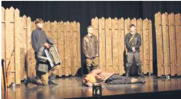
Inicjatywa miała na celu upamiętnienie 70. rocznicy aresztowania „Wrzosa” oraz popularyzację historii wśród mieszkańców regionu.