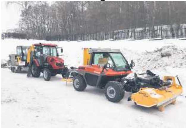
Łączna wartość zakupów wyniosła 3,02 mln zł.

Regionalny Zarząd Gospodarki Wodnej w Lublinie zaprezentował nowy sprzęt zakupiony w ramach Programu Ochrony Ludności i Obrony Cywilnej. Konferencja prasowa odbyła się 23 stycznia przed Obiektem Hydrotechnicznym RZGW przy zbiorniku w Nieliszu. Zakupy zostały sfinansowane ze środków programu i mają wzmocnić zdolności reagowania w sytuacjach kryzysowych, w tym podczas zagrożenia powodziowych.