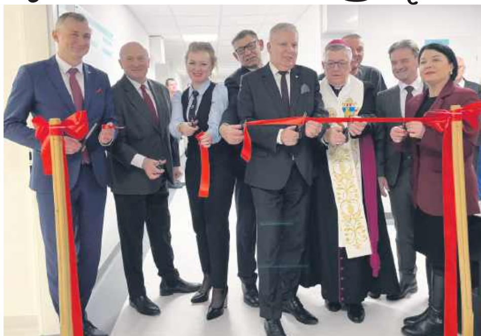
Symboliczne otwarcie Oddziału Chirurgii Ogólnej i Onkologicznej po modernizacji.

Wydarzeniu uczestniczył marszałek województwa lubelskiego wraz z przedstawicielami samorządu województwa, dyrekcja szpitala oraz zaproszeni goście. Spotkanie było okazją do zaprezentowania efektów inwestycji, które