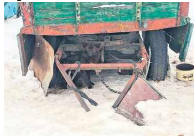
Głodzone, uwiązane na krótkich łańcuchach i „chronione” przed mrozem arkuszami blachy lub szybą samochodową – tak wyglądała codzienność 16 psów na jednej z posesji w gminie Mirce.

– Sytuacja jest bardzo dramatyczna, żadne zwierzę na pewno nie zasługuje na takie traktowanie, na takie warunki bytowe, jak miało to stado zwierząt, zwłaszcza że od początku stycznia mamy bardzo niskie temperatury. Psy w ogóle nie były w żaden sposób zabezpieczone przed chłodem, mrozem i innymi skrajnie wycieńczającymi warunkami atmosferycznymi. Nie miały dostępu do czystej wody, w miskach nie miały w ogóle nic do jedzenia. Później, w trakcie interwencji, rzucono im jakieś „trociny”, tzn. zmielone zboże, chyba śrutę. Psy zostały strategicznie uwiązane „na krótko” w różnych miejscach, tak by chroniły dobytek. Jeden był uwiązany pod ciągnikiem, drugi pod ciągnikową przyczepą. Aż trudno sobie wyobrazić, ile te zwierzęta musiały wycierpieć