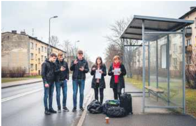
Klienci wpłacali należność na wskazane konto bankowe, a w ustalonym dniu oczekiwali na przyjazd busa. W wielu przypadkach bus jednak nie przyjechał, a kontakt telefoniczny z właścicielem lub przedstawicielami firmy urywał się.

Narazie trudno powiedzieć, od kiedy firma z Werbkowic zajmowała się tym procederem. Zapewne to oraz inne okoliczności ustali Prokuratura Rejonowa w Hrubieszowie, która połowic sierpnia zeszłego roku wszczęła dochodzenie w tej sprawie. Tymczasem nam udało się nieoficjalnie ustalić kilka oko-