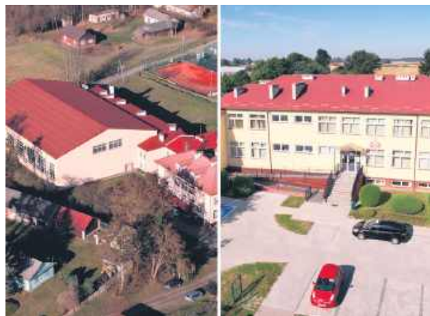
Zakończenie prac zaplanowano na październik 2026 roku.

Łączna wartość inwestycji wynosi 4 297 292,60 zł, z czego 3 493 733,82 zł stanowi pozyskane dofinansowanie.