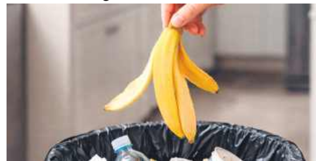
W 2026 roku opłaty za odpady w mieście Tomaszów są bez zmian.