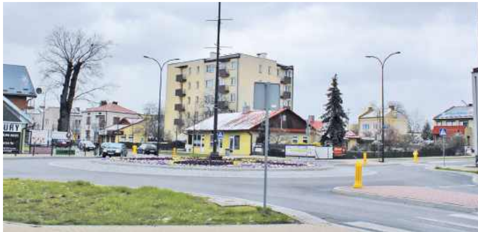
Nazwa ronda upamiętni bohaterów walczących w imię wolnej ojczyzny.