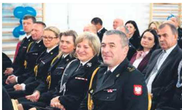
Spotkanie opłatkowe odbyło się już po raz 17.

Nie zabrakło także tradycyjnego przełamania się opłat-