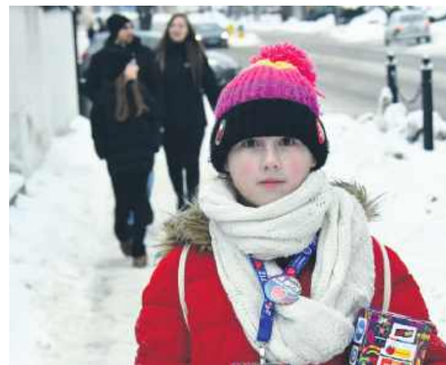
Dziewczynka już po raz trzeci jest rekordzistką biłgorajskiego sztabu.