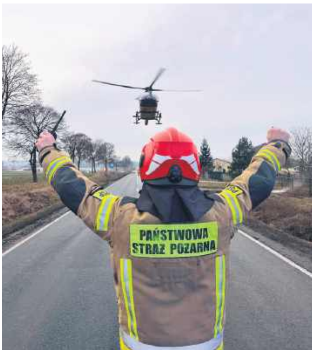
Strażackie statystyki za 2025 r. dla powiatu hrubieszowskiego ujawniają pewien paradoks – z jednej strony widać spadek ogólnej liczby zdarzeń (o blisko 7 proc.), a z drugiej strony dane dotyczące ofiar śmiertelnych i rannych są alarmujące.

Az 77 proc. wszystkich interwencji stanowiły tzw. miejscowe zagrożenia (695 wyjazdów). To szeroki wachlarz działań: od