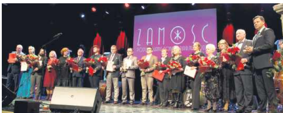
Gala „Podsumowania Roku Kulturalnego 2025”.

Medal Złoty za Długoletnią Służbę, wzorowe i wyjątkowo