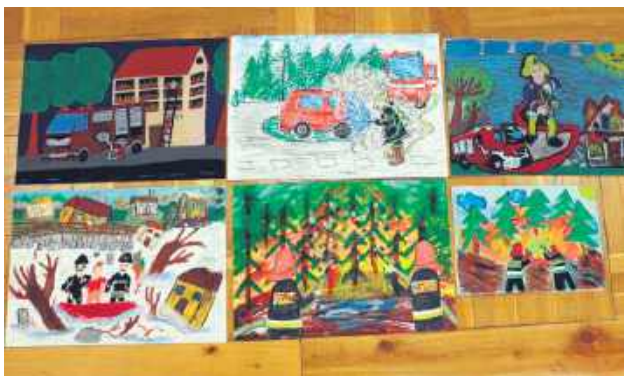
Rysunki były na bardzo wysokim poziomie.