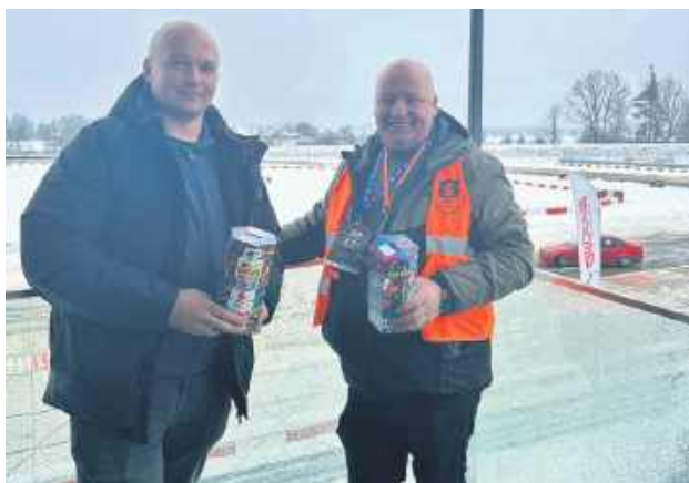
Pasja do motoryzacji połączyła się ze szczytnym celem.

Głównym punktem programu były widowiskowe jazdy po nitce toru oraz w strefie off-road. Odwiedzający mogli