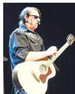
Dla uczestników uroczystości koncert zagrał Maciej Maleńczuk z zespołem.