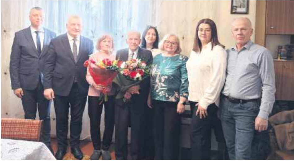
Setne urodziny mieszkańca gminy Biszczka.