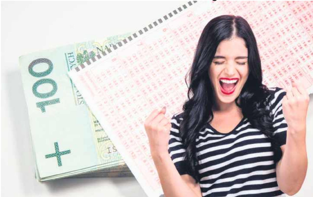
Gry hazardowe mogą być oferowane wyłącznie osobom pełnoletnim, a udział w nich jest dozwolony od 18. roku życia.

Z danych wynika, że w 2025 roku na Lubelszczyźnie odnotowano pięć wygranych przekraczających milion złotych, w trzech różnych grach liczbowych. W Zamościu padła wygrana w Lotto w wysokości 10,12 mln zł, w Nowej Woli (powiat puławski) w Lotto – 8,46 mln zł, w Górze Puławskiej w Ekstra Pensję – 1,2 mln zł, wypłacaną po 5 tys. zł miesięcznie przez 20 lat. W Puławach w Lotto Plus odnotowano wygraną 1 mln zł, a w Lublinie także 1 mln zł w Lotto Plus. Łącznie daje to 21,78 mln zł, które trafiły do graczy z regionu.