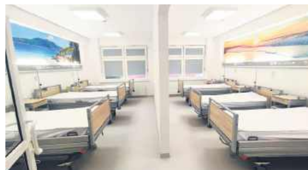
Oddział dysponuje obecnie 40 łózkami, w tym pięcioma przeznaczonymi do intensywnej opieki medycznej.

Zrealizowane inwestycje mają duże znaczenie dla całego regionu. Przyczyniają się do zwiększenia bezpieczeństwa zdrowotnego mieszkańców Zamojszczyzny, poprawy komfortu leczenia oraz jakości pracy personelu medycznego. Jak podkreślono podczas uroczystości, to element szerszego programu rozwoju placówki – w latach 2025-2026 w Szpitalu Wojewódzkim w Zamościu realizowane są zadania inwestycyjne o łącznej wartości około 15 mln zł, współfinansowane przez Zarząd Województwa Lubelskiego. sin