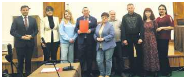
Miejska Rada Działalności Pożytku Publicznego jest organem opiniodawczo-doradczym, który wspiera współpracę samorządu z organizacjami pozarządowymi i sektorem społecznym.