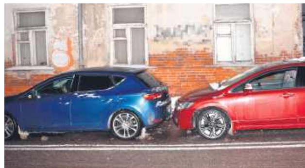
W wyniku kolizji kierowcy nie odnieśli obrażeń.

Policjanci ruchu drogowego ustalili, że obaj kierowcy jechali w kierunku ulicy Pił-