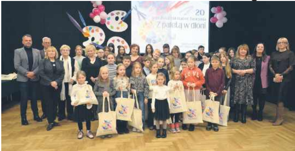
Nauczycielka ze swoimi wychowankami.

27 stycznia w Młodzieżowym Domu Kultury w Biłgoraju odbyła się uroczystość jubileuszu 20-lecia działalności pracowni plastycznej „Tęczowa Malarnia”. Wydarzeniu towarzyszyło otwarcie wystawy prac z cyklu „Radość Tworzenia” prezentującej twórczość wychowanków pracowni.