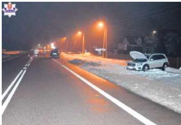
Niebezpieczne wyprzedzanie było przyczyną kolizji w Zawadzie.