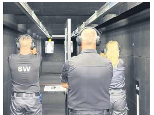
Ćwiczenia odbywały się na zamojskiej strzelnicy kontenerowej.

Szkolenie było związane z wprowadzeniem na wyposażenie Służby Więziennej nowego pistoletu 9 mm GLOCK 17. Funkcjonariusze zapoznali się z budową broni, zasadami jej obsługi oraz bezpiecznego użytkowania. Zajęcia miały zarówno charakter teoretyczny, jak i praktyczny.