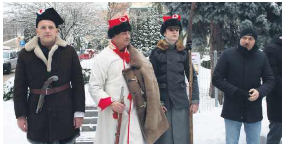
Zwienięciem spotkania była prezentacja uzbrojenia powstańców styczniowych, przygotowana przez Stowarzyszenie Moje Nowosiółki.