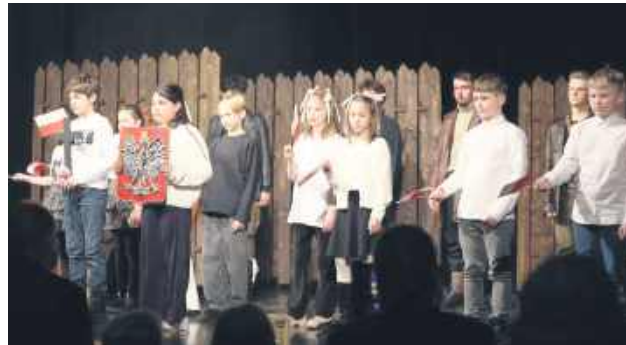
Wzruszający montaż słowno-muzyczny przygotowali uczniowie Szkoły Podstawowej nr 3 im. doktora Janusza Petera w Tomaszowie Lub.