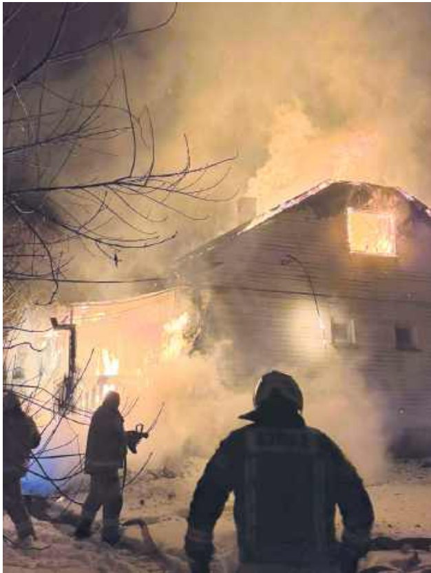
Dom 64-latka z Oszczowa (Gmina Dołhobyczów) spłonął doszczętnie. Poszkodowany w pożarze mężczyzna został przewieziony do szpitala.

Podobną notatkę sporządzili druhowie OSP w Hulczu: „Dnia 26.01.2026 r., o godzinie 23:54, zostaliśmy zadysponowani do pożaru domu jednorodzinnego w miejscowości Oszczów. Po przyjeździe na miejscu była już jednostka z OSP KSRG Dołhobyczów, dojechała jeszcze PSP Hrubieszów oraz OSP Przewodów. Wspólnymi siłami pożar