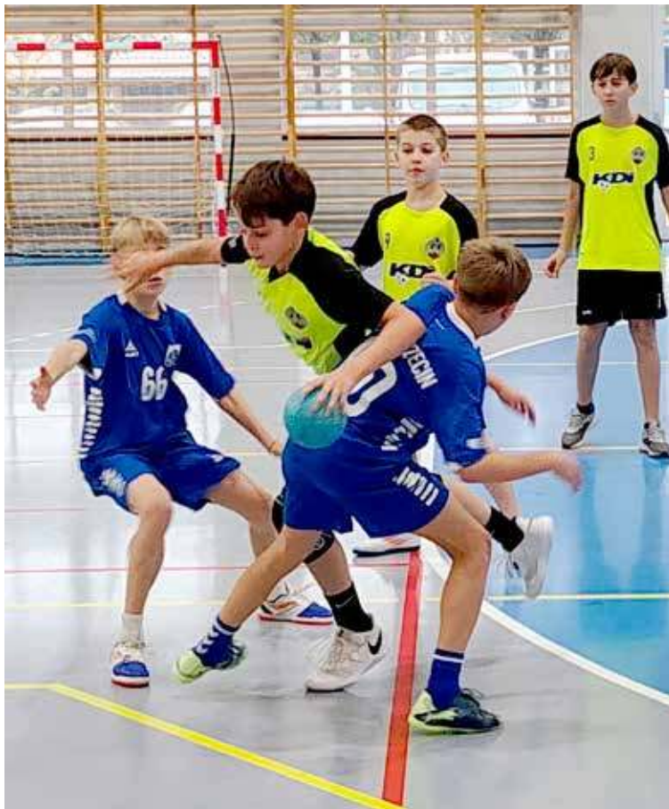
red. Nasi w każdym meczu walczyli od pierwszej do ostatniej minuty meczu

Kolejna szansa na klubową rywalizację klas V wśród drużyn z województwa zachodniopomorskiego zaplanowana jest już w styczniu 2026 roku. Już teraz życzymy powodzenia!