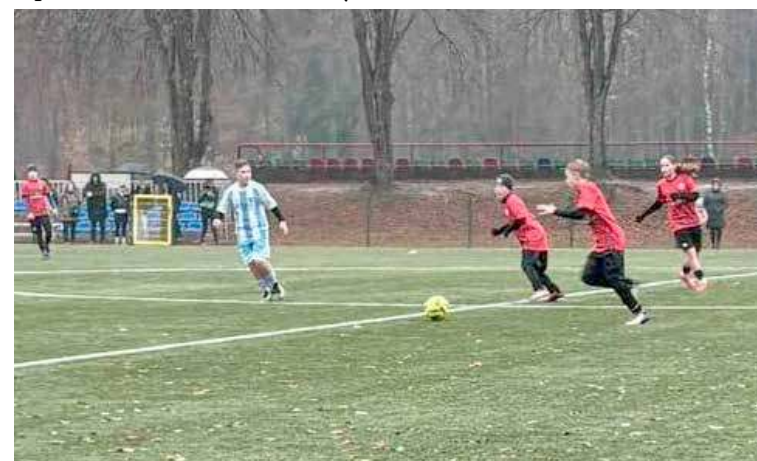
To był kolejny bardzo trudny mecz dla naszych piłkarzy