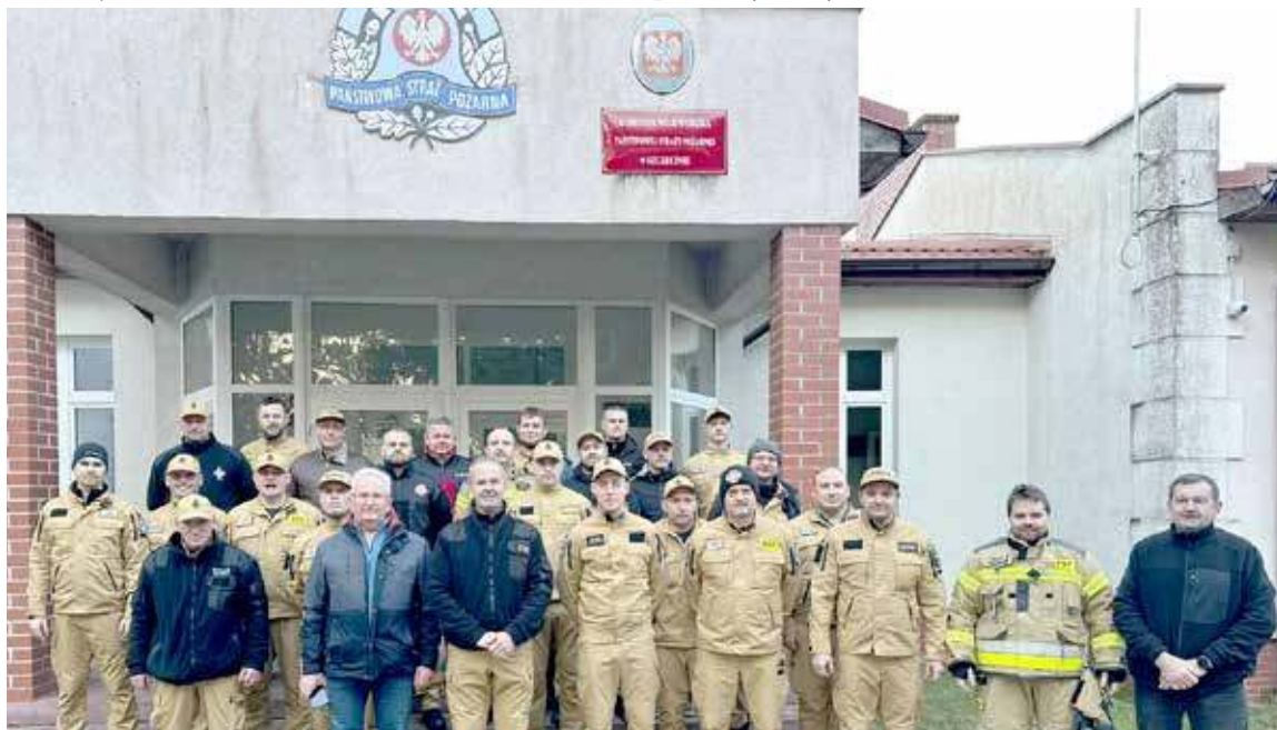
Pamiątkowe zdjęcie uczestników szkolenia