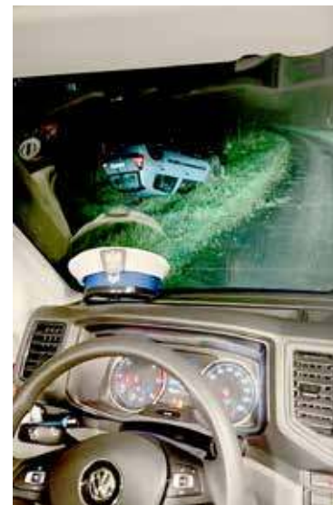
Ucieczka przed mundurowymi dla 60-letniego kierowcy zakończyła się dachowaniem

riusze zatrzymali prawo jazdy mężczyzny, zabezpieczyli pojazd oraz sporządzili stosowną dokumentację. 60-latek wkrótce odpowie przed sądem za kierowanie pojazdem mechanicznym w stanie nietrzeźwości, za co grozi