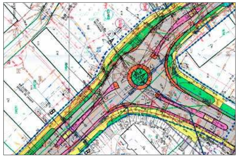
Projekt ronda, który wbrew twierdzeniom inwestora, pogorszy a nie polepszy płynność ruchu, zwłaszcza z ulicy 3 Maja

bynajmniej nie na zadania gminne, ale dla powiatu i województwa na ich zadania własne. Dla powiatu na remont drogi powiatowej w Strzelewie - ocenimy to, jak poznamy kwotę tej dotacji. Dla województwa zaś na wykonanie inwestycji w ciągu drogi wojewódzkiej 106 w postaci ronda koło Netto. Trudno sobie wyobrazić głupszego pomysłu na „poprawienie płynności” - jak to reklamują” - jak wykonanie ronda właśnie w tym miejscu w sytuacji, gdy nie jest rozwiąza-