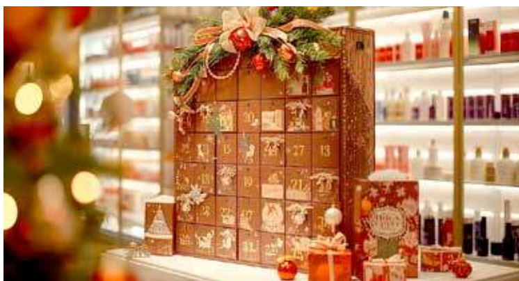
Kalendarz adwentowy to oszustwo funkcjonujące w internecie w listopadzie br.

Jak rozpoznać fałszywą ofertę? Należy zwrócić uwagę na to: czy jest zbyt dobra, by była prawdziwa - „darmowy” lub bardzo tani produkt znanej marki to sygnał ostrzegawczy; podejrzany adres strony - różni się od oficjalnej domeny sklepu; prośba o dane z karty płatniczej w ramach „gratisu” - to próba wyłudzenia da-