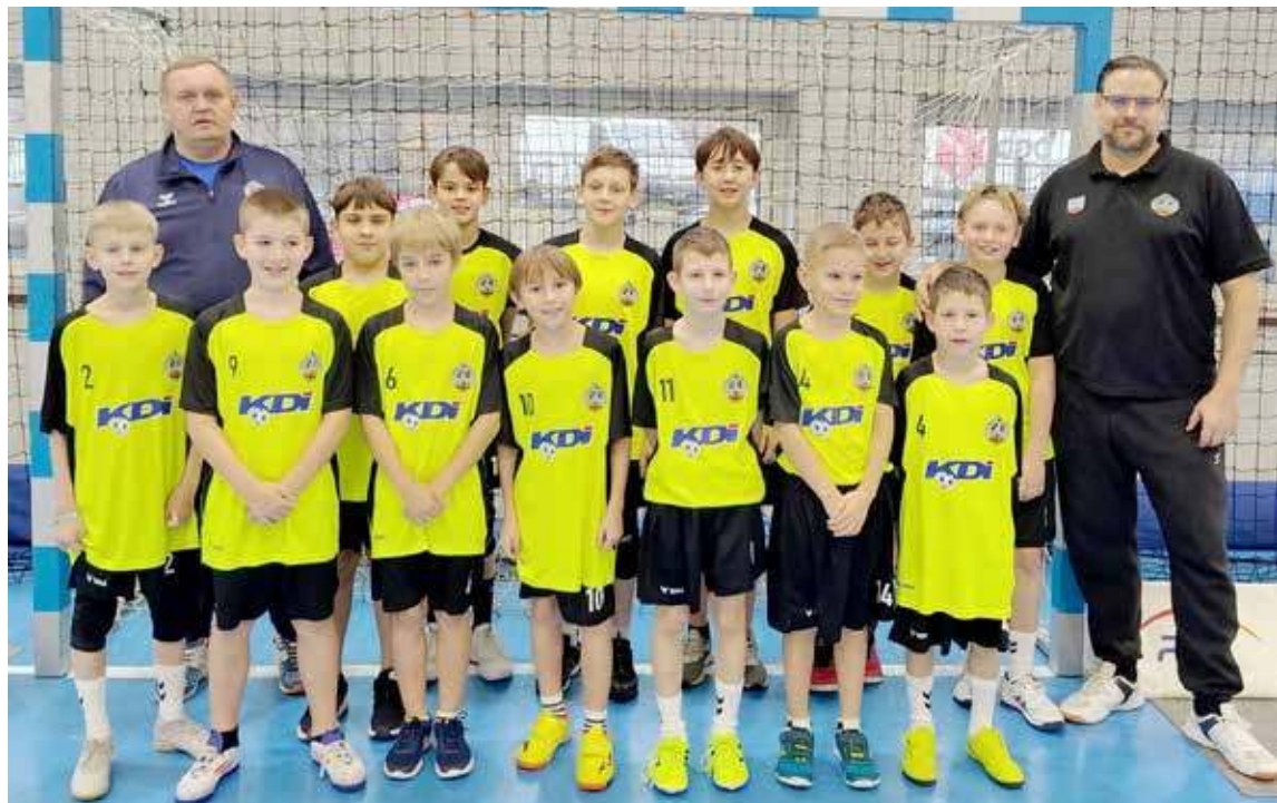
Wspólne zdjęcie przed przystąpieniem do rywalizacji na hali w Gryfinie