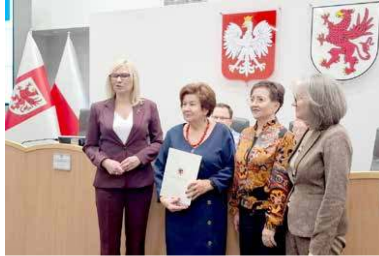
Przekazanie zaświadczenia o wyborze do Wojewódzkiej Rady Seniorów

Rada Seniorów będzie pełnić funkcję doradczą i opiniotwórczą, reprezentując głos osób starszych oraz wspierając działania na rzecz ich aktywności, integracji i jakości życia