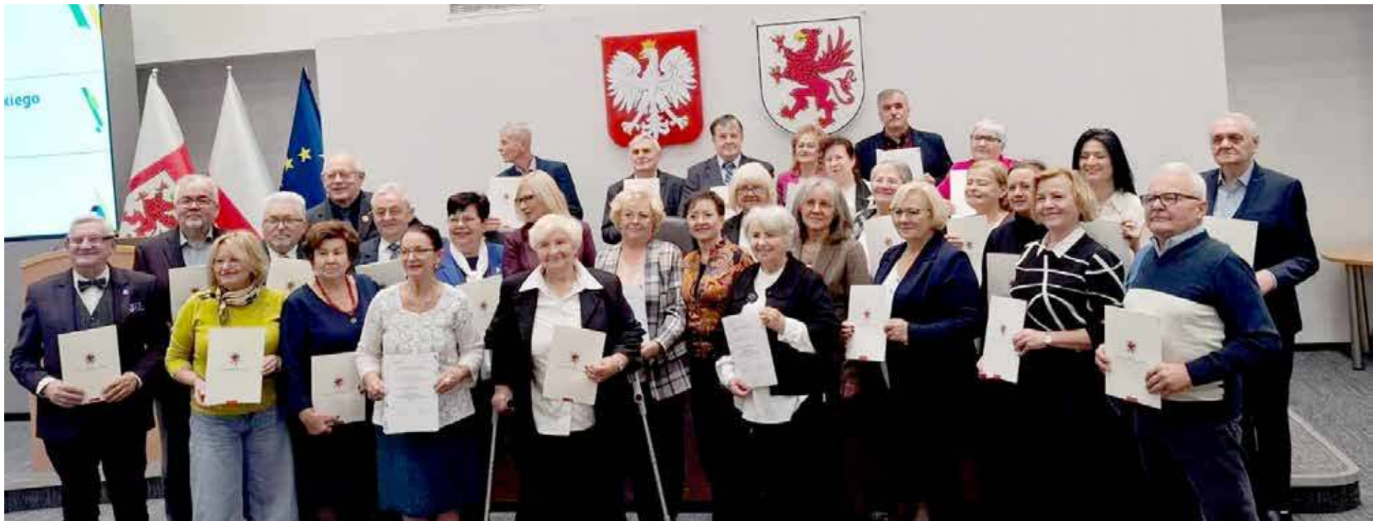
Wspólne zdjęcie radnych