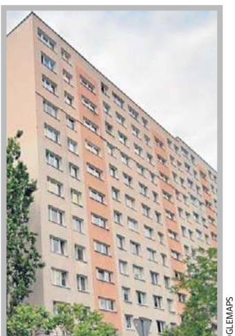
Martwą kobietę znaleziono w windzie w tym bloku.

Na tym etapie postępowania nie można jednoznacznie wykluczyć udziału osób trzecich.