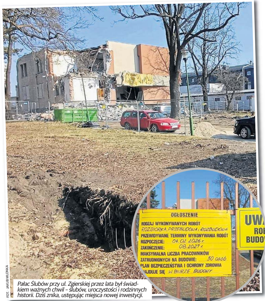
Pałac Ślubów przy ul. Zgierskiej przez lata był świadkiem ważnych chwil - ślubów, uroczystości i rodzinnych historii. Dziś znika, ustępując miejsca nowej inwestycji.