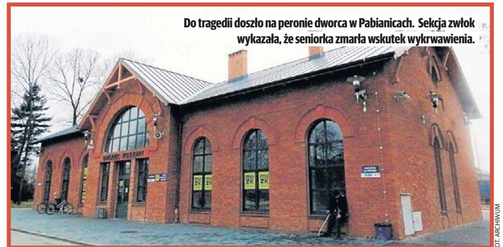
Do tragedii doszło na peronie dworca w Pabianicach. Sekcja zwłok wykazała, że seniorka zmarła wskutek wykrwawienia.

Wszystko wskazuje na to, że miała dwie torby. Z jedną wsiadła do pociągu, zostawiła ją i wróciła na peron po drugą. Niestety, podczas wyładunku pociąg ruszył i 70-latka upadła. Moment upad-