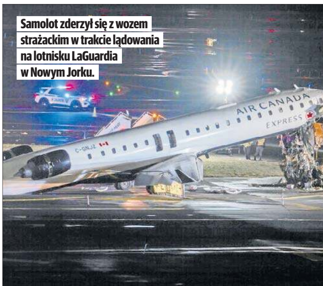
Samolot zderzył się z wozem strażackim w trakcie lądowania na lotnisku LaGuardia w Nowym Jorku.

Liczne filmy nagrane przez świadków zdarzenia i opublikowane w mediach społecznościowych pokazują samolot z