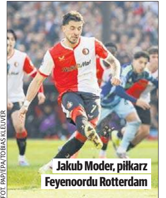
Jakub Moder, piłkarz Feyenoordu Rotterdam

Z Włoch przyjechał m.in. Nicola Zalewski z Atalanty Bergamo, który jednak ze względu na żółte kartki nie zagra