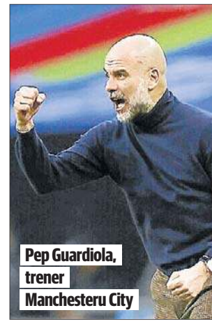
Pep Guardiola, trener Manchesteru City

● Międzynarodowa Federacja Samochodowa opowiedziała, że od sezonu 2027 do kalendarza rajdowych mistrzostw świata WRC wróci impreza w Wielkiej Brytanii - Rajd Szkocji.