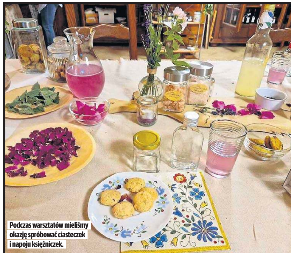
Podczas warsztatów mieliśmy okazję spróbować ciasteczek i napoju księżniczek.