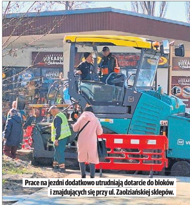
Prace na jezdni dodatkowo utrudniają dotarcie do bloków i znajdujących się przy ul. Zaolziańskiej sklepów.