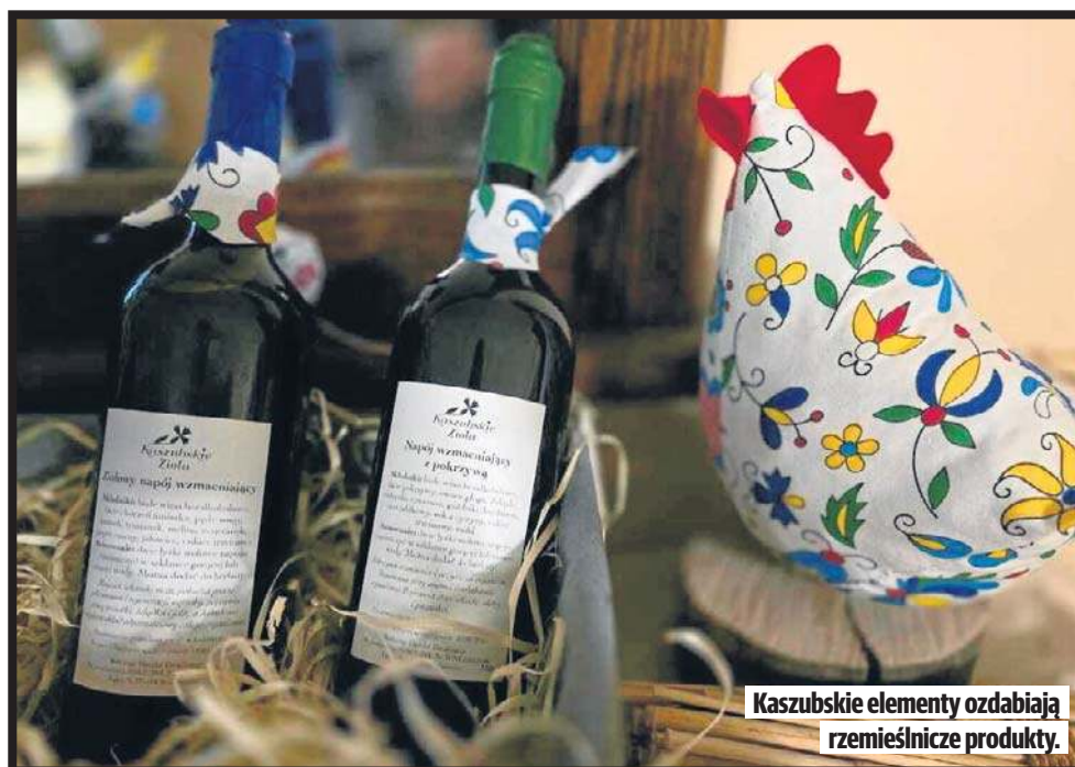
Kaszubskie elementy ozdabiają rzemieślnicze produkty.