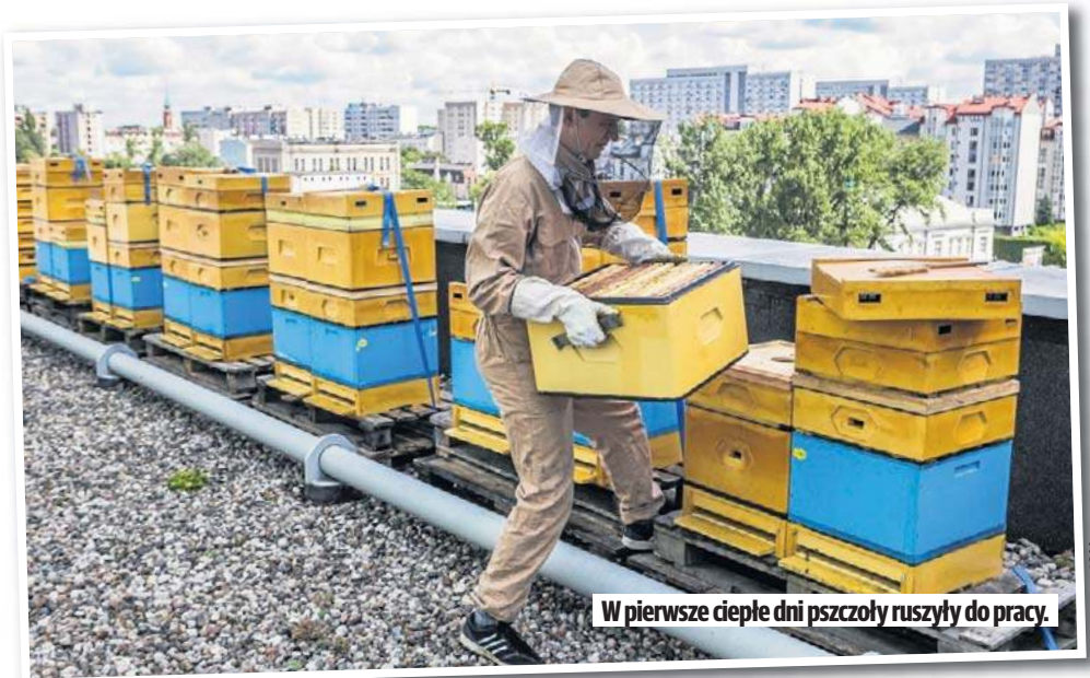
W pierwsze ciepłe dni pszczoły ruszyły do pracy.

- Cena miodu, który wjeżdża do Polski z kierunków wschodnich, czyli z Chin, w maju ub. r. wynosiła poniżej 1 euro. Sza-