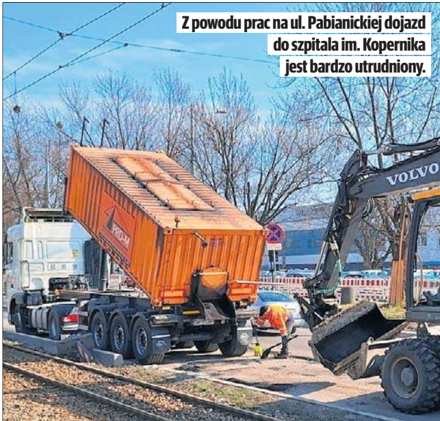
Z powodu prac na ul. Pabianickiej dojazd do szpitala im. Kopernika jest bardzo utrudniony.