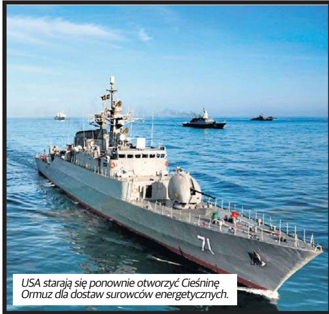
USA starają się ponownie otworzyć Cieśninę Ormuz dla dostaw surowców energetycznych.

W sobotę Trump zapowiedział, że irańskie elektrownie staną się celem ataków, jeśli Teheran nie otworzy całkowicie Cieśniny Ormuz dla ruchu statków w ciągu 48 godzin. Termin ten upłynął po północy z niedzieli na poniedziałek czasu polskiego.