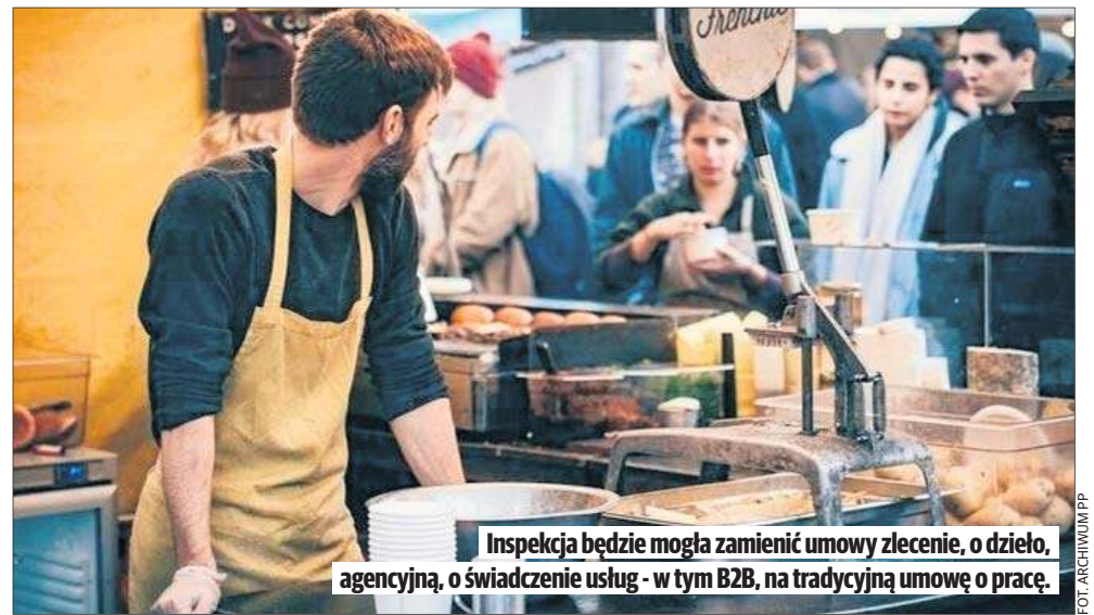
Inspekcja będzie mogła zamienić umowy zlecenie, o dzieło, agencyjną, o świadczenie usług - w tym B2B, na tradycyjną umowę o pracę.

To także jedyna platforma społecznościowa, na której pojawia się unikalny wątek osób neuroatypowych (np. z ADHD), wskazujących na umowy B2B jako formę ucieczki od sztywnych ram etatowych, a użytkownicy traktują sekcję komentarzy jako kanał bezpośredniej komunikacji z władzą przez apele do „Pani Ministery”.