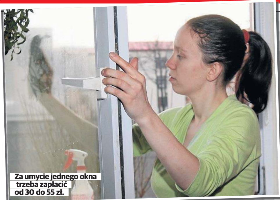
Za umycie jednego okna trzeba zapłacić od 30 do 55 zł.

• Czy Conrado Moreno byłby gotowy wrócić do programu? STR. 12