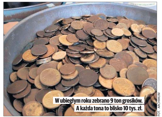
W ubiegłym roku zebrano 9 ton grosików. A każda tona to blisko 10 tys. zł.

Zbiórka bilonu odbywa się głównie w przedszkolach i szkołach, a także w firmach i instytucjach. Dla wszystkich jest organizowany konkurs „Ozłoceni” na najlepszego zabieracza złotych monet. Ale i osoby prywatne mogą gromadzić złote grosze i przystąpić do konkursu. Dla zwycięzców przewidziano nagrody - bezpłatne kursy pierwszej pomocy PCK.