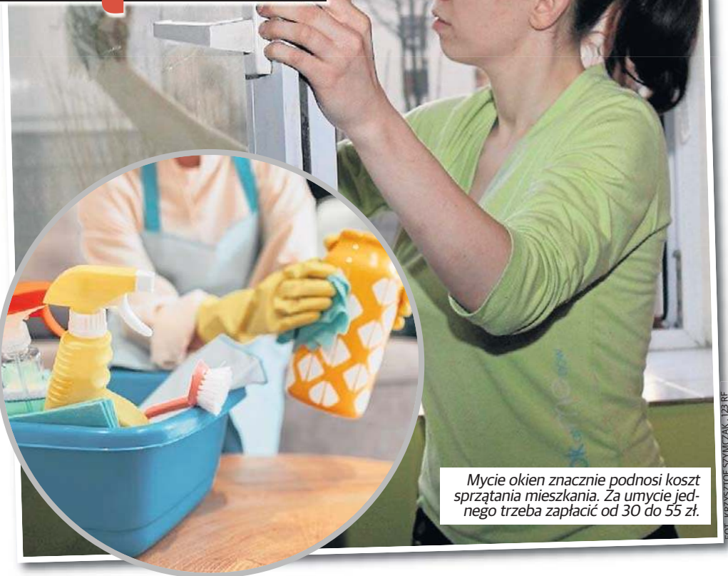
Mycie okien znacznie podnosi koszt sprzątnia mieszkania. Za umycie jednego trzeba zapłacić od 30 do 55 zł.