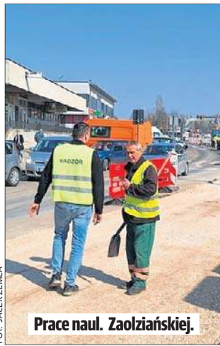
Prace naul. Zaolziańskiej.

niu z ul. Ciasną powstanie rondo, które upłyni ruch i poprawi bezpieczeństwo na osiedlu - informuje Wiktor Stańczyk, rzecznik Zarządu Dróg i Transportu w Łodzi. - Drogowcy zajęli połowę remontowanej drogi, obecnie część chodników została już ułożona. Później, prawdopodobnie w kwietniu, prace przeniosą się na drugą stronę ul. Zaolziańskiej.