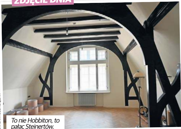
To nie Hobbiton, to pałac Steinertów.