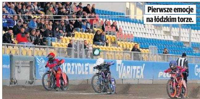
Pierwsze emocje na łódzkim torze.