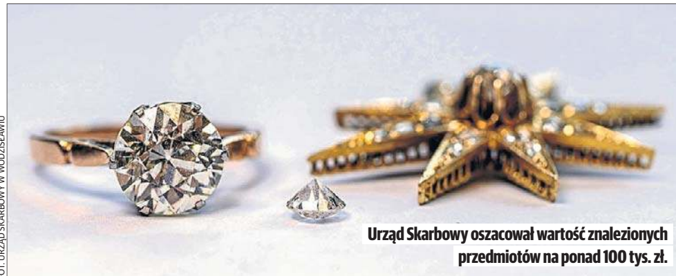
Urząd Skarbowy oszacował wartość znalezionych przedmiotów na ponad 100 tys. zł.

Wartościowa biżuteria ma przynajmniej kilka dekad. Choć nie jest znana ich dokładna historia. Jakiś czas temu została znaleziona przez przypadkowe osoby na wysypisku gruzu w Wodzisławiu Śląskim. Nie można wykluczyć, że w przeszłości ktoś schował biżuterię w budynku, nie zdołał jej później odzyskać, a resztki obiektu po zburzeniu wraz z diamentami trafiły na wysypisko. Uczciwi znalazcy, zgodnie z prawem i przyjętą normą, zanieśli „skarby” na komisariat policji. Jako że nie udało się ustalić właścicieli, rzeczy trafiły do depozytu sądowego. Zgodnie z przepisami sąd wezwał do ich odbioru przez okres trzech lat. W tym terminie żadna osoba uprawniona nie zgłosiła się po przedmioty, depozyt zlikwidowano, a sąd postanowił o ich przepadku na rzecz Skarbu Państwa.