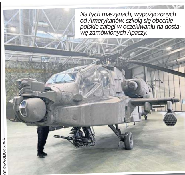
Na tych maszynach, wypożyczonych od Amerykanów, szkolą się obecnie polskie załogi w oczekiwaniu na dostawę zamówionych Apaczy.

Mówiąc w skrócie, podpisana wczoraj umowa z Lockheed Martinem da łódzkim zakładom kompetencje do obsługi, napraw i eksploatacji systemów naprowadzania uzbrojenia i nawigacyjnych oraz serwisowania radarów i kierowania ogniem Longbow.