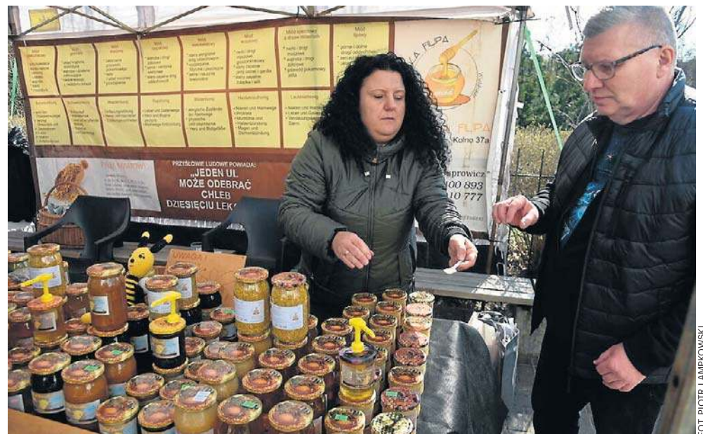
Toruńskie Muzeum Etnograficzne zorganizowało kiermasz wielkanocny