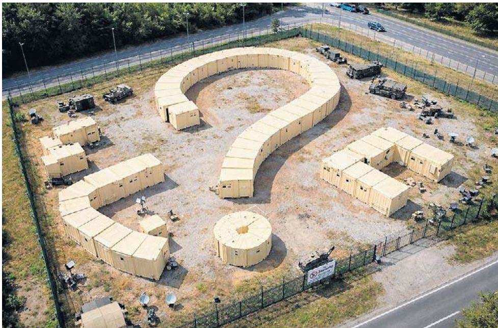
Tak wyobraża sobie wojskową bazę kontenerową w Toruniu sztuczna inteligencja

Sprawa niektórych zapisów ustawy o obronie ojczyzny budzi kontrowersje nie od dziś, o czym pisaliśmy na naszych łamach wielokrotnie. Jej pierwotna wersja z 2022 roku wносиła do porządku prawnego wręcz piramidalne absurdy - w myśl zapisów zakazane miało być fotografowanie m.in. lecznic dla zwierząt, w których znajdował się tomograf. W 2025 roku część absurdalnych paragrafów usunięto, ale przykład toruński pokazuje, że nie wszystkie.