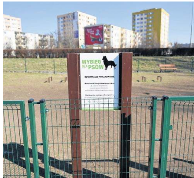
W ramach Budżetu Obywatelskiego w Toruniu powstają place zabaw, wybiegi dla psów czy społeczne ogrody

Zgłoszenie projektu jest możliwe zarówno drogą elektroniczną na stronie internetowej budżet.torun.pl, jak i w tra-