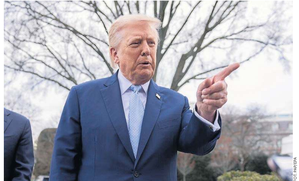
Oświadczenie Trumpa pojawiło się w sobotę wieczorem na platformie Truth Social. Ultimatum upływa tuż przed 1 w nocy czasu polskiego z poniedziałku na wtorek

Amerykański prezydent wielokrotnie wcześniej groził zniszczeniem irańskich elektrowni - w tym elektrowni jądrowej - twierdząc, że w ten sposób w ciągu godziny mógłby spowodować takie zniszczenia, że kraj nie byłby się w stanie z tego podnieść. Trump podkreślał jednak wówczas, że jest „miły” i tego nie robi.