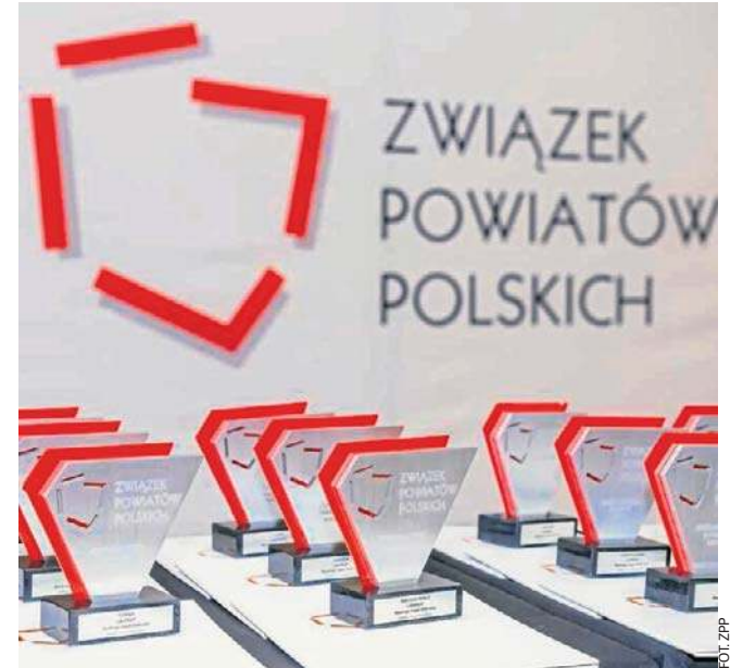
Ranking Związku Powiatów Polskich organizowany jest od 2003 r.

gdzie są przestrzenie do poprawy i w których aspektach powiat nie jest doceniony. - Zdaje sobie sprawę, że ubiegły rok był słabszy np. w zakresie wsparcia finansowego na rzecz prac konserwatorskich i restauratorskich. I tu widzę potencjał na poprawę oceny. Warto też zaznaczyć, że w niektórych kryteriach, w których otrzymaliśmy zero punktów, podjęliśmy już aktywne działania, które po prostu jeszcze nie zdążyły znaleźć odzwierciedlenia w rankingowej ocenie. U uruchomiliśmy na przykład pod koniec minionego roku urządomat z automatycznymi powiadomieniami dla klientów urzędu, ale w kryterium „posiadanie systemu powiadomiania” jeszcze tego nie ujęto i nie przyznano punktów. Nie otrzymaliśmy ich również za powołanie Młodzieżowej Rady Powiatu, ale w tej kwestii rozpoczęliśmy już kon-