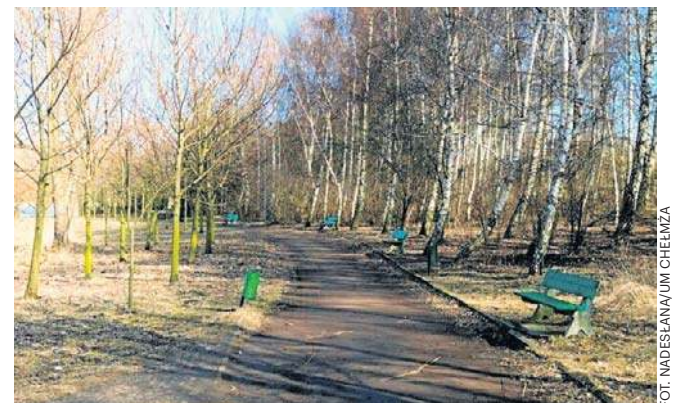
Gruntowna modernizacja terenów wokół jeziora spowoduje, że zyskają one nową, atrakcyjną infrastrukturę

Przypomnijmy, że projekt „Rewitalizacja zieleni miejskiej na obszarze miasta Chełmży” uzyskała dofinansowanie ze środków UE w wysokości 1,1 mln zł, natomiast projekt „Zagospodarowanie turystyczne terenów wokół Jeziora Chełmżyńskiego” otrzymał wsparcie prawie 1,4 mln zł. ©