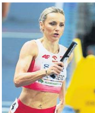
Justyna Święty-Ersetic ma na koncie już pięć medali Halowych Mistrzostw Świata