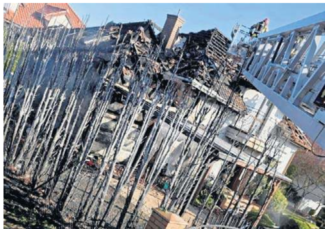
Najpilniejsze koszty po pożarze domu jednorodzinnego zostały oszacowane na 300 tysięcy złotych