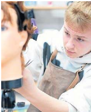
W „ekonomiku” kształcą się też przyszli fryzjerzy

Nowością w II LO na Skarpie będzie klasa wojskowa. Toruńscy radni zgodzili się na utworzenie takiego oddziału, bo w tym roku nie będzie naboru do VI Liceum Ogólnokształcącego przy ul. Wojska Polskiego, które klasy wojskowe miało. Szkoła będzie stopniowo wygaszana. W jej budynku ma w przyszłości funkcjonować