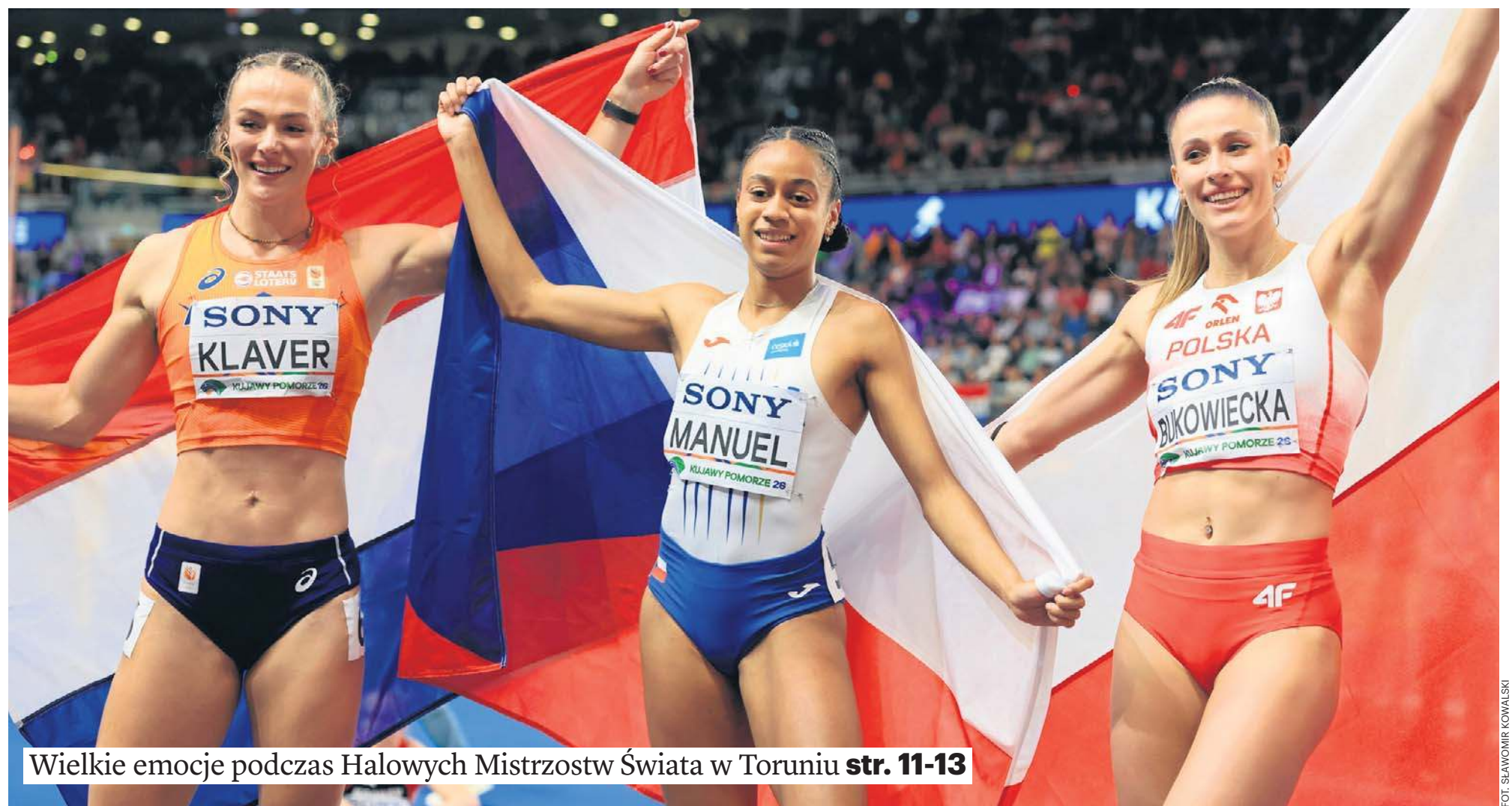
Wielkie emocje podczas Halowych Mistrzostw Świata w Toruniu str. 11-13

SAMORZĄD STARTUJE KOLEJNA EDYCJA BUDŻETU OBYWATELSKIEGO