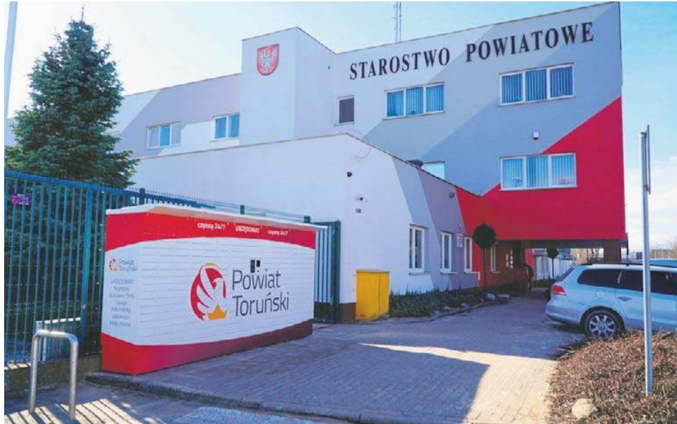
Uruchomiony w ubiegłym roku urządomat nie zdążył zostać uwzględniony w rankingowej ocenie

O ocenę pozycji Powiatu Toruńskiego w rankingu ZPP poprosiliśmy Starostę Toruń-