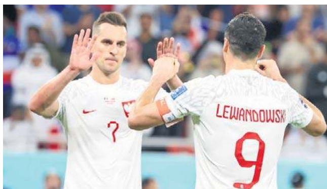
Arkadiusz Milik kontuzji, po której nie grał niemal dwa lata, doznał w meczu reprezentacji z Ukrainą

W lidze włoskiej też grali Polacy, także ci niepowołani na mecze barażowe przez Jana Urbana jak Milik. 45 minut rozegrał Jakub Piotrowski. Pomocnik, który dwa lata temu w barażach strzelił gola Estonii (5:1), wszedł na murawę zaraz po przerwie, a Udinese wygrało 2:0 z Genoa.