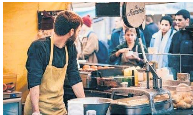
Inspekcja będzie mogła zamienić umowy zlecenie, o dzieło, agencyjną, o świadczenie usług - w tym B2B, na tradycyjną umowę o pracę

Z analizy Instytutu Monitorowania Mediów (IMM) wynika, że w dyskusji internetowej nowe przepisy są określane jest mianem „administracyj-