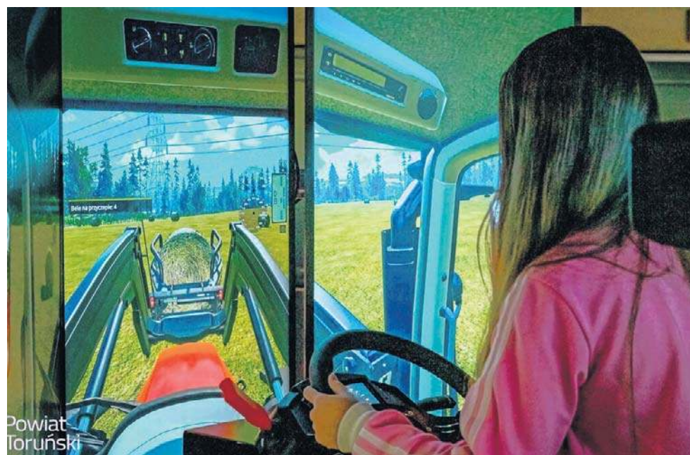
W rankingu ZPP oceniane są m.in. działania podejmowane na rzecz nowoczesnej edukacji zawodowej. Na zdjęciu symulator maszyn rolniczych wykorzystywany w ZS CKU w Gronowie