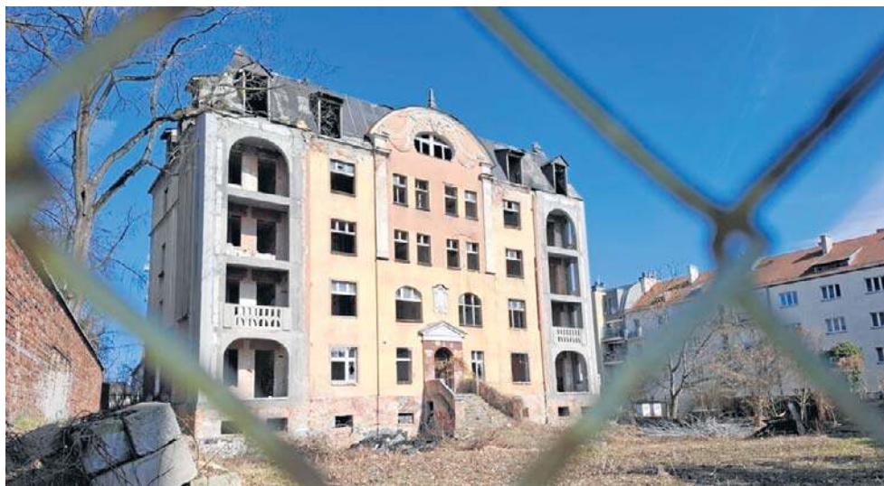
W doprowadzeniu tego zabytku do ruiny toruńska prokuratura nie dopatrzyła się znamion czynu zabronionego

W Toruniu takich przykładów niestety mamy wiele. Batalie o zabytki, bo trudno to nazwać inaczej, toczą się latami i nawet sądowy wyrok nie gwarantuje sukcesu. Właściciele Fortu XI zostali przeciw kilka lat temu skazani, bo nie zabezpieczyli w odpowiedni sposób nieruchomości ważnej nie tylko dla nas, ale i przyszłych pokoleń. Toruński sąd uznał ich winę i obciążył grzywną, podkreślając wy-