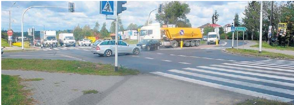
Mieszkańcy wschodnich rejonów powiatu czekają na budowę rond na DK10 w Lubiczu

- Wniosek o decyzję środowiskową dla tej inwestycji został już złożony - informuje Michał Sitarek, rzecznik prasowy Zarządu Dróg Wojewódzkich w Bydgoszczy. - W ubiegłym roku burmistrz Chełmży pozytywnie zaopiniował realizację tego zadania. Trwają jeszcze prace nad uzupełnieniami raportu o oddziaływaniu na środowisko. Do jego opracowania został zobowiązany wykonawca. To ważny dokument, bo jego celem jest minimalizacja wpływu nowej drogi na środowisko naturalne. Opiniuje go m.in. Regionalna Dyrekcja