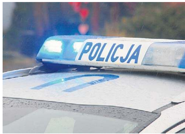
Pierwsze zgłoszenie o podejrzeniu włamania pochodziło z dzielnicy Wrzosey

Kilka minut później otrzymali kolejne zgłoszenie, tym razem o alarmie, który załączył się