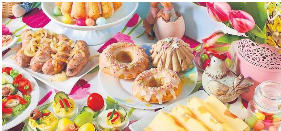
Teraz jest najlepszy czas, by zamawiać jedzenie na Wielkanoc

Tanio jak w markecie - wiadomo - nie jest, ale jakość ma swoją cenę. Co ważne, niektórzy z tych gospodarzy obecni