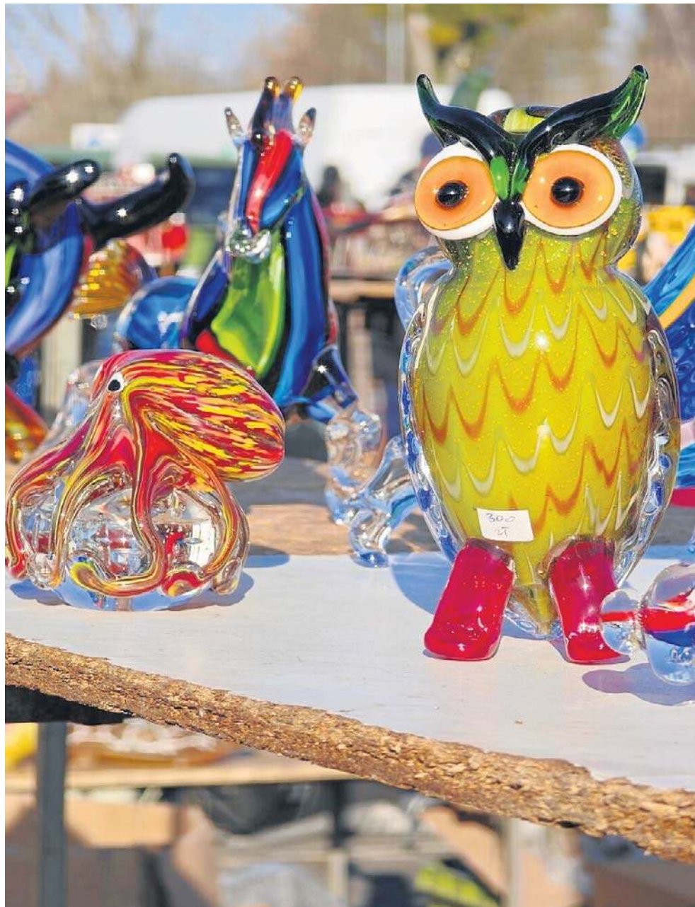
Na pchlim targu, jak zawsze, można było znaleźć różne ciekawe przedmioty