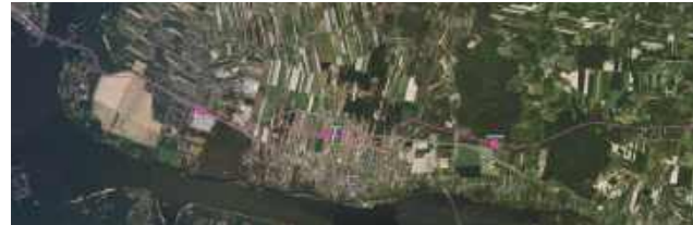
Odcinek Jadwisin - Serock - Wierzbica

Nowe torowiska często ingerują w lokalne drogi i pola, a mieszkańcy powinni uważnie przeanalizować mapy przebiegu przystanków i odcinków linii. To czas, by sprawdzić, czy projekt nie