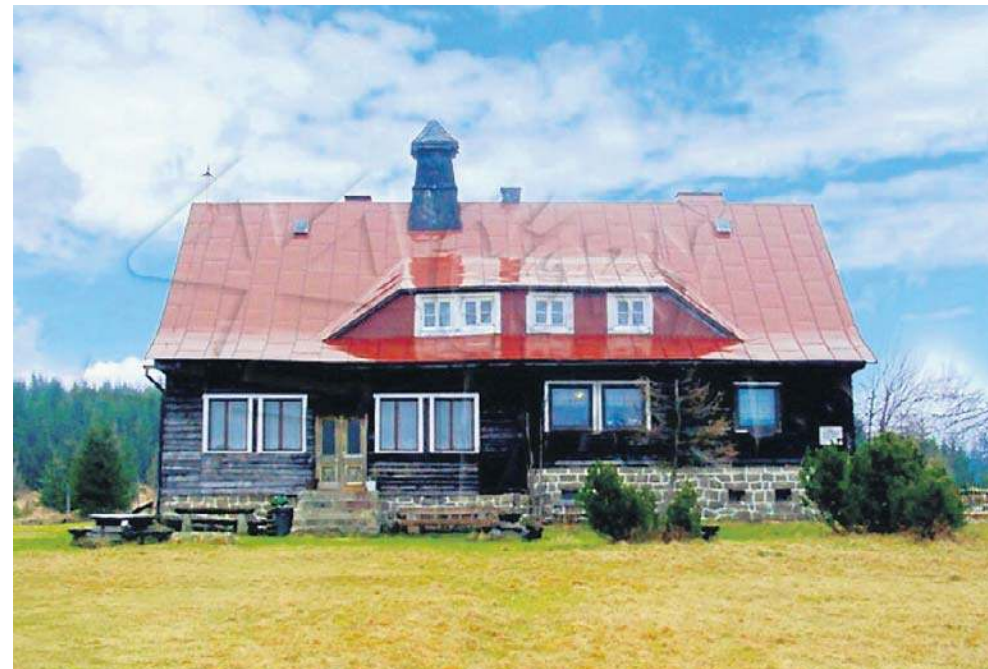
Chatka Górzystów to jedyny budynek, który ocalał po miejscowości Gross Iser