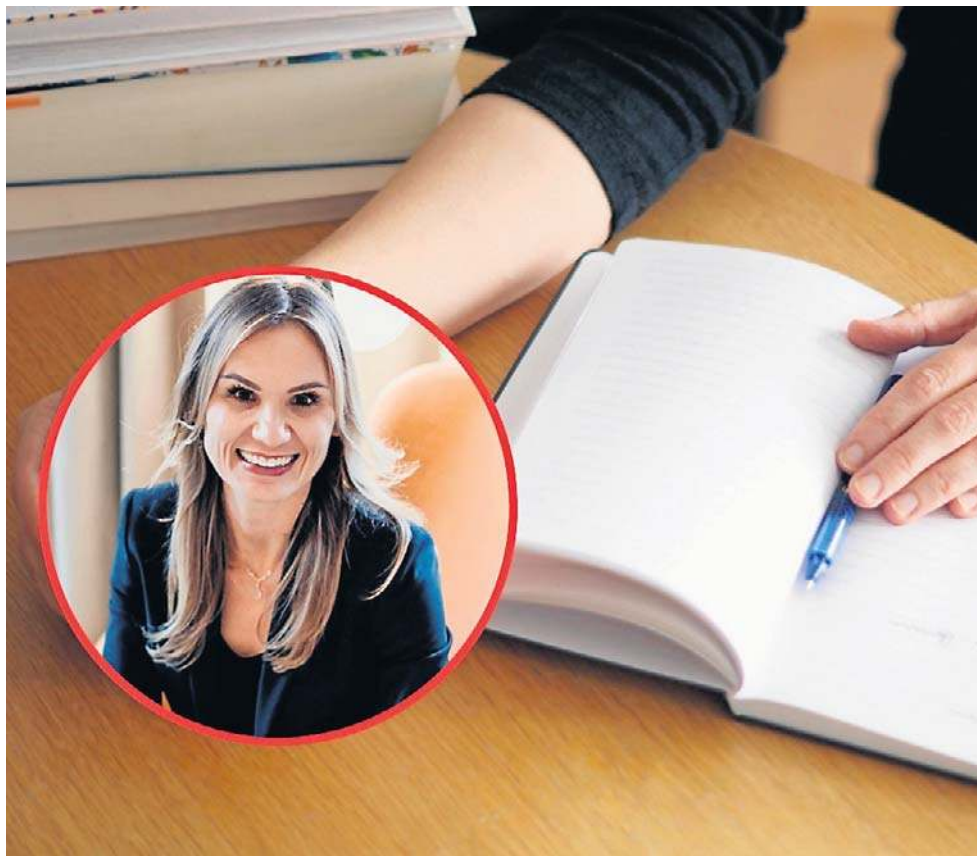
Noworoczne postanowienia wymagają świadomego podejścia, planowania i konsekwencji.

Najważniejsze wydają się więc 3 pierwsze miesiące nowego roku, bo po tym czasie liczba osób, którym się nie powiodło, rośnie przez trzy kolejne miesiące tylko o 4 procent.