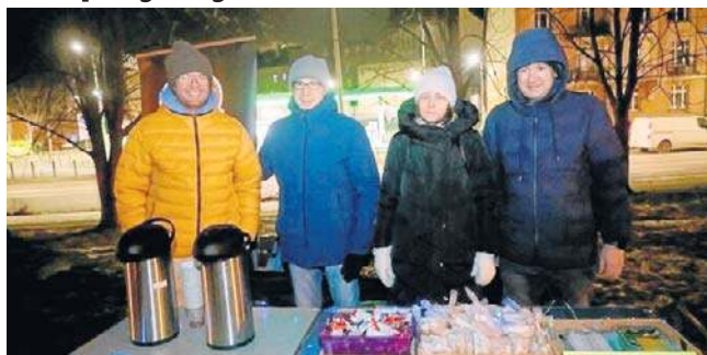
W każdy poniedziałek i wtorek bezdomni mogą uzyskać wsparcie Kościoła Zielonościwotkowego „Anastasis”

Spotkania dla bezdomnych organizuje Kościół Zielonościwotkowy „Anastasis” w Legnicy, w ramach programu Coffee House Legnica. Odbywają się w każdy poniedziałek o godz. 17.30 „pod chmurką” - na Alei Platanowej (róg ulic Pocztowej