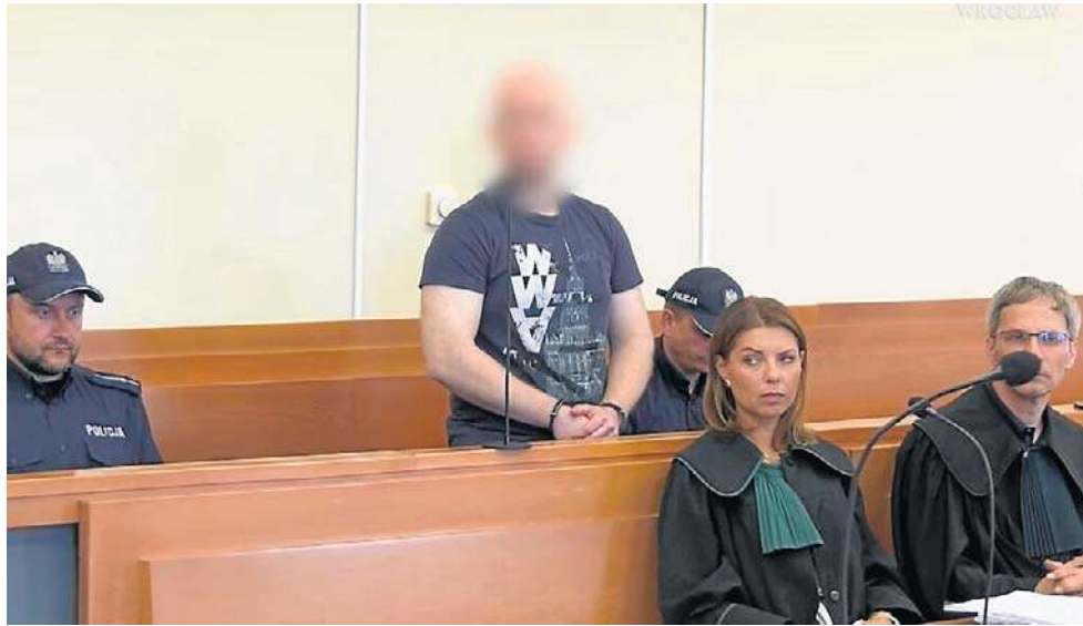
Oskarżony nie wyraził skruchy i nie miał wyrzutów sumienia