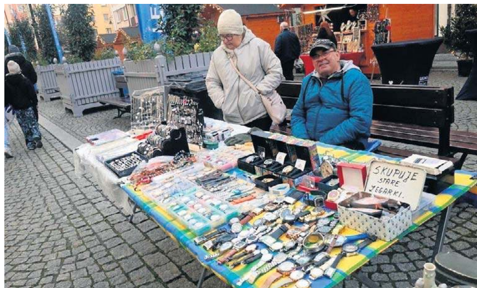
Jarmark Staroci organizowany jest w Legnicy od 2003 roku

Towarzystwo Miłośników Legnicy nie zwlekało i nie zwleka z dopełnianiem formalności związanych z organizacją Jarmarku Staroci. Od dłuższego