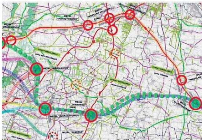
Od węzła Wrocław Wschód - Kąty Wrocławskie A4 pójdzie nowym śladem