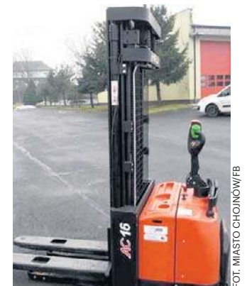
Do Chojnowa trafił m.in. wózek podnośnikowy

10. Zestaw urządzeń radiowych do centrali sterowania syrenami - 6492,61 zł