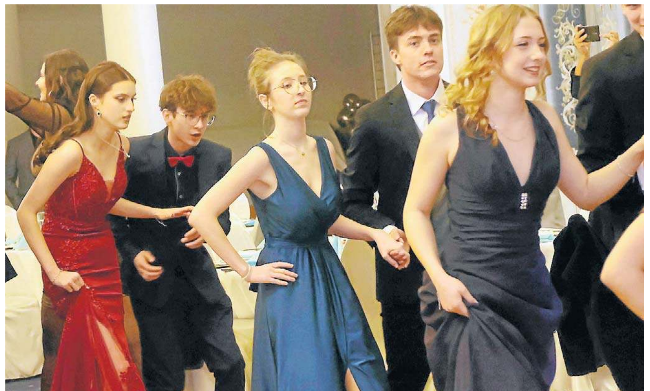
Oficjalną część studniówki rozpoczął oczywiście uroczysty polonez