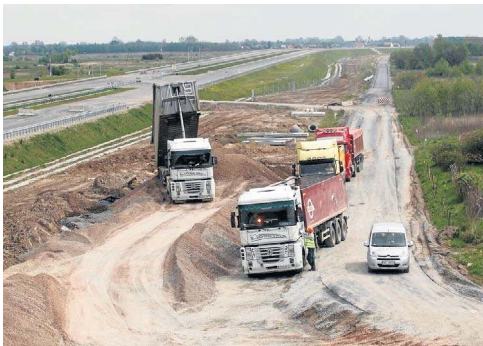
Rozbudowa A4 Krzyżowa - Legnica (35 km) podzielona będzie na dwa odcinki

- Rozbudowa trasy jest podzielona na dwa zadania: pierwsze o długości ok. 14 km, które rozpoczyna się za węzłem Krzyżowa i kończy za węzłem Krzywa oraz drugie o długości ok. 21 km rozpoczynające się za węzłem Krzywa i kończące przed węzłem Legnica Południe - wyjaśnia Generalna Dyrekcja Dróg Krajowych i Autostrad. - Mamy już pierwszą decyzję środowiskową, na pierwsze zadanie, drugą planujemy uzyskać w I kwartale 2026 r. - dodaje zarządca drogi.