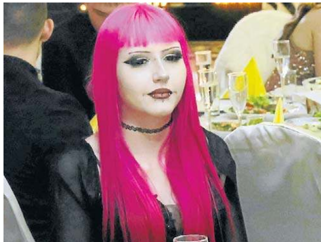
Studniówka to często przegląd trendów modowych, w tym uczesania, makijażu i oczywiście ubioru