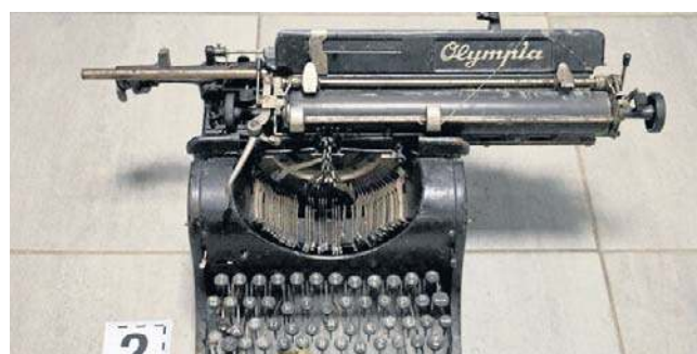
Wśród odzyskanych przedmiotów jest stara maszyna do pisania, możliwe, że dla kogoś to cenna pamiątka

Zobacz zdjęcia, które publikujemy w naszej galerii na legnica.naszemiasto.pl . Może