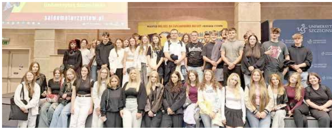
Uczniowie II LO w sali wykładowej US przy ul. Krakowskiej