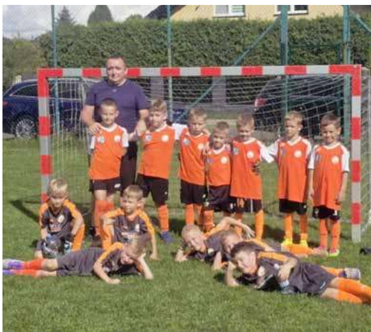
Młodzi piłkarze z rocznika 2017 stawili się tym razem w Goleniowie na turnieju