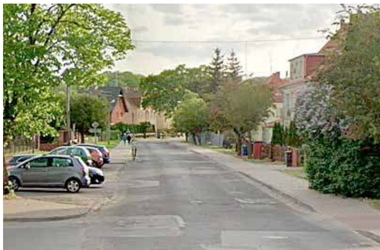
Wyniki przetargu dot. ul. Wojska Polskiego mają być znane najwcześniej pod koniec września br.

Pozyskanie dotacji to bez wątpienia impuls, by jeszcze w tym roku podjąć się położenia nowej warstwy nawierzchni. Z drugiej