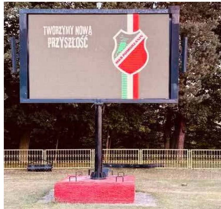
Tablica „świeci” na stadionie i to napisem z gatunku „masło maślane” (jakby mogła być „stara” przyszłość... No, ale w piłce liczy się „kop”, a nie język polski poprawny