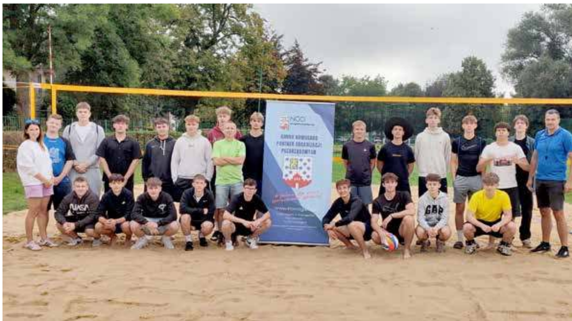
Na zakończenie turnieju wspólna fotografia