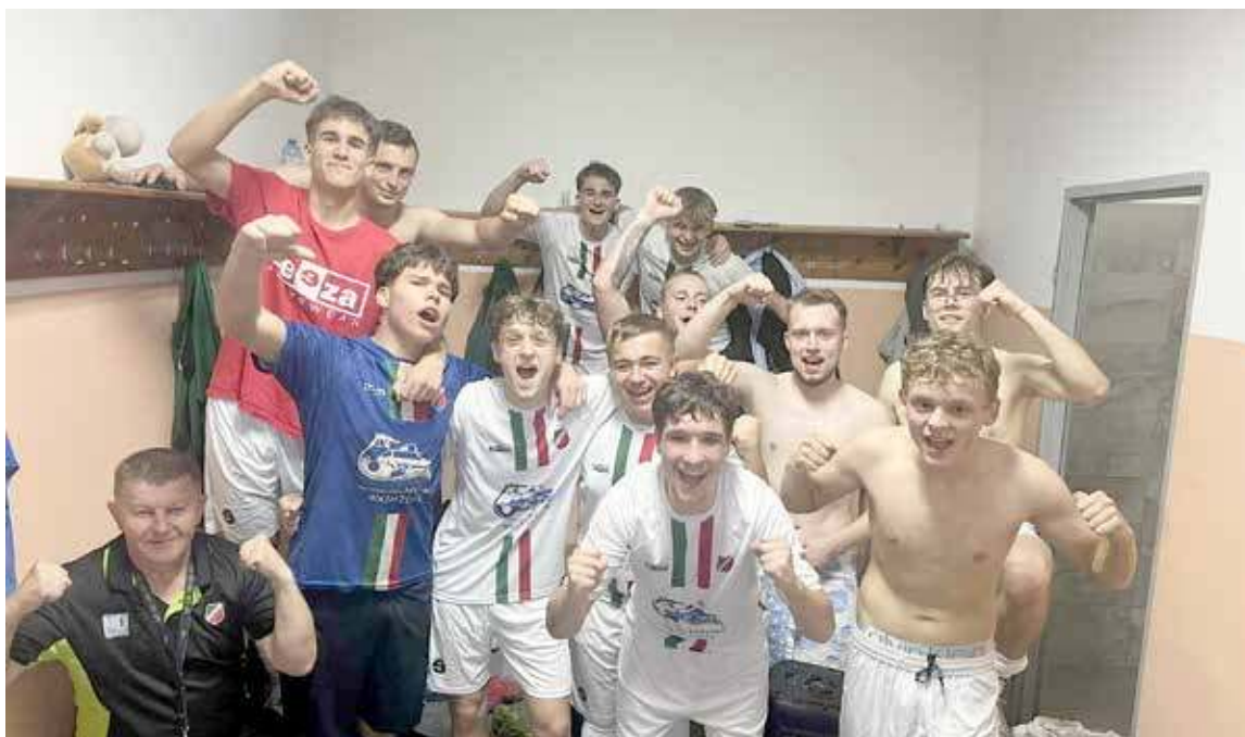
Piłkarze drugiej drużyny po meczu ze Zniczem Wysoka Kamińska

Dosłownie po kilkudziesięciu sekundach nasza drużyna ponownie mogła cieszyć się z trafienia. W 52 minucie było już