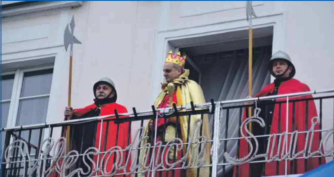
Nowy dress code po zmianie władzy w ratuszu. Uwaga interesanci, Was to także dotyczy!