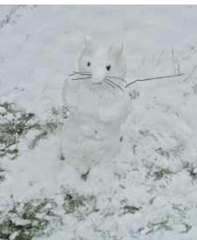
Bałwana kotka (albo myszkę) nadesłał Sylwester Walowski