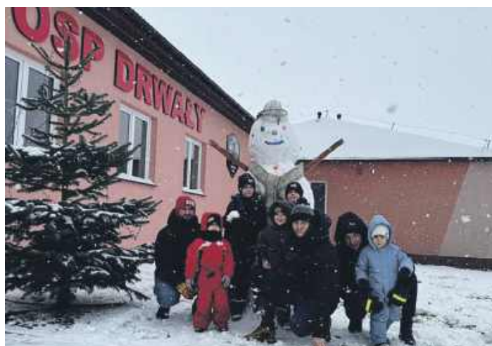
Strażacki bałwanek powstał w OSP Drwały