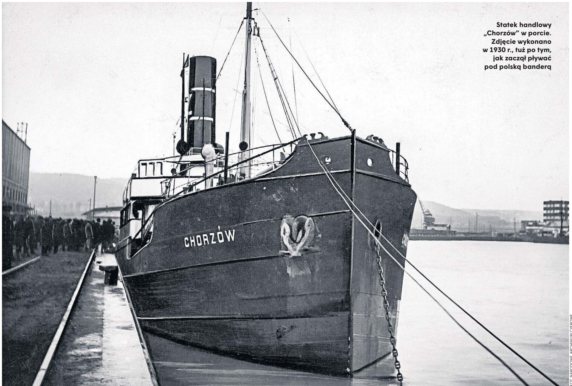
Statek handlowy „Chorzów” w porcie. Zdjęcie wykonano w 1930 r., tuż po tym, jak zaczął pływać pod polską banderą

● Niewielki statek handlowy „Chorzów” w czasie wojny przypadkiem znalazł się we Francji ● Okazał się jedynym dostępnym statkiem, którym można było przewieźć zbiory z Wawelu do Wielkiej Brytanii ● Misja niemożliwa - ale zakończyła się szczęśliwie