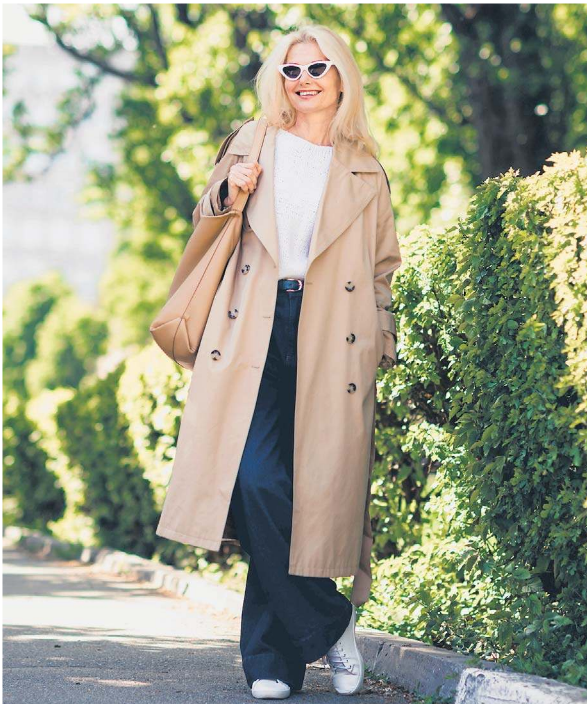
Trencz zazwyczaj ma luźny, lekko oversizowy krój, z szerokimi ramionami i paskiem w talii, który pozwala na optyczne modelowanie sylwetki

Trencz damski to rodzaj płaszcza. Jego klasyczna wersja ma dwurzędowe zapięcie i charakterystyczny pasek z kłamrą. Wywodzi się z mody męskiej. Sama nazwa pochodzi od angielskiego słowa, które oznacza „okop”. Za stwórcę tego okrycia wierzchniego uznaje się Thomasa Burberrego, który w latach 20. uszył dla żołnierzy długie, lekkie płaszcze wykonane z nieprzemakalnego i materiału, który chronił ich także od wiatru. Z czasem płaszcz wszedł do mody i nosili go popularni amanci lat 40., m.in. Humphrey Bogart. Przez wiele lat obecności na rynku płaszcz ten zmieniał także swój krój i przeznaczenie. Obecnie jest jednym z najbardziej pożądanym kobiecych okryć wierzchnich. A kto go rozpromował wśród pań? Oczywiście Audrey Hepburn w kultowym filmie „Śniadanie u Tiffany’ego”. I tak trencz damski beżowy stał się elementem garderoby, który zawitał do każdej kobiecej szafy. Teraz występuje w innych kolorach, takich jak czarny, granatowy, czerwony, a nawet zielony. Trencz damski zapinany jest na 2 rzędy guzików.