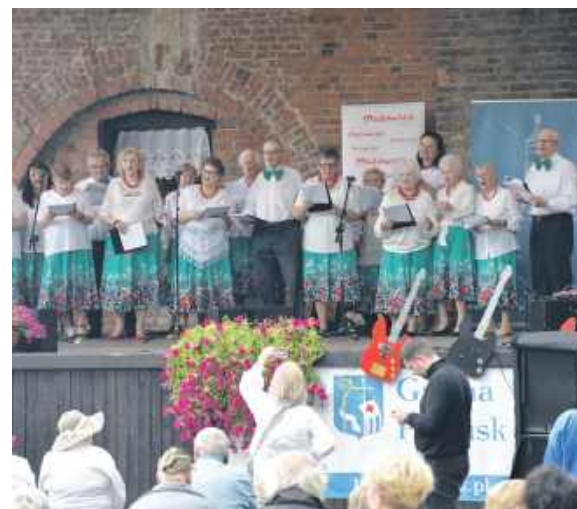
Seniorzy z Centrum Opiekuńczo-Mieszkalnego