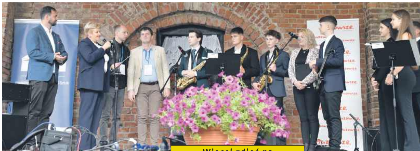
Goście z miasta partnerskiego Szerencs