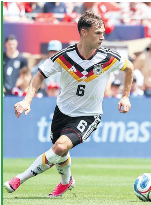
Trzeba przyznać, że koszulki reprezentacji Niemiec prezentują się gustownie.

W grupie jednak Niemcy nie powinni mieć problemu - tym bardziej że można wyjść też z trzeciego miejsca. Są w niej zdecydowanie najsilniejszą drużyną, ale zarówno Ekwador, jak i Wybrzeże Kości Słoniowej mają swoje argumenty. U tych pierwszych nazywają się one Hin-capie, Pacho, Ordonez i Moises Caicedo, u tych drugich