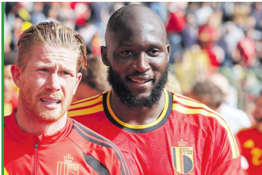
Romelu Lukaku (z prawej) w minionym sezonie oglądał mecze głównie z ławki.

O tym, w jakiej sytuacji jest reprezentacja Belgii, najlepiej świadczy sytuacja Romelu Lukaku. 33-letni napastnik w minionym sezonie rozegrał zaledwie pięć ligowych meczów w barwach Napoli. Wszystko przez to, że cały czas był kontuzjowany. Od początku sezonu leczył uraz uda. Do gry wrócił w styczniu, wszedł z ławki podczas wspomnianych pięciu meczów, zdobył jednego gola i... doznał urazu mięśniowego. Przez ostatnie dwa miesiące w klubowych rozgrywkach nie powąchał murawy. Właściwie nie byłoby dużym nadużyciem stwierdzenie, że piłkarz ten był wyłączone z gry przez cały rok. Mimo tego selekcjoner Belgów Rudi Garcia nie miał wątpliwości i powołał Lukaku na mundial, bo po prostu nie ma go kim zastąpić. W ostatnim przedturniejowym meczu sparingowym z Tunezją Lukaku nawet wszedł na murawę z ławki, bo tak ograniczoną kadrę ma francuski trener. Co więcej, na murawie zastąpił Charlesa De Ketelaere, który gra w kadrze na „dziewiątkę”, ale tak naprawdę jest ofensywnym pomocnikiem.