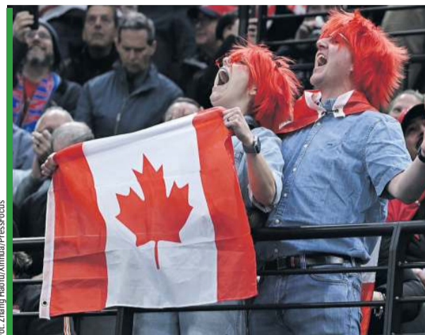
Awans do 1/8 finału wydaje się być w zasięgu piłkarzy spod znaku Klonowego Liścia, wspieranych własnymi stadionami w Toronto i Vancouver oraz kibicami.

Dla nas mocnym faworytem do awansu z pierwszego miejsca jest Szwajcaria. Najbardziej doświadczona i wyrównana drużyna w grupie oraz jedna z najbardziej niezawodnych w międzynarodowym futbolu. Helweci awansowali do 1/8 finału na każdym z ostatnich trzech mundialu, byli ćwierćfinalistą Euro 2024. Trener Murat Yakin zazwyczaj