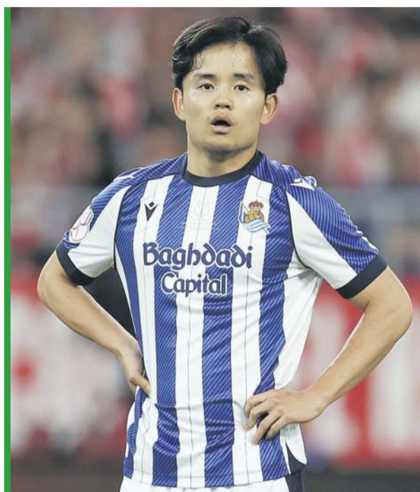
Takefusa Kubo musi wziąć grę na swoje barki.

H olendrzy to zdecydowani faworyci grupy F. Nie zmienia to nawet porażka w teście przed mundialem z Algierią 0:1. Selekcjoner Ronald Koeman postanowił jednak namieszać w kadrze. Oranje mierzą się z kilkoma kontuzjami, dlatego po ponad dwóch latach nieobecności do kadry wrócił 35-letni Marten de Roon. Zawodnik Atalanty dostał powołanie, ponieważ uraz wykluczył z gry Jerdy'ego Schoutena z PSV. Ponadto zabrakło piłkarza Liverpoolu Jeremiego Frimponga, a znalazł się Crysencio Summerville, który wraz z West Hamem spadł z Premier League. Holendrzy na ostatnich mistrzostwach odpadli na etapie ćwierćfinału i teraz liczą na lepszy rezultat. Jednocześnie reprezentacja Oranje jest jedyną drużyną w historii, która trzykrotnie wystąpiła w finale mistrzostw świata i ani razu nie wygrała (ostatni raz w 2010 roku przeciwko Hiszpanii 0:1). Z kolei reprezentacja Japonii chce odrobić lekcje z historii. W 2022 roku w Katarze Samurajowie ograli Niemców i Hiszpanów (po 2:1), wyszli z grupy z 1. miejsca, ale w 1/8 finału odpadli z Chorwacją. Ten etap jest wręcz przeklęty