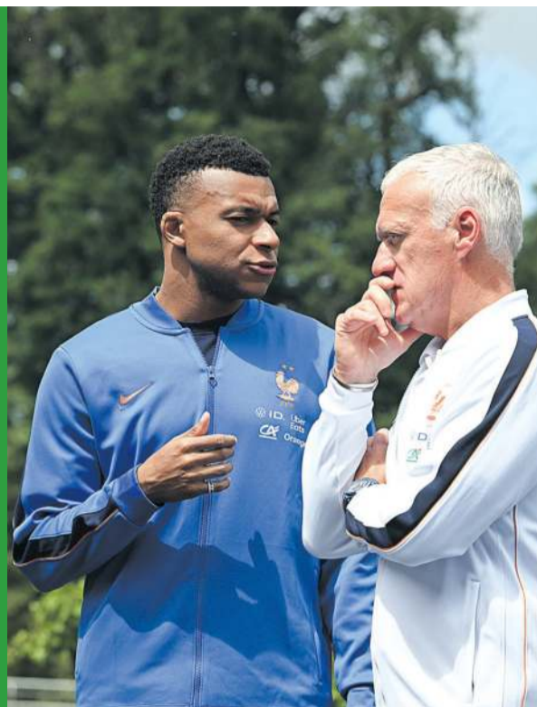
Kylian Mbappe i trener Didier Deschamps mają poprowadzić Francję do trzeciego tytułu mistrza świata. Uda się?