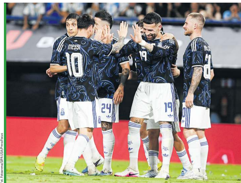
Czy Argentyńczycy będą przybijając tak piątki aż do finału?

Nie wydaje się żeby w grupie ktoś był w stanie Argentyńczyków powstrzymać. Austria jest coraz silniejsza, Algieria coraz bardziej doświadczona, Jordania to egzotyczny debiutant, jednak utknięcie Albicelestes w rozgrywkach grupowych byłoby niewyobrażalnym kataklizmem, choć nawet jeśli czegoś nie potrafimy sobie wyobrazić, to jednak może się to zdarzyć - jak choćby odpadnięcie Argentyńczyków w grupie podczas mundialu w 2002 roku, nawet Claudio Caniggia nie pomógł. Austria, która przez niektórych typowana jest jako czarny koń turnieju, zdecydowała się na niecodzienny krok. W meczu z Tunezją, odbywającym się w ramach przygoto-