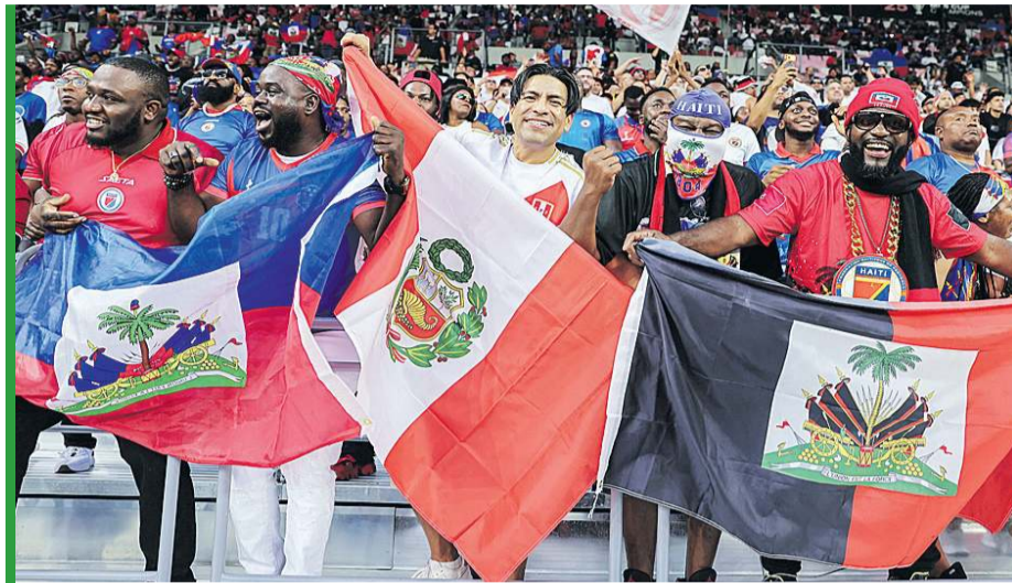
Haitańscy kibice stanowią będą barwną i głośną ekipę!

Oczywiście w swych szeregach wciąż mają gigantów. Carlo Ancelotti wziął do kadry – po niemal 2,5 roku nieobecności – Neymara, choć dzień przed ogłoszeniem nominacji tenże doznał kolejnego urazu, wykluczającego go być może z pierwszego meczu MŚ. Co ważniejsze jednak: za sprawą włoskiego trenera Brazylija wydaje się wreszcie zespołem, a nie zlepkiem indywidualności. Scena z finału LM, gdy Marquinhos – miast świętować z kolegami z PSG triumf w Lidze Mistrzów – pociesza rodaka z Arsenalu, niefortunego egzekutora karnego Gabriela Magalhaesa, zdaje się to doskonale ilustrować. Kluczem do sukcesu może być dyspozycja Viniciusa Juniora