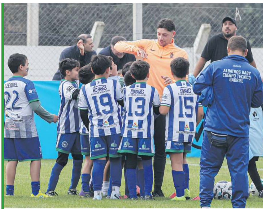
Piłkarz Realu Madryt Federico Valverde to idol urugwajskich dzieci.

Urugwajczycy poszukiwali kogoś, kto mógłby poukładać zespół na nowo. Wybrali geniusza, Marcelo Bielsę. Problem w tym, że w porównaniu do poprzednich lat, dysponuje on znacznie gorszą kadrą. Nie ma do dyspozycji Diego Forlana, który szalał na mundialu w RPA. Nie skorzystał z usług starszych się Edinsona Cavaniego i Luisa Suareza, któ-