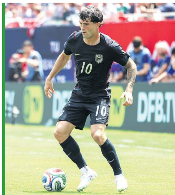
Christian Pulisic przelał się tuż przed mundialem. To dobry prognostyk na przyszłość?

– podkreślił obrońca Crystal Palace. Spopularyzowaniu pomóc może sukces sportowy. Największy w historii piłki w Stanach Zjednoczonych miał miejsce w... 1930 roku! Niemal sto lat temu zorganizowano pierwszy mundial, który rozegrano w Urugwaju. Tam Jankesi zajęli 3. miejsce. Sukcesem był także ćwierćfinał w 2002 roku. Jednak od kilkunastu lat (z wyjątkiem 2018 r., kiedy USA na MŚ się nie zakwalifikowała) Amerykanie mają problem z pokonaniem 1/8 finału. I chociaż piłkę trzeba spopularyzować w kraju, to reprezentacji głównie mają pomóc zawodnicy z klubów... europejskich. Na pierwszy plan wychyla się Christian Pulisic, pomocnik Milanu, który w sparingu z Senegalem (3:2) przelał się i strzelił swojego pierwszego gola w tym roku. W środku pomagają mu wspomniani McKennie oraz Tyler Adams z Bournemouth.