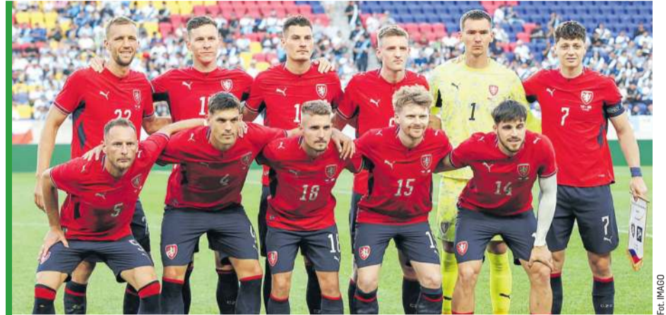
Czesi wracają na mundial po 20 latach. Czy nasi sąsiedzi okażą się czarnym koniem imprezy?

Czesi na mundial wracają po 20 latach nieobecności, co już samo w sobie jest sukcesem. W XXI wieku na najważniejszej sportowej imprezie świata zagraли zaledwie raz, w 2006 roku w Niemczech. Naszą kadrę prowadził wtedy Paweł Janas, nie ma co czarować - dawno temu. Nasi południowi sąsiedzi przeważnie dobrze wypadali na mistrzostwach Starego Kontynentu, ale mundial? To nie była ich bajka. W Czechach mówi się, że w piłkę grają tam ci, którzy byli za stabi do hokeja, ale dzisiaj to już raczej stereotyp niemający wiele wspólnego z rzeczywistością. Faktem jest, że gdyby piłkarze mieli pozycję równą w świecie hokeistów - kibicowaliby im z pewnością więcej „fanousków”. Warto przypomnieć, że bilety dla Ameryki Północnej wywalczyli w niesamowitych okolicznościach. W grupie niczym wielkim nie zaimponowali, zajęli drugie miejsce za Chorwacją,