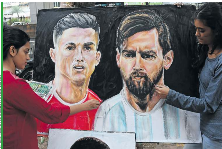
Dla Cristiano Ronaldo i Lionela Messiego mundial w Ameryce Północnej będzie szóstym w karierze.

Ostateczne składy podkreślają zarówno ciągłość, jak i odnowę w światowej piłce nożnej. 357 zawodników powraca na mundial po przynajmniej jednym wcześniejszym udziale w nim, a 891 graczy repre-