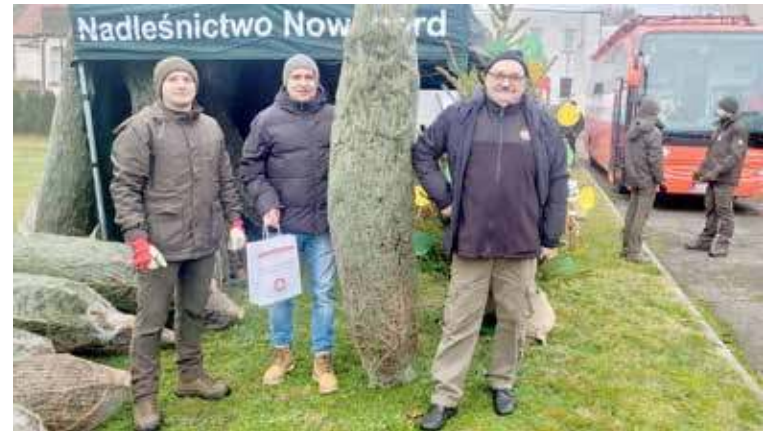
Każdy z tego dnia oddających krew mógł liczyć na świąteczne drzewko

Ponad 50 osób zdecydowało się dziś oddać krew w ramach akcji Nadleśnictwa Nowogard pn. „Choinka dla życia”. Duża frekwencja świadczy o niewątpliwym sukcesie akcji.