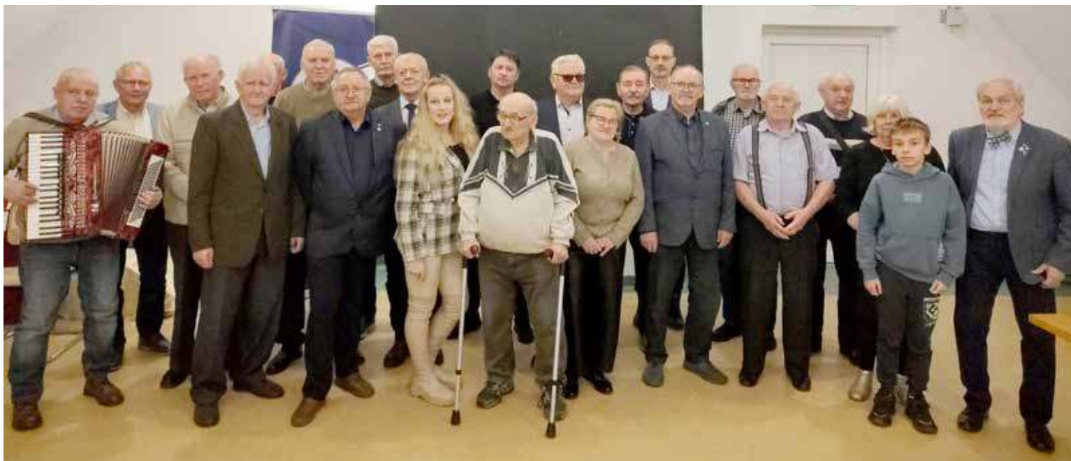
Pamiątkowe zdjęcie uczestników spotkania .jpg