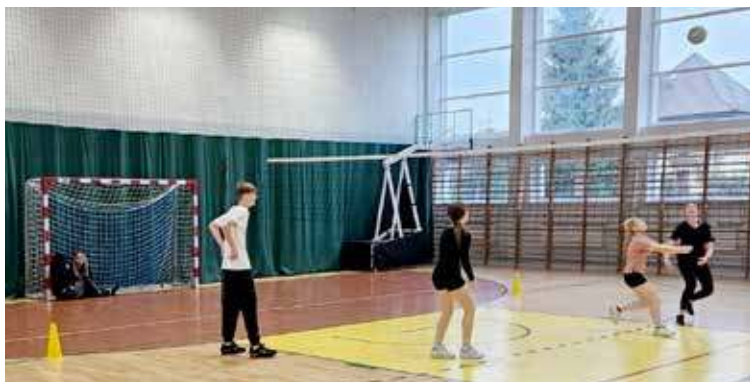
Kotary grodzące pomogą w podziale sali sportowej na kilka stref ćwiczebnych

Jak tłumaczą pracownicy starostwa, wsparcie finansowe samorządu województwa umożliwiło doposażenie sali gimnastycznej w nowoczesne