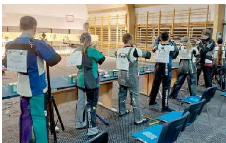
Mistrzostwa rozegrano na strzelnicy w Kołobrzegu