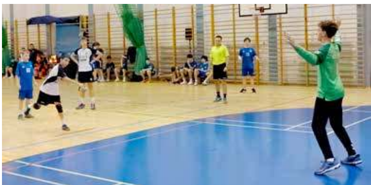
Próba z rzutu karnego zakończona bramką

Również po raz pierwszy drużyna zagrała mecz ligowy