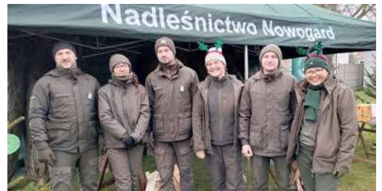
Drużyna Nadleśnictwa w trakcie akcji