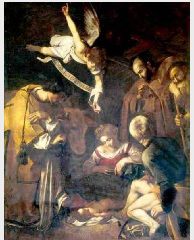
Narodzenie Pańskie ze św. Franciszkiem z Asyżu i św. Wawrzyńcem - Caravaggio 1610. Obraz skradziony w 1969 roku (i nie odnaleziony) z oratorium San Lorenzo w Palermo na Sycylii