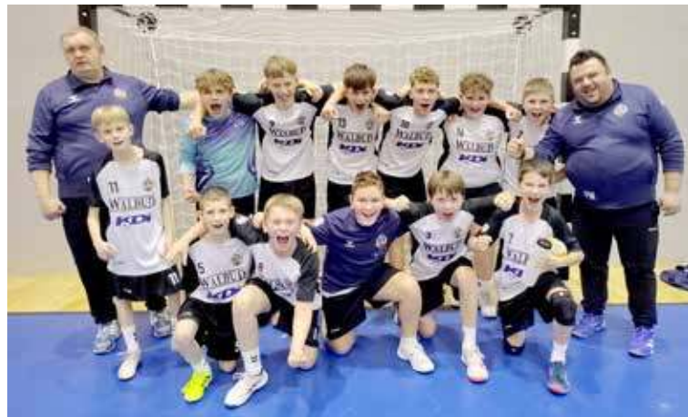
Drużyna młodzika miała powody do radości

poza halą II LO. Zespół Kusego Szczecin goszczony był w hali SP nr 1. Wszystko to z uwagi na rozpoczynającą się przebudowę hali przy ul. Bohaterów Warszawy, która potrwa przynajmniej do połowy 2026 roku.