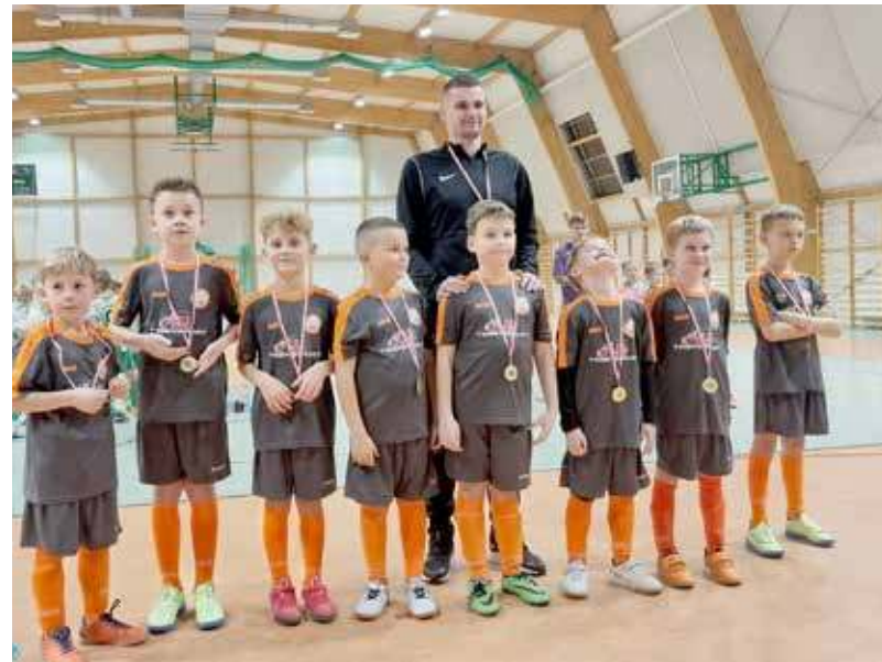
Drużyna spisała się na medal