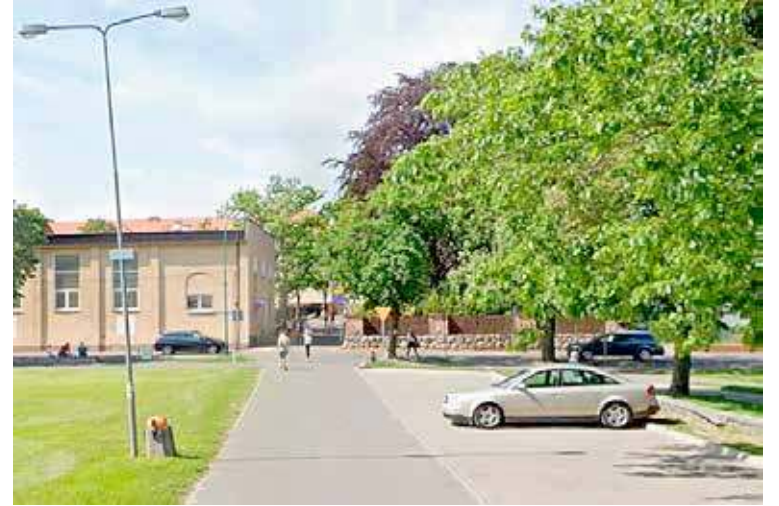
Widoczny odcinek Placu Szarych Szeregów nie od wczoraj służy jako tor do popisów młodych kierowców

Choć dla niektórych manewry w formie efektownego driftu mogą wyglądać widowiskowo – na profesjonalnych torach, pod okiem instruktorów – to na drogach publicznych stanowią poważne zagrożenie. Wystarczy ułamek sekundy, aby sytuacja wymknęła się spod kontroli i