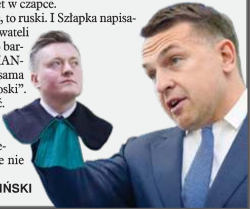
Ilustr. KRZYSZTOF OLEJNIK

Nieodłącznym elementem tej opowieści były także gigantyczne pensje i przywileje dla ludzi wokół PFN – dyrektorzy, prezesi, członkowie zarządów zarabiali dziesiątki tysięcy miesięcznie, a służbowe karty potrafiły posłużyć nawet do opłacania napiwków czy lotów biznes klasą. Do tego dochodziły koszty wynajmu biur w centrum Warszawy, opłacanie doradców, prawników i PR-owców. W sumie – imperium pozorów, które pochłaniało setki milionów bez kontroli. Wynagrodzenia członków rady sięgały ponad 30 tys. zł miesięcznie, a niektórzy łączyli funkcje z innymi intratnymi posadami w spółkach.