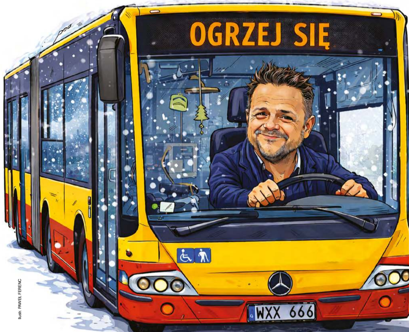
Ilustr. PAWEŁ FERENC