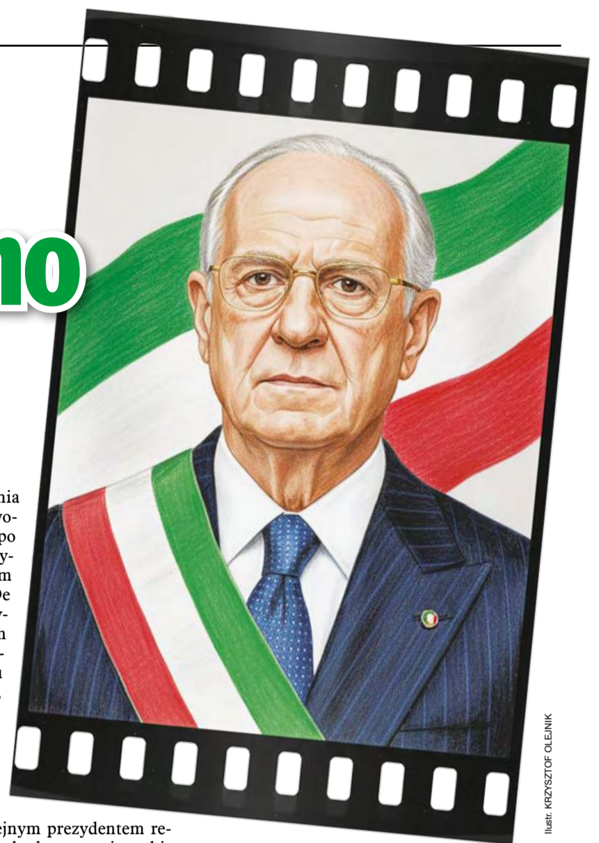
Ilustr. KRZYSZTOF OLEJNIK

kandydat na włoskiego prezydenta musi mieć co najmniej 50 lat. W praktyce jednak pięćdziesięcioletek na prezydenturę we Włoszech nie ma szans – gdy Napolitano obejmował urząd, miał lat 80; Mattarella tylko 73.