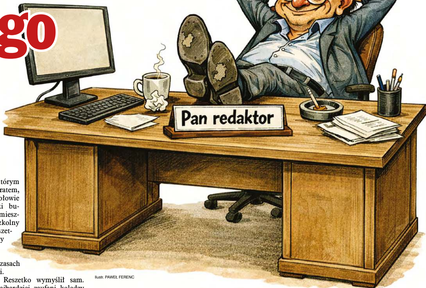
ilustr. PAWEŁ FERENC

W ogólniaku byłem redaktorem, a jednocześnie uprawiałem sport; w wielkim uproszczeniu można powiedzieć, że już byłem dziennikarzem sportowym, tyle że oba czynniki występowały osobno. Trenując piłkę ręczną, nie pisałem o niej,