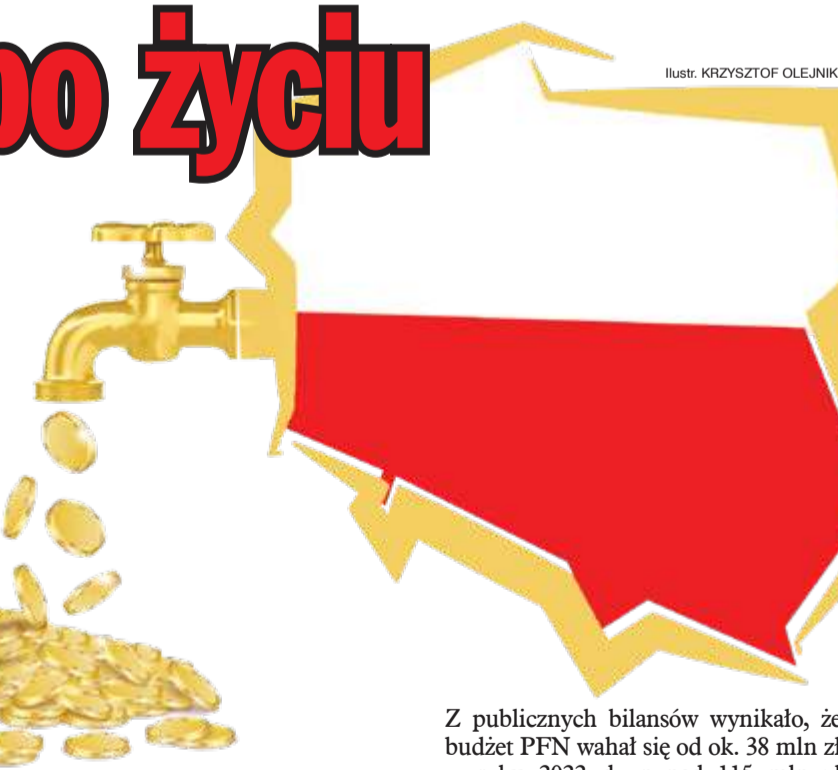
Ilustr. KRZYSZTOF OLEJNIK

Potężny strumień pieniędzy płynął do podmiotów i ludzi łatwo identyfikowanych z PiS. Jednym z najbardziej znanych projektów była kampania „Sprawiedliwe sądy”, która – zamiast promować Polskę – infor-