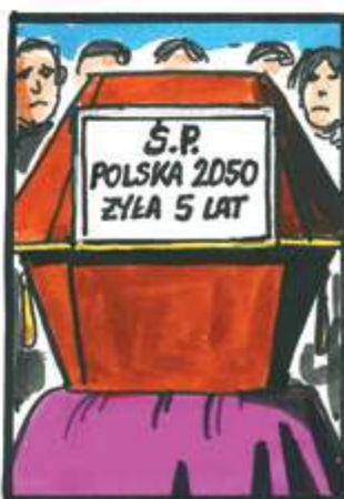
Rys. RYSZARD DĄBROWSKI