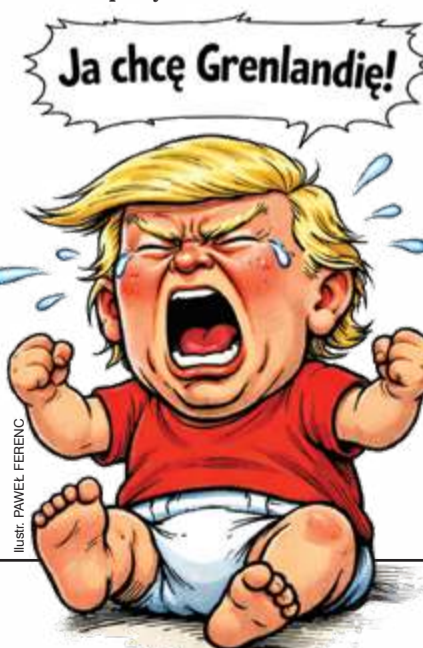
Ilustr. PAWEŁ FERENC

Jej przejawami są zmiany zachowania i osobowości, zmiany językowe, poznawcze, motoryczne, problemy z kontrolą emocji. Wszystkie te zjawiska są diagnozowane u prezydenta USA.