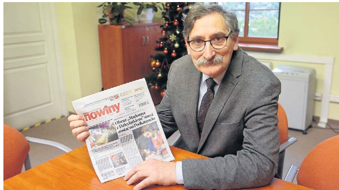
A. Sapeta - Obraz jest wybitny. Malarstwo włoskie z przeł. XVI i XVII w. było bogate w takie przedstawienia Św. Rodziny

Te dwa obrazy są wystawiane w małych miejscach. Czy to pomniejsza ich wartość? Absolutnie nie. Bardzo często jest tak, że jedno dzieło sztuki