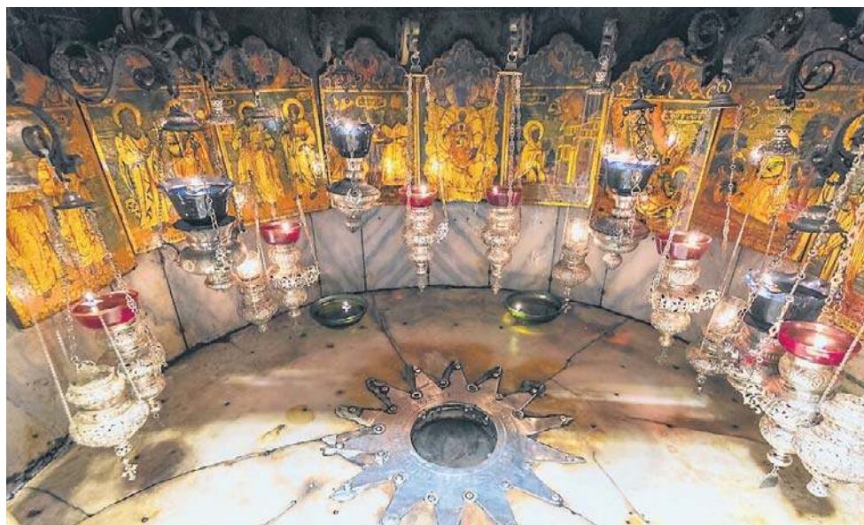
O tym, że zarówno bazylika, jak i Grota wymagają remontu, poinformowali już w 2008 roku duchowni z Ziemi Świętej

Przy ekumenii pojawił się też aspekt polityczny: renowacja ma przynieść wymierne finansowe