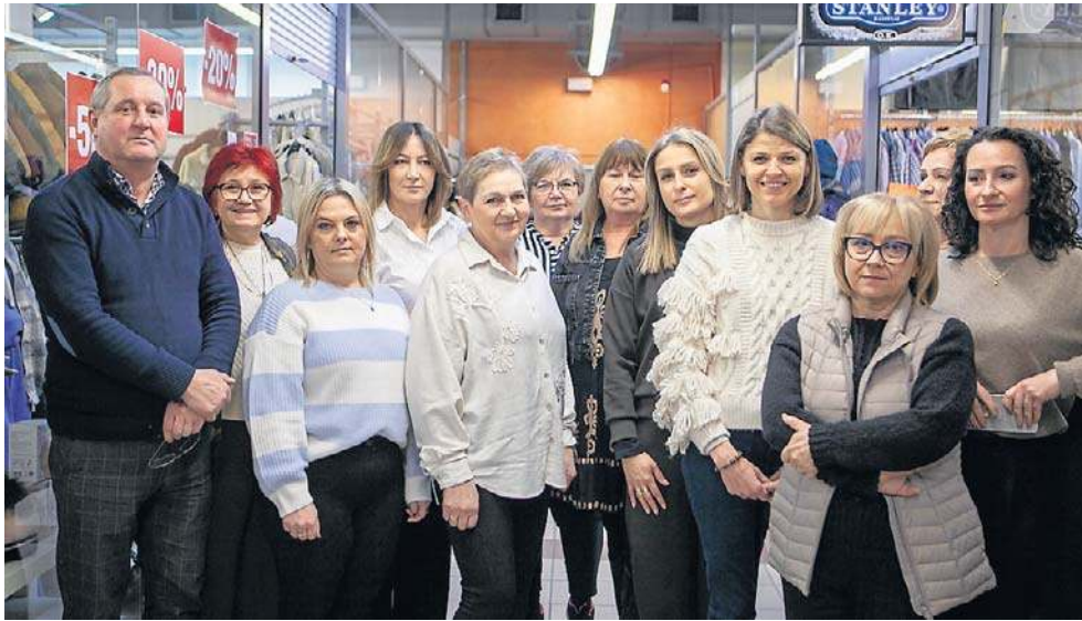
Rzeszowski Full Market nadal jest źródłem utrzymania dla wielu osób. Niektórzy pracują tu od otwarcia w czerwcu 1998 roku

I w tym wszystkim nie wspomiano, że Full Market nadal jest źródłem utrzymania dla wielu osób, którzy w cieniu pandemii i wojny, walczą o byt.