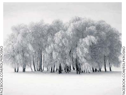
III nagroda – Mirosław Kwolek z Nowego Sącza za fotografię „Milczenie brzoź”

w Jaworznie, Szkoła Podstawowa w Korzeniowie, Zespół Szkół Inżynierii Środowiska w Toruniu oraz Zespół Szkolno-Przedszkolny nr 6 w Wałbrzychu.