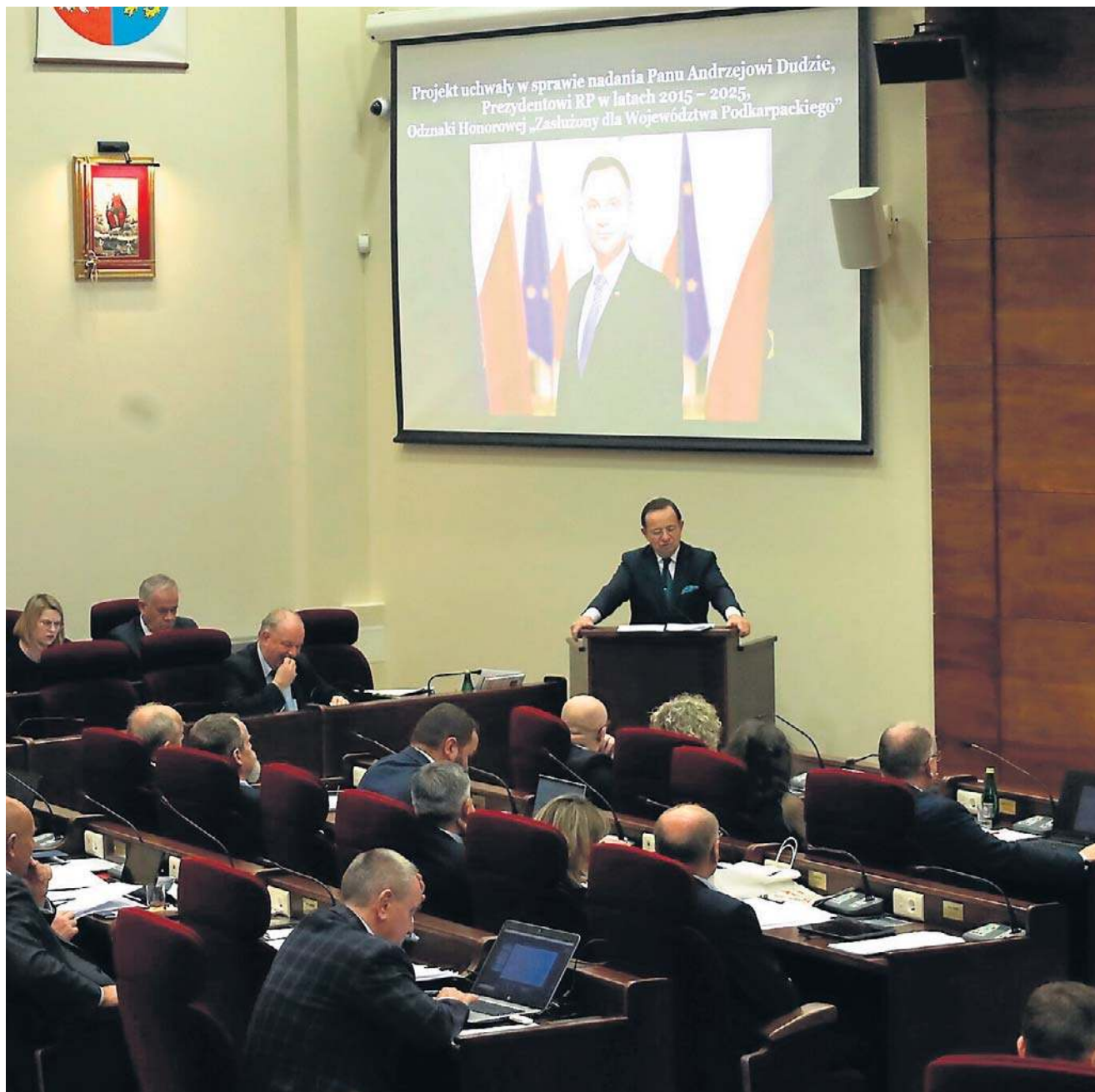
O zasługach prezydenta Andrzeja Dudy dla Podkarpacia mówił w swoim wystąpieniu marszałek Władysław Ortyl