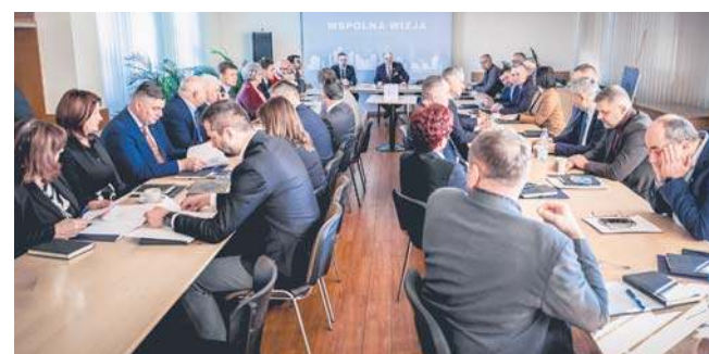
Zebranie walne Stowarzyszenia Samorządów Terytorialnych Aglomeracja Rzeszowska

Nowy, poszerzony Zarząd rozpoczyna pracę z silnym mandatem i szerokim poparciem członków stowarzyszenia. Przed nim kolejne inicjatywy i projekty, które mają służyć wzmocnieniu współpracy samorządowej oraz rozwojowi lokalnych społeczności całego regionu.