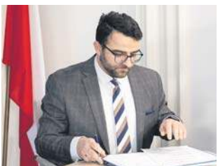
Krzysztof Jarosz Starosta Rzeszowski podczas podpisania listu intencyjnego.

W Rzeszowie powstanie nowy, nowoczesny dworzec autobusowy – inwestycja, która ma diametralnie zmienić funkcjonowanie komunikacji publicznej w stolicy Podkarpacia. Przedstawiciele Województwa Podkarpackiego, Powiatu Rzeszowskiego oraz Związku Gmin „Podkarpacka Komunikacja Samochodowa” podpisali list intencyjny doty-