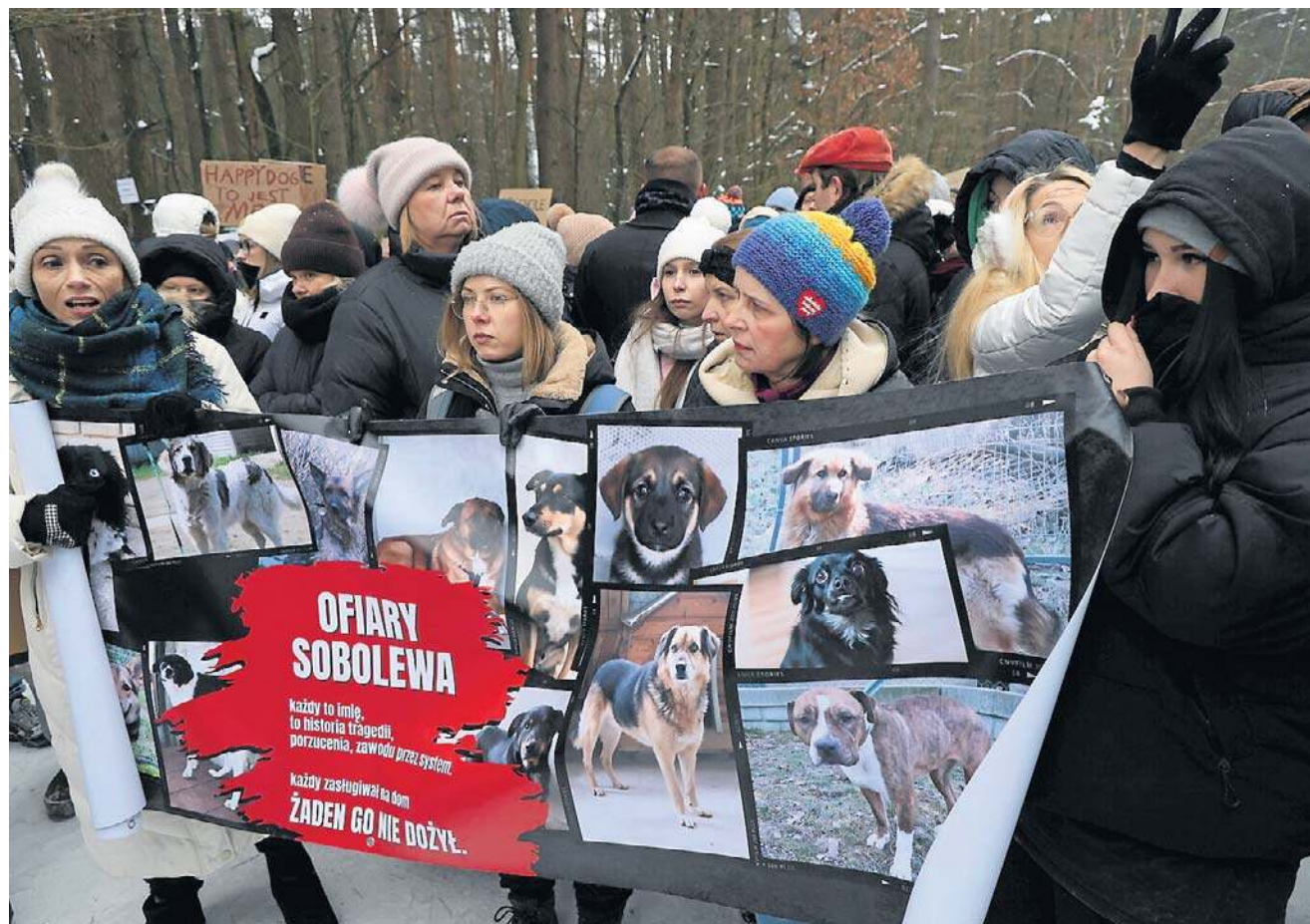
Pikieta przed schroniskiem w Sobolewie. To jeden z przypadków, gdy piekło zwierząt nagłośniła Doda

I dodaje, że kiedy w schroniskach dzieje się źle, odpowiedzialność za nieprawidłowości powinny ponosić schronisko i gmina. Schronisko jest niejako wykonawcą zlecenia, ale gmina opiekunem prawnym zwierzęcia. Jeżeli wie, a powinna wiedzieć, że w schronisku dzieje się źle i nic z tym nie robi, ponosi