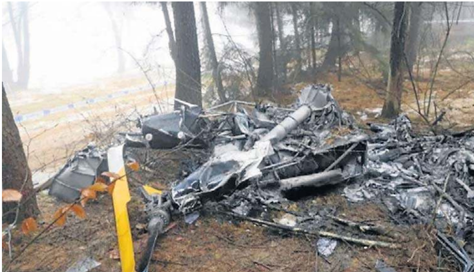
Jak czytamy w raporcie KBWL, śmigłowiec po zderzeniu z ziemią zapalił się i uległ zniszczeniu

Raport przedstawia fakty dotyczące okoliczności zaistnienia i przebiegu dramatu. Komisja przeprowadziła oględziny wraku śmigłowca i miejsca zdarzenia. Zabezpieczono dokumenty dotyczące obsługi śmigłowca oraz uprawnień i historii szkolenia pilota. Ze zbiornika, który oddzielił się od kadłuba, pobrano próbkę paliwa do badania.