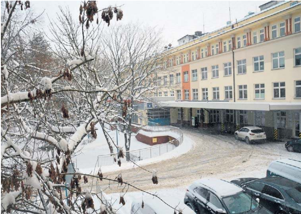
Szpital od ubiegłego roku ma możliwość pobierania narządów od zmarłego

Swoją rolę w tej poprawiającej się statystyce ma również Powiatowy Szpital Specjalistyczny w Stalowej Woli, który przypomniał o tym w Ogólnopolskim Dniu Transplantacji. W maju 2025 roku doszło tu