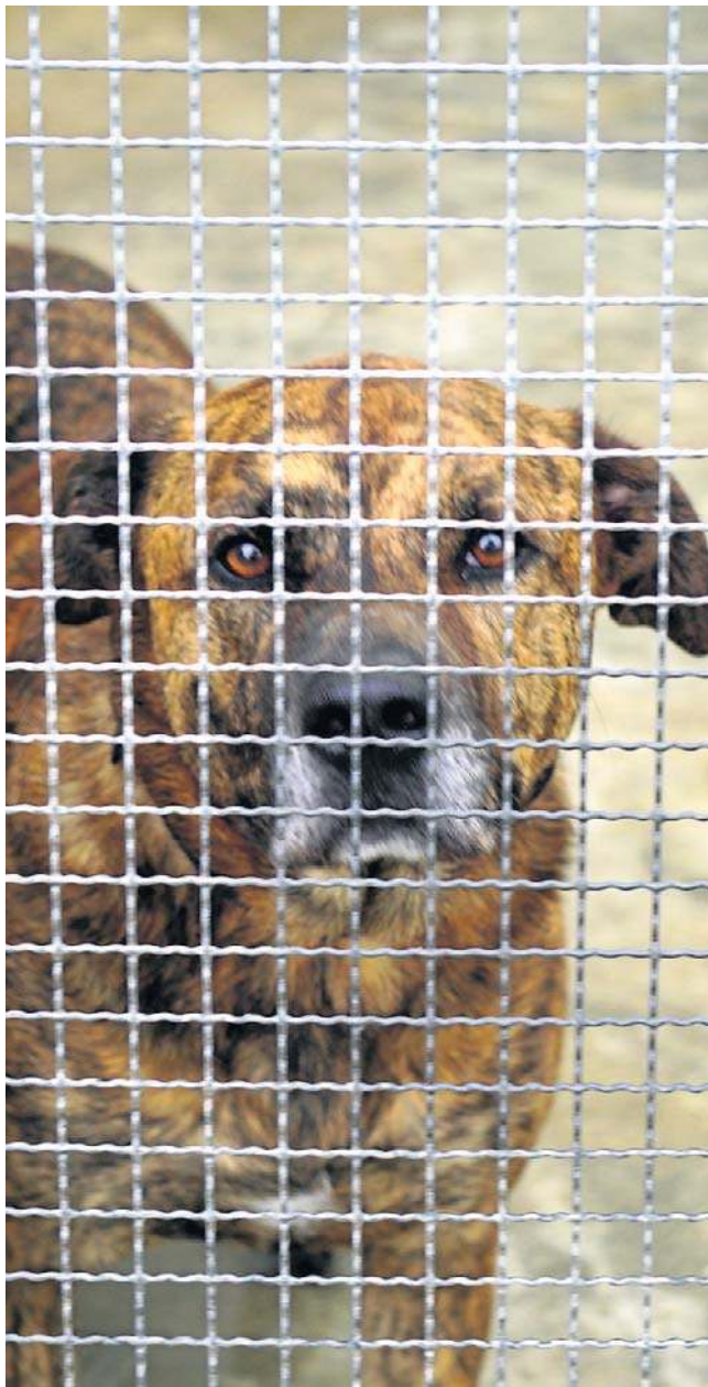
W Polsce funkcjonuje ponad 200 zarejestrowanych schronisk dla bezdomnych zwierząt