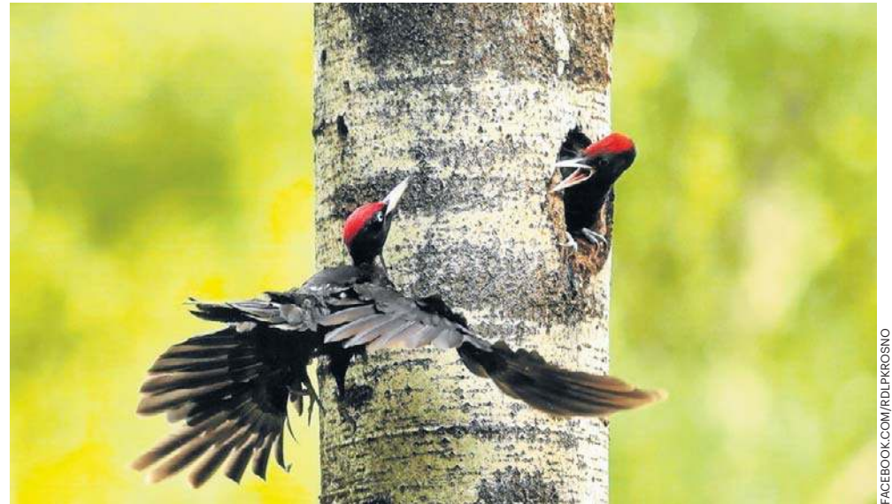
I nagrodę otrzymał Jarosław Klej z Sokółki za fotografię „Powrót taty”

Jury przyznało siedem równorzędnych wyróżnień. Jak zaznacza Marszałek, organizatorzy uhonorowali dyplomami placówki aktywnie promujące fotografię przyrodniczą. Wyróżnienia otrzymały Szkolno-Koło Fotograficzne „Światłoczuły” przy ZSP nr 4