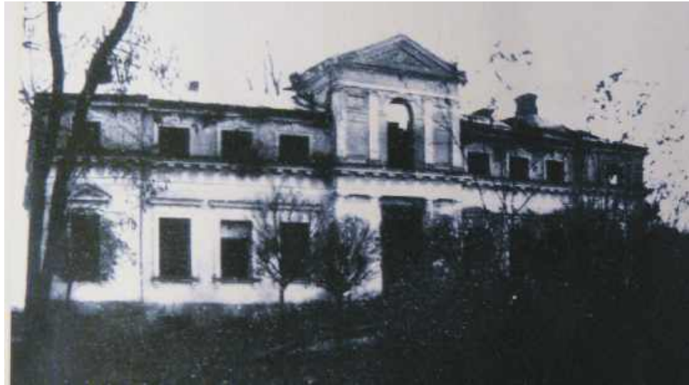
Elewacja frontowa pałacu tuż po II wojnie światowej