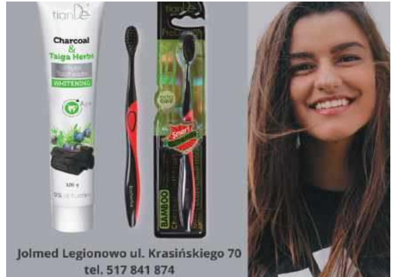
Joimed Legionowo ul. Krasińskiego 70 tel. 517 841 874

Szczoteczka do zębów „Węgiel bambusowy” : - łagodnie oczyszcza, poleruje szkliwo zębów i masuje dziąsła; - może być używana przy nadwrażliwości zębów i osłabionych dziąsłach; - usuwa nalot bakteryjny nawet w miejscach trudno dostępnych. Szczoteczka do zębów „Węgiel bambusowy” pozwoli Tobie znów uśmiechać się od ucha do ucha! Dlaczego jest tak skuteczna? Miękkie i cienkie włoski. Produkt ten na pewno polubią osoby cierpiące na nadwrażliwość