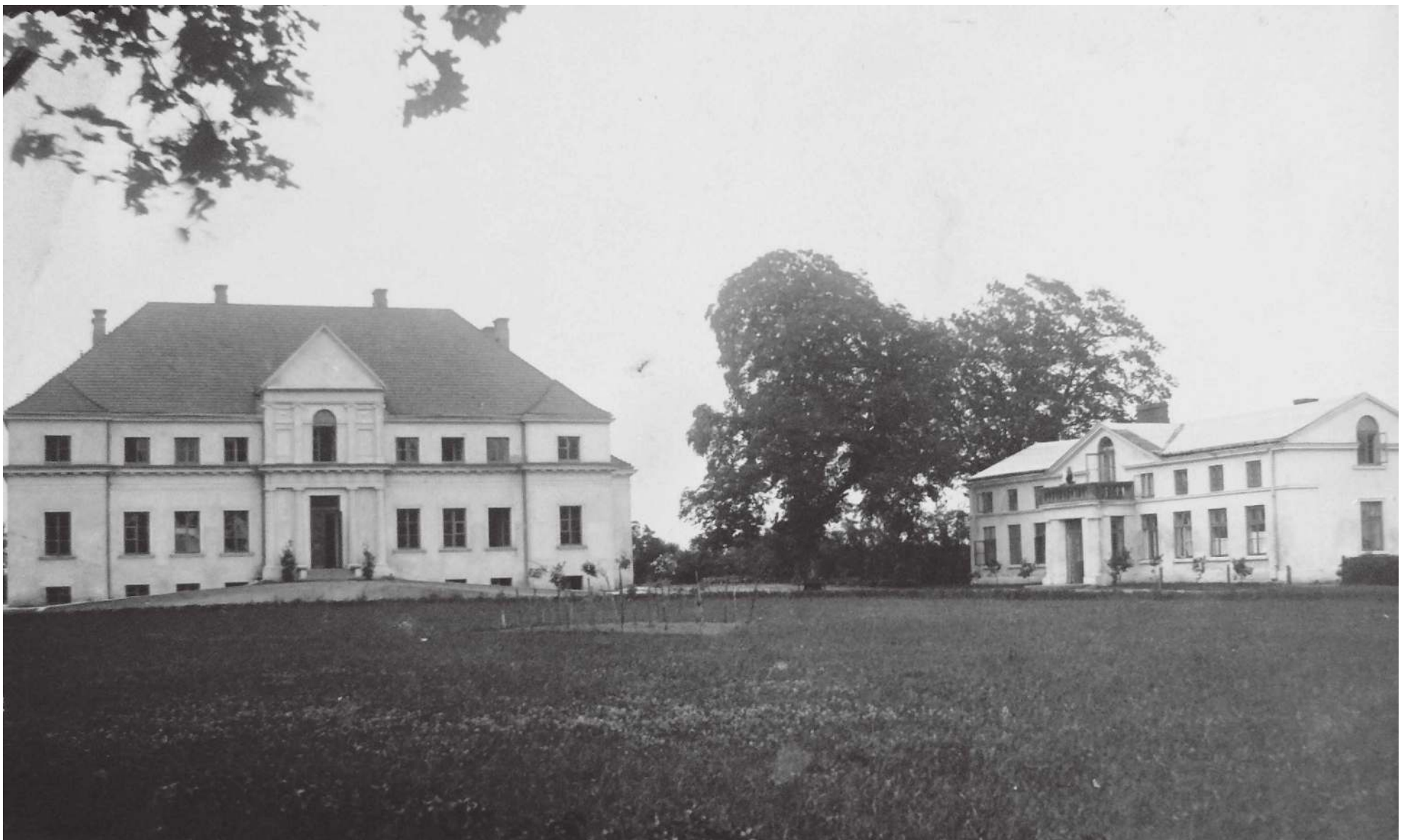
Pałac i oficyna w Górze przed II wojną światową