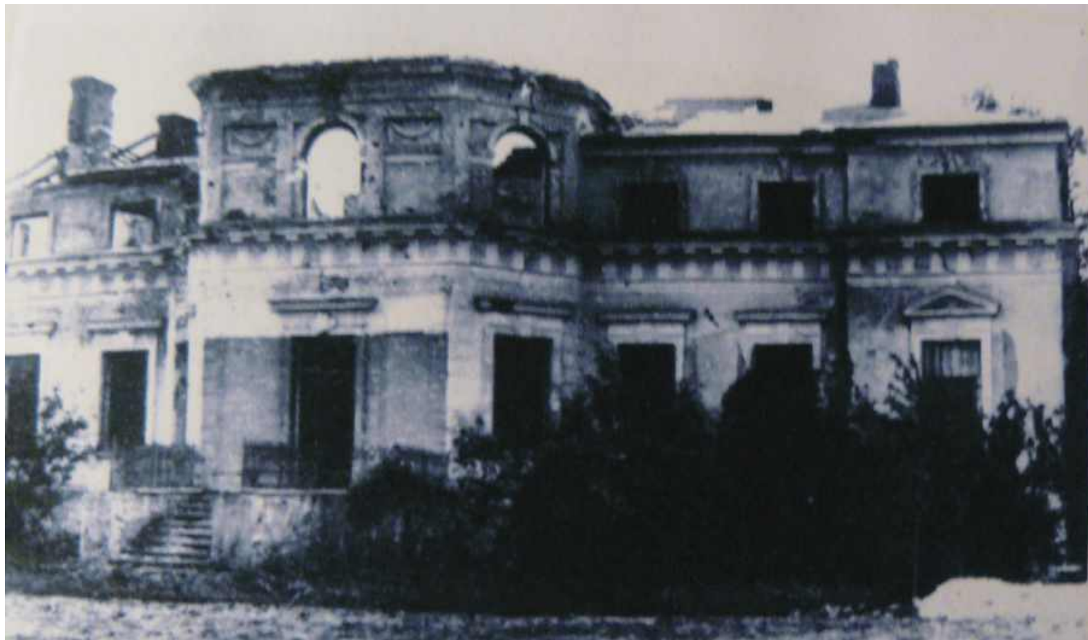
Elewacja pałacu (od strony obecnego jeziora Góra) tuż po II wojnie światowej

Zdjęcia ruin z „Projekt rewitalizacji ruin dworców i zespołów pałacowych położonych w powiecie legionowskim”