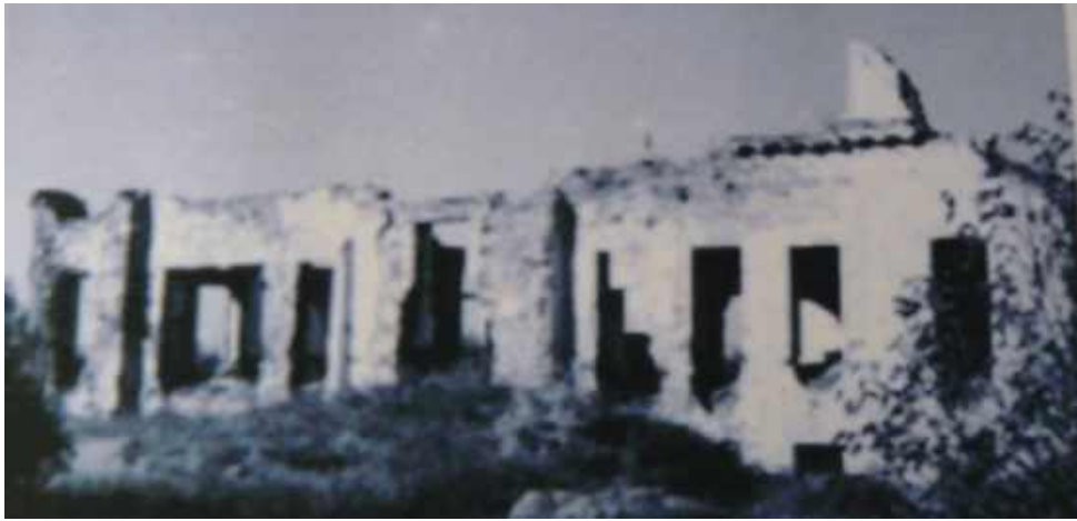
Ruiny pałacu - lata 70-te XX wieku