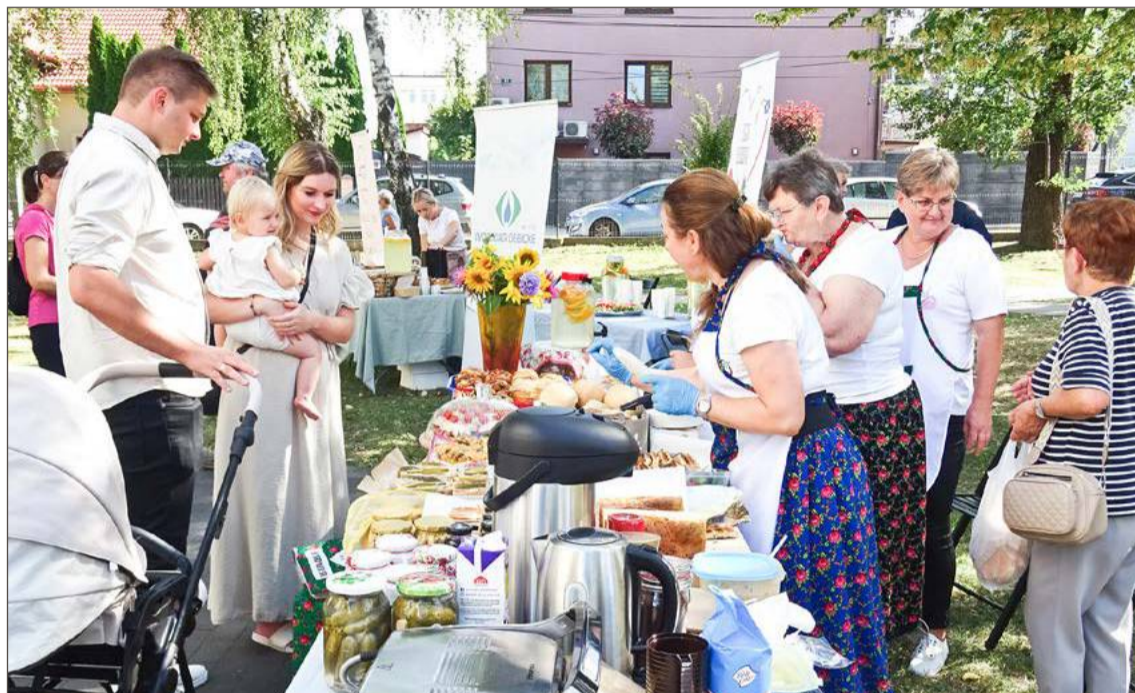
Na stoisku przygotowanym przez panie z KGW w Bukowej każdy mógł znaleźć coś smacznego dla siebie.

Nie zawsze to, czego chcieliby dla niej rodzice, spina się z tym, co lubi