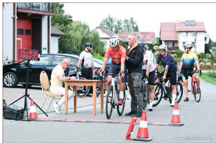
Kolarze mieli do pokonania trasę o długości 9 km.