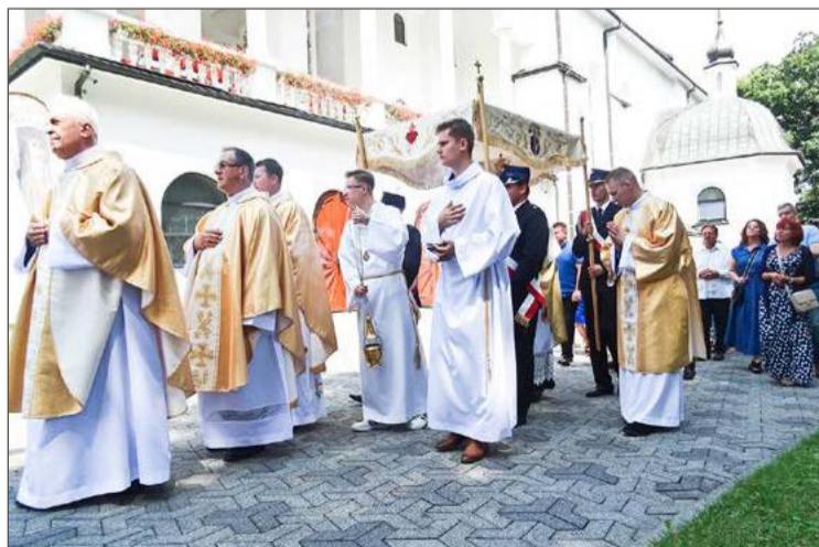
Na zawadzkie wzgórze od 6 do 14 września zaprasza ks. Józef Książek.

Dlatego też zaprasza na tegoroczny odpust wszystkich, którzy na nim w przeszłości bywali, ale też tych, którzy jeszcze nie byli. Msze