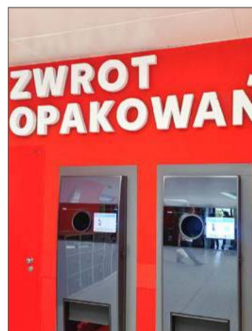
Taki automat w mieście na razie jest jeden.