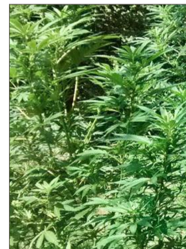
Uprawa była bardzo zadbana.

W nielegalnej uprawie zabezpieczyli łącznie 36 krzewów konopi.