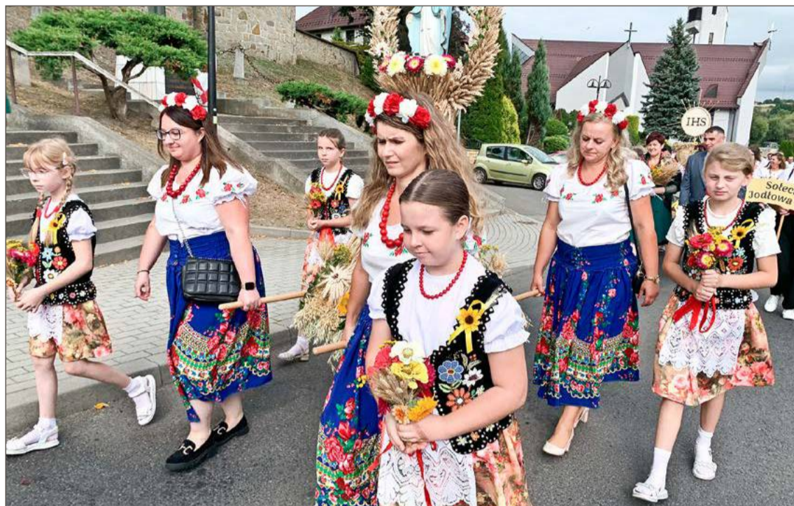
Mieszkancki Dębowej w dożynkowym pochodzie z kościoła na miejsce oficjalnych uroczystości.

- To dzięki wam, drodzy rolnicy, możemy być pewni, że zapewnicie