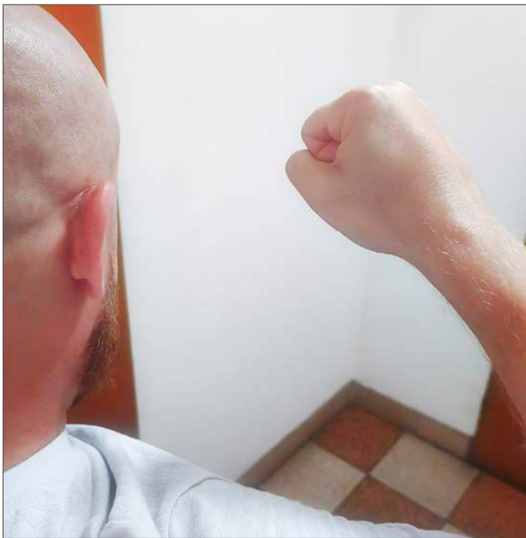
Z uwagi na dobro pokrzywdzonych, sąd orzekł areszt tymczasowy.

- Dostał też zakaz zbliżania się do nich na odległość bliższą niż 50 metrów przez 5 lat oraz kontaktowania się bez zgody pokrzywdzonych – relacjonuje Tomasz Zwierzyk, prokurator rejonowy.