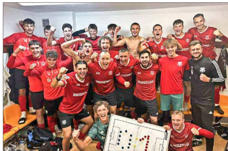
Drużyna gra obecnie w IV lidze podkarpackiej.

A atrakcji, jak zapewniają, nie zabraknie. Prócz turnieju piłkarskiego lokalnych gwiazd futbolu, będą również dmuchańce i animacje dla najmłodszych, a także zabawa ta-