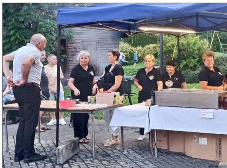
Koło Gospodyń Wiejskich w Siedliskach-Bogusz dzięki dofinansowaniu zorganizowało też piknik rodzinny.

W dwóch wiatach funkcjonują po dwa stowarzyszenia i obydwie mo-