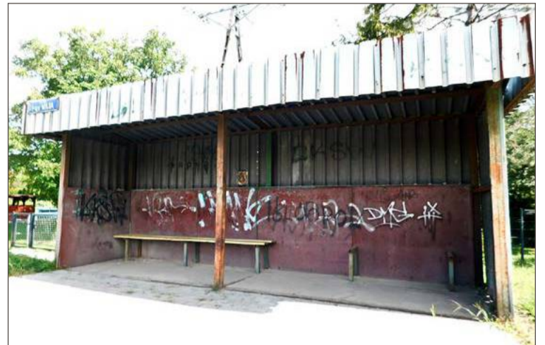
Ta wiata przystankowa nie jest najlepszą wizytówką miasta.

Dodaje, że w tegorocznym budżecie pieniądze na ich wymianę na pewno się nie znajdują, szczególnie że jak przekonuje, z końcem roku urzędnicy każdą złotówkę obracają cztery razy zanim zdecydują