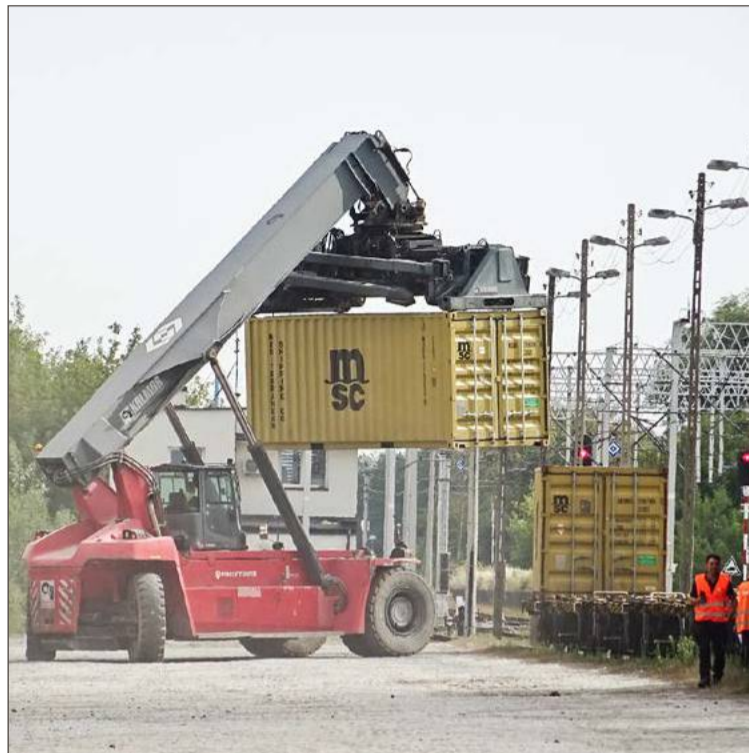
Kontenery od MSC też są przeładowywane na stacji Dębica Towarowa.

Rozpoczęcie współpracy z Medlog, a później z Maersk pozwala