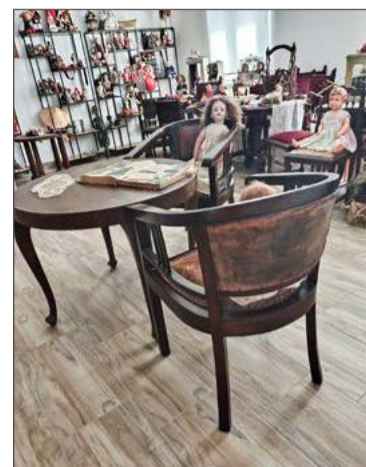
Lalki pokazywane są na 600 m 2 powierzchni ekspozycyjnej.

- Jeśli chodzi o cykl obyczajów i wierzenia narodów świata to zaczynamy od judaizmu i chrześci-