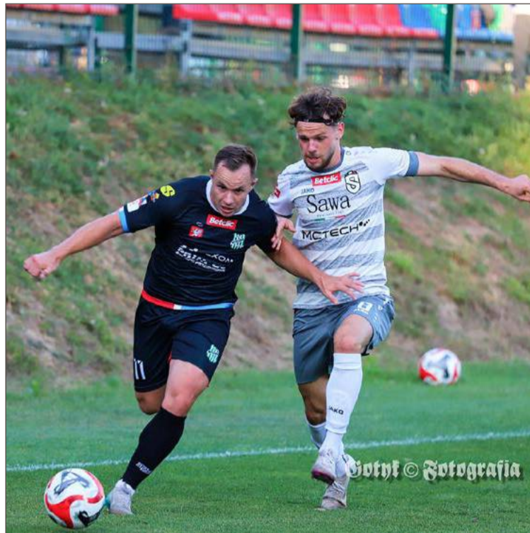
W meczu ze Świdniczanką piłkarze Wisłoki musieli zadowolić się remisem.

Gospodarze otworzyli wynik spotkania po rzucie różnym. Efektownym strzałem z woleja popisał się Kowalski. Wisłoka odpowiedziała również ze stałego fragmen-