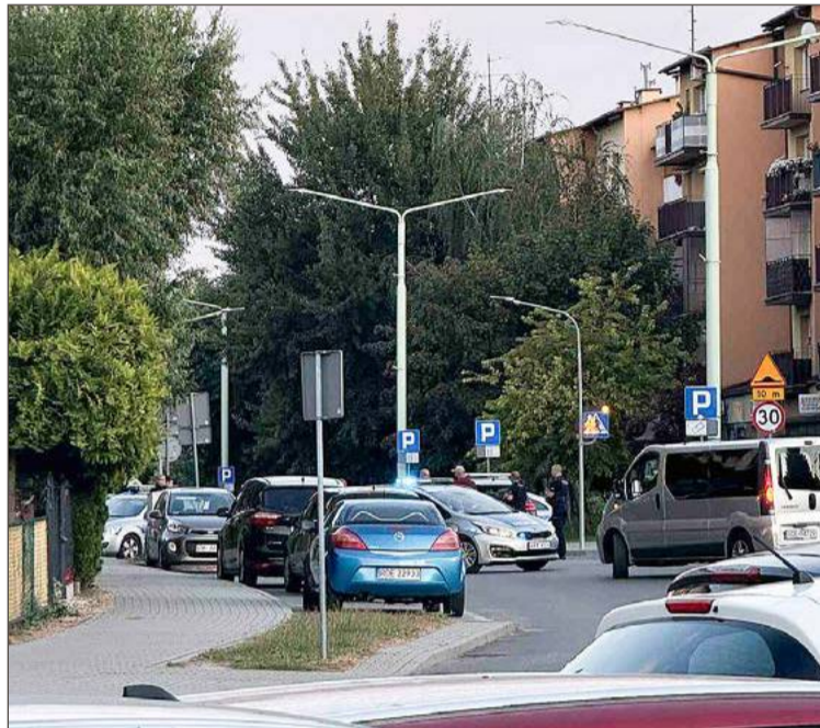
Mieszkańcy z niepokojem obserwowali, co się dzieje.

Funkcjonariusze zatrzymali czterech mężczyzn w wieku: 25, 31, 34 i 40 lat. Podczas prze-