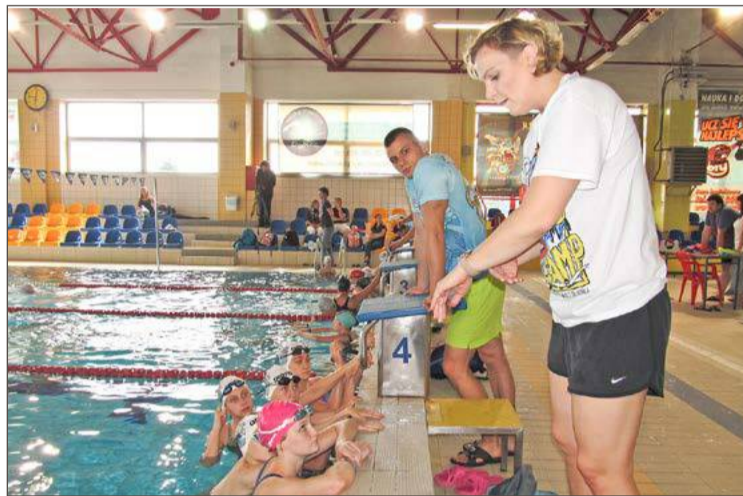
Otylia Jędrzejczak, szefowa PZP, dobrze zna dębicką pływalnię.

A fakt, że mistrzyni olimpijska w pływaniu jest obecnie prezeską Polskiego Związku Pływackiego, ma w tym przypadku bardzo duże znaczenie. Szczególnie że, jak podkreśla burmistrz, który był w tej sprawie w Ministerstwie Sportu i Turystyki, jeśli pojawią się programy, z których będzie można zdobyć dofinansowanie, to będą one