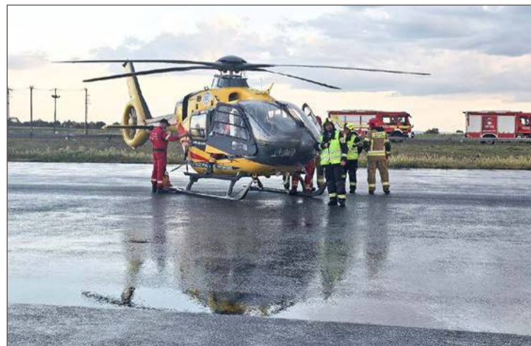
Na miejsce zadysponowany został śmigłowiec LPR.