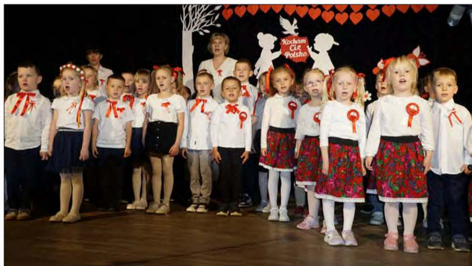
☛ Uroczystość rozpoczęła się od odśpiewania hymnu Polski