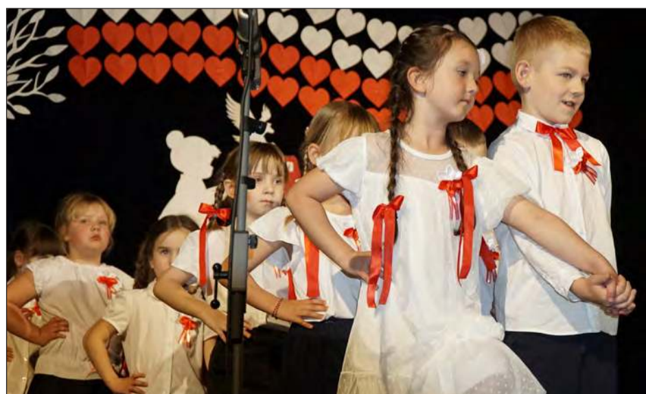
☛ 5-latki z grupy „Tygryski” zaprezentowały poloneza