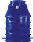
Studnie wodomierzowe z atestem