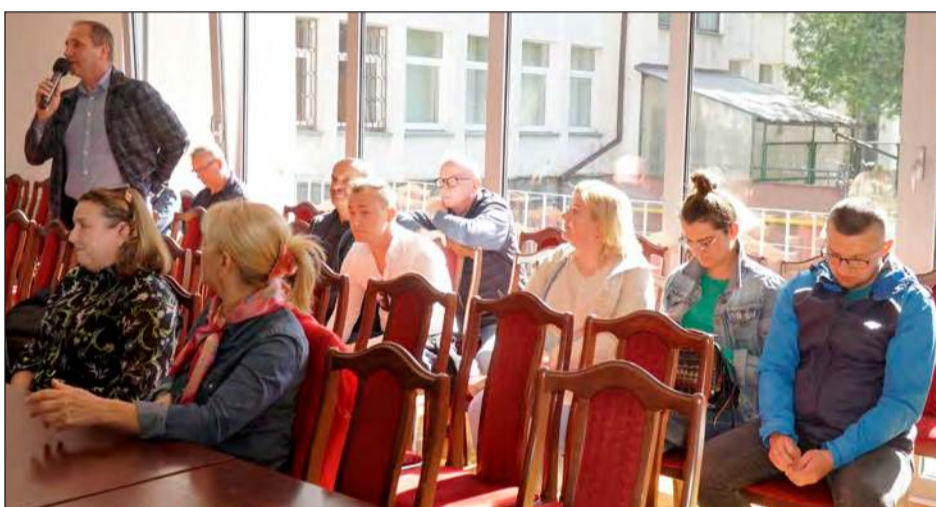
» Podczas dyskusji mieszkańcy przedstawiali szereg swoich argumentów, aby przekonać radnych do podjęcia decyzji o przejęciu od PKP dworca na rzecz gminy

niaczy budynek niedawno odzyskał blask dzięki przejęciu przez gminę i urządzeniu tam centrum kultury. Chęci jednak po stronie rycyńskiego samorządu nie było. Nie było też innych zainteresowanych przejęciem zrujnowanego budynku. Przerazały koszty doprowadzenia go znów do użytku, a później utrzymania. Radni poprzedniej i obecnej kadencji jednomyślnie opowiadali się, aby nie przejmować budynku, tłumacząc to tym, że gmina na swoim terenie ma już ponad 30 świetlic, które musi utrzymywać. Z drugiej strony w 2022 roku burmistrz wpisał na listę zabytków gminy Ryki były dworzec kolejowy w Leopoldowie. Miało to utrudnić PKP ewentualną rozbiórkę budynku. Tyle, że kolej zaskarżyła decyzję burmistrza argumentując, że obiekt nie ma wartości historycznej, artystycznej ani naukowej, a wpisanie go do ewidencji było uznaniowe. Sąd przyznał rację PKP i unieważnił decyzję, dając kolej swobodę dysponowania budynkiem bez ochrony konserwatora. Budynek jednak pozostał. Nic się tam nie działo, poza dalszą degradacją.