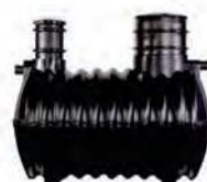
Oczyszczalnie drenażowe CE

ZBIORNIKÓW PE I OCZYSZCZALNI ŚCIEKÓW, PRZEPOMPOWNI, ZBIORNIKÓW NA DESZCZÓWKĘ, STUDNI WODOMIERZOWYCH