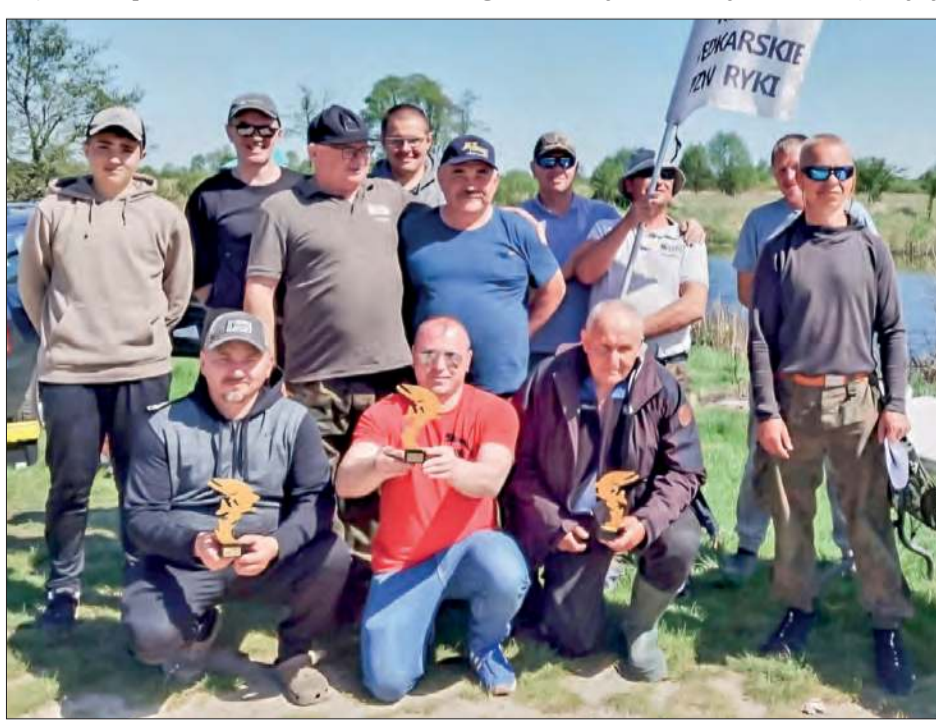
Spinningowe „Otwarcie Krzaka” wędkarzy z „Czystej Wody” odbyło się w Ruskiej Wsi nad Wieprzem