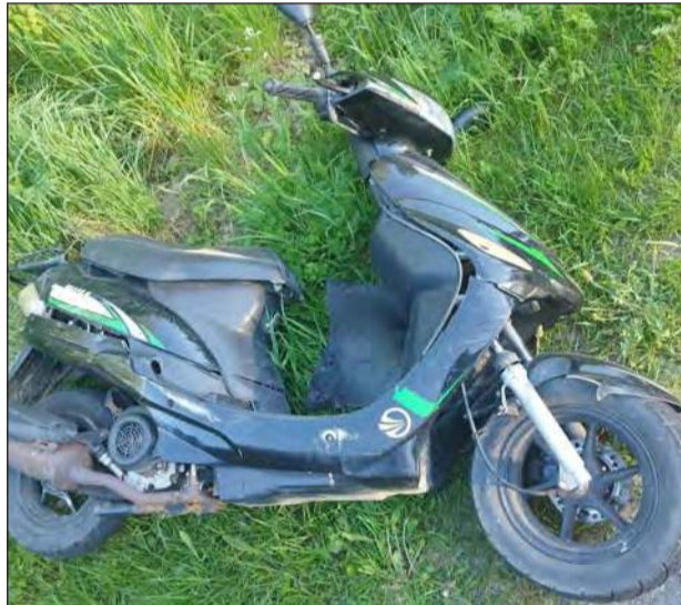
Niechronieni uczestnicy ruchu drogowego są grupą najbardziej narażoną na odniesienie urazów w przypadku zdarzenia drogowego. Do nich zaliczamy również motorowerzystów i motocyklistów - przypomina asp. Łukasz Filipek z ryckiej policji

Funkcjonariusze apelują również do kierowców o zachowanie ostrożności na drogach. - Niechronieni uczestnicy ruchu drogowego są grupą najbardziej narażoną na odniesienie urazów w przypadku zdarzenia drogowego. Do nich zaliczamy również motorowerzystów i motocyklistów. Apelujemy