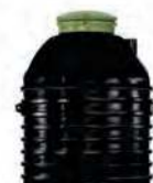
Zbiorniki na deszczówkę