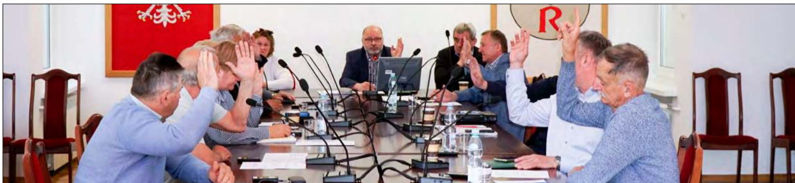
» Radni dali się przekonać. Wszyscy obecni na sesji zagłosowali za tym, aby gmina Ryki przejęła dworzec PKP w Leopoldowie

Zawiązał się komitet społeczny, który przygotował petycję w sprawie ochrony dworca przed zrównaniem go z ziemią. Inicjatorzy chcieli, aby gmina przejęła budynek byłego dworca PKP i stworzyła w nim świetlicę wiejską. Mieszkańcy z nadzieją spoglądali w kierunku Krzywdy, gdzie bliź-