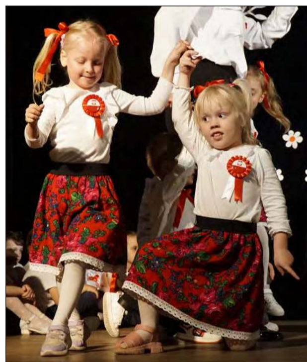
☛ Taniec grozik zaprezentowały 3-latki z grupy „Biedroneczki”

dzieci. Dzieci w przepiękny sposób, recytując wiersze, śpiewając piosenki i tańcząc tańce narodowe, wyrażały miłość do Ojczyzny i szacunek do symboli narodowych. Była