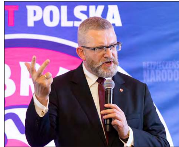
Kandydat na prezydenta RP Grzegorz Braun przedstawił w Dęblinie swój program, krytykując politykę rządu oraz wpływy zagraniczne

prezydenturę jako gwarancję obrony Polski przed zagranicznymi wpływami. - Ja wojska polskiego na żadną wojnę ukraińską ani inną cudzą wojnę nie puszcę - zadeklarował, odrzucając pakt migracyjny i politykę „eurokołchozu”. Zapowiedział normalizację stosunków z sąsiadami, ale w imię interesów gospodarczych, a nie „festiwalu przyjaźni”. - Trzeba robić dobre interesy, bo jeśli nie będziemy robić tych dobrych interesów, no to manna z nieba nie spada - tłumaczył, krytykując politykę „eksportu bezpieczeństwa” na rzecz Niemiec.