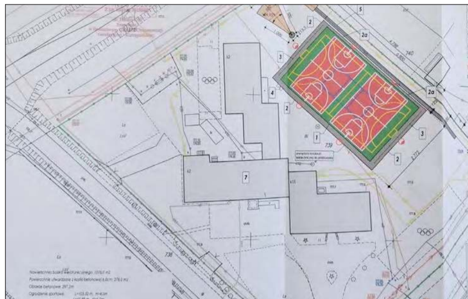
Całe boisko o nawierzchni syntetycznej będzie miało wymiar blisko 48x28 metrów. Będzie zawierało boisko do piłki ręcznej/nożnej, boisko do piłki siatkowej, dwa boiska do koszykówki, skocznia do skoku w dal i rzutnię do pchnięcia kulą

Nadzieja na spełnienie oczekiwań pojawiła się rok temu. Gmina Ryki przygotowała i złożyła wniosek o dofinansowanie planowanej inwestycji do Ministerstwa Sportu. Mijały miesiące, ale decyzji nie było. Nabór został rozstrzygnięty jesienią ub.r. W końcu, gdy lista