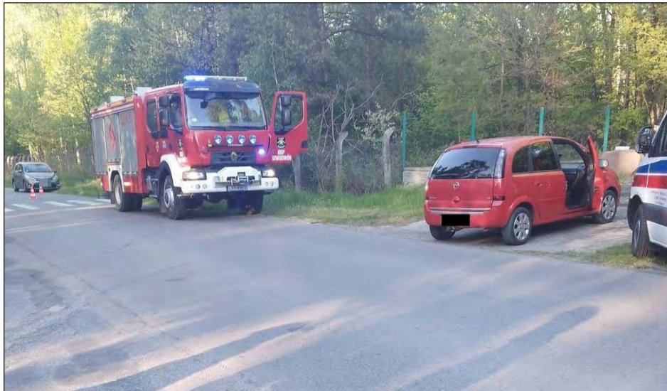
Do wypadku doszło na terenie Ułęża na skrzyżowaniu drogi powiatowej z drogą gminną prowadzącą do miejscowości Trzcianki

Ze wstępnych ustaleń policjantów wynika, że 36-letnia kierująca osobowym oplem nie ustąpiła pierwszeństwa przejazdu kierującemu motorowerem, w wyniku czego doszło do zderzenia pojazdów