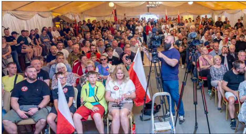
Grzegorz Braun, kandydat na prezydenta RP spotkał się z mieszkańcami Dębina w Zajeździe na Towarowej

» Kandydat na prezydenta RP spotkał się z mieszkańcami Dębina w Zajeździe na Towarowej, przedstawiając szczegółowy program i ostro krytykując politykę rządu oraz wpływy zagraniczne