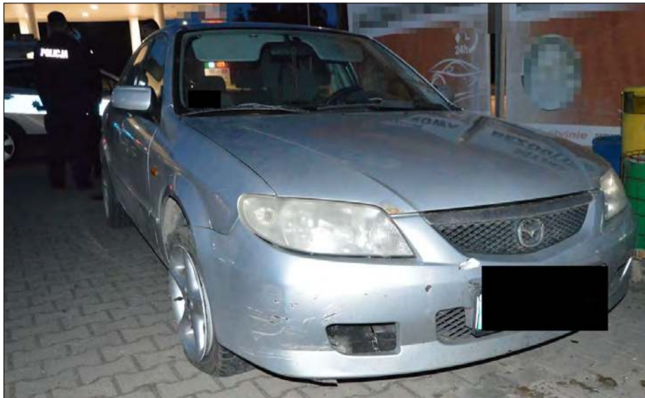
Kierowca „wydmuchał” blisko 1,5 promila alkoholu. W ogóle nie powinien siadać za kierownicę, bo ma zakaz za popełnione wcześniej wykroczenie. Jakby tego było mało, samochód, którym poruszał się, nie posiadał ważnych badań technicznych

Kompletnym brakiem rozsądku wykazał się 29-letni kierowca mazdą. W poniedziałek po godzinie 19:30 na ul. Królewskiej w Rykach nie zapanował nad autem i wjechał na chodnik, a uderzając w krawęż-