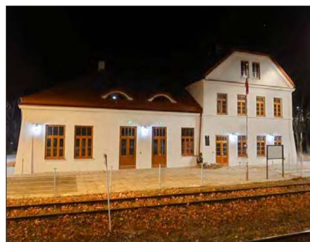
» Mieszkańcy mają nadzieję, że za jakiś czas również tak będzie wyglądał budynek w Leopoldowie, jak ten bliźniaczy, parę lat temu wyremontowany w Krzywdzie

Podczas dyskusji mieszkańcy przedstawiali szereg