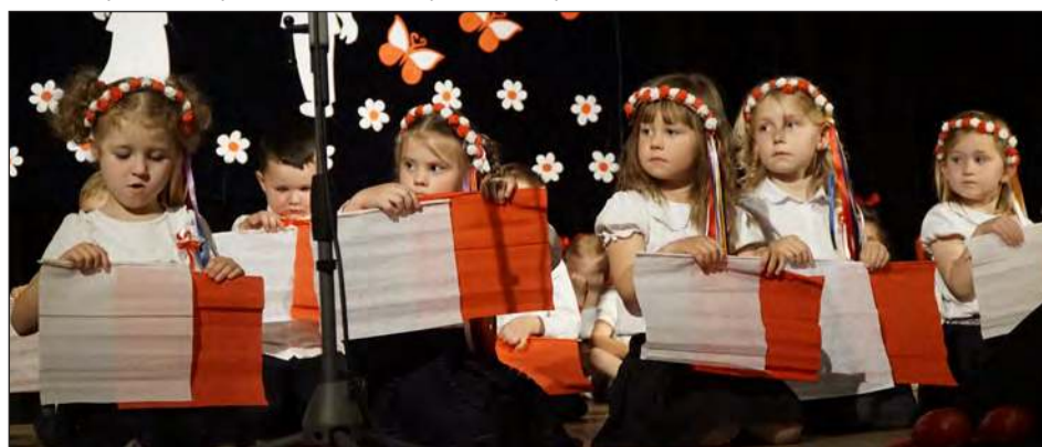
☛ 4-latki z grupy „Dinusie” zaprezentowały się w tańcu z flagami