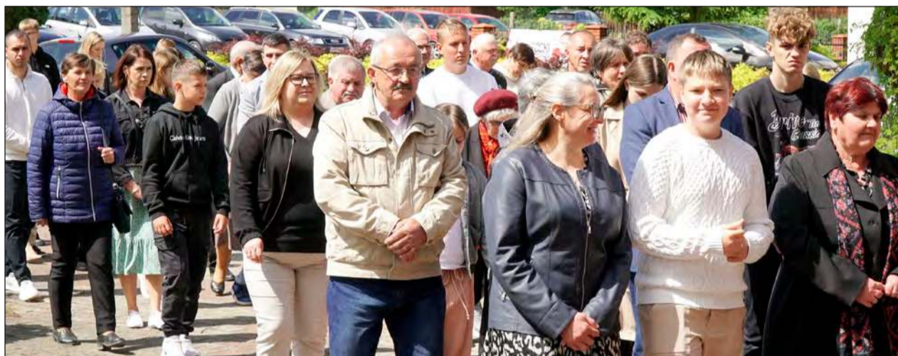
» Doroczny odpust jak zwykle zgromadził wielu wiernych nie tylko z parafii Nowodwór

» Minęło 1028 lat od męczeńskiej śmierci biskupa Wojciecha. Od początku powstania parafii w Nowodworze w XVII wieku został on patronem tutejszych mieszkańców