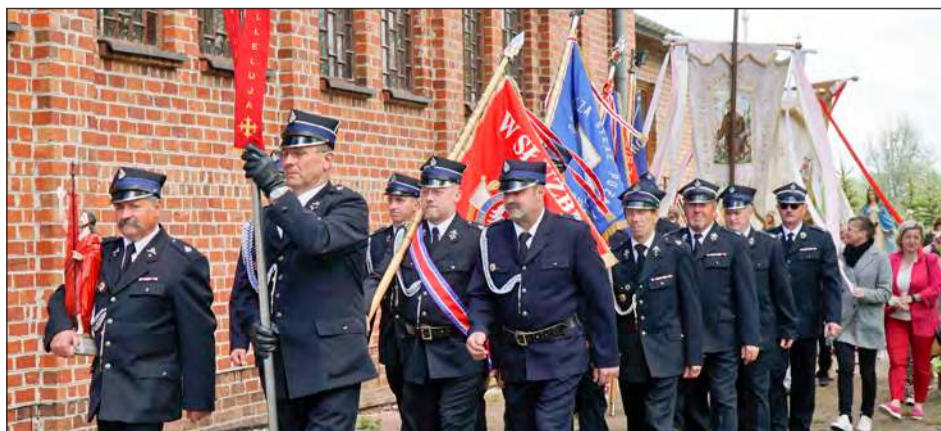
» Swoją obecnością uroczystości odpustowe uświetnili również druhowie z pocztaami sztandarowymi z jednostek w Nowodworze, Zawitale, Trzciankach i Grabowie Ryckim