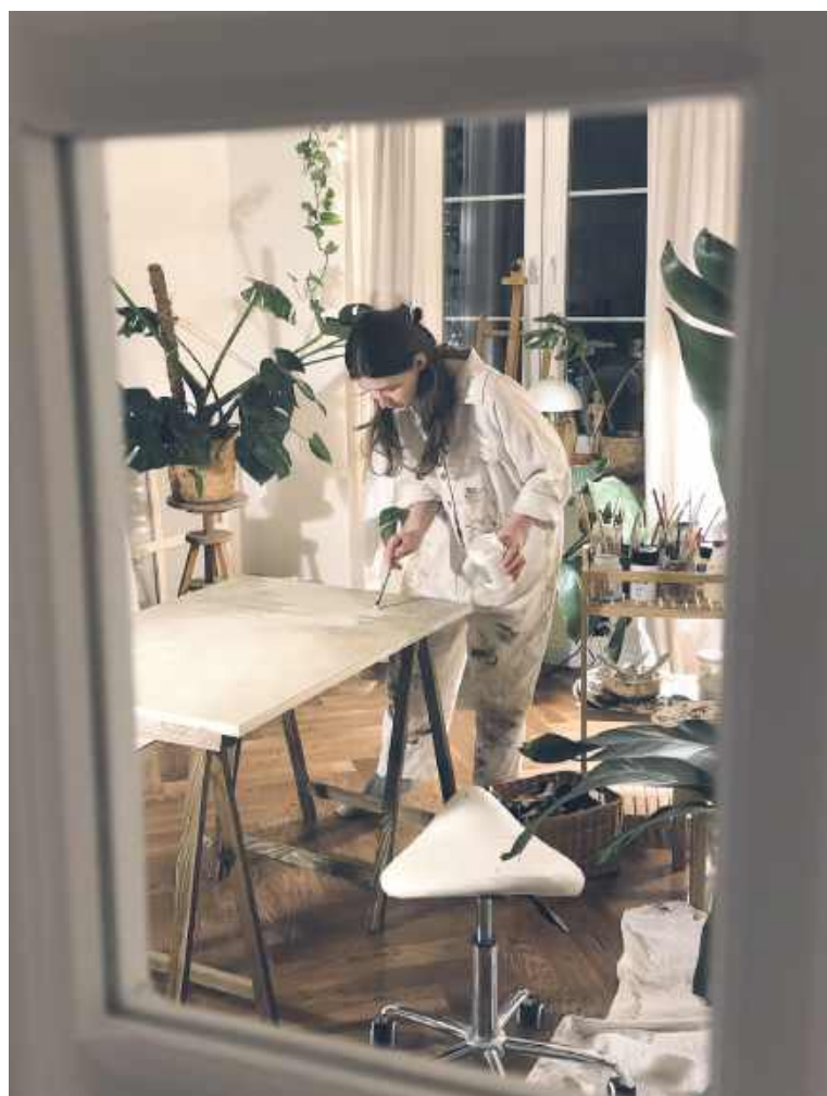
Ola i jej artystyczny świat.