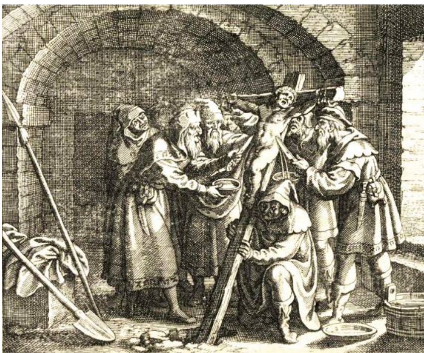
Miedzioryt przedstawia scenę mordu rytualnego na dziecku chrześcijańskim, dokonywanego przez grupę Żydów. XVI-XVII w.

Mit Żyda, niewiernego i niewdzięcznego wobec ojców Kościoła, był wałkowany na wszelkie sposoby