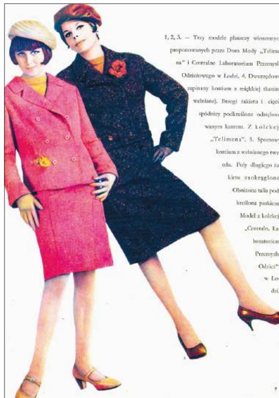
Kostiumy wiosenne z kolekcji Telimena, „Moda”, wiosna 1966 r.

zatrudnienie o kolejne 50 każdego miesiąca. W sierpniu zakład miałby działać już na dwie zmiany, a ekipa – liczyć 400 osób. Na razie działała komórka wzorująca pod kierownictwem Krystyny Depczyńskiej, zatrudniająca sześciu plastyków, sześciu modelarzy i 15 wysokiej klasy krawców. W pierwszej połowie marca ok. 30 modeli miało zostać przedstawionych detalistom, a na kwiecień