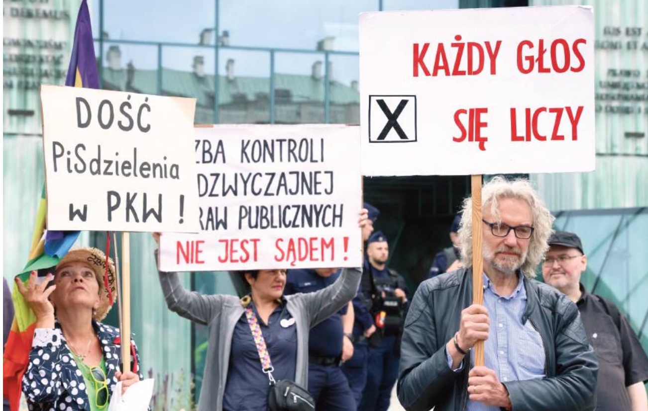
Pikieta przed budynkiem Sądu Najwyższego, gdzie odbywało się jawne posiedzenie w sprawie protestów wyborczych po drugiej turze głosowania. 27 czerwca 2025 r.