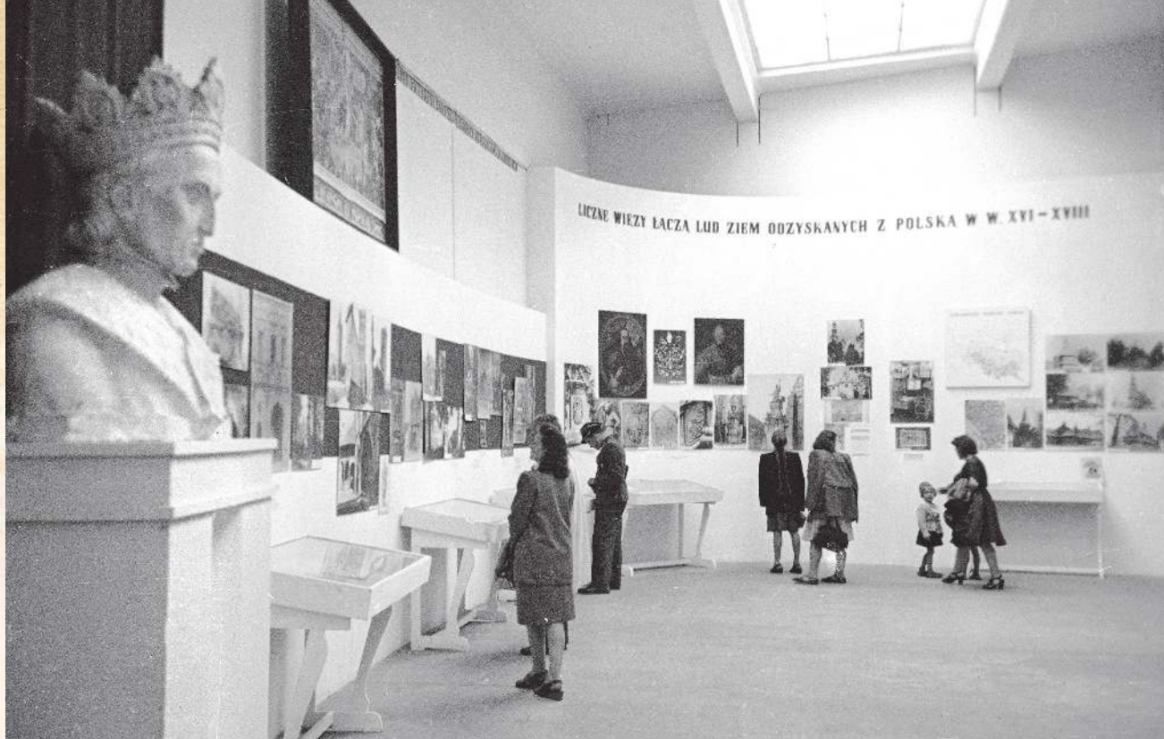
Wystawa na temat Ziem Odzyskanych, Wrocław 1948 r.

historycznych profili, których autorzy dzielą się biografiami niemieckich mieszkańców znanych dotąd tylko z wykutych na nagrobkach nazwisk lub poniemieckimi śladami spotykanymi na ulicach. Znacznie mniej jest treści, które przypominałyby Wrocław czy Szczecin lat 50., 60. i 70.