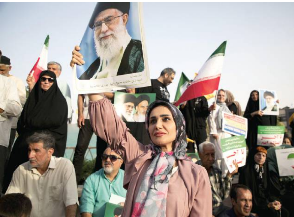
Irańczycy na ulicach Teheranu świętują zawieszenie broni, 24 czerwca 2025 r.

latach, już za rządów księcia Moham-meda bin Salmana, trochę w tej polityce się zmieniło. Dotychczas była ona w zasadzie kopią oczekiwań amerykańskich. Teraz zaczęto sprawdzać, jak daleko można się posunąć, akcentując swoje interesy. Podam przykład, w jakimś stopniu łączący się z Iranem. Otóż Saudyjczycy mają sporo własnego uranu. I są zdecydowani realizować program pokojowego wykorzystania energii nuklearnej. Tę sprawę postawili wręcz na ostrzu noża wobec Stanów Zjednoczonych. Zakomunikowali: chcemy z wami współpracować, ale wzbogacać uran chcemy u nas. Nie chcemy wywozić rudy do Ameryki, żebyście ją przetwarzali i sprzedawali nam dziesięciokrotnie drożej. My to sami sobie zrobimy, jak wyprodukujemy trochę więcej, to będziemy eksportować itd.