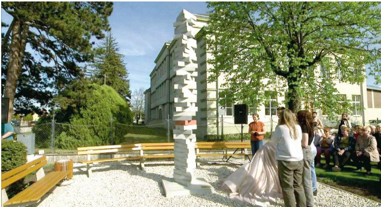
Przed szkołą średnią w Hirtenbergu, dzięki uporowi lokalnych aktywistów, 5 kwietnia 2024 r. stanęła pamiątkowa stela, taka jak przy dwóch innych podobozach KZ Mauthausen.

pojedynczych działek. Wtedy lista Ramhartera miała absolutną większość w radzie gminy, dlatego mógł przeprowadzić zmianę klasyfikacji ziemi na terenie byłego obozu koncentracyjnego, a gmina doprowadziła mu kanalizację, oświetlenie i światłowód do granicy terenu. Grunt zyskał na atrakcyjności, czyli na cenie. Gminę kosztowało to ponad 1,4 mln euro.