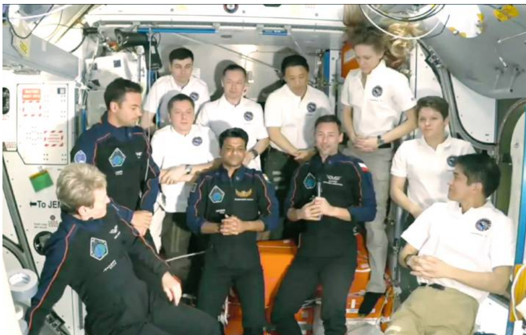
Drugi Polak w kosmosie. Sławosz Uznański- -Wiśniewski z załogą misji Axiom-4 na pokładzie Międzynarodowej Stacji Kosmicznej, 26 czerwca 2025 r.