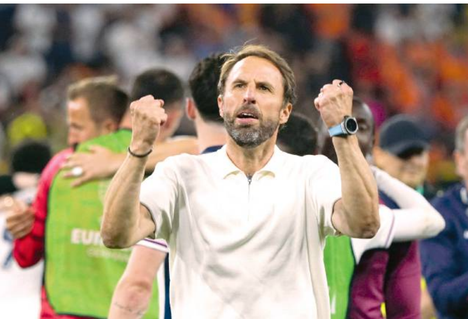
Gareth Southgate w Dortmundzie podczas półfinałów UEFA Euro 2024, mecz Anglia-Holandia.

Nicola Zalewski, ale nie bardzo z niej skorzystał, bo zmieniony w przerwie meczu z Diamentami Skorzy, następny już przesiedział na ławce.